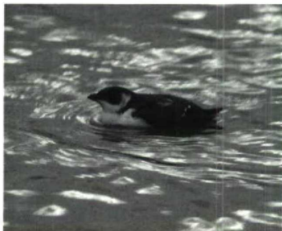
30 Kleine Alk Alle alle , Den Oever, Noordholland, december 1988 (Do van Dijck)

september bij Den Oever Nh begon het pas goed op 8 oktober toen er exemplaren zaten bij Den Helder Nh (twee), IJmuiden (drie), het Kornwerderzand Fr en de Abtskolk bij Petten Nh. Bij IJmuiden waren nog exem-