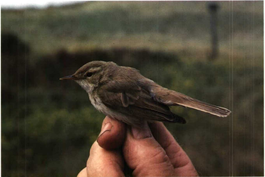
80 Kleine Spotvogel Hippolais caligata , Bloemendaal, Noordholland, september 1988

12:30 trof ik een kleine zanger aan in de bovenste baan van een mistnet tussen 2-6 m hoge wilgen en duindoorns. Vanwege het Fitis Phylloscopus trochilus -achtige voorkomen, het bleke uiterlijk, de achter het oog brede lichte wenkbrauwstreep, de witachtige staartzijde en de gladde licht rozeachtige poten kon de vogel onmiddellijk als Kleine Spotvogel Hippolais caligata worden herkend. De vogel werd geringd (Arnhem J04521), beschreven en gefotografeerd. Voordat de vogel om 14:00 bij het strandpaviljoen 'Parnassia' werd losgelaten, kon hij ook door de gewaarschuwde en tijdig gearriveerde Hans Schouten, Jan van Tussenbroek en Kees van Tussenbroek worden bekeken. De vogel vloog naar dicht struikgewas en liet zich urenlang niet meer zien. Om 17:30 waren er 12 vogelaars getuige van dat de vogel zich begon te verplaatsen waarbij hij even bovenin een struik, op de kale grond en op prikkeldraad ging zitten en enkele keren van struik naar struik vloog, om tenslotte na c 20 min over de duinen oostwaarts uit het zicht te verdwijnen. In zit vielen klein formaat en witte onderdelen op. In vlucht waren de bleke bruingrijze bovendelen, iets donkerdere lange staart en witachtige staartzijde opvallend. De onderstaande beschrijving werd van de vogel in de hand gemaakt.