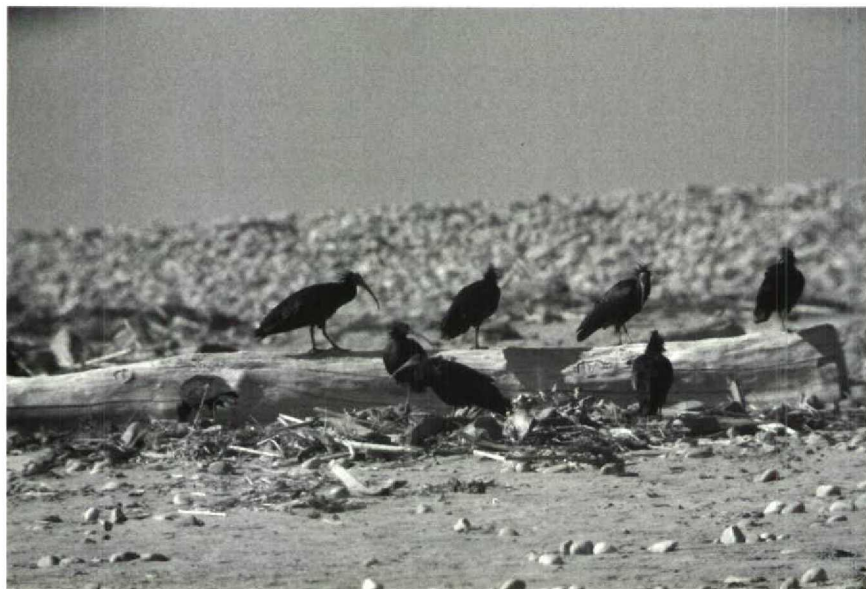
85-86 Bald Ibis Geronticus eremita , Tamri, Morocco, January 1989 (Jan Mulder)