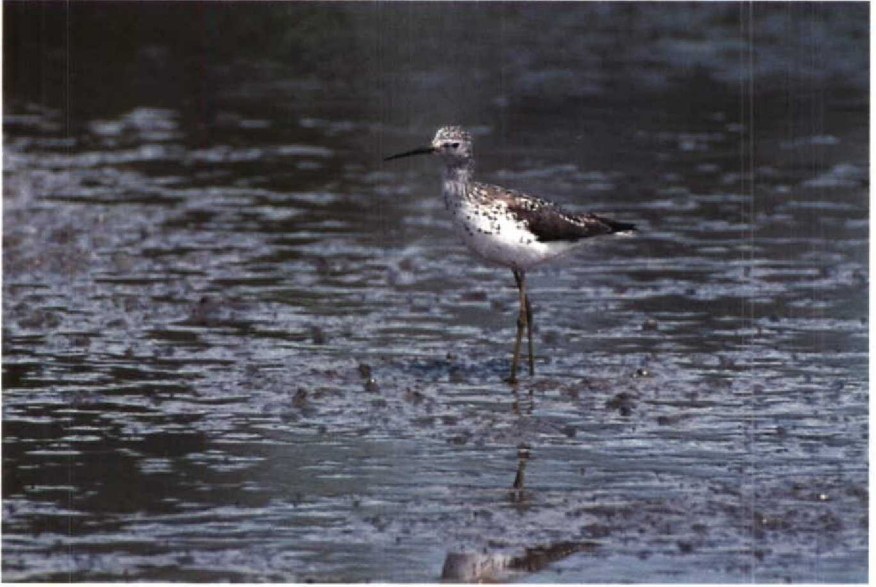
97 Poelruiter Tringa stagnatilis , Philipsdam, Zeeland, mei 1989 98 Woestijntapuit Oenanthe deserti , Oud-Alblas, Zuidholland, april 1989