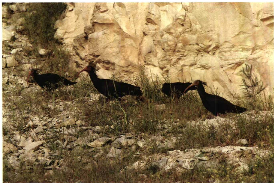
83-84 Bald Ibis Geronticus eremita , Birecik, Turkey, May 1987