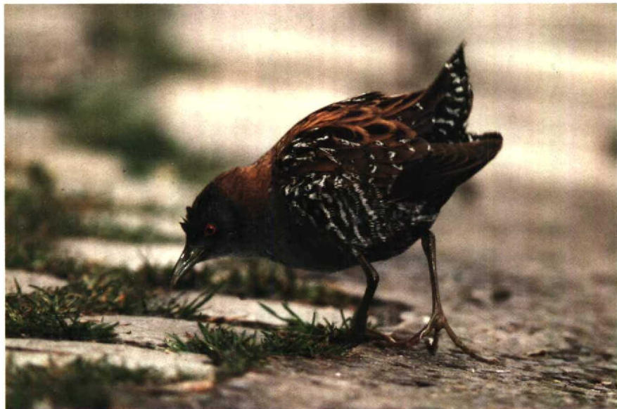
87 Baillon's Crake Porzana pusilla , Sunderland, Tyne and Wear, Britain, May 1989 88 Desert Wheatear Oenanthe deserti , Barn Elms Reservoir, Greater London, Britain, April 1989