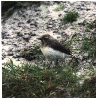
74-75 Bonte Tapuit Oenanthe pleschanka , Schiermonnikoog, Friesland, mei 1988 (Arnoud B van den Berg, Guus Hak)

witte staartvlak afgerond (recht bij Tapuit). Bruin-wit verdeling op t2-6 ongelijk op binnen- en buitenvlag waardoor rand witte staartvlak rafelig leek.