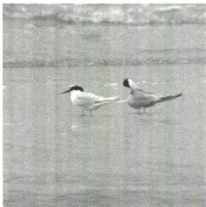
92 Dougalls Stern Sterna dougallii , IJmuiden, Noordholland, juni 1989

KRAANVOGELS TOT ALKEN Zeven Kraanvogels Grus grus , waaronder vijf adulten die af en toe ballsten, waren van 27 maart tot 15 april