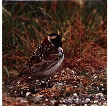
103 IJsgors Calcarius lapponicus , Putten bij Camperduin, Noordholland, juni 1989

lanceolatus bij Wageningen Gld op 10 en 11 mei werd korte tijd voor een Rosse Spotlijster Toxostoma rufum gehouden. Een Buidelmees Remiz pendulinus die op 30 april bij Schulen werd gecontroleerd bleek het vorig najaar als eerstejaars geringd te zijn bij Lier. Roodkopklauwieren Lanius senator waren er op 1 mei bij Blokkersdijk, op 10 mei bij Goudriaan, op 14 juni in het NP De Hoge Veluwe Gld en op 18 juni op Vlieland Fr. Een mogelijke Pallas' Roodmus Carpodacus roseus werd kort gezien bij Groningen. Van 18 mei tot in juni konden op enkele plaatsen in de Flevopolder weer Roodmussen C erythrinus waargenomen worden. Waarnemingen elders betreffen die van Texel op 21 en 27 mei, Den Helder