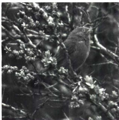
100 Provençaalse Grasmus Sylvia undata , Knokke, Westvlaanderen, mei 1989

mei en bij Goudriaan op 20 mei. Een Groenlandse Tapuit Oenanthe oenanthe leucorhoa werd op 27 april gemeld nabij de Cocksdoorp op Texel. Van geheel ander kaliber was de Woestijntapuit O. deserti die van 24 tot 26 april te bewonderen was in de polder bij Oud-Alblas Zh. Dit exemplaar was de tweede voor Nederland. Van 5 tot 7 mei zat er een mannetje Vale Lijster Turdus obscurus te Roermond L. Dit was het vierde geval voor Nederland. Een Cetti's Zanger Cettia cetti die van 2 tot 13 mei in de Dordtse Biesbosch zat kon, doordat twee excursies georganiseerd werden, door tientallen mensen gehoord worden. Op 16 juni was er één aanwezig in de AW-duinen. Op 14 juni werd een Veldrietzanger Acrocephalus agricola gevangen bij Veurne Wvl. Orpheusspotvogels Hippolais polyglotta zongen, buiten het normale verspreidingsgebied, bij Roisin Hg op 13 juni en bij Beloeil Hg op 25 juni. Op de Maasvlakte werd er op 21 mei één gevangen. De Provençaalse Grasmus Sylvia undata die zich op 1 mei in de 'Zwinbosjes' bij Knokke Wvl bevond was alweer de derde voor België. Bij Epen L werden tussen 28 en 31 mei één tot twee Bergfluiters Phylloscopus bonelli geobserveerd. Er zat van 24 tot 30 mei een Siberische Tjiftjaf P. collybita tristis te zingen bij