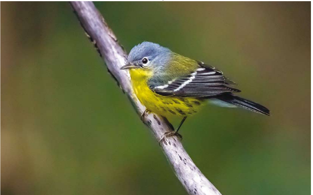
594 Magnolia Warbler / Magnoliazanger Setophaga magnolia , first-year, Corvo, Azores, 19 October 2017 (Vincent Legrand)