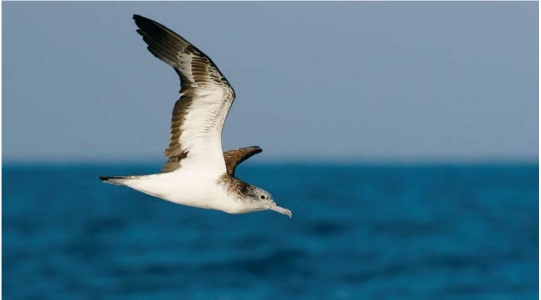
556 Streaked Shearwater / Gestreepte Pijlstormvogel Calonectris leucomelas , off Mirbat, Oman, 10 November 2017