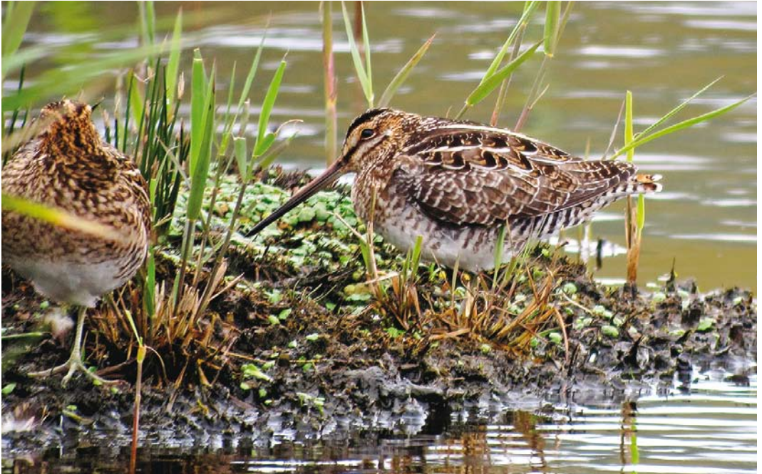
554 Wilson's Snipe / Amerikaanse Watersnip Gallinago delicata (right), St Mary's, Scilly, England, 11 October 2017