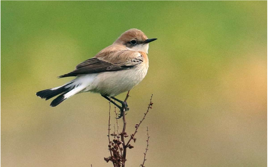
617 Westelijke Blonde Tapuit / Western Black-eared Wheatear Oenanthe hispanica , eerstejaars mannetje, Waal en Burg, Texel, Noord-Holland, 19 oktober 2017

O. melanoleuca zijn deze delen kouder grijsbruin getekend. Omdat hispanica met maar twee eerdere gevallen – waarvan maar één twitchbaar (in 2004) – een stuk zeldzamer is dan melanoleuca nam het belangstellingsniveau flink toe en in de loop van de dag kwamen vele 10-tallen vogelaars naar Texel. De tapuit liet zich de hele dag goed bekijken en fotograferen, zij het vaak op flinke afstand omdat hij bij voorkeur verbleef op een grote stapel gemaaid riet in het weiland. Naast de kleur is ook de handpenprojectie een kenmerk om beide ‘blonde tapuiten’ te onderscheiden; de projectie van c 90% paste goed op hispanica . Aan het eind van de middag werd een poepje verzameld voor DNA-analyse waarmee hopelijk de determinatie verder ondersteund kan worden. De volgende dag werd de vogel niet meer aangetroffen. Eerdere gevallen van hispanica in Nederland waren een mannetje op Terschelling, Friesland, op 11 mei 2001 en een vrouwtje in de Eemshaven, Groningen, van 30 oktober tot 28 november 2004. Daarnaast zijn er zes gevallen van niet nader gedetermineerde ‘blonde tapuiten’ (mei 1937, mei 1970, juni 1975, april 1982, juni 1991 en mei 2006). Vooral bij oudere gevallen is de documentatie onvoldoende om de subtiele verschillen tussen beide soorten te kunnen vaststellen. Daarnaast is er één geval waarbij het een ‘blonde tapuit’ of Bonte Tapuit O. pleschanka betrof (oktober 1992). KOEN STORK & ENNO B EBELS