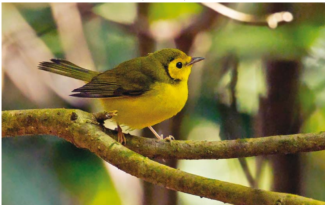
587 Hooded Warbler / Monnikszanger Setophaga citrina , first-year female, Corvo, Azores, 20 October 2017 (Kris De Rouck)