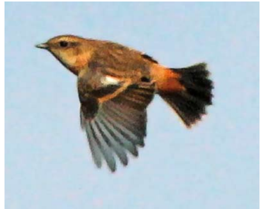
598 Geelsnavelduiker / Yellow-billed Loon Gavia adamsii , Westkapelle, Zeeland, 3 oktober 2017 ( Lennart Verheuvell ) 599 Siberische Boompieper / Olive-backed Pipit Anthus hodgsoni , Katwijk aan Zee, Zuid-Holland, 19 oktober 2017 ( René van Rossum ) 600 Vale Gierzwaluw / Pallid Swift Apus pallidus , juveniel, Ruige Plak, Vlieland, Friesland, 20 oktober 2017 ( Steven Wytema ) 601 Stejnegers Roodborsttapuit / Stejneger's Stonechat Saxicola stejnegeri , eerstejaars vrouwtje, Noordoosthoek, Vlieland, Friesland, 16 oktober 2017 ( Lars Buckx )

mee was dit ook het beste jaar sinds 2011. Voorts werden 331 Middelste Jagers S pomarinus en 2867 Grote Jagers S skua genoteerd. Voor laatstgenoemde soort was dit de beste september-oktober in de afgelopen 10 jaar (het gemiddelde over 2008-17 is 977). De hoogste aantallen passeerden de telposten op 14 september, waaronder 307 langs Schiermonnikoog en 276 langs de Tweede Maasvlakte. Deze aantallen betekenden respectievelijk het op drie en vier na hoogste aantal ooit voor ons land. Stevige aanlandige winden zorgden voor een totaal van 73 langstreckende Vorkstaartmeeuwen Xema sabini waaronder enkele adulte in zomerkleed. De meeste werden waargenomen vanaf de telposten bij Westkapelle en Den Haag. Bij de Maasvlakte verbleef op 6 oktober langdurig een fraaie adult in zomerkleed. Op 12 september werd een gekleuringde Baltische Mantelmeeuw Larus fuscus fuscus (zwart J167K) gefotografeerd bij 's-Gravenzande, Zuid-Holland; hij was als nestjong geringd op