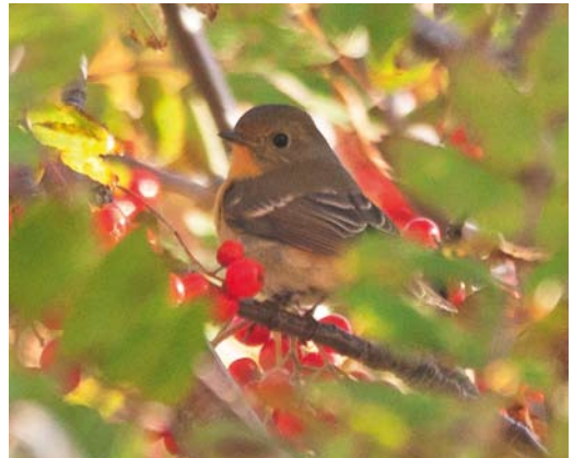
573 White-crowned Sparrow / Witkruingors Zonotrichia leucophrys , first-year, Foula, Shetland, Scotland, 8 October 2017 (Roger Riddington) 574 Yellow-breasted Bunting / Wilgengors Emberiza aureola , first-year, Out Skerries, Shetland, Scotland, 21 September 2017 (Josh Jones) cf Dutch Birding 39: 350, 2017 575 Brown Shrike / Bruine Klauwier Lanius cristatus , first-year, il-Maghluq, Marsaxlokk, Malta, 3 November 2017 (Natalino Fenech) 576 Mugimaki Flycatcher / Mugimakivliegenvanger Ficedula mugimaki , first-winter female, Værøøy, Nordland, Norway, 13 October 2017 (Kjell Mjølhusnes)

CROWS TO SWALLOWS In the Canary Islands, two Pied Crows Corvus albus were still present at Las Palmas de Gran Canaria harbour on 25 October; the Spanish rarities committee treats all records in the Canary Islands, Ceuta and mainland Spain as probably ship-assisted (listing the species in so-called 'category D') despite the species' frequent occurrence in Morocco. The first or second Common Firecrest Regulus ignicapilla for the Faeroes was photographed at Sydrugøta, Eysturoy, on 24 October (cf Dutch Birding 38: 462, 2016). The fifth Greater Hoopoe-Lark Alaemon alaudipes for the Canary Islands was found on Gran Canaria on 29 October. In Israel, an amazing c 20 000 Greater Short-toed Larks Calandrella brachydactyla were estimated to gather for a roost at Judean plains on 23 September. A first-winter American Cliff Swallow Petrochelidon pyrrhonota on Tresco, Scilly, on 2-6 October was probably the same individual as the