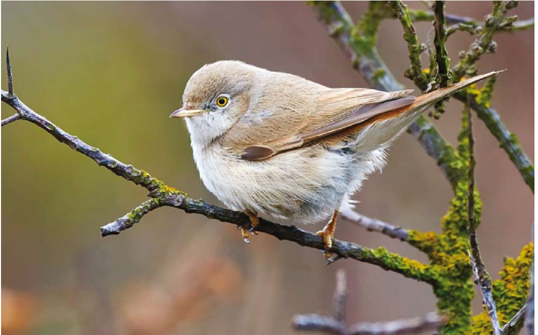
566 Asian Desert Warbler / Woestijngrasmus Sylvia nana , Helgoland, Schleswig-Holstein, Germany, 22 October 2017