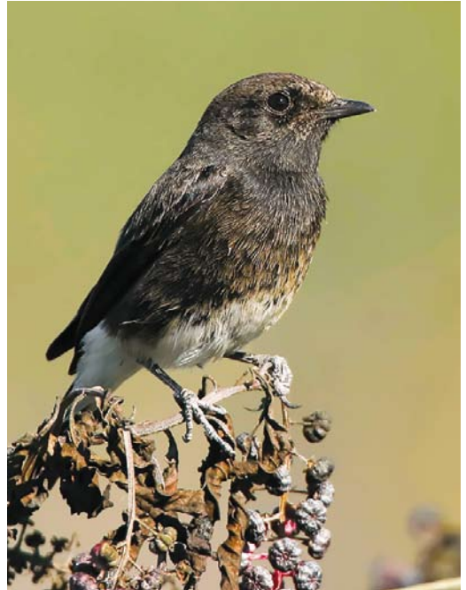
568 Pallas's Reed Bunting / Pallas' Rietgors Emberiza pallasi , first-year, Linosa, Sicily, Italy, 15 October 2017 569 Pied Bushchat / Zwarte Roodborsttapuit Saxicola caprata , first-year male, Bonifica di Vecchiano, Pisa, Toscana, Italy, 20 October 2017 570 Blyth's Pipit / Mongoolse Pieper Anthus godlewskii , first-year, Linosa, Sicily, Italy, 26 October 2017