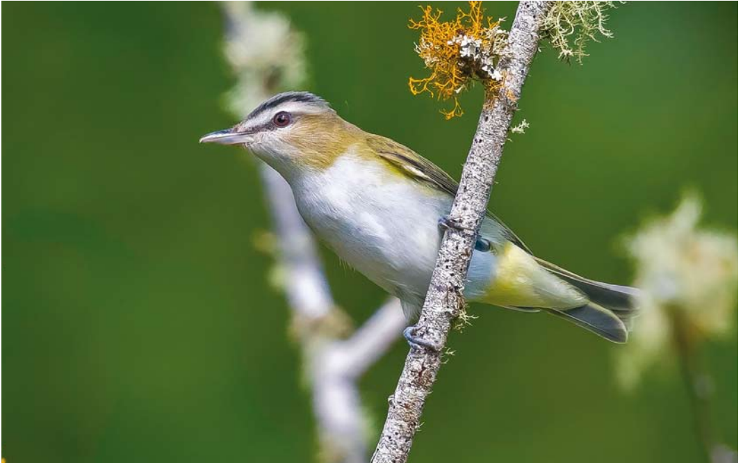
571 Red-eyed Vireo / Roodoogvireo Vireo olivaceus , first-year, Corvo, Azores, 8 October 2017 (Rafael Armada)