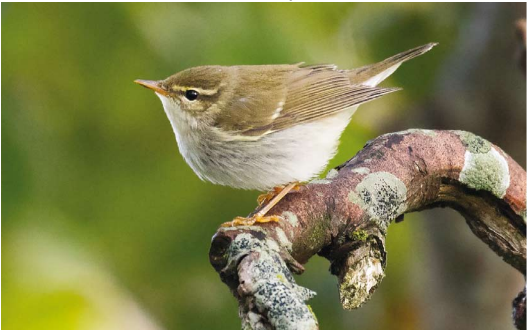
605 Noordse Boszanger / Arctic Warbler Phylloscopus borealis , Oost, Texel, Noord-Holland, 15 september 2017