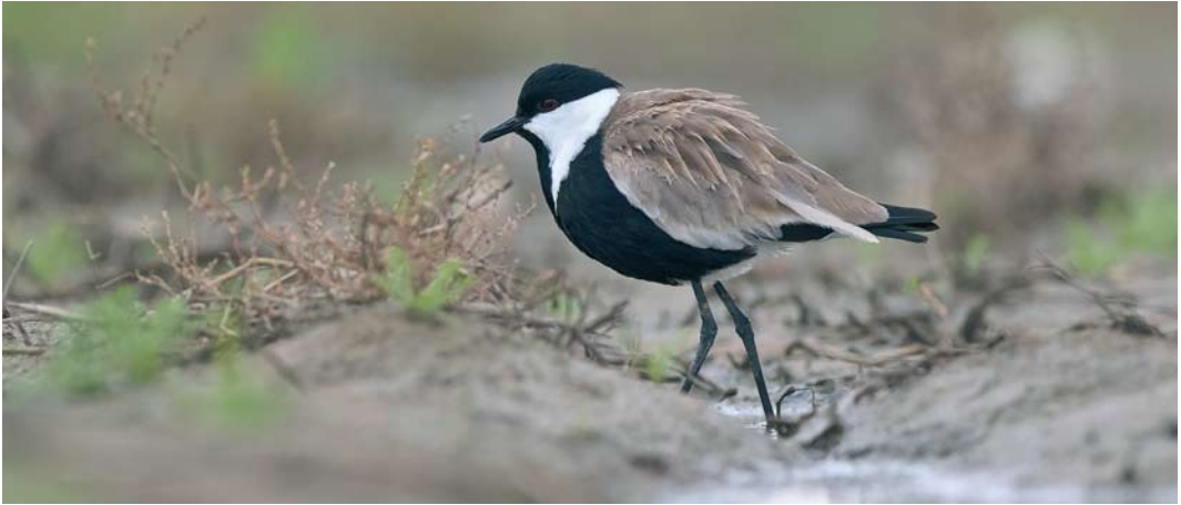
563 Spur-winged Lapwing / Sporenkievit Vanellus spinosus , adult, Strzelno, Kujawsko-Pomorskie, Poland, 25 September 2017

A adalberti were seen at Point Cires, Tangier, crossing the Strait of Gibraltar to Morocco. C 1500 Steppe Eagles A nipalensis at Raysut waste disposal site on 24 January was the highest-ever number for Oman. The second Eastern Imperial Eagle A heliaca for the Netherlands was a fourth calendar-year photographed at Brobbelbies, Schaijk, Noord-Brabant, on 27 September, and then turning up in north-western Overijssel and into Flevoland on 3-4 and 8-10 October (the first was in April 2005). It had been ringed as a chick on the nest at Dévaványa, Békés, Hungary, on 18 June 2014. Surprisingly, based on feather details, it was identified as the same individual as the one in January at Lago di Massaciuccoli, Toscana, where it was erroneously considered to be the first Spanish Imperial Eagle for Italy, partly the result of its ring not read (cf Dutch Birding 39: 45, plate 54, 2017). In Scotland, an adult male Northern Harrier C hudsonius was reported at Rendall, Mainland, Orkney, on 13 October. The second Northern Goshawk Accipiter gentilis for the Faeroes stayed on Kunoy from 30 September to 3 October. A kite flying over Slikken van de Heen, Zeeland, Netherlands, on 10 October was identified as an 'intergrade' between Black Kite M migrans and Black-eared Kite M lineatus .