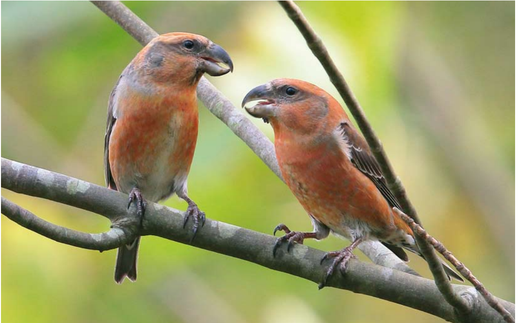
612 Grote Kruisbekken / Parrot Crossbills Loxia pytyopsittacus , mannetjes, Staatsbossen, Texel, Noord-Holland, 12 oktober 2017