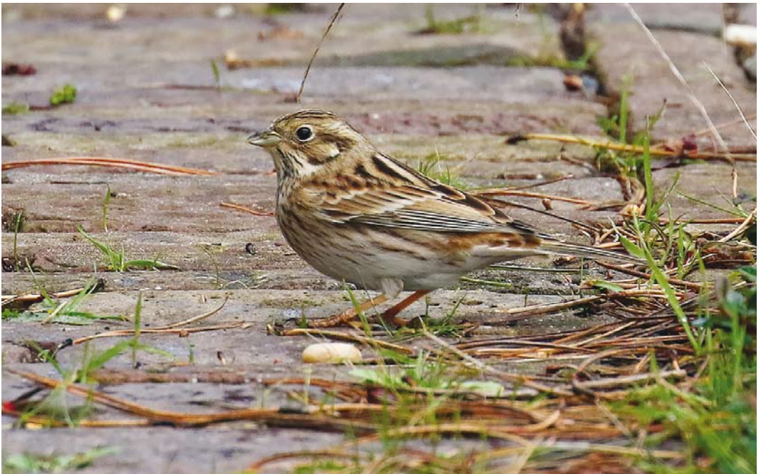
545 Pine Bunting / Witkopgors Emberiza leucocephalos , first-year female, Oost-Vlieland, Vlieland, Friesland, 21 October 2016 (Wietze Janse)