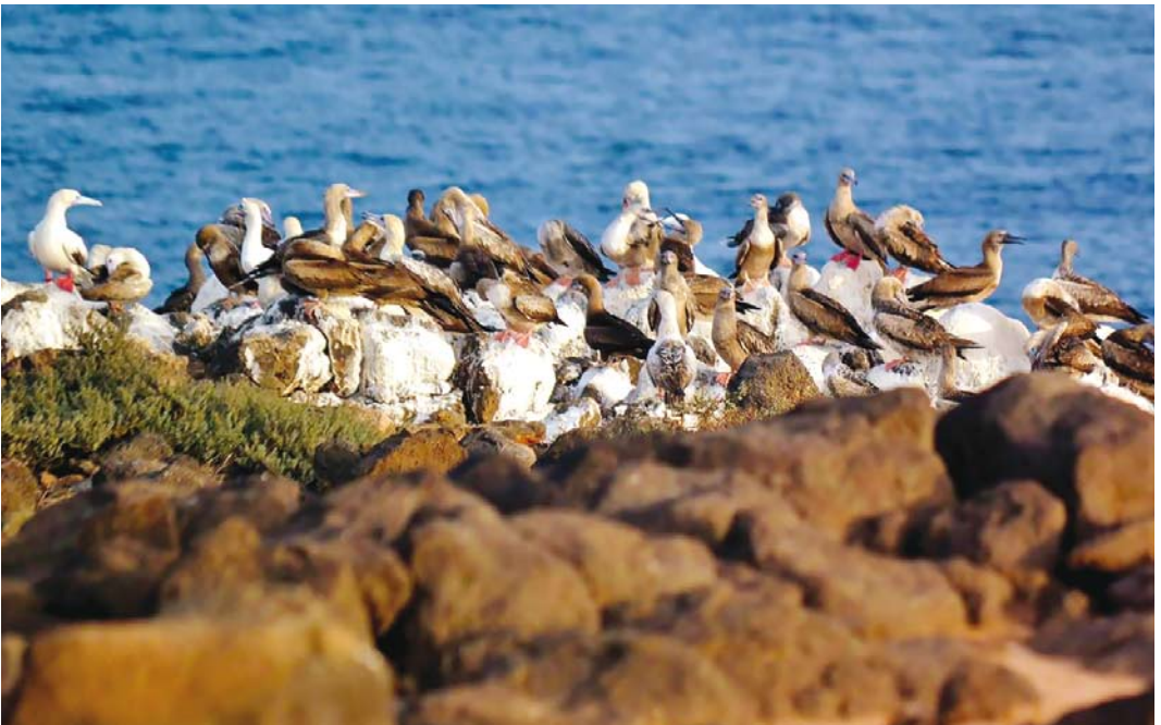
551 Red-footed Boobies / Roodpootgenten Sula sula , Raso, Cape Verde Islands, 28 August 2017