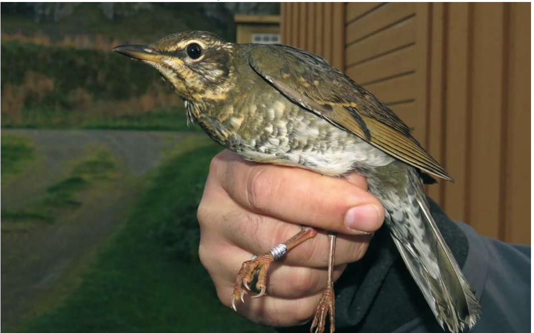
565 Siberian Thrush / Siberische Lijster Geokichla sibirica , first-year female, Værøy, Nordland, Norway, 25 September 2017