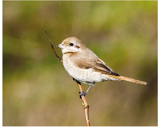
611 Daurische Klauwier / Daurian Shrike Lanius isabellinus , eerstejaars, Maasvlakte, Zuid-Holland, 23 oktober 2017 (Ruurd Boonstra)

Maarnse Berg, Utrecht. De laatste datum was 18 oktober, toen een vogel bij Camperduin (rond)vloog. Tot 24 september werden diverse Witwangsters Chlidonias hybrida waargenomen in het Zuidlaardermeergebied, Groningen. Verder werden er twee gemeld van telposten en vanaf 26 oktober tot in november verbleef een adult bij Stellendam, Zuid-Holland. Trektellers noteerden nog zes Witvleugelsters C leucopterus en tussen 13 en 24 september pleisterden er ten minste vier (waaronder één adulte) bij Medemblik.