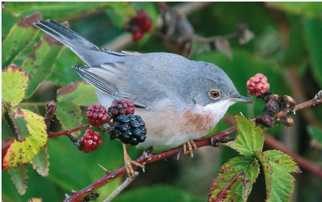
602 Balkanbaardgrasmus / Eastern Subalpine Warbler Sylvia cantillans , adult mannetje, Robbenjager, Texel, Noord-Holland, 9 september 2017