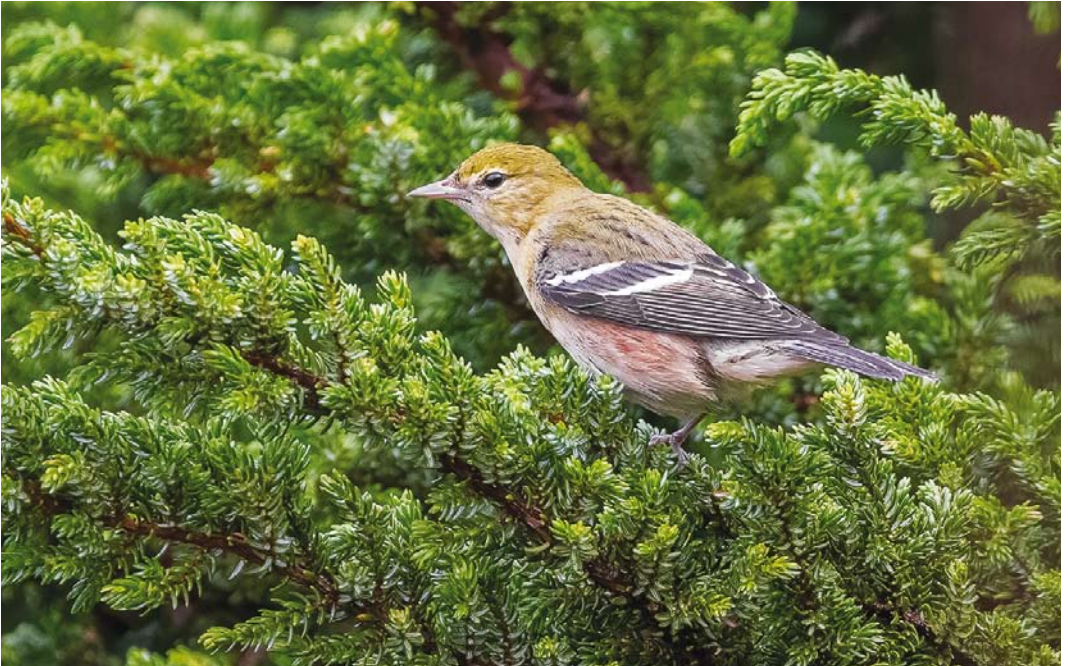
593 Bay-breasted Warbler / Kastanjezanger Setophaga castanea , first-year male, Corvo, Azores, 22 October 2017