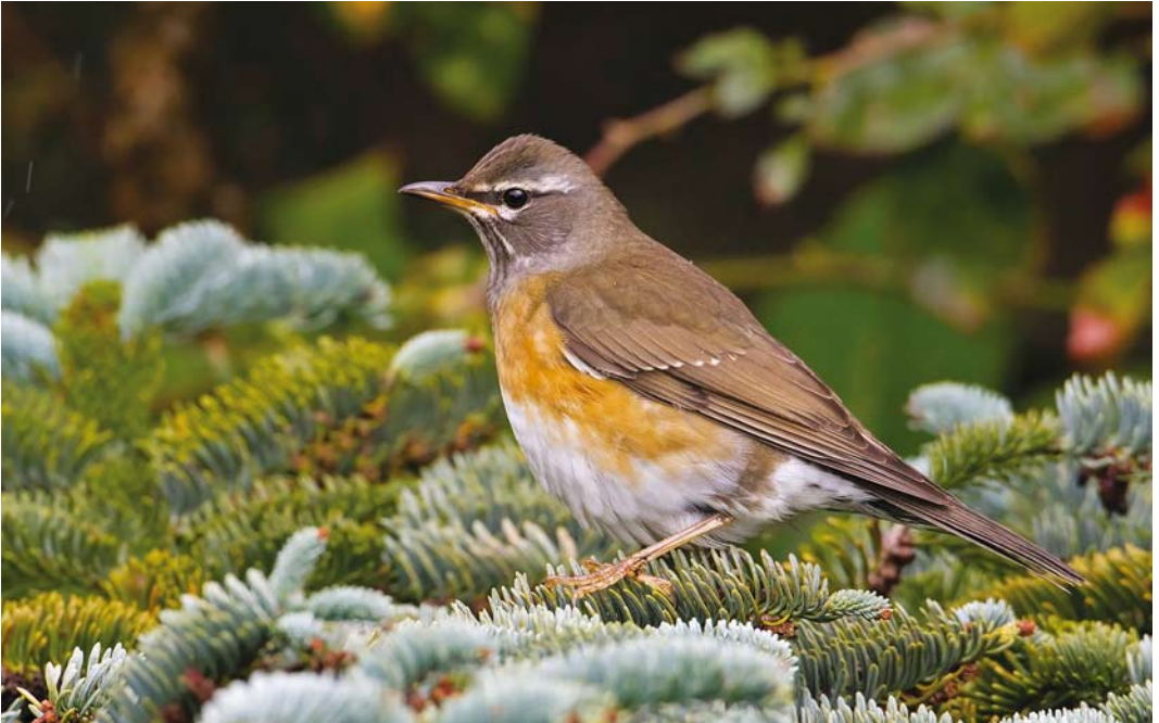
618 Vale Lijster / Eyebrowed Thrush Turdus obscurus , eerstejaars mannetje, Oost-Vlieland, Vlieland, Friesland, 21 oktober 2017

egaal groenbeige rug en zag ik een hagelwit, flinterdun vleugelstreepje... Mijn hart bonsde in mijn keel en ik kon maar aan één ding denken: 'Dit is bingo! Dit is bingo!' In de stress keek ik om mij heen om te zien waar ik mijn camera had gelaten en zag ik hem twee tuintjes verderop staan. Ik trok een sprintje naar mijn camera. Even later keek ik door de zoeker en bleek de vogel nog steeds op de zelfde plek te zitten, half verscholen achter de taxus. Ik drukte af en checkte de display van de camera. Op dat moment sprong de vogel iets naar voren, kwam ineens vrij en zag ik de abrikoosoranje flanken. Ik riep VH die snel naar beneden kwam. Omdat de vogel inmiddels volledig achter een standbeeld in de tuin was verdwenen liet ik VH mijn display zien... 'Dat is een Vale Lijster, man!'. We wachtten gespannen tot de vogel weer zou verschijnen. Na enkele 10-tallen seconden hipte hij weer achter het standbeeld vandaan. We balden onze vuisten en vierden kort ons feestje. Ik maakte in de DF-appgroep melding 'Vale Lijster!!!', gevolgd door de locatie en een paar 'back-of-camera' foto's. Meteen daarna verstuurde ik een Rare Bird Alert om ook de mensen op de vaste wal op de hoogte te brengen van de vondst. Even later arriveerden RdB en RH, kort daarna gevolgd door andere vogelaars. Terwijl de groep groeide, speurde iedereen geconcentreerd de tuintjes af. Het duurde minuten, en voor mijn gevoel een eeuwig-