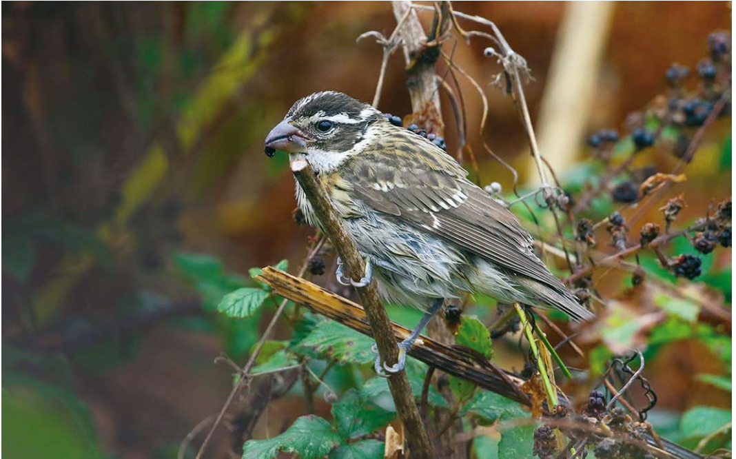
588 Rose-breasted Grosbeak / Roodborstkardinaal Pheucticus ludovicianus , first-year male, St Agnes, Scilly, England, 30 September 2017 589 Siberian Blue Robin / Blauwe Nachtegaal Larvivora cyane , adult male, North Ronaldsay, Orkney, Scotland, 8 October 2017 590 Cedar Waxwing / Cederpestvogel Bombycilla cedrorum , juvenile, St Agnes, Scilly, England, 8 October 2017