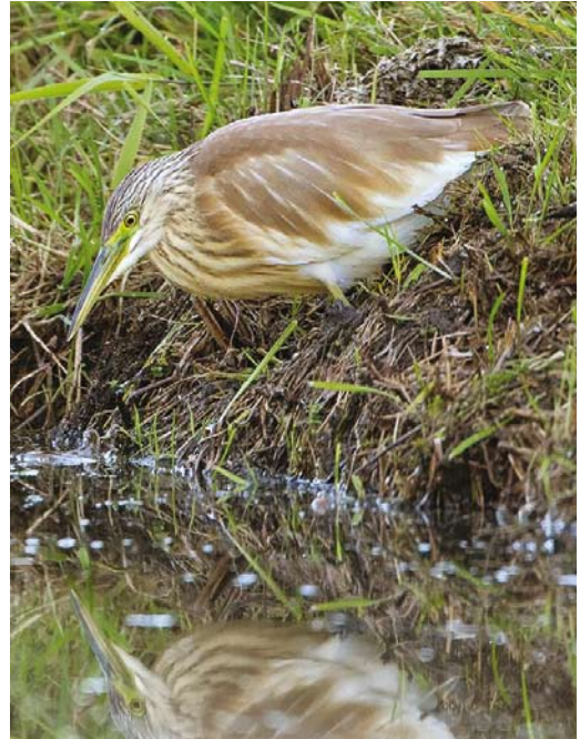
596 Ralreiger / Squacco Heron Ardeola ralloides , eerstejaars, Vollenhove, Overijssel, 25 oktober 2017 (Co van der Wardt)

OOIEVAARS TOT GENTEN Er passeerden meer Zwarte Ooievaars Ciconia nigra (107) de telposten dan in juli-augustus (71), waarbij met name het totaal van 47 over de Grootte Peel, Noord-Brabant, in het oog springt. Leuk was dat opnieuw een roepende Woudaap Ixobrychus minutus werd opgenomen over Arnhem-Zuid, Gelderland, ditmaal in de nacht van 27 op 28 september. De Ralreiger Ardeola ralloides van de Eempolders bij Eem-