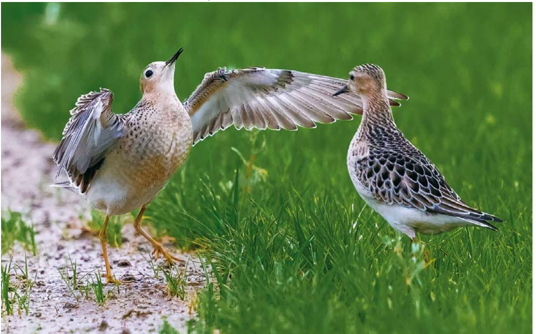
555 Buff-breasted Sandpipers / Blonde Ruiters Calidris subruficollis , juveniles, Ebro delta, Tarragona, Spain, 25 September 2017 (Rafael Armada)