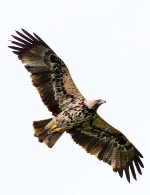
614 Keizerarend / Eastern Imperial Eagle Aquila heliaca , vierde-kalenderjaar, Hasselt, Overijssel, 4 oktober 2017