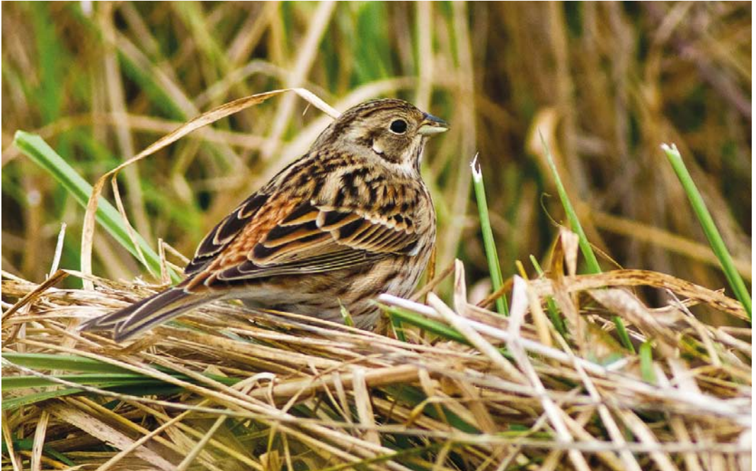
544 Pine Bunting / Witkopgors Emberiza leucocephalos , first-year female, Oosternieuwlandpolder, Veere, Zeeland, 24 October 2016 (Corstiaan Beeke)