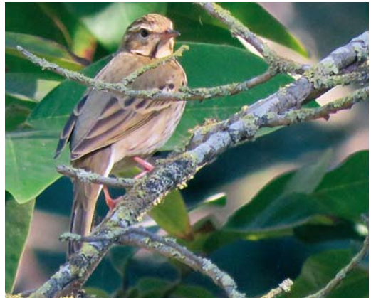
577 Dickcissel / Dickcissel Spiza americana , first-year female, Corvo, Azores, 18 October 2017 578 Ovenbird / Ovenvogel Seiurus aurocapilla , Flores, Azores, 23 October 2017 579 Eyebrowed Thrush / Vale Lijster Turdus obscurus , first-year male, Aktau, Mangystau, Kazakhstan, 2 October 2017 580 Olive-backed Pipit / Siberische Boompieper Anthus hodgsoni , Rabat, Morocco, 5 November 2017

for these species (Br Birds 110: 652-654, 2017). A Hume's Leaf Warbler P. humei at Vík, Lón, on 21-24 October was the first for Iceland. A Dusky Warbler P. fuscatus trapped at Aras on 8 October was the sixth for Turkey. The second and third for Austria were trapped at Illmitz, Burgenland, on 10 and 14 October. The first for Serbia was trapped at Ludas lake, Vojvodine, on 20 October. If accepted, one found at Mandria on 3 November will be the third for Cyprus. A record seven were reported in Italy this autumn, including three on Linosa, Sicily, on 5 November. A first-winter Asian Desert Warbler Sylvia nana was seen and then trapped at Halias, Hanko, Finland, on 17-20 October. The third for Germany was twitched by many birders on Helgoland, Schleswig-Holstein, from 20 October to 2 November (previous ones were in June-July 1981 and May 2002). In Scilly, the first Eastern Orphean Warbler S. crassirostris for Britain on St Agnes on 12-20 October was identified with certainty after its departure.