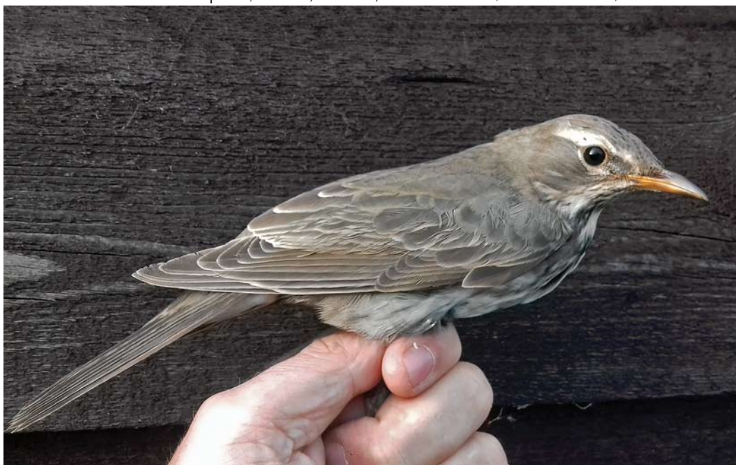
607 Vermoedelijke Zwartkeellijster / presumed Black-throated Thrush Turdus atrogularis , eerstejaars vrouwtje, Derde Kroonspolder, Vlieland, Friesland, 30 oktober 2017 ( Peter van Horsen )