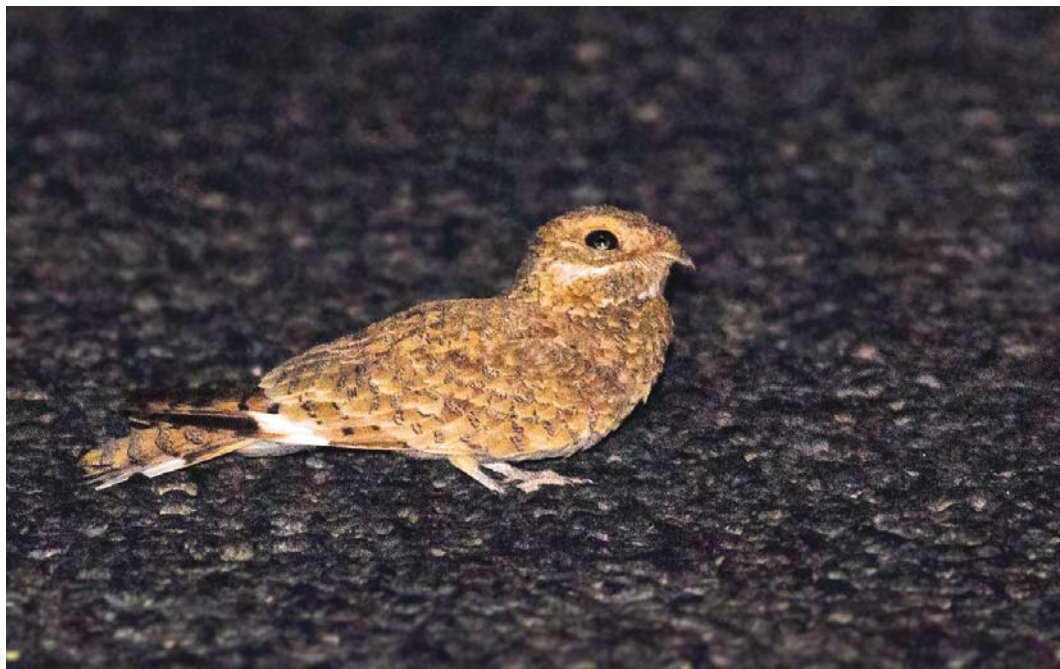
547 Golden Nightjar / Goudgele Nachtzwaluw Caprimulgus eximius , Aousserd road, Oued Ad-Deheb, Western Sahara, Morocco, 21 April 2016 (Daan Drukker). Presumed male because of length of white tip on outer tail feather.

The next evening, on 21 April, the Dutch group again went spotlighting around Oued Jenna. They saw and photographed one Golden Nightjar, almost at the exact spot where they had found the roadkill (point 3). Almost an hour later, they again found one 850 m further west (again at point 5,