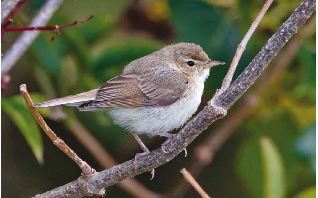
608 Kleine Spotvogel / Booted Warbler Iduna caligata , Neeltje Jans, Zeeland, 19 september 2017