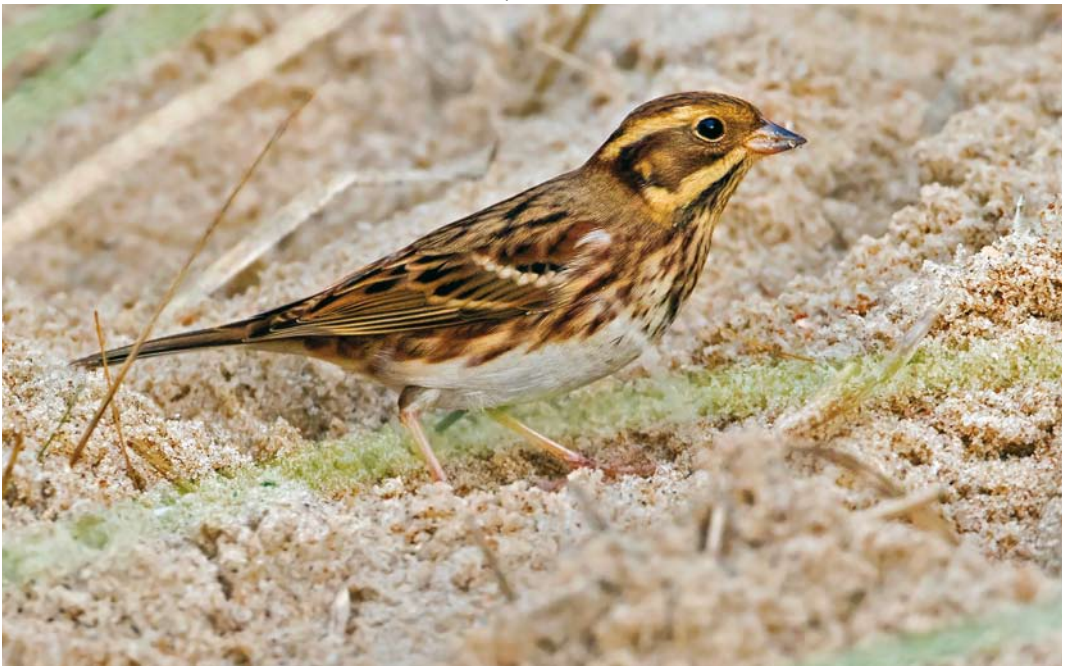
613 Bosgors / Rustic Bunting Emberiza rustica , eerstejaars, Vlieland, Friesland, 29 september 2017 (Jaap Denee)