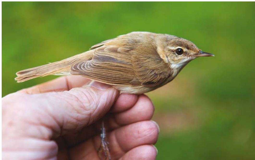
528 Paddyfield Warbler / Veldrietzanger Acrocephalus agricola , first-calendar year, Wormer- en Jisperveld, Noord-Holland, 31 August 2016 ( Jan van der Geld )