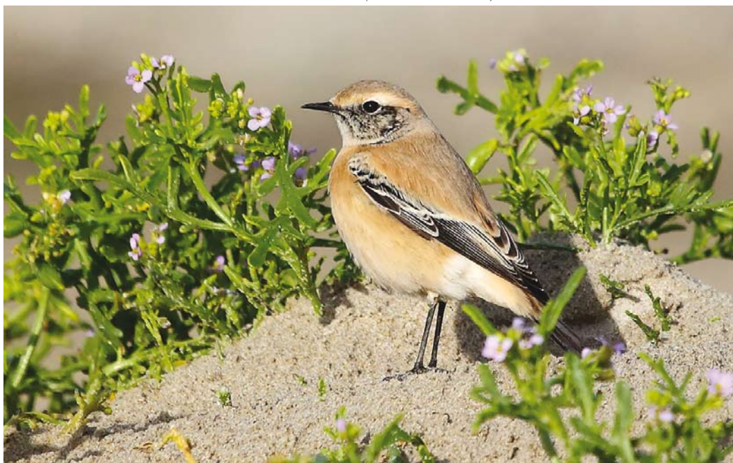
535 Desert Wheatear / Woestijntapuit Oenanthe deserti , first calendar-year male, Paal 29, Texel, Noord-Holland, 6 November 2016