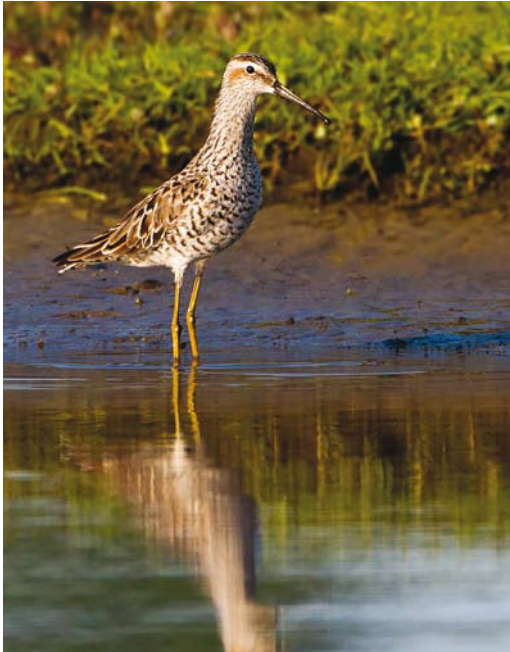
522 Stilt Sandpiper / Stelstrandloper Calidris himantopus , first-summer, Borculo, Gelderland, 16 May 2016 (Karel A Mauer)

These were (only) the first and second for Texel. The second was found dead in a tern colony; it had been ringed as a chick on Coquet Island, Northumberland, England, on 26 July 2014 (486 km north-west of Texel).