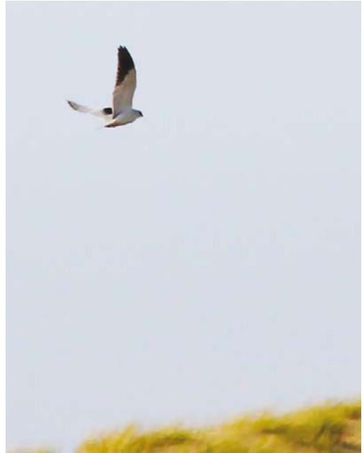
523 Black-winged Kite / Grijze Wouw Elanus caeruleus , adult, Noordhollands Duinreservaat, Castricum, Noord-Holland, 4 April 2016 (Sander Lagerveld)

Again, a crazy number for one year! The first record of this former mega rarity was in 1971, the second in 1998 and the third in 2000. The remaining 15 followed since 2009, with six in 2015 and four in 2016. Limburg is now