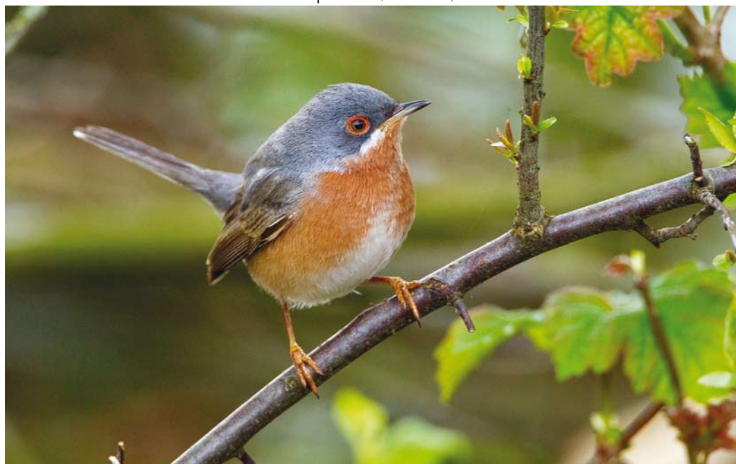
529 Western Subalpine Warbler / Westelijke Baardgrasmus Sylvia inornata , male, Wageningen, Gelderland, 16 April 2016