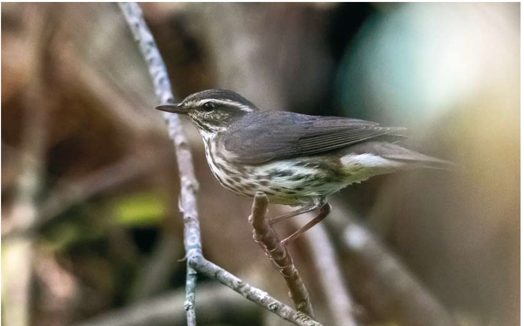
572 Northern Waterthrush / Noordse Waterlijster Parkesia noveboracensis , Corvo, Azores, 6 October 2017 (Rafael Armada)