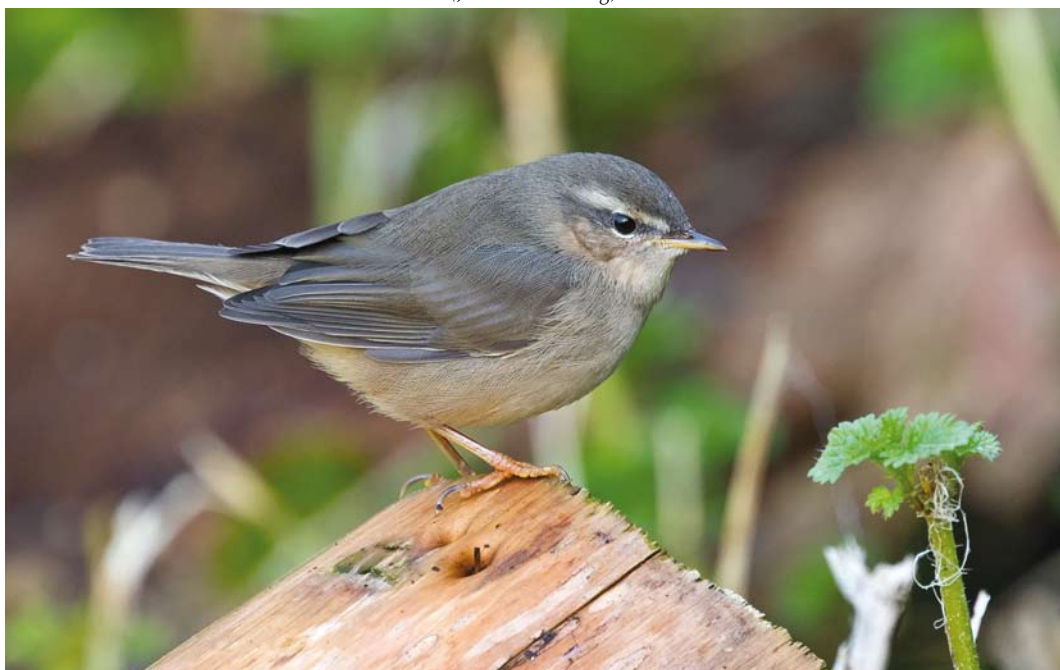
603 Bruine Boszanger / Dusky Warbler Phylloscopus fuscatus , Oost, Texel, Noord-Holland, 27 oktober 2017