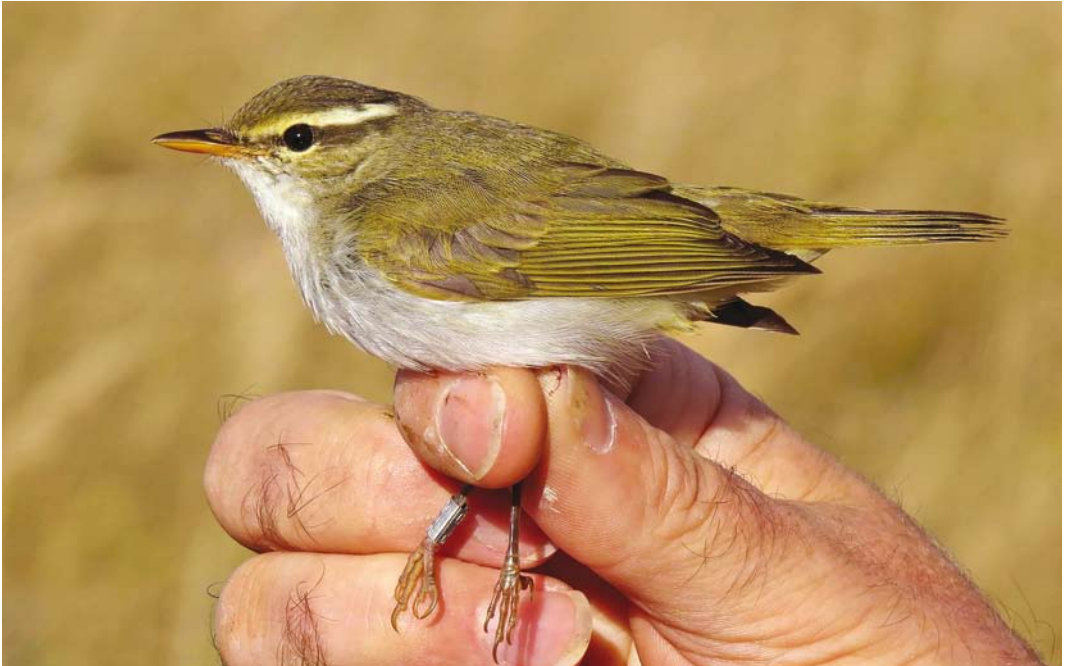
530 Eastern Crowned Warbler / Kroonboszanger Phylloscopus coronatus , Noordhollands Duinreservaat, Castricum, Noord-Holland, 21 October 2016 ( Hans Schekkerman )