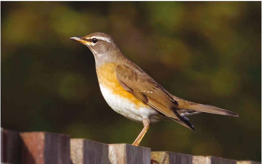
609 Vale Lijster / Eyebrowed Thrush Turdus obscurus , eerstejaars mannetje, Oost-Vlieland, Vlieland, Friesland, 21 oktober 2017 (Jaap Denee)