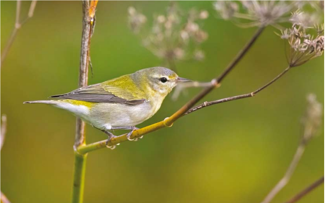
591 Tennessee Warbler / Tennesseezanger Oreothlypis peregrina , first-year, Corvo, Azores, 21 October 2017 (David Monticelli)