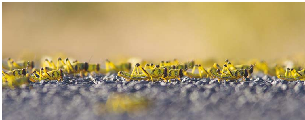
548 Desert Locusts / Woestijnsprinkhanen Schistocerca gregaria , bands, gregarious late instars, Aousserd road, Oued Al-Debeh, Western Sahara, Morocco, 20 April 2016 (Peter Stronach)