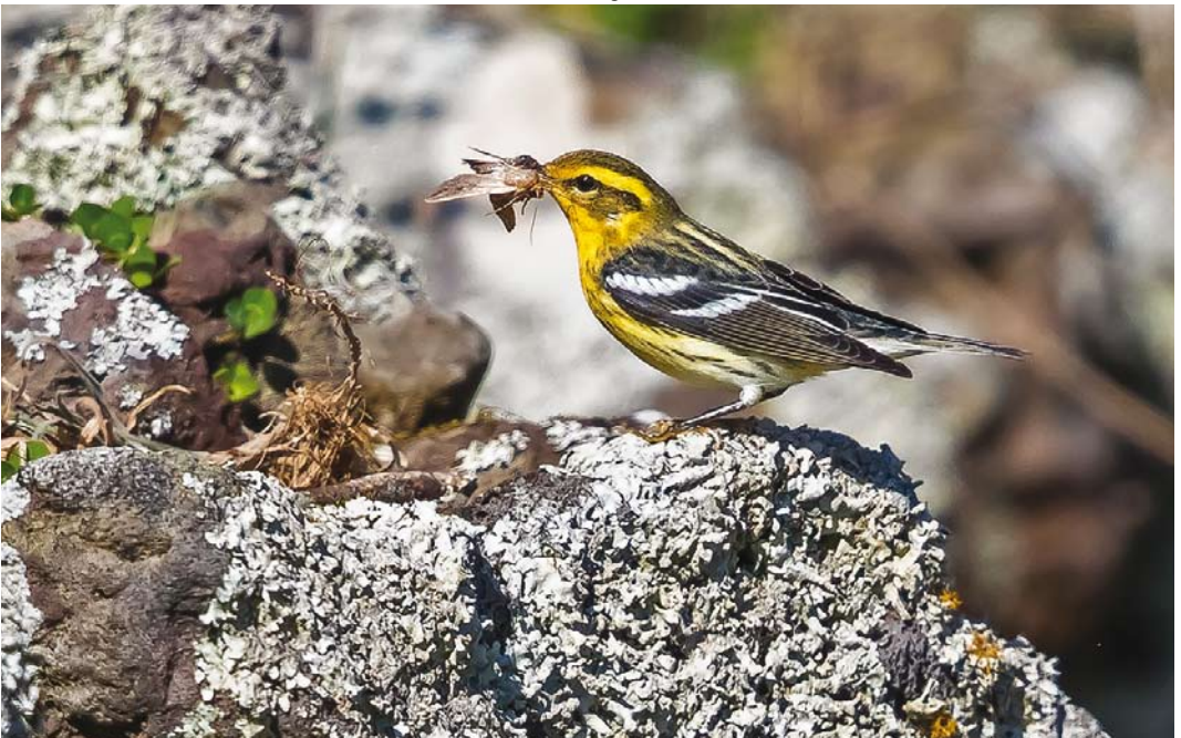
592 Blackburnian Warbler / Sparrenzanger Setophaga fusca , first-year male, Corvo, Azores, 15 October 2017 (Vincent Legrand)