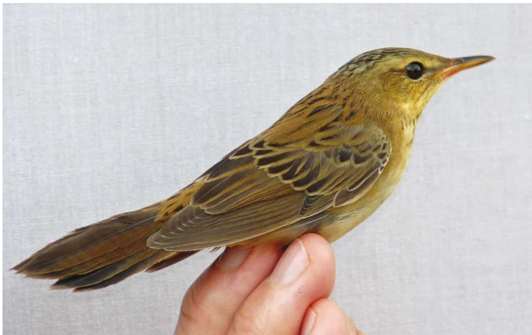
606 Siberische Sprinkhaanzanger / Pallas's Grasshopper Warbler Locustella certhiola , eerstejaars, Noordhollands Duinreservaat, Castricum, Noord-Holland, 17 september 2017