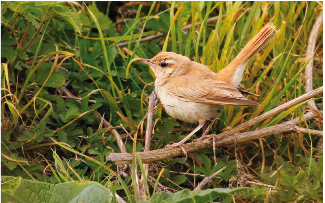
537 Western Rufous-tailed Scrub Robin / Westelijke Rosse Waaierstaart Cercotrichas galactotes galactotes , Maasvlakte, Zuid-Holland, 20 September 2016 ( Marcel Klotwijk )