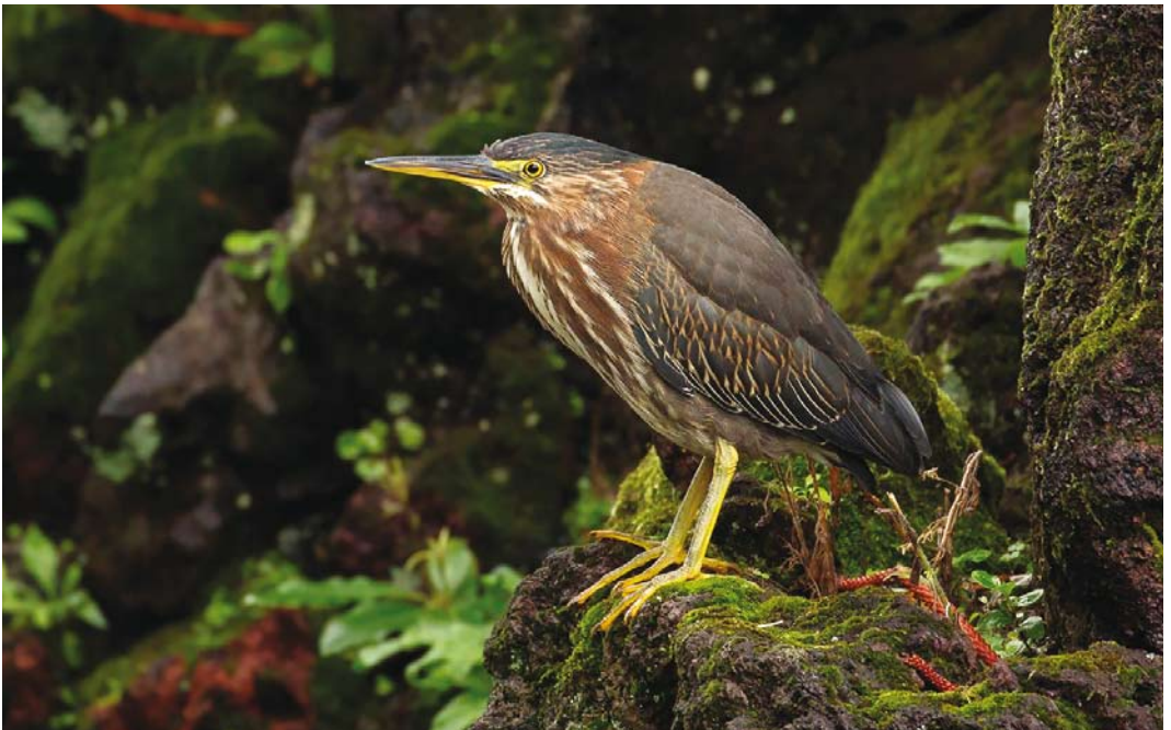
553 Green Heron / Groene Reiger Butorides virescens , first-year, Faial, Azores, 27 October 2017