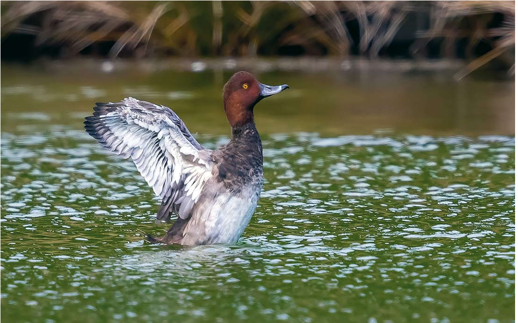
550 Redhead / Amerikaanse Tafeleend Aythya americana , adult male, Terceira, Azores, 4 October 2017