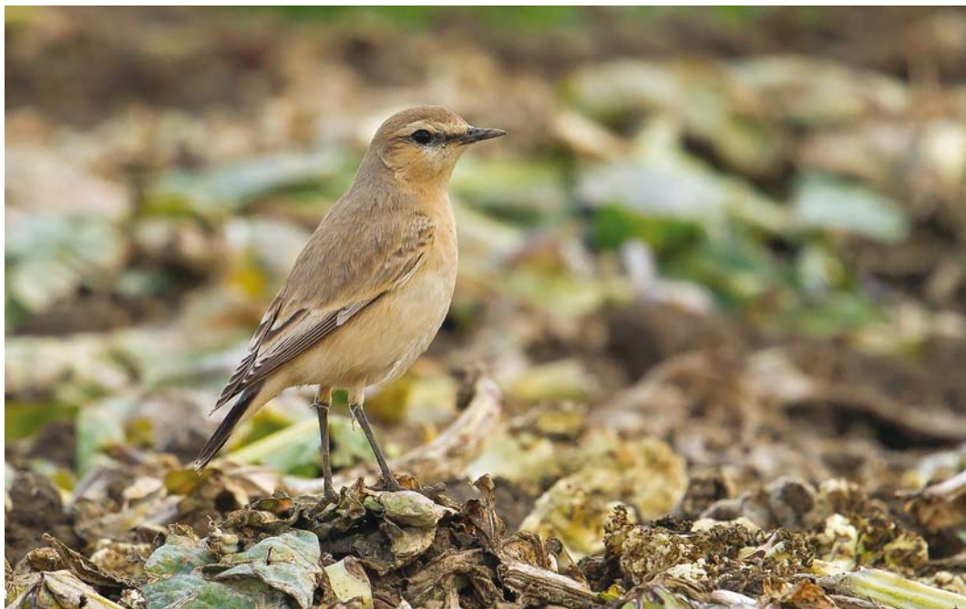
534 Isabelline Wheatear / Izabeltapuit Oenanthe isabellina , first calendar-year, Polredijk, Veere, Zeeland, 25 October 2016