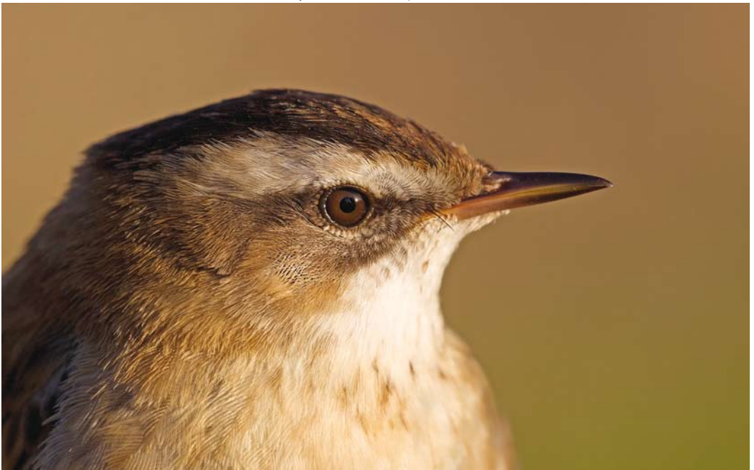
531 Moustached Warbler / Zwartkoprietzanger Acrocephalus melanopogon , Ooijse Graaf, Ooijpolder, Gelderland, 21 April 2016