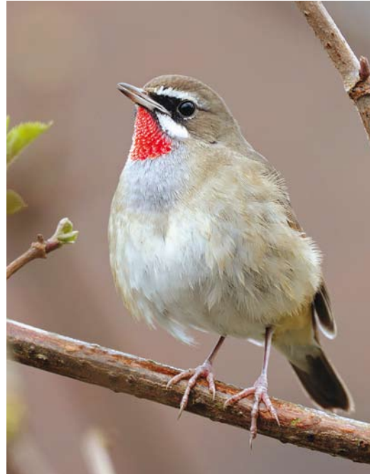
533 Siberian Rubythroat / Roodkeelnachtegaal Calliope calliope , first-winter male, Hoogwoud, Noord-Holland, 12 February 2016

24, plate 32-33, 26, plate 34-35, 27, figure 1, 28, plate 36-37, 2017).