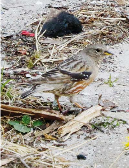
532 Alpine Accentor / Alpenheggenmus Prunella collaris , Vuurboetsduin, Vlieland, Friesland, 5 May 2016