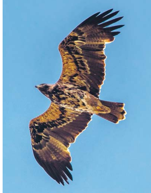
615 Keizerarend / Eastern Imperial Eagle Aquila heliaca , vierde-kalenderjaar, Brobbelbies, Schaijk, Noord-Brabant, 27 september 2017 (Toy Janssen)

springen. Ook was hij op ten minste twee plekken in gevecht met lokale Zeearenden. Rond 11:00 zat hij langere tijd in een weiland, waar hij door veel mensen mooi werd gezien. Na 13:05 werd het stil – gedurende de hele middag zochten er nog 10-tallen mensen maar hij werd niet meer gevonden.