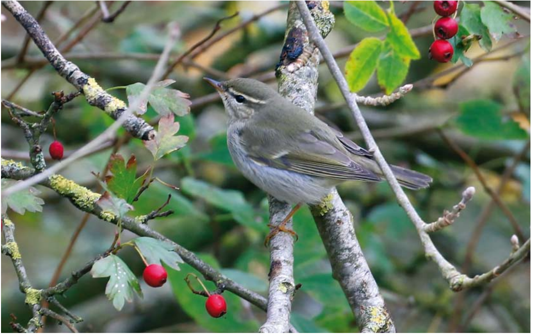
604 Noordse Boszanger / Arctic Warbler Phylloscopus borealis , camping Seedune, Schiermonnikoog, Friesland, 9 oktober 2017