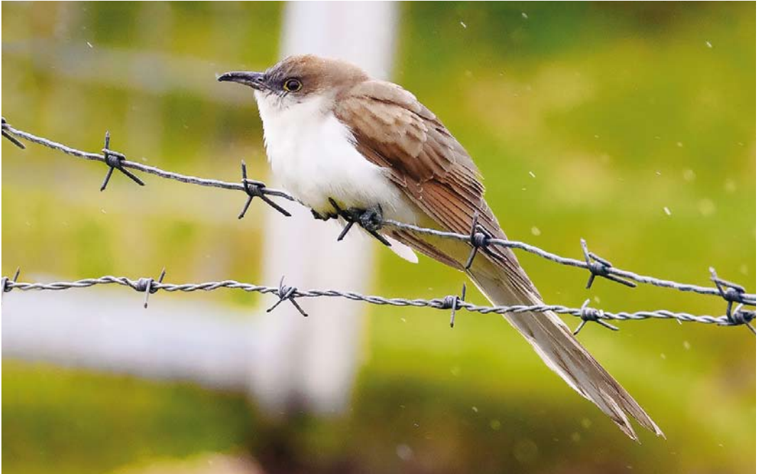
552 Black-billed Cuckoo / Zwartsnavelkoekoek Coccyzus erythrophthalmus , juvenile, Dale of Walls, Mainland, Shetland, Scotland, 18 September 2017 cf Dutch Birding 39: 337, 2017