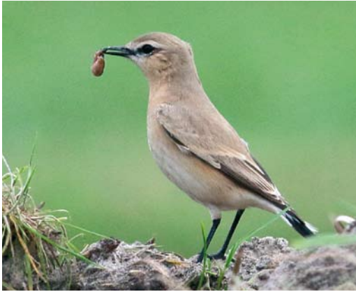
610 Izabeltapuit / Isabelline Wheatear Oenanthe isabellina , eerstejaars, Dorpszicht, Texel, Noord-Holland, 26 oktober 2017