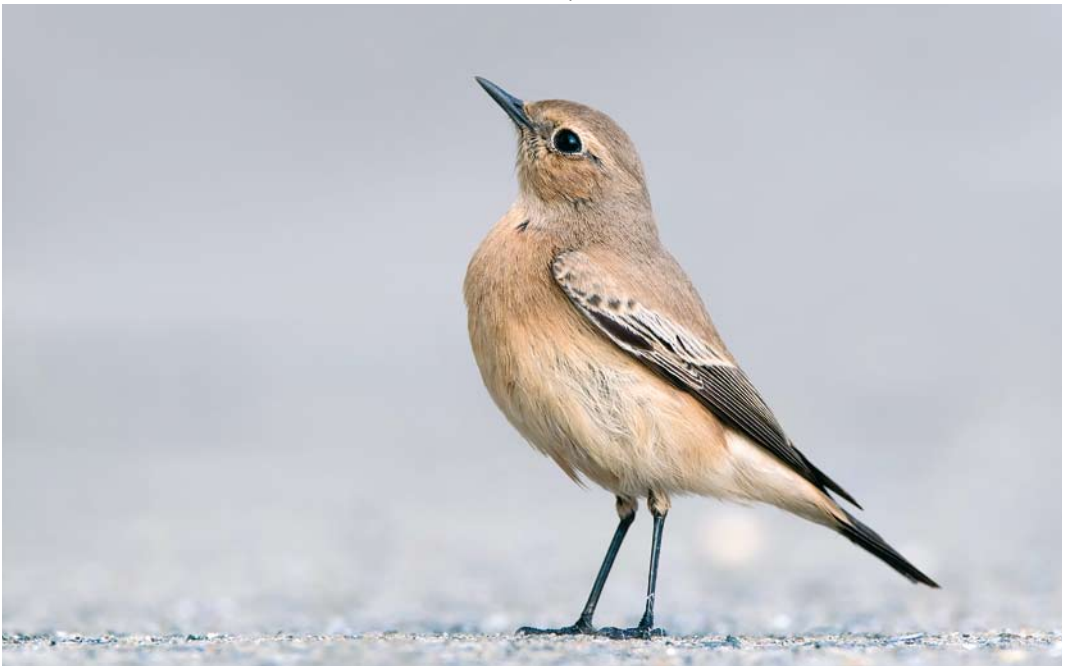
567 Desert Wheatear / Woestijntapuit Oenanthe deserti , first-year female, Zeebrugge, West-Vlaanderen, Belgium, 9 October 2017