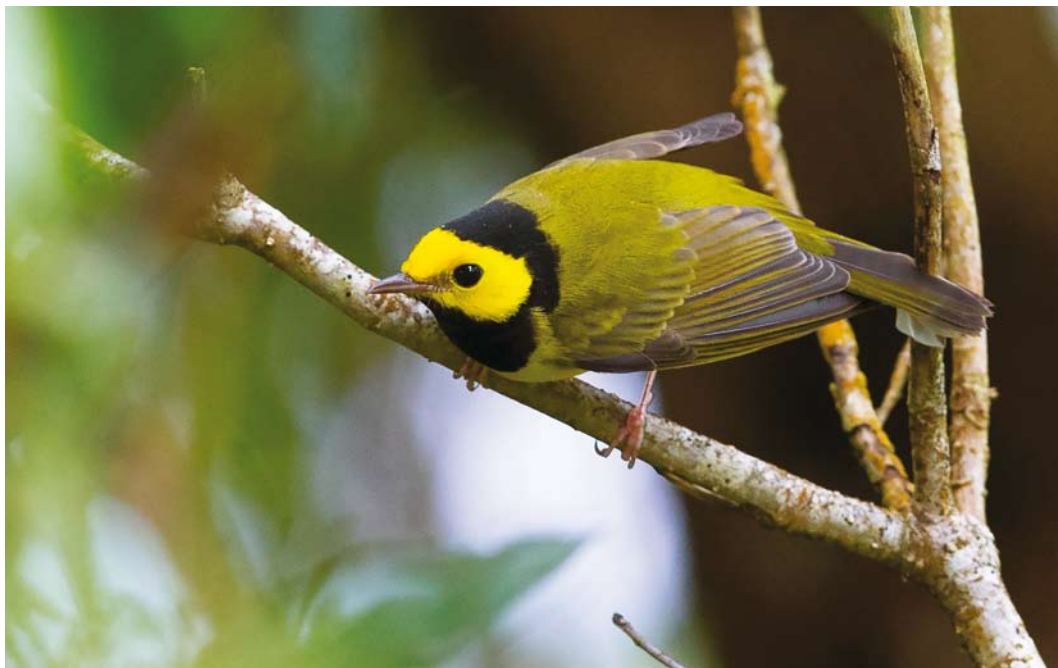
586 Hooded Warbler / Monnikszanger Setophaga citrina , first-year male, Corvo, Azores, 23 October 2017 (Mika Bruun)