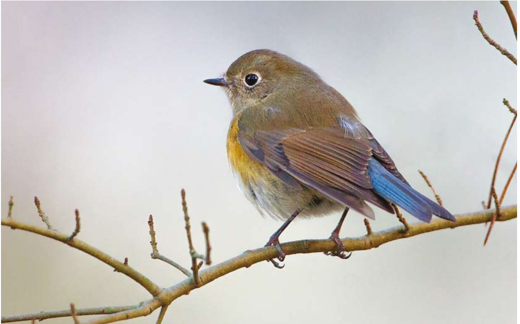
536 Red-flanked Bluetail / Blauwstaart Tarsiger cyanurus , first calendar-year, Pan van Persijn, Wassenaar, Zuid-Holland, 6 December 2016