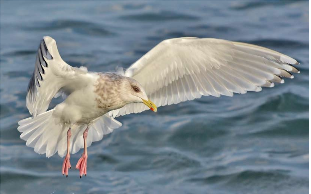
151-152 Thayer's Gull / Thayers Meeuw Larus thayeri , adult, San Ciprian, Galicia, Spain, 10 March 2013 ( Antonio Martínez Pernas ) 153 Iceland Gull / Kleine Burgemeester Larus glaucooides , second-winter, Merligen, Bern, Switzerland, 26 January 2013 ( Jonas Landolt )