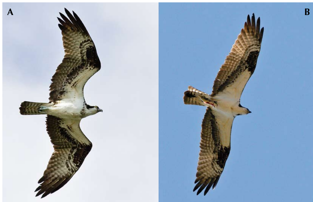
FIGURE 8 American Ospreys / Amerikaanse Visarenden Pandion haliaetus carolinensis . A adult female, Bahamas, 14 March 2010 (Craig Nash); B adult male, Wyoming, USA, 10 July 2007 (Mats Wallin). General sex appearance is same in carolinensis as in haliaetus but difference is slightly less obvious as the size difference seems to be less. Nevertheless, wings, tail and neck are typically longer in females while the belly is less pronounced in carolinensis females, making body shape more even between sexes. Furthermore, females show stronger markings with spotted underwing-coverts area and heavily spotted breast-band. Note also big solid carpal patch in both sexes and slightly broader bands across greater under primary coverts in female.

sex only 50-70% of the pairs studied in North America when relying on breast-band alone.