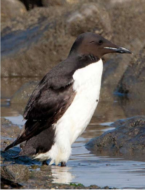
122 Kortbekzeekoet / Thick-billed Murre Uria lomvia lomvia , Kustweg, Lauwersmeer, Groningen, 29 juli 2012