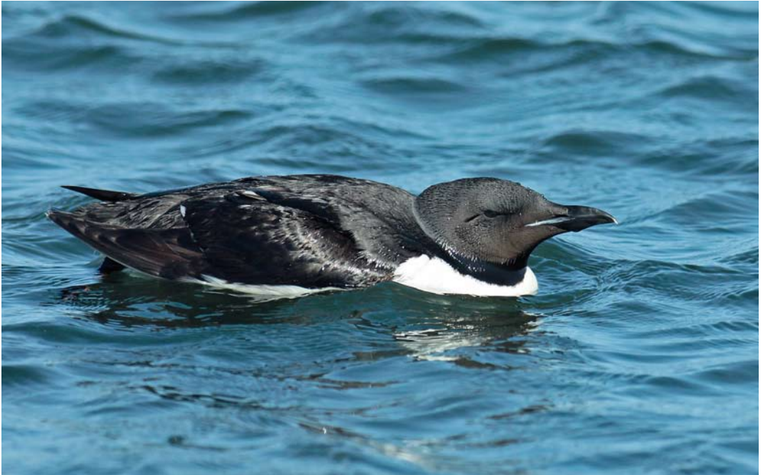
123 Kortbekzeekoet / Thick-billed Murre Uria lomvia lomvia , Huisduinen, Den Helder, Noord-Holland, 12 augustus 2012