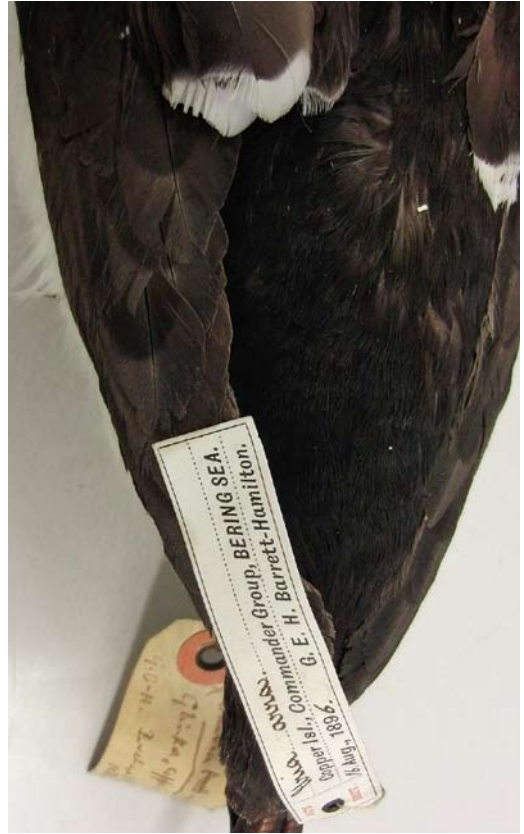
126 Kortbekzeekoet / Thick-billed Murre Uria lomvia arra (verzameld op Commandeurseilanden, Rusland, op 16 augustus 1896), Natural History Museum, Tring, Engeland, 8 november 2012. Typisch patroon met kleine witte top aan armpennen (hier 6 mm) en vrijwel zwarte binnenvlag.

tische Oceaan van Oost-Canada tot Nova Zembla (Novaya Zemlya), Rusland): bovenzijde zwart-achtig, tussen leonorae en arra in; relatief grote witte top aan centrale armpennen (9-14 mm) en diffuus wit op binnenvlag van centrale armpennen duidelijk aanwezig maar variabel. 2 arroides (Frans Jozefland (Zemlja Frantsa Iosifa), Rusland): zeer donkere, diepzwarte bovenzijde en relatief kleine witte top aan centrale armpennen. 3 leonorae (oostelijk Taimyr tot Nieuw-Siberische Eilanden (Novosibirskije ostrova), Rusland): minst donkere taxon met lichtste grijze bovenzijde; achterkop lichtbruin; grote witte top aan centrale armpennen (groter dan bij nominaat lomvia ); snavel kort en slank in vergelijking met andere ondersoorten. 4 heckeri (Wrangel en Herald eilanden en noord-