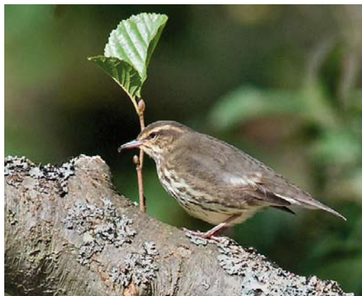
144 Noordse Waterlijster / Northern Waterthrush Parkesia noveboracensis , Oude Eendenkooi, Vlieland, Friesland, 21 september 2010

Until late 2012, there have been 19 other records in the WP: in the Azores (six, of which four in autumn 2012), Britain (seven), Channel Islands (one), France (three) and Ireland (two). There is only one WP record of