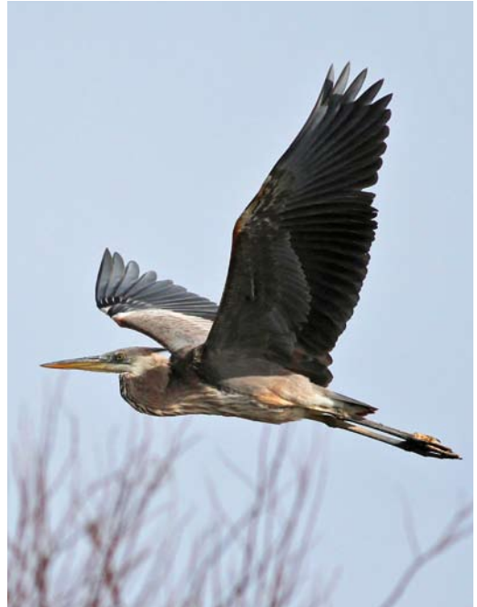
146 Bourne's Heron / Kaapverdise Purperreiger Ardea bournei , juvenile, Barragem de Poilão, Santiago, Cape Verde Islands, 5 March 2013 ( Kris De Rouck ) 147 Great Blue Heron / Amerikaanse Blauwe Reiger Ardea herodias , Corvo, Azores, 8 February 2013 ( Gerbrand Michielsen ) 148 Yellow-billed Egret / Middelste Zilverreiger Mesophoyx intermedia , Barragem de Poilão, Santiago, Cape Verde Islands, 5 March 2013 ( Kris De Rouck ) 149 Ashy Drongo / Grijsze Drongo Dicrurus leucophaeus , Fintas Park, Kuwait, 18 February 2013 ( Pekka Fagel )