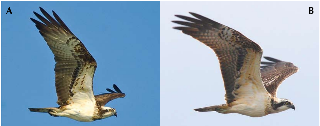
FIGURE 1 Ospreys / Visarenden Pandion haliaetus haliaetus . A adult female, Skagen, Denmark, 19 April 2005; B first calendar-year female, Stevns, Denmark, 25 August 2007. Combination of fresh plumage, pale tips to flight-feathers and upperparts, rusty yellow wash to underwing-coverts and orange-yellow iris are first-autumn characters. Young females often lack the distinct dark drop-spots on the underwing-coverts that adult females show. Note also female characters shown by both birds, including large head, broad and long wings, long tail, large feet and robust breast/belly. Pattern on greater underwing-coverts is often hard to judge and also variable (see figure 6-7 and 14). Looking closer at the adult female ( A ), tips of often concealed outer median underwing-coverts are visible.

subspecies are given, while focusing on haliaetus and carolinensis .