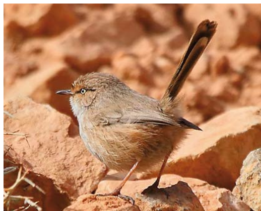
134 Streaked Scrub Warbler / Maquiszanger Scotocerca inquieta , Gorges du Todra, north of Tinerhir, Central High Atlas, Morocco, 26 January 2012 (Frank Dhermain)