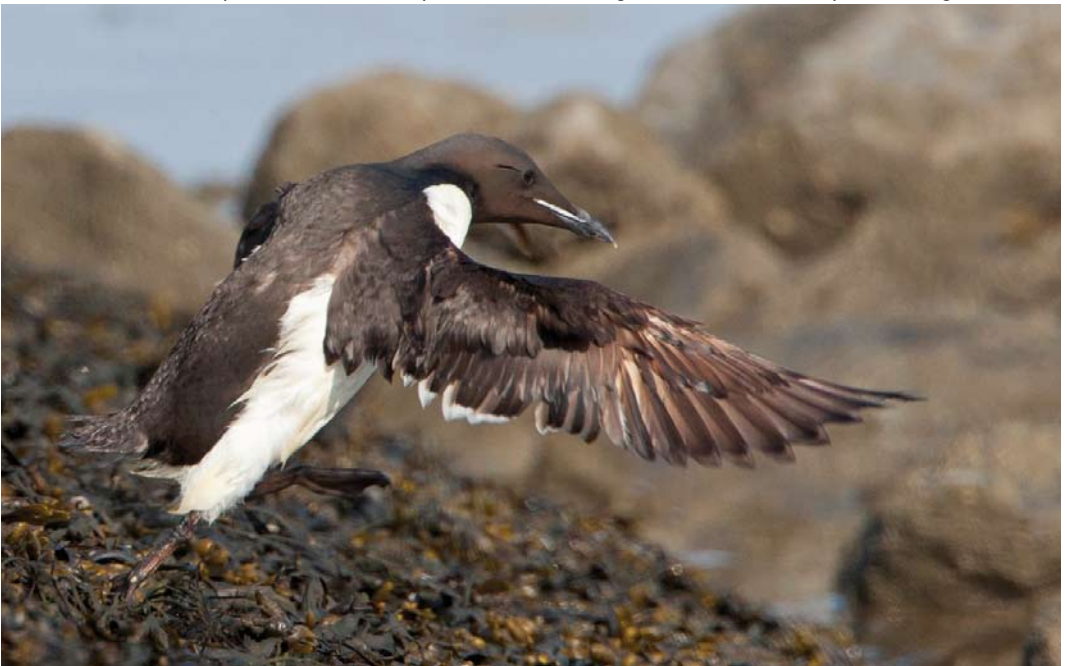
121 Kortbekzeekoet / Thick-billed Murre Uria lomvia lomvia , Kustweg, Lauwersmeer, Groningen, 29 juli 2012 (Co van der Wardt). Op enkele centrale armpennen (rond s10) is grote hoeveelheid wit op binnenvlag zichtbaar.