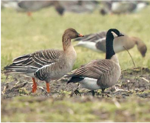
173 Kleine Canadese Gans / Cackling Goose Branta hutchinsii , met Toendrarietganzen / Tundra Bean Geese Anser serrirostris , Vriezenveen, Overijssel, 26 februari 2013