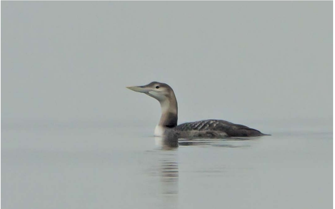
167 Geelsnavelduiker / Yellow-billed Loon Gavia adamsii , eerstejaars, Dreischor, Grevelingenmeer, Zeeland, 16 februari 2013