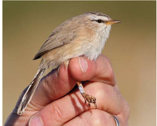
140 Streaked Scrub Warbler / Maquiszanger Scotocerca inquieta inquieta , Hameishar plains, southern Negev, Israel, 17 December 2012 (Yoav Perlman)

The variation in colour intensity within the population of theresae found near Goulimine, Lower Draa, having richer and darker colours than in areas further east or south may perhaps relate to an ecological adaptation. According to Gloger's Rule (Gloger 1833), birds in more humid habitats tend to show darker and redder colours than those in drier areas ('eumelanin' and, therefore, are darker or redder