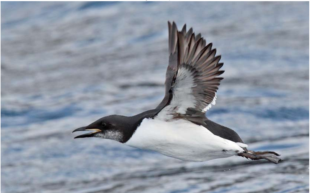
116 Kortbekzeekoet / Thick-billed Murre Uria lomvia , Lerwick, Shetland, Schotland, december 2005