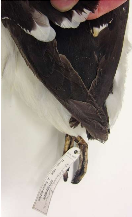
125 Kortbekzeekoet / Thick-billed Murre Uria lomvia lomvia (verzameld op Spitsbergen in 1896), Natural History Museum, Tring, Engeland, 8 november 2012. Exemplaar met relatief kleine witte top (10 mm) aan armpennen en matig ontwikkelde lichtere binnenvlag (s10 blootgelegd). Nederlandse vogel lijkt meer wit te hebben.