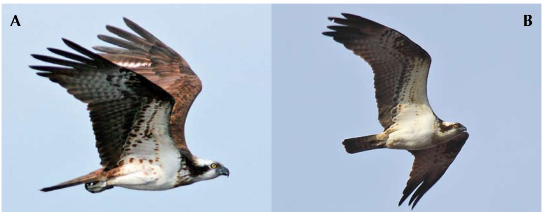
FIGURE 5 Ospreys / Visarenden Pandion haliaetus haliaetus . A adult female, Ivösjön, Sweden, 6 July 2008 (Linda Niklasson); B adult male, Armsjön, Sweden, 25 April 2012 (Leif Strandberg). Comparison of underwing patterns in well-pigmented individuals.

ing the breeding period – males forage while females care for the young), 12% of the males showed a pale, sparsely streaked to sometimes nearly invisible breast-band (with a faint pale brown wash). Hence, a minority of haliaetus males shows incomplete markings or faint coloration on the breast but I have not found one single male, either in the field or in photo galleries, that lacks