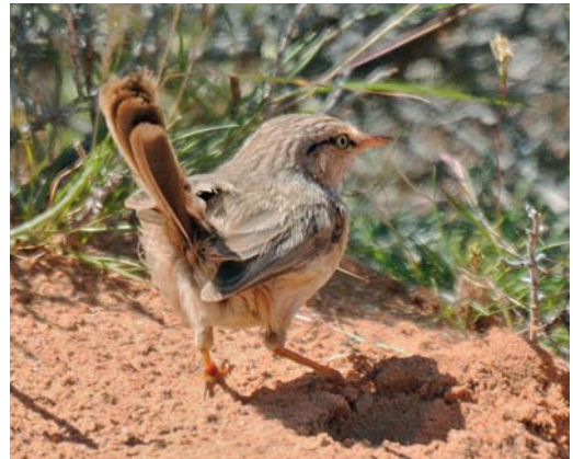
136 Streaked Scrub Warbler / Maquiszanger Scotocerca inquieta , west of Errachidia, Tafilalt, Morocco, 8 April 2010 (Arnoud B van den Berg) 137 Streaked Scrub Warbler / Maquiszanger Scotocerca inquieta , west of Errachidia, Tafilalt, Morocco, 13 March 2012 (Arnoud B van den Berg) 138 Streaked Scrub Warbler / Maquiszanger Scotocerca inquieta , south of Erfoud, Tafilalt, Morocco, 3 May 2010 (Benoît Maire) 139 Streaked Scrub Warbler / Maquiszanger Scotocerca inquieta , west of Errachidia, Tafilalt, Morocco, 29 March 2009 (Arnoud B van den Berg)

from north-eastern Egypt to Jordan and central Arabia. Three other subspecies are described further south in the Arabian Peninsula ( S i grisea , S i buryi and S i striata ) but Jennings (2010) suggests that a review is needed. In western Central Asia from Iran to Uzbekistan, Kazakhstan, Pakistan and north-western India, also three subspecies are known ( S i montana , S i platyura and again S i striata ). Saharae occurs from eastern and southern Morocco eastward (Thévenot et al 2003) and through Algeria and Tunisia into Libya. Thesae has been described by Meinertzhagen (1939) from a male collected near Bou Izakarn on 5 November 1938 and, according to Thévenot et al (2003), it occurs in south-western Morocco. It should be noted that there is confusion about the distribu-