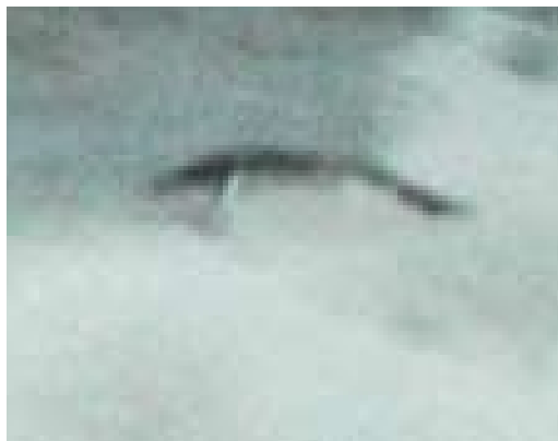
103-104 Kortbekzeekoet / Thick-billed Murre Uria lomvia , Paal 7, Noordzeestrand, Schiermonnikoog, Friesland, 23 oktober 2005 (Martijn Renders)

minatie. Een vliegende Kortbekzeekoet combineert een opvallend hangende, bolle buik, met een hoge rug en een korte 'stierennek' (cf plaat 105-106). Svensson et al (2009, 2010) beschrijven de soort als 'vliegend vaatje' (Nederlandse versie) of 'rugbybal' (Engelse versie); Blomdahl et al (2003) gebruiken een vergelijkbare typering. Bij Alk en Zeekoet is de overgang van romp naar kop geprononceerder dan bij Kortbekzeekoet. Zeekoet heeft ten opzichte van Kortbekzeekoet een meer langgerekt postuur in vlucht (cf plaat 110-112). Ook Zeekoet kan een enigszins 'gebochelde' indruk maken. Bij Zeekoet lijkt het zwaartepunt van het lichaam iets achter de vleugels te liggen terwijl dit bij Kortbekzeekoet en Alk ter hoogte van de vleugels lijkt te liggen. Hoewel steviger gebouwd dan Zeekoet komt Alk meer gestroomlijnd over dan Kortbekzeekoet door het meer 'torpedovormige' lichaam en de langere staart (cf plaat 107-109). De stevige kop en snavel resulteren in een topzware indruk. Alk mist het 'gebochelde' postuur maar kan wel een bolle buik hebben.