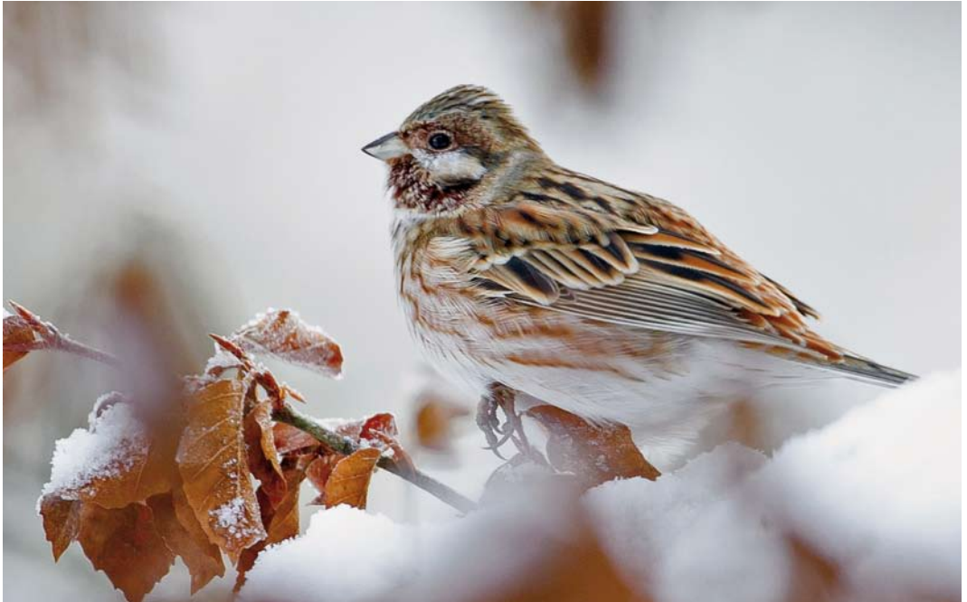
165 Pine Bunting / Witkopgors Emberiza leucocephalos , male, Sprova, Nord-Trøndelag, Norway, 12 February 2013