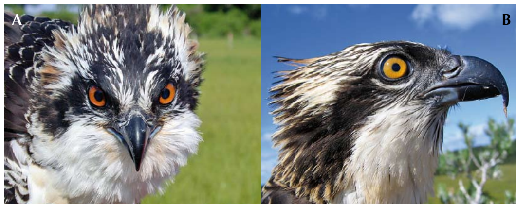
FIGURE 12 Ospreys / Visarenden Pandion haliaetus . A P h carolinensis , juvenile, Tashmoo, New England, USA, 2 August 2008; B P h haliaetus , Grimsö area, Sweden, 19 July 2007. Note in carolinensis reddish iris, blackish plumage, darker upper gape, black eyeliner, and lack of gorget streaks, and in haliaetus yellow-orange iris, brownish plumage, equally bluish upper and lower gape, blue-grey eyeliner and black gorget streaks.

mottled brown and pale brown on upperwing-coverts. Carolinensis : blackish-brown, males often blacker on upperwing-coverts.