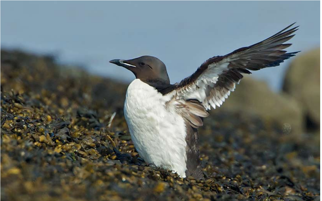
120 Kortbekzeekoet / Thick-billed Murre Uria lomvia lomvia , Kustweg, Lauwersmeer, Groningen, 29 juli 2012 (Martin van der Schalk)