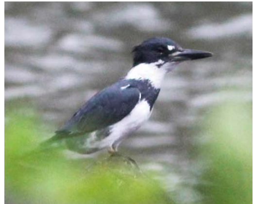
161 Sandhill Crane / Canadese Kraanvogel Grus canadensis , Gallocanta, Zaragoza, Spain, 24 February 2013 (Felipe Rosado/Asociación de Amigos de Gallocanta) 162 Balearic Woodchat Shrike / Balearische Roodkopklauwier Lanius senator badius , Oued Massa, Morocco, 29 January 2013 (Arnoud B van den Berg) 163 African Dunn's Lark / Afrikaanse Dunns Leeuwerik Eremalauda dunnii dunnii , west of Aousserd, Western Sahara, Morocco, 6 February 2013 (Arnoud B van den Berg) 164 Belted Kingfisher / Bandiisvogel Megaceryle alcyon , Santa Maria, Azores, 29 January 2013 (Gerbrand Michielsen)

conneely, Galway, from 28 November 2012 stayed through mid-March. On 24-26 February, a Sandhill Crane Grus canadensis was seen in a huge flock of Common Cranes G grus at Gallocanta lagoon, Zaragoza, Spain.