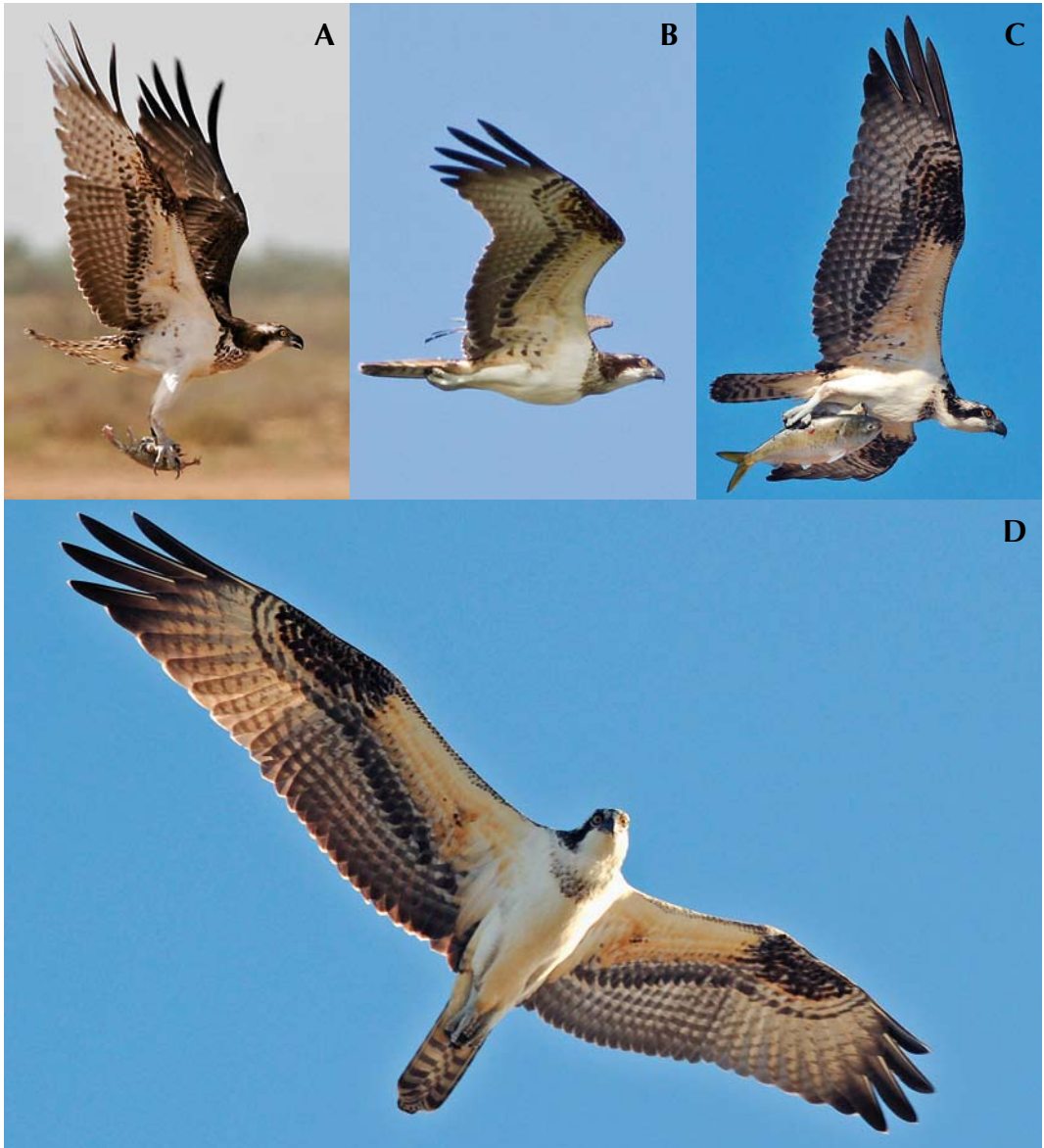
FIGURE 10 Ospreys / Visarenden Pandion haliaetus , first-year females. A P h haliaetus , Djoudj, Senegal, 21 November 2006; B P h haliaetus , Falsterbonäset, Sweden, 31 August 2011; C-D P h carolinensis , Cape May, New Jersey, USA, 28 September 2010. Most useful characters to distinguish between young birds is illustrated in these females. Note prominent breast-band in haliaetus , continuing all the way up onto neck sides, while carolinensis has a spotted band reduced to a breast-patch. No direct subspecies differences are recognized concerning carpal patches. Iris color differs with more orange-yellow to reddish eyes in carolinensis . Also compare belly shape.