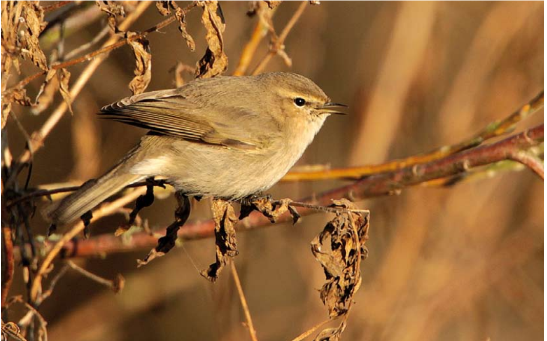
171 Siberische Tjiftjaf / Siberian Chiffchaff Phylloscopus collybita tristis , Wageningse Bovenpolder, Gelderland, 13 januari 2013