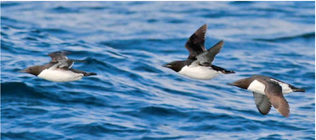
117 Kortbekzeekoet / Thick-billed Murre Uria lomvia arra (links) en Zeekoet / Common Murre U aalge inornata , Gambell, St Lawrence Island, Alaska, USA, August 2004 (Brian L Sullivan) 118 Kortbekzeekoet / Thick-billed Murre Uria lomvia arra (midden) en Zeekoeten / Common Murres U aalge inornata , Gambell, St Lawrence Island, Alaska, USA, August 2004 (Brian L Sullivan)

Bovendien zou gezien de tijd van het jaar alleen een extreem vroeg ruiende adulte zuidelijke Zeekoet op weg naar zomerkleed in aanmerking komen voor kopruï. Zuidelijke Zeekoeten bezitten juist de minst donkere bovendelen. Bovendien sluit de combinatie van zeer donkere bovendelen, lichte ondervleugel, afwezigheid van flankstreping en hoog oplopende witte zijflank (oftewel: een smalle, zwarte stuit) van de vogel van Schiermonnikoog Zeekoet (ongeacht de geografische oorsprong) uit. Samenvattend past de combinatie van waargenomen kenmerken alleen op Kortbekzeekoet.