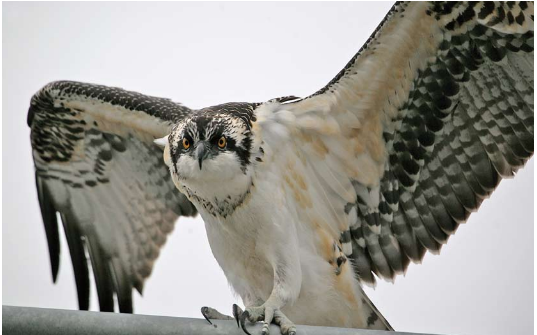
98-99 American Osprey / Amerikaanse Visarend Pandion haliaetus carolinensis , first-year male, Hafnarfjörður, Iceland, 22 September 2008 (Dagur Brynjólfsson)