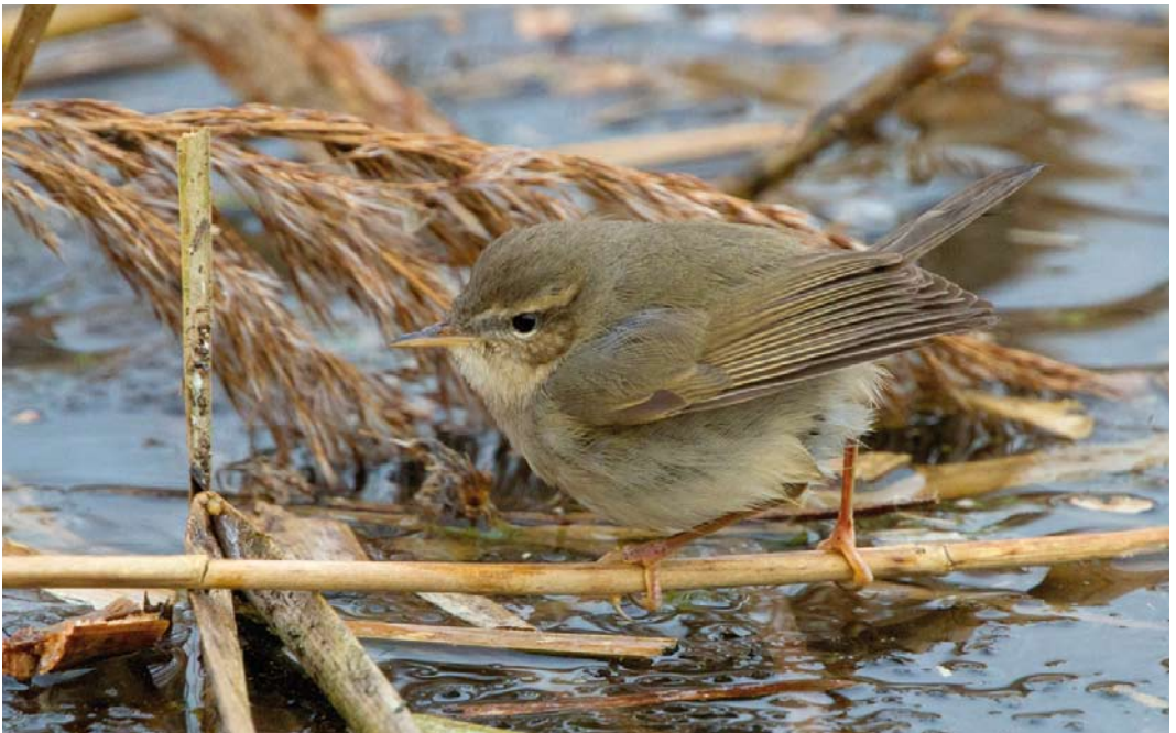
172 Bruine Boszanger / Dusky Warbler Phylloscopus fuscatus , Geestmerambacht, Noord-Holland, 18 januari 2013