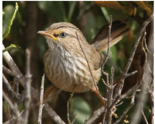
128 Streaked Scrub Warbler / Maquiszanger Scotocerca inquieta , Khnifiss lagoon, Tarfaya, West Saharan Morocco, 14 January 2012 ( Arnoud B van den Berg ) 129 Streaked Scrub Warbler / Maquiszanger Scotocerca inquieta , Oued Sayed, Goulimine, Lower Draa, Morocco, 5 April 2004 ( Arnoud B van den Berg ) 130 Streaked Scrub Warbler / Maquiszanger Scotocerca inquieta , Oued Boukila, Goulimine, Lower Draa, Morocco, 30 April 2010 ( Tomas Svensson ) 131 Streaked Scrub Warbler / Maquiszanger Scotocerca inquieta , young, Oued Boukila, Goulimine, Lower Draa, Morocco, 30 April 2010 ( Tomas Svensson )

where it has recently been observed mostly in coastal areas west and north-west of Goulimine (eg, Fom Assaka, Oued Noun, Fort Bou-Jerif). It is common in Lower Draa from Goulimine to Tantan (especially at Asrir, Oued Boukila, and along the Draa valley near Tafnidilt, but it is irregular at Oued Sayed), and in Tarfaya where it is especially abundant on the littoral between Akhfénir and the Khnifiss lagoon and further inland in the gras (well vegetated depressions with herbaceous and bushes of, eg, Nitraria , Atriplex , Rhus and Boxthorn Lycium ), on the plateaus and in the wadi valleys (eg, Oued El Ouair, Oued Ez-Zehar, Khaoui Naâm, Rhouiba; Qninba et al 2005b). Its range extends southwards into Saquiat Al-Hamra where