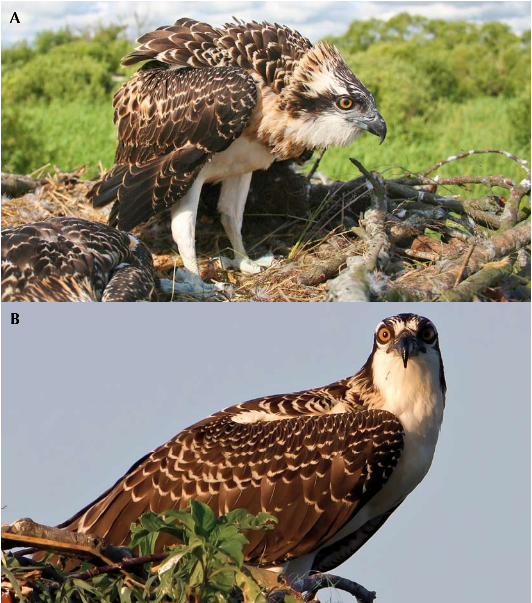
FIGURE 11 Ospreys / Visarenden Pandion haliaetus . A P h haliaetus , juvenile, Hammarsjön, Sweden, 2 July 2011; B P h carolinensis , juvenile, West River, Shady Side, Maryland, USA, 30 July 2011. Note differences in upperwing coloration, with haliaetus showing less contrast, narrower and rustier pale tips to wing-coverts and also typically a paler patch in centre of wing-coverts.