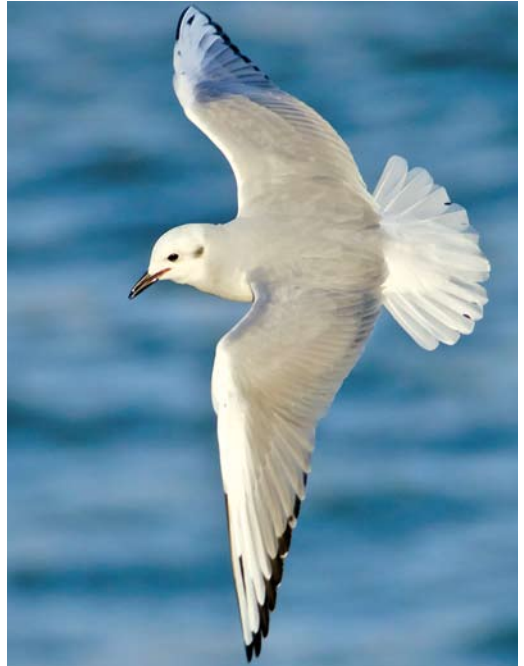
154 Lesser Yellowlegs / Kleine Geelpootruiters Tringa flavipes , Cural Velho, Boavista, Cape Verde Islands, 8 March 2013 155 Bonaparte's Gull / Kleine Kokmeeuw Chroicocephalus philadelphia , adult, Getxo, Bizkaia, Spain, 29 January 2013 cf Dutch Birding 35: 51, 2013 156 Bonaparte's Gull / Kleine Kokmeeuw Chroicocephalus philadelphia , adult, Eastbourne, East Sussex, England, 9 February 2013