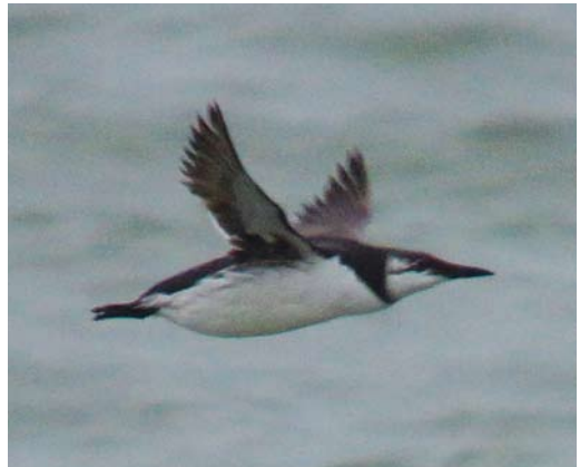
109 Alk / Razorbill Alca torda , Noordzee ten westen van Den Haag, Zuid-Holland, 24 januari 2013 (Steve Geelhoed) 110 Zeekoet / Common Murre Uria aalge , Noordzee ten westen van Den Haag, Zuid-Holland, 24 januari 2013 (Steve Geelhoed) 111 Zeekoet / Common Murre Uria aalge , Noordzee ter hoogte van Texel, Continentaal Plat, 21 oktober 2012 (Kees Boele) 112 Zeekoet / Common Murre Uria aalge , Noordzee ten westen van Castricum, Noord-Holland, 10 januari 2012 (Steve Geelhoed)

zal gelden dat er onder slechte waarnemingsomstandigheden verwarring met Kortbekzeekoet zou kunnen optreden, wanneer andere kenmerken niet in beschouwing worden genomen.