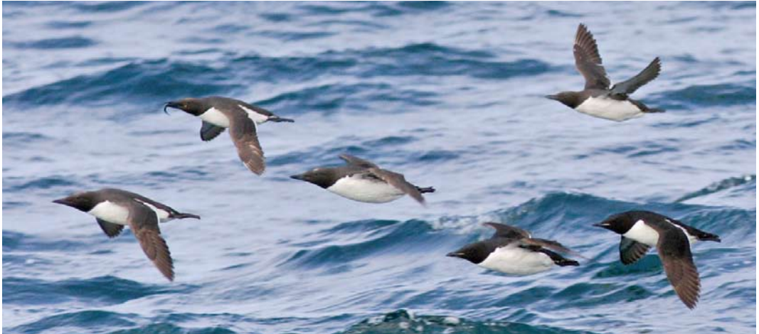
119 Kortbekzeekoeten / Thick-billed Murres Uria lomvia arra (rechtsonder) en Zeekoeten / Common Murres U aalge inornata , Gambell, St Lawrence Island, Alaska, USA, August 2004

Echter, onder gunstige omstandigheden is de identificatie van een langsvliegende Kortbekzeekoet zeker niet onmogelijk. Kortbekzeekoet deelt bepaalde kenmerken met Alk en andere met Zeekoet en de determinatie moet daarom gebaseerd worden op een combinatie van kenmerken. Bij een langsvliegende alkachtige is het van belang om op de volgende kenmerken te letten: 1 jizz; 2 snavelvorm; 3 pootprojectie; 4 koppelteken; 5 kleur van de bovendelen; 6 ondervleugel- en okseltekening; 7 aanwezigheid of afwezigheid van flankstreping; en 8 hoeveelheid wit op de achterflank en zwart op de stuit.