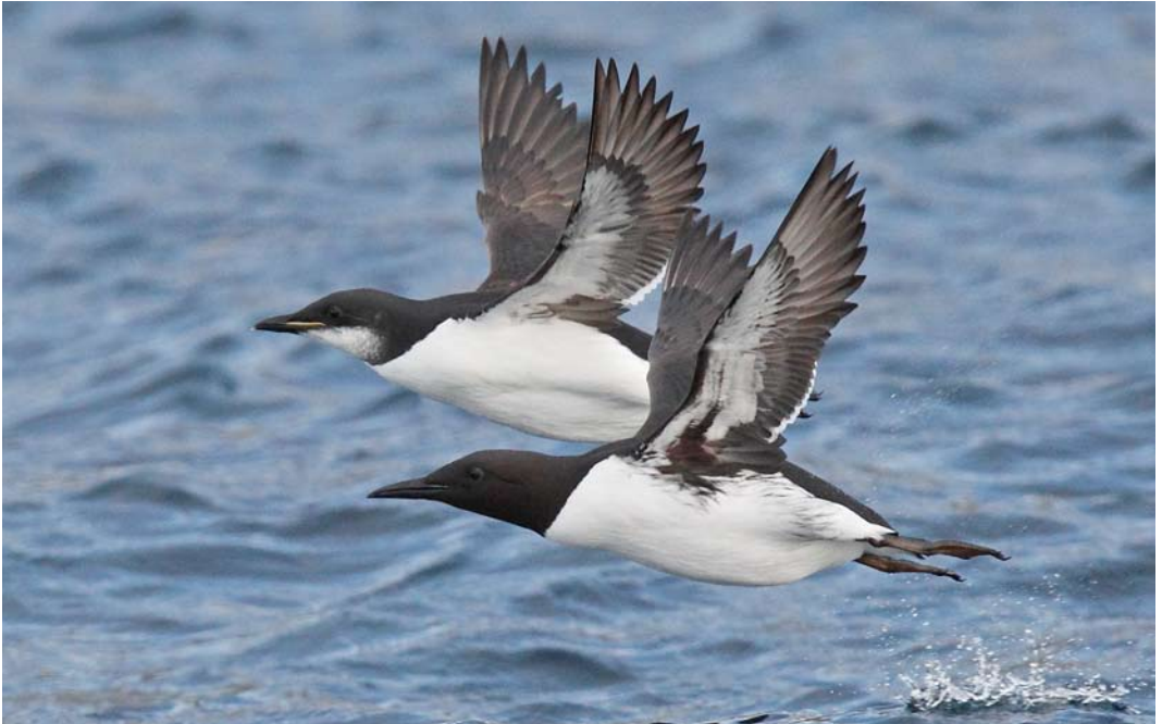
115 Kortbekzeekoet / Thick-billed Murre Uria lomvia (achter), met Zeekoet / Common Murre U aalge , Lerwick, Shetland, Schotland, december 2005