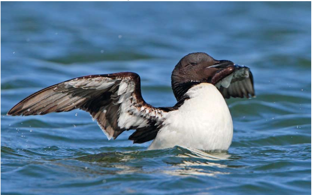
124 Kortbekzeekoet / Thick-billed Murre Uria lomvia lomvia , Huisduinen, Den Helder, Noord-Holland, 12 augustus 2012