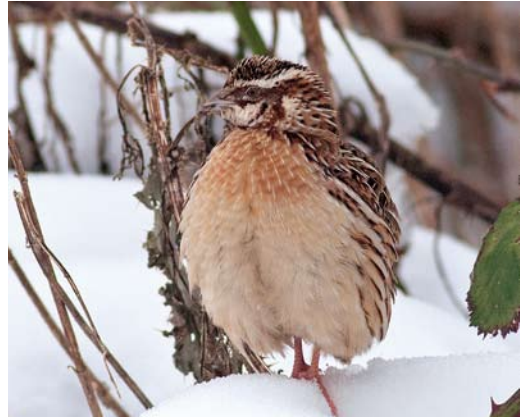
174 Kwartel / Common Quail Coturnix coturnix , mannetje, Zoutelande, Zeeland, 22 januari 2013

Camperduin en op 2 februari langs Vlieland, Friesland (twee); met name in februari is deze soort uitermate zeldzaam. Een dode Koereiger Bubulcus ibis werd op 1 januari opgeraapt van het strand bij Den Hoorn op Texel, Noord-Holland. Een levende werd op 27 januari gemeld bij Maasbree, Limburg. De Zwarte Ibis Plegadis falcinellus van Schiermonnikoog, Friesland, werd daar op 1 januari nog – of weer – waargenomen. Trektellers registreerden in totaal vijf Rode Vrouwen Milvus milvus , acht Zeearenden Haliaeetus albicilla , 53 Blauwe Kiekendieven Circus cyaneus (met name tijdens de sneeuwperiodes), twee Ruigpootbuiszeters Buteo lagopus , zes Smellekens Falco columbarius en 34 Slechtvalken F peregrinus . Een mogelijke Giervalk F rusticolus hield tussen 20 januari en 6 februari de gemoederen bezig rondom Den Oever, Noord-Holland. Trektellers meldde op vier plekken in totaal 11 Kraanvogels Grus grus . Op vier plaatsen langs de kust werden solitaire Rosse Franjepoten Phalaropus fulicarius waargenomen.