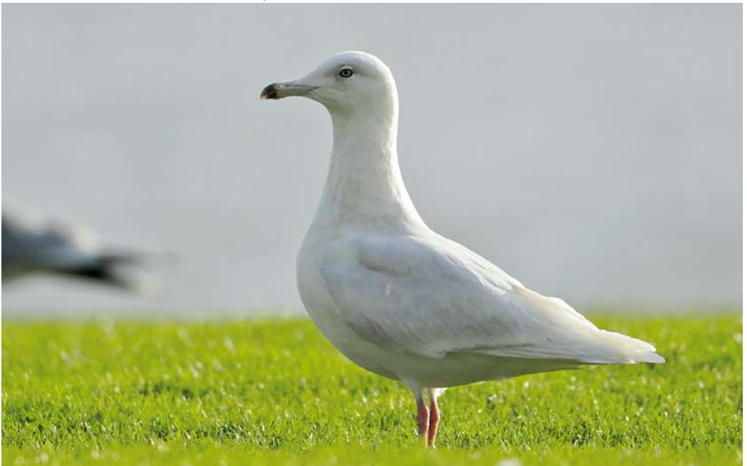
168 Grote Burgemeester / Glaucous Gull Larus hyperboreus , tweede-winter, Vlaardingen, Zuid-Holland, 12 januari 2013