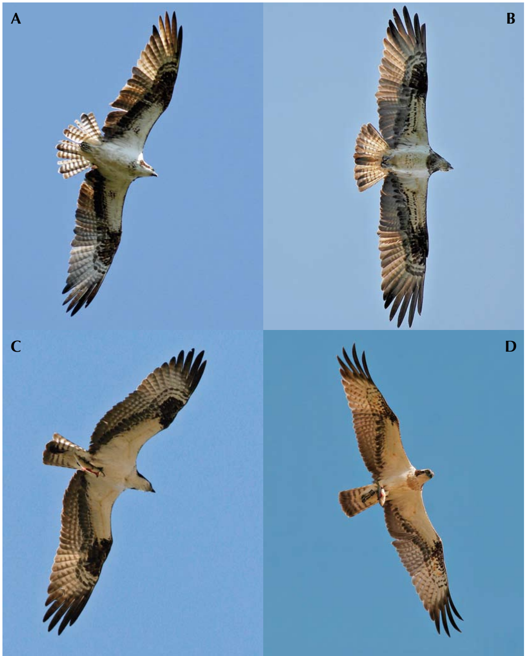
FIGURE 9 Ospreys / Visarenden Pandion haliaetus . A P h carolinensis , adult female, Cape May, New Jersey, USA, 20 September 2010 (Mats Wallin); B P h haliaetus , adult female, Åsnen, Sweden, 1 July 2008 (Håkan Berg); note extremely dark median under primary coverts for a haliaetus ; C P h carolinensis , adult male, Wyoming, USA, 10 July 2007 (Mats Wallin); same bird as in figure 8B; D P h haliaetus , adult male, Dakar, Senegal, 22 November 2006 (Patrik Olofsson)