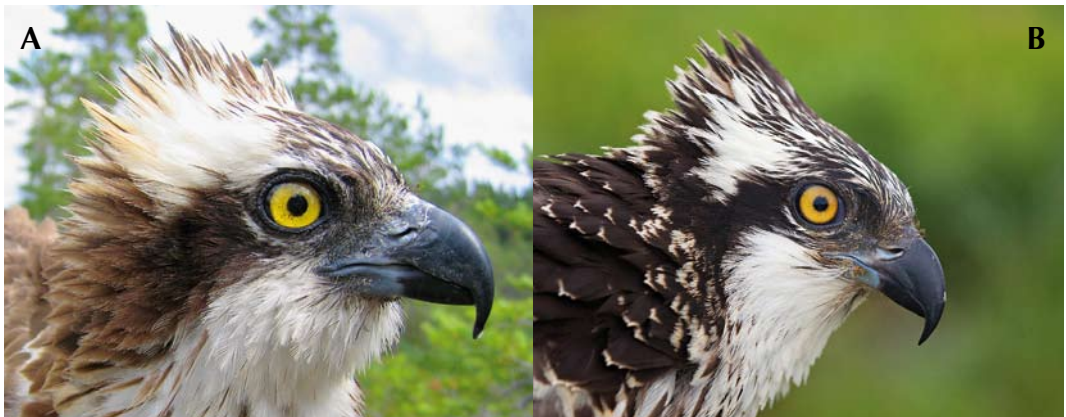
FIGURE 2 Ospreys / Visarenden Pandion haliaetus haliaetus . Comparison of iris colour between adult and juvenile. A adult female, Grimsö, Sweden, 5 July 2007; B rather typical juvenile male, Hammarsjön, Sweden, 8 August 2010. Note bluish tinged orbital ring and gape (compare with P h carolinensis in figure 12).

Even though species recognition and ageing of Ospreys is rather straightforward, identifying subspecies and sexing has received very little attention in the literature. Concerning sexing, most handbooks and field guides note that females are larger than males and highlight that females have a breast-band which is 'darker, broader, wider, better marked, more prominent, more pronounced, more heavily patterned or browner'