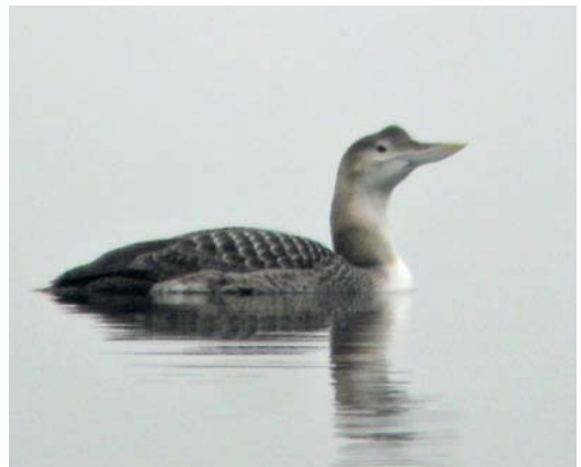
157 Homeyer's Golden Eagle / Homeyers Steenarend Aquila chrysaetos homeyeri , first-year, Boulariah Barrage, Aousserd, Western Sahara, Morocco, 7 February 2013 ( Arnoud B van den Berg ) 158 Black Heron / Zwarte Reiger Egretta ardesiaca , Barragem de Poilão, Santiago, Cape Verde Islands, 5 March 2013 ( Kris De Rouck ) 159 White-winged Scoter / Pacifische Grote Zee-eend Melanitta deglandi , first-year male, Höfn, Iceland, 3 February 2013 ( Björn Arnarson ) 160 Yellow-billed Loon / Geelsnavelduiker Gavia adamsii , first-year, Dreischor, Grevelingenmeer, Zeeland, Netherlands, 16 February 2013 ( Martijn Bot )

Breeding results of Northern Bald Ibis Geronticus eremita in Morocco in 2012 showed mixed results for the species' last two colonies. At the Oued Massa colony, south of Agadir, 34 pairs nested (two less than in 2011) and 95 chicks hatched of which 56 fledged (in 2011, 79 fledged). However, at the Tamri colony, north of Agadir, the breeding was a complete failure with 43 pairs present (in 2011, there were 51) of which only 11 pairs laid eggs and none finished incubation. The most recent bad breeding year for the species was 2008 with 55 fledglings at Oued Massa and two at Tamri. Pied-billed Grebes Podilymbus podiceps occurred at Saint-Martin-de-Crau, Bouches-du-Rhône, France, from 20 January to at least 27 February; at Ham Wall, Somerset, England, from 15 February through mid-March; and at Tréméoc and Plonéour-Lanvern, Finistère, France, from 17 February into March. In the Azores, up