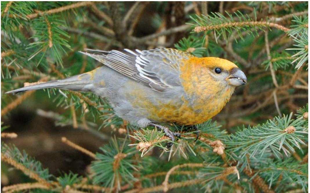
166 Pine Grosbeak / Haakbek Pinicola enucleator , first-year male, North Collafirth, Mainland, Shetland, Scotland, 2 February 2013 (Rebecca Nason)