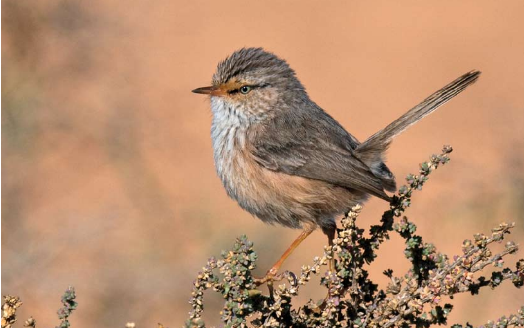
132-133 Streaked Scrub Warbler / Maquiszanger Scotocerca inquieta , Asrir, Goulimine, Lower Draa, Morocco, 21 January 2012 (Arnaud B van den Berg)