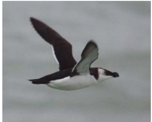
105-106 Kortbekzeekoet / Thick-billed Murre Uria lomvia lomvia , Spitsbergen, 7 september 2007 (Roy de Haas/Agami.nl) 107 Alk / Razorbill Alca torda , Noordzee ten westen van Den Haag, Zuid-Holland, 24 januari 2013 (Steve Geelhoed) 108 Alk / Razorbill Alca torda , Noordzee ten westen van Castricum, Noord-Holland, 10 januari 2012 (Steve Geelhoed)

den geruid zullen vogels met een mix van donkere en lichte veren op de keel dat in de regel ook op de oorstreek vertonen. Maar zijn er misschien uitzonderingsgevallen? Enkele auteurs doen een harde uitspraak dat zulke uitzonderingen niet bekend zijn (van den Berg 1980, McGeehan 1991ab, Sibley 2000). Van Duivendijk (2010) meldt dat ruiende Alk en Zeekoet in de herfst een donkere oorstreek en achterkant van de zijkop kunnen tonen in combinatie met een lichte keel. Hiermee wordt bedoeld dat, onder suboptimale omstandigheden, de kleine hoeveelheid wit op de oorstreek en op de zijkop van ruiende vogels gemakkelijk gemist kan worden (Nils van Duivendijk in litt). Yadon (1970) noemt een Pacifische Zeekoet U a californica/inornata met een op Kortbekzeekoet gelijkend koppatroon maar vermeldt specifiek een ge-