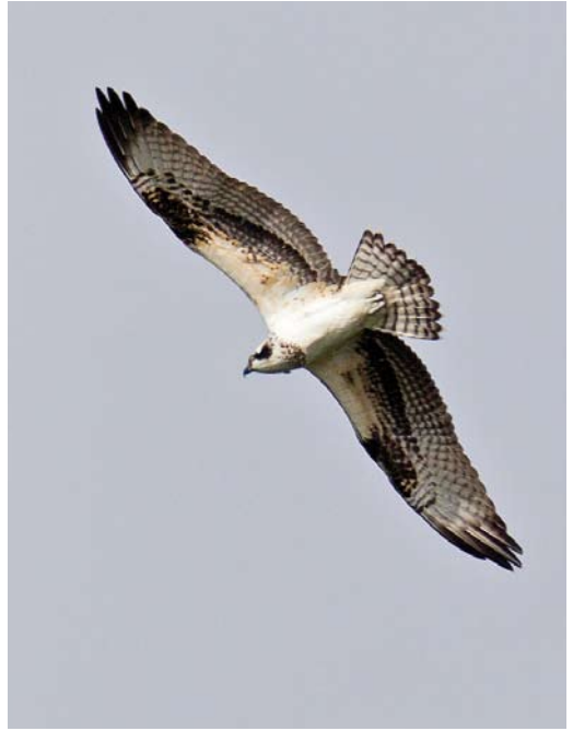
100 American Osprey / Amerikaanse Visarend Pandion haliaetus carolinensis , first-year male, Hafnarfjörður, Iceland, 22 September 2008 ( Dagur Brynjólfsson ) 101 American Osprey / Amerikaanse Visarend Pandion haliaetus carolinensis , first-year female, Flores, Azores, 20 October 2011 ( Jan Kåre Ness ) 102 American Osprey / Amerikaanse Visarend Pandion haliaetus carolinensis , first-year female, Flores, Azores, 22 October 2011 ( Mika Bruun )