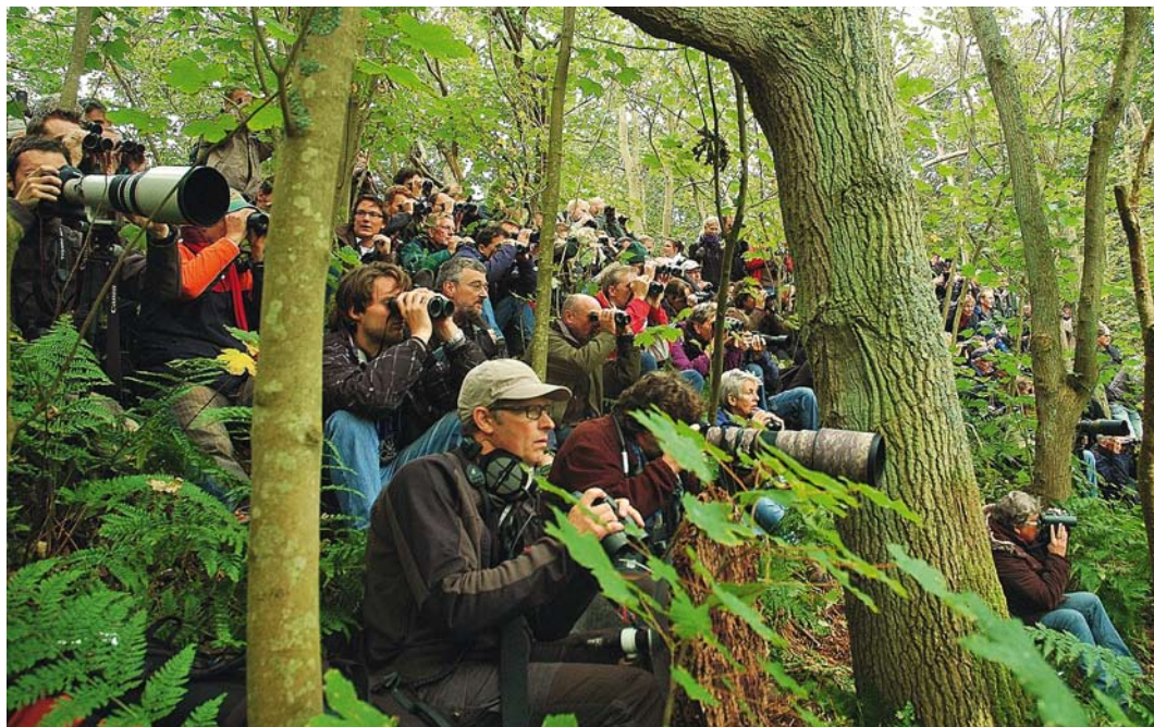
143 Vogelaars bij Noordse Waterlijster Parkesia noveboracensis , Oude Eendenkooi, Vlieland, Friesland, 19 september 2010

STAART Bovenstaart olijfgroen tot olijfbroen als bovendelen en vleugel.