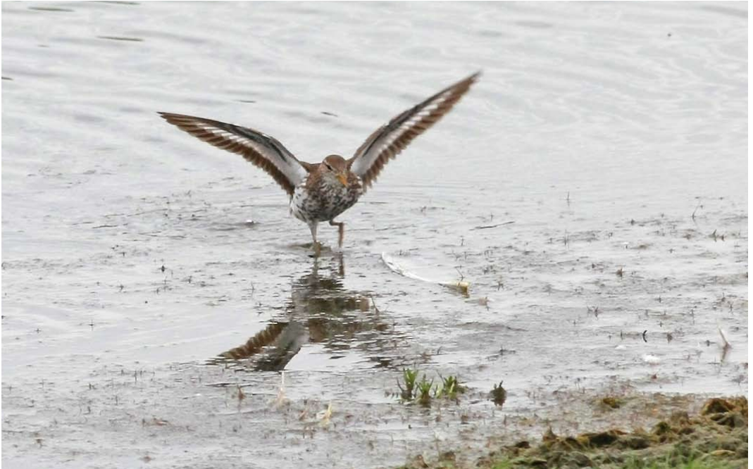
393-394 Amerikaanse Oeverloper / Spotted Sandpiper Actitis macularia , adult zomerkleed, Hogerwaardpolder, Zeeland, 31 juli 2011 ( Jaco Walhout )