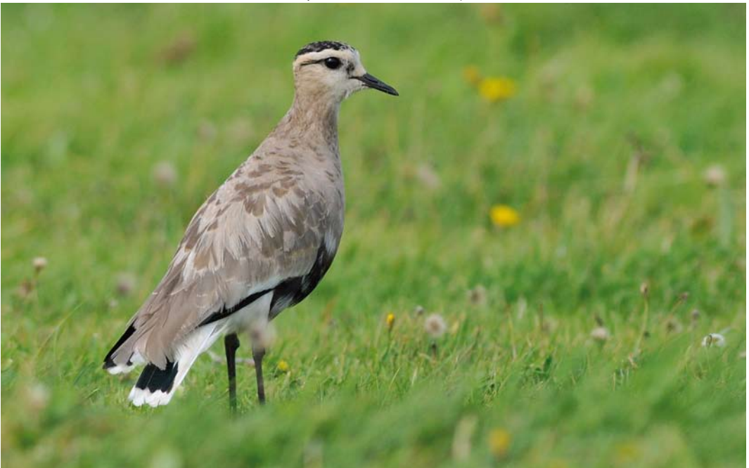
427 Sociable Lapwing / Steppekievit Vanellus gregarius , adult, Texel, Noord-Holland, Netherlands, 20 September 2011