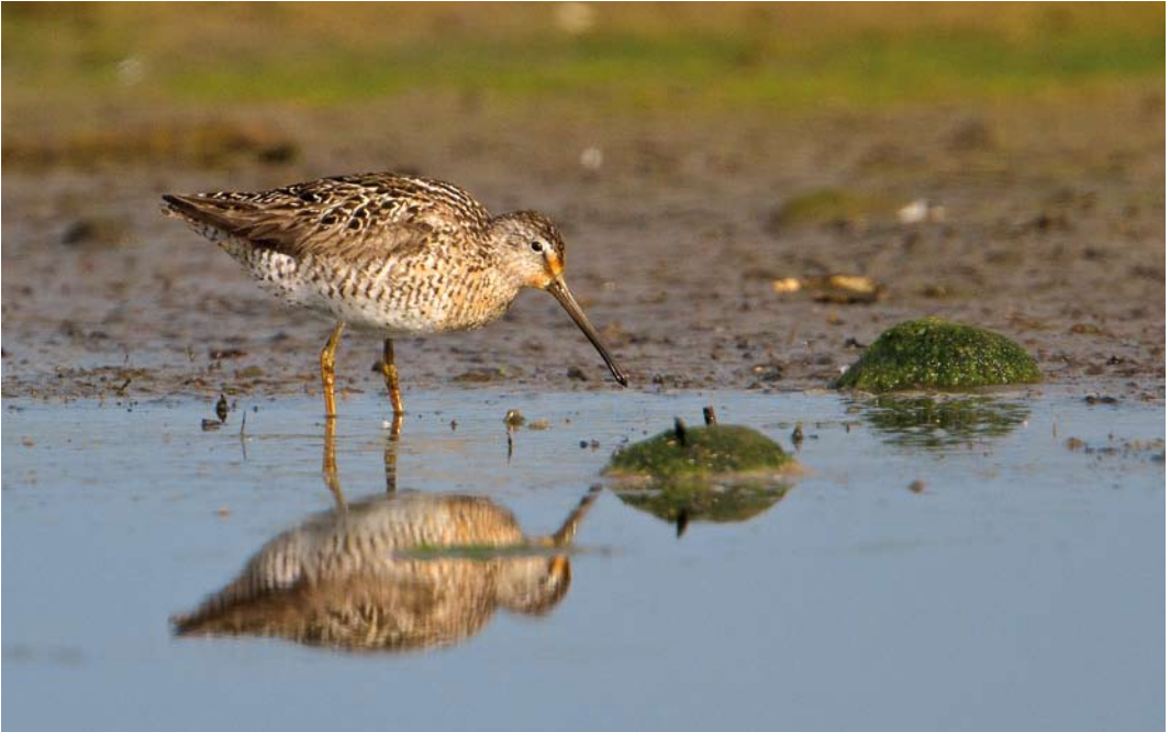
426 Short-billed Dowitcher / Kleine Grijze Snip Limnodromus griseus , Njarðvík, Iceland, 19 July 2011