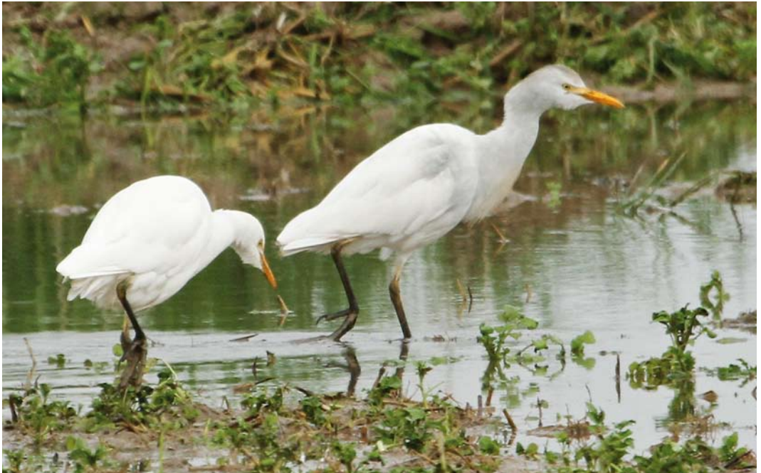
403 Cattle Egrets / Koereigers Bubulcus ibis , Albufera de Valencia, Valencia, Spain, 1 January 2011. Aberrantly coloured individual on right.

Adult winter Indian Pond Heron A grayii and Chinese Pond Heron A bacchus that might present