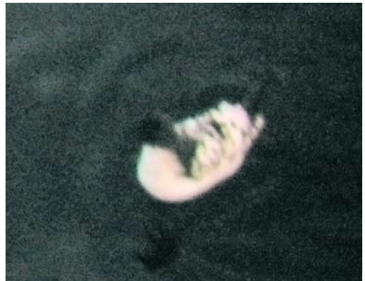
259 Smithsonian Gull / Amerikaanse Zilvermeeuw Larus smithsonianus , first-year, Sandgerði, Reykjanes Peninsula, Iceland, 2 April 2010 ( Peter Adriaens ) 260 Bonelli's Eagle / Havikarend Aquila fasciata , Skagen, Nordjylland, Denmark, 7 April 2010 ( Jørgen Kabel ) 261 Smithsonian Gull / Amerikaanse Zilvermeeuw Larus smithsonianus , second-winter, Praia da Vitoria, Terceira, Azores, 8 April 2010 ( Richard Bonser ) 262 Cape Gull / Afrikaanse Kelpmeeuw Larus dominicanus vetula (background), adult, Oued Souss, Agadir, Morocco, 12 April 2010 ( Arnoud B van den Berg/The Sound Approach ) 263 Great Blue Heron / Amerikaanse Blauwe Reiger Ardea herodias , Praia da Vitoria, Terceira, Azores, 9 April 2010 ( Richard Bonser ) 264 Cape Petrel / Kaapse Stormvogel Daption capense , Åsgard B platform, Norwegian Sea, Norway, 5 May 2010 ( Kjell Koteng )