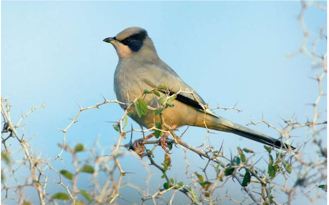
235 Hypocolius / Zijdestaart Hypocolius ampelinus , Mond protected area, Bushehr, Iran, 23 January 2009 ( Bas van den Boogaard ) 236 Iraq Babbler / Iraakse Babbelaar Turdoides altirostris , Horeh Bamdej, Khuzestan, Iran, 17 January 2009 ( Edward Verduyze ) 237 Sind Pied Woodpecker / Tamariskspecht Dendrocopos assimilis , Chikalar, Hormuzgan, Iran, 17 January 2009 ( Mark Zekhuis )