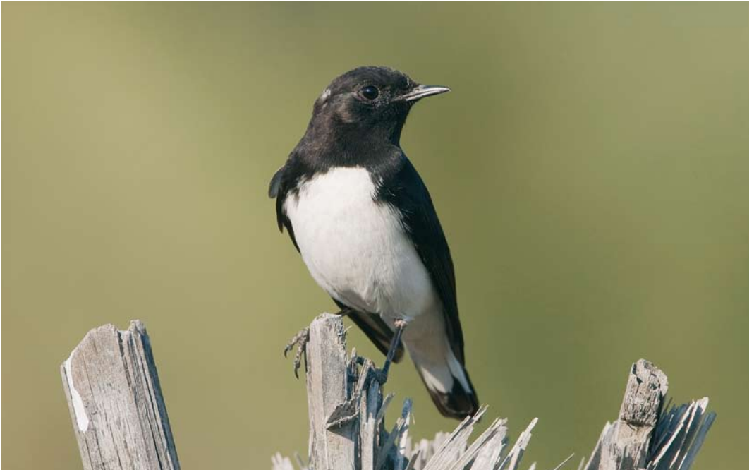
242 Variable Wheatear / Picatatapuit Oenanthe picata , between Bandar Abbas and Minab, Hormuzgan, Iran, 26 January 2009