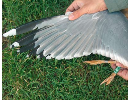
211 Herring Gulls / Zilvermeeuwen Larus argentatus , male (left) and female, Włocławek reservoir, central Poland, April 2008 (Grzegorz Neubauer). Note deep yellow of bill and legs of the female, giving strong michahellis -like impression. This individual was identified by pure white tip to p10, very small amount of black between the tongue and white tip, and a large white mirror on p9 – such a combination is extremely unlikely to occur in michahellis . 212 Herring Gull / Zilvermeeuw Larus argentatus , Włocławek reservoir, central Poland, May 2007 (Magdalena Zagalska-Neubauer). Wing-tip of yellow-legged female. Note large amount of black on outer two primaries (p9-10) but (in this case) just small black spots on both webs of p5.

are outside of their regular range, they are faced with a lack of conspecific partners and mate with heterospecifics, or engage in homosexual relationships. They pair up with cachinnans , argentatus or hybrids between these two that make up the remaining part of the large gull population here (apart from a few rare, breeding Lesser Black-backed Gulls). Similarly, a homosexual pair recorded in Tarnów in 2000 (two michahellis females trapped at one nest) and in Jankowice in 2004 (homosexual heterospecific pair of female michahellis ringed as a chick in Italy paired with a female cachinnans ) fit the lack-of-conspecific-partners hypothesis (Betleja et al 2007).