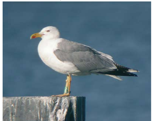
218 Yellow-legged Gull / Geelpootmeeuw Larus michahellis , adult male, Jankowice, southern Poland, July 2006 (Damian Wiehle). This bird was paired with a female Caspian Gull L. cachinnans .

Identification of michahellis in central Europe seems far more difficult than in the west due to a relatively larger proportion of hybrids compared to the 'real thing'. Its separation from yellow-legged argentatus is fairly easy when based on measurements but when using a near-diagnostic combination of the length of black markings on p7 and p8, a few individuals overlap and are better left unidentified. Separation of michahellis from