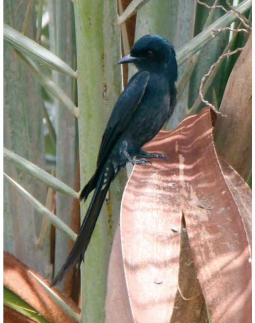
285 Pallid Swift / Vale Gierzwaluw Apus pallidus (left) and Alpine Swift / Alpengierzwaluw A. melba , Kessingland, Suffolk, England, 28 March 2010 286 Ashy Drongo / Grijze Drongo Dicrurus leucophaeus , Jahra farms, Kuwait, 10 April 2010 287 Semicollared Flycatcher / Balkanvliegenvanger Ficedula semitorquata , female, Cabrera, Balearic Islands, Spain, 27 April 2010