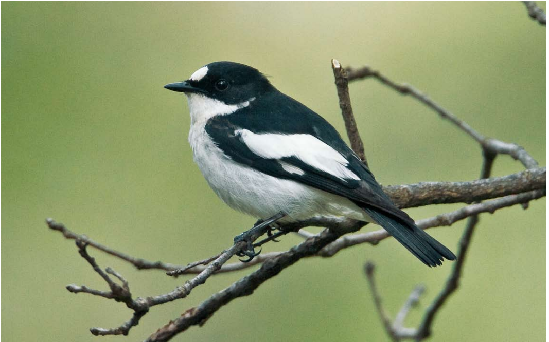
197 Atlas Flycatcher / Atlasvliegenvanger Ficedula speculigera , adult male, Ifrane, Morocco, 9 June 2009 ( Rafael Armada/rafaelarmada.com ). Note almost no white patch on rump, and extensive amount of white on tertials. 198 Atlas Flycatcher / Atlasvliegenvanger Ficedula speculigera , first-summer male, Ifrane, Morocco, 9 June 2009 ( Rafael Armada/rafaelarmada.com ). Brown primaries and primary coverts allow to age this bird easily. White in outer tail-feathers apparently absent, although this is not always easy to check without examination in the hand.