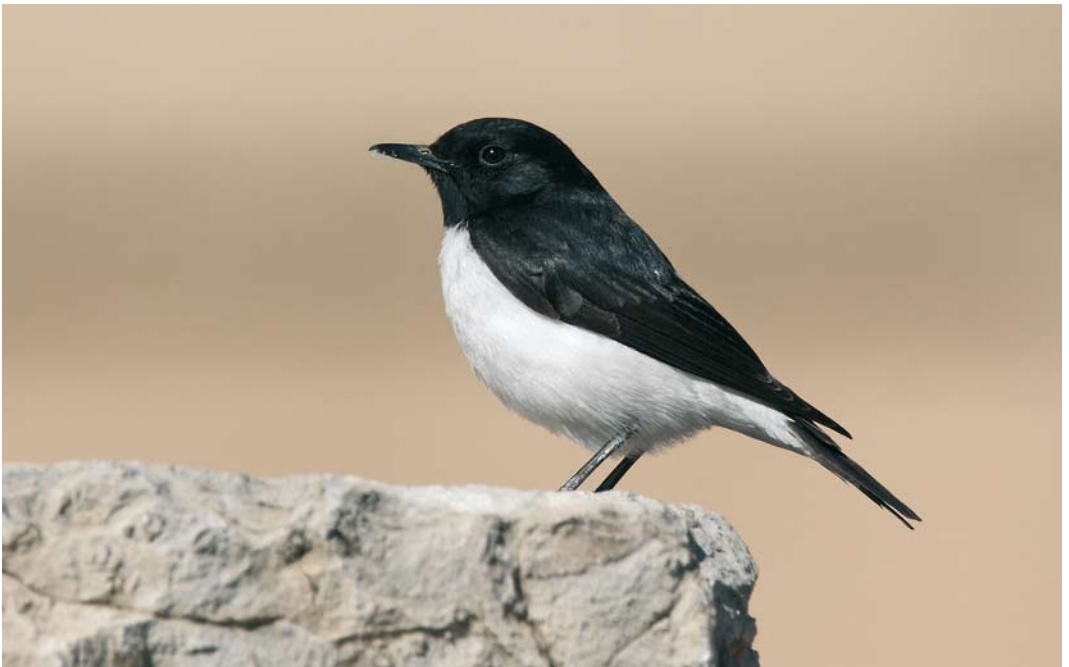
243 Hume's Wheatear / Humes Tapuit Oenanthe albonigra , Persepolis, Fars, Iran, 9 January 2009 (Edwin Winkel)