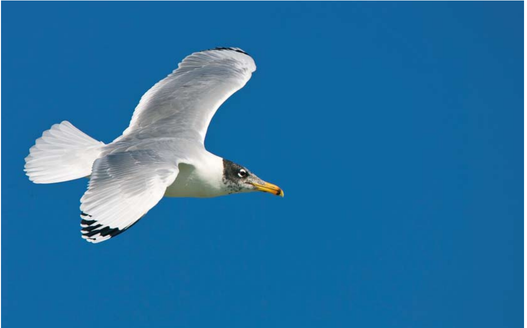
222 Pallas's Gull / Reuzenzwartkopmeeuw Larus ichthyaetus , Helleh delta, Bushehr, Iran, 16 January 2009 (Bas van den Boogaard)