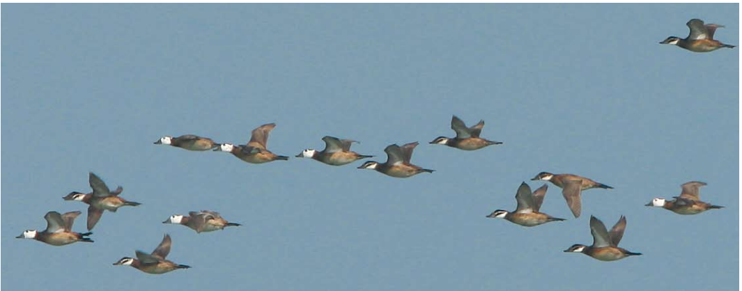
230 Amur Falcon / Amoerroodpootvalk Falco amurensis , first-winter, 15 km east of Chabahar Sistan Baluchestan, Iran, 24 January 2009 (Maarten Pieter Lantsheer) 231 Eastern Rock Nuthatch / Grote Rotsklever Sitta tephronota tephronota , Alneh valley, Golestan, Iran, 22 January 2009 (Edwin Winkel) 232 Eurasian Eagle-Owl / Oehoe Bubo bubo , Gomishan, Golestan, Iran, 19 January 2009 (Edwin Winkel) 233 Black-throated Loon / Parelduiker Gavia arctica , Jask, Hormuzgan, Iran, 19 January 2009 (Mark Zekhuis) 234 White-headed Ducks / Witkopeenden Oxyura leucocephala , Gorgan bay, Mazandaran, Iran, 20 January 2009 (Mervyn Roos)