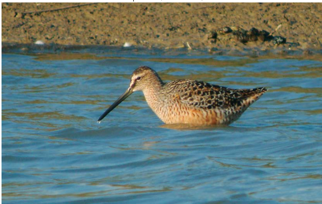
299 Grote Grijsze Snip / Long-billed Dowitcher Limnodromus scolopaceus , Lingewal, Huissen, Gelderland, 26 april 2010 ( Erik de Waard )