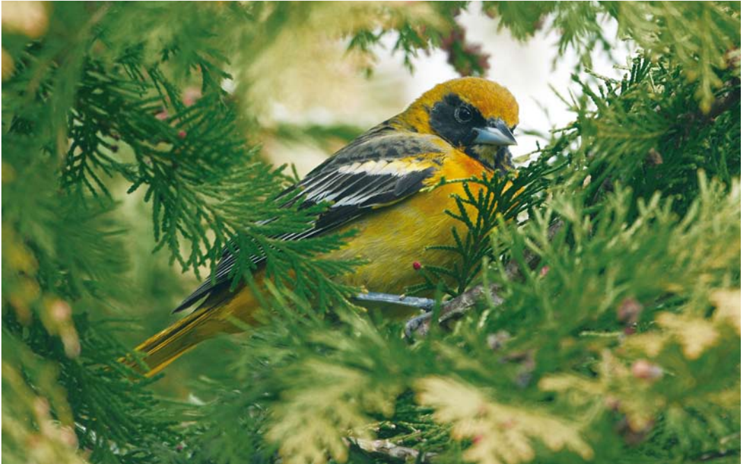
303 Baltimoretroepiaal / Baltimore Oriole Icterus galbula , eerste-winter mannetje ruiend naar eerste-zomer, Oudorp, Alkmaar, Noord-Holland, 11 april 2010