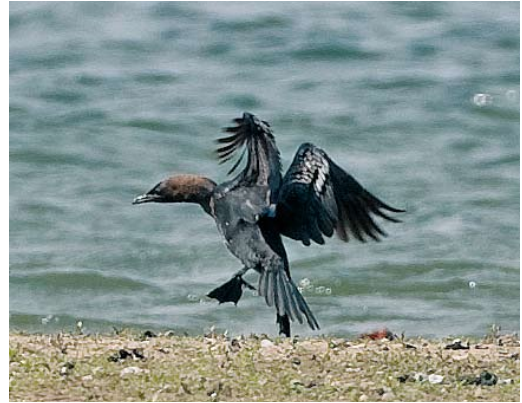
314 Dwergaalscholver / Pygmy Cormorant Phalacrocorax pygmeus , Ooijpolder, Gelderland, 16 mei 2010 (Toy Janssen)

Pas op vrijdag 14 mei werd de vogel weer gemeld toen hij om 09:40 in noordoostelijke richting over de