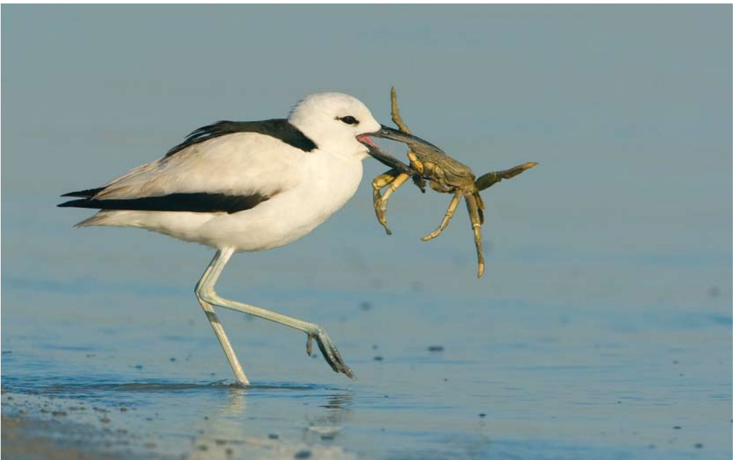
221 Crab Plover / Krabplevier Dromas ardeola , adult, Hara protected area, Hormuzgan, Iran, 17 January 2009