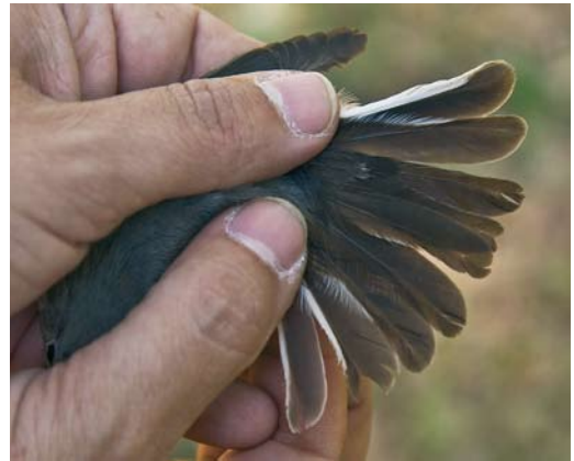
208 Atlas Flycatcher / Atlasliegenvanger Ficedula speculigera , female, Ifrane, Morocco, 9 June 2009 209-210 Atlas Flycatcher / Atlasliegenvanger Ficedula speculigera , adult female, Ifrane, Morocco, 9 June 2009

Shirihai (1994) did not provide any illustrations of this plumage, while there was only one good image in van den Berg & The Sound Approach (2006). Unfortunately, our limited sample comprised only two females showing the full suite of characters, since a third female had lost its tail.