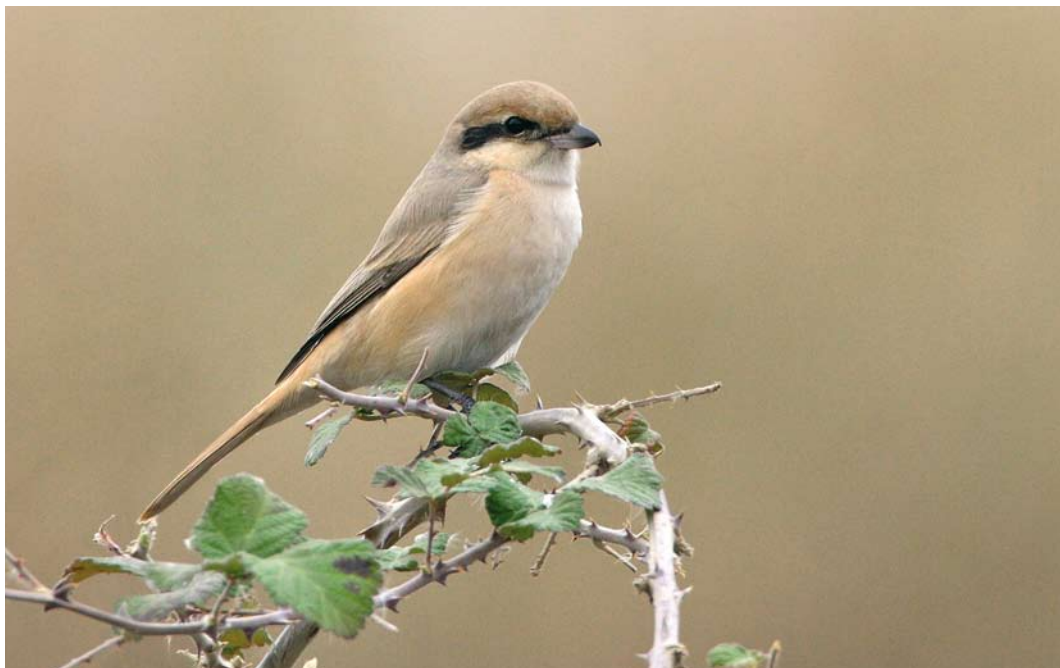
240 Chinese Shrike / Chinese Klauwier Lanius arenarius , Bibi Shirvan, Golestan, Iran, 19 January 2009 (Edwin Winkel)