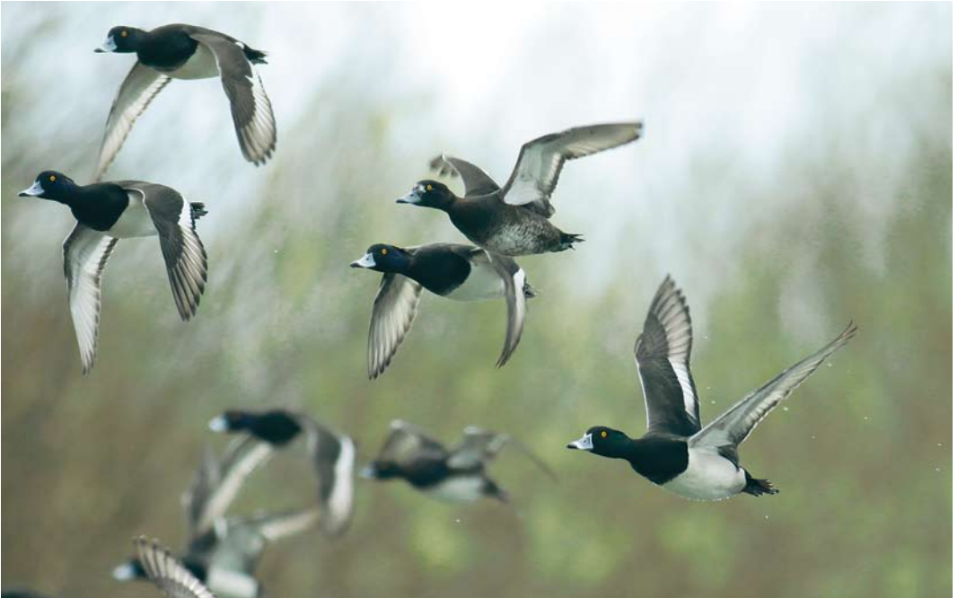
289 Hybride Ringsnaveleend x Kuifeend / hybrid Ring-necked x Tufted Duck Aythya collaris x fuligula , mannetje (rechts), met Kuifeenden / Tufted Ducks A fuligula , Dijkwater, Noord-Holland, 11 april 2010