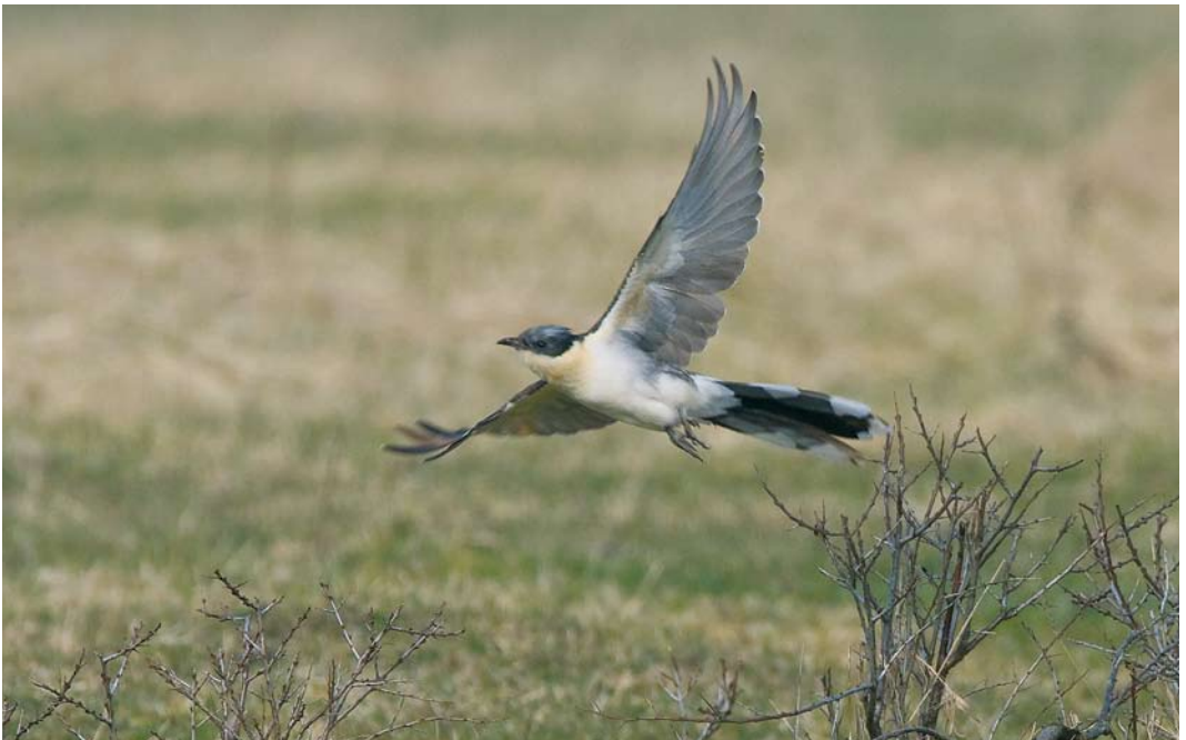
304 Kuifkoekoek / Great Spotted Cuckoo Clamator glandarius , Lentevreugd, Wassenaar, Zuid-Holland, 24 maart 2010 ( René van Rossum )