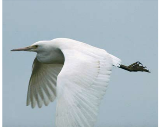
247 Hybride Koereiger x Kleine Zilverreiger / hybrid Little x Cattle Egret Bubulcus ibis x Egretta garzetta , Braakman, Zeeuws-Vlaanderen, Zeeland, 3 november 2009

Hybriden Koereiger x Kleine Zilverreiger zijn zeer zeldzaam en voor zover bekend zijn er geen eerdere gevallen in het wild vastgesteld. Wel zijn en-