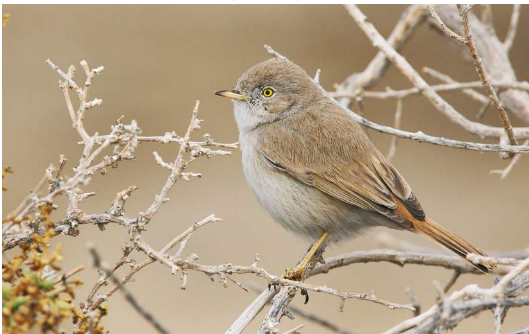
241 Asian Desert Warbler / Woestijngrasmus Sylvia nana , Dasht-e-Konar, Fars, Iran, 12 January 2009