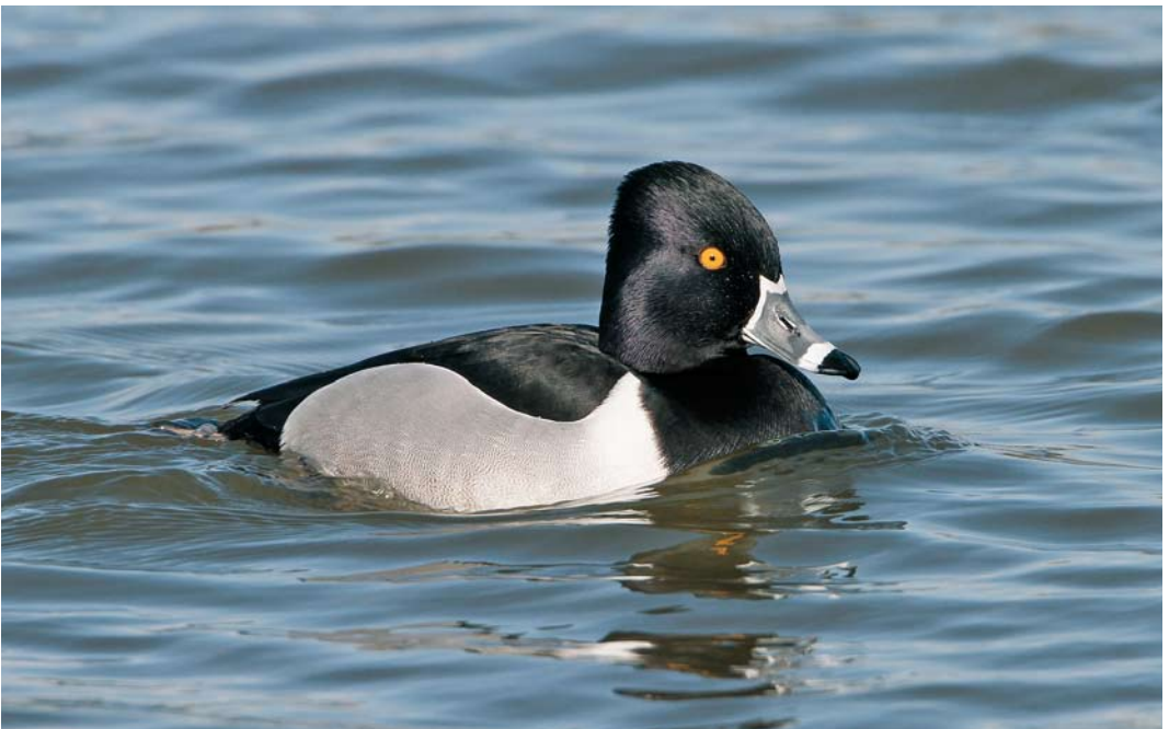
290 Ringsnaveleend / Ring-necked Aythya collaris , mannetje, Lepelaarsplassen, Flevoland, 10 april 2010 (Martin van der Schalk)