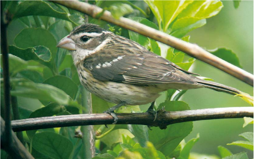
267 Rose-breasted Grosbeak / Roodborstkardinaal Pheucticus ludovicianus , first-year, Fajãzinha, Flores, Azores, 10 May 2010 268 Red-throated Pipit / Roodkeelpieper Anthus cervinus , Hologne-sur-Geer, Liège, Belgium, 7 May 2010 269 Spanish Sparrow / Spaanse Mus Passer hispaniolensis , male, Capestang, Hérault, France, 14 May 2010