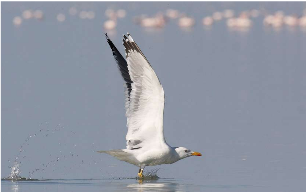
223 Baraba Gull / Barabameeuw Larus (cachinnans) barabensis , Gomishan, Golestan, Iran, 26 January 2009