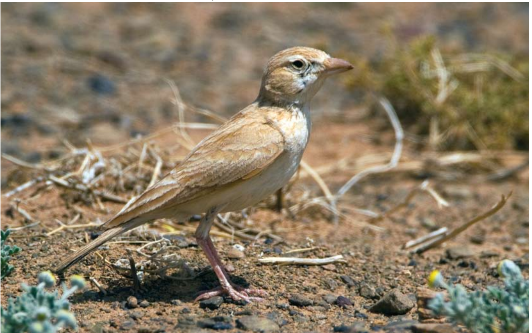
266 African Dunn's Lark / Afrikaanse Dunns Leeuwerik Eremalauda dumni dumni , Merzouga, Tafilalt, Morocco, 11 April 2010