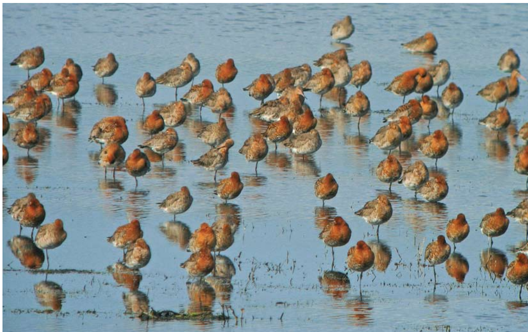
298 IJslandse Grutto's / Icelandic Black-tailed Godwits Limosa limosa islandica , Landje van Geijssel, Ouderkerk aan de Amstel, Noord-Holland, 3 april 2010