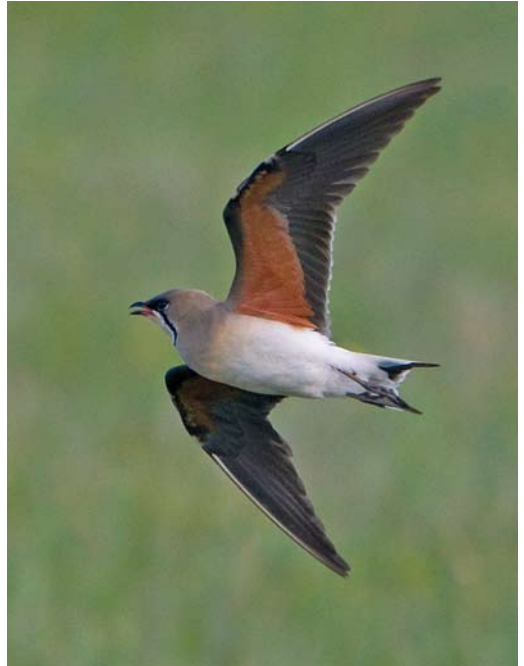
254-255 Oriental Pratincole / Oosterse Vorkstaartplevier Glareola maldivarum , Frampton Marsh, Lincolnshire, England, 11 May 2010