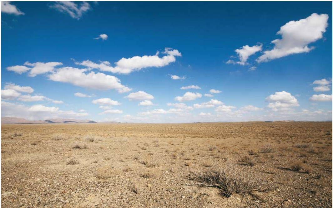
244 Habitat of Pleske's Ground-jay Podoces pleskei and Onager Equus onager , Bahram-e Gur, Fars, Iran, 13 January 2009

Carl Derks, Erik Foekens, Leila Joolaei and Amir Pasha Kankash counted Fars, one of the largest