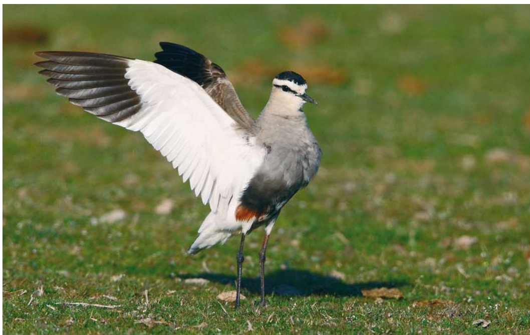
258 Sociable Lapwing / Steppekievit Vanellus gregarius , Valladolid, Castilla y León, Spain, 10 April 2010