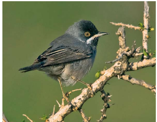
278 Iberian Pied Flycatcher / Iberische Bonte Vliegenvanger Ficedula hypoleuca iberiae , Touroug, Morocco, 10 April 2010 ( Arnoud B van den Berg/The Sound Approach ) 279 African Desert Warbler / Afrikaanse Woestijngasmus Sylvia deserti , Migra Ferha, Malta, 22 April 2010 ( Raymond Galea ) 280 Rüppell's Warbler / Rüppells Grasmus Sylvia rueppelli , Cabrera, Balearic Islands, Spain, 21 April 2010 ( David Cuenca ) 281 Rüppell's Warbler / Rüppells Grasmus Sylvia rueppelli , Linosa, Sicily, Italy, 31 March 2010 ( Giuseppe Rinaldi )

first for Iceland since 2004. In Ireland, the Forster's Tern S forsteri at Nimmo's Pier, Galway, from 11 November 2009 stayed until at least 23 April; the one in Wexford returned at Tacumshin for another summer from 8 May.