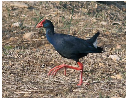
270 Caspian Plover / Kaspische Plevier Charadrius asiaticus , El Gouna, Egypt, 4 April 2010 ( Mattias Ullman ) 271 Sociable Lapwing / Steppiekievit Vanellus gregarius , Wachtebeke, Oost-Vlaanderen, Belgium, 11 April 2010 ( Vincent Legrand ) 272 Wilson's Snipe / Amerikaanse Watersnip Gallinago delicata , Laukaa, Länsi-Suomen lääni, Finland, 23 April 2010 ( Pasi Pirinen ) 273 Western Swampphen / Purperkoet Porphyrio porphyrio , Simar, Malta, 10 April 2010 ( Raymond Galea )

March and early April at Eilat and Yotvata. A male roosted for 20 min at the El Gouna golf course, Egypt, on 4 April. Sociable Lapwings Vanellus gregarius occurred, eg, at Toledo, Castilla-La Mancha, Spain, on 16 March; at Juscorps, Deux-Sèvres, France, on 20 March; near Valladolid, Castilla y León, Spain, from 21 March to 17 April; in Oost-Vlaanderen, Belgium, on 4-11 April; in Baden-Württemberg, Germany, on 8 April; and at Lena, Uppland, Sweden, from 11 May. The first Wilson's Snipe Gallinago delicata for Finland was a displaying male near Jyväskylä from 22 April; reportedly, it was present at the same site in the summers of 2008 and 2009.