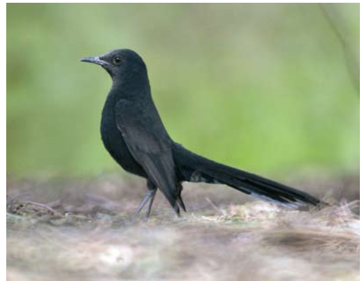
274 Pied Crow / Schildraaf Corvus albus , El Gouna, Egypt, 11 April 2010 275 Balearic Woodchat Shrike / Balearische Roodkopklauwier Lanius senator badius , west of El Kelaa, Morocco, 27 March 2010 276 Western Black-eared Wheatear / Westelijke Blonde Tapuit Oenanthe hispanica , Great Saltee Island, Wexford, Ireland, 15 May 2010 277 Black Scrub Robin / Zwarte Waaierstaart Cercothrichas podobe , Ofira Park, Eilat, Israel, 7 April 2010

were found in Vardø, Finnmark, Norway, on 10 May and at Sørvágur, Vágur, Faeroes, on 12 May (second for Faeroes this year). Laughing Gulls Larus atricilla occurred at Porthcawl, Glamorgan, Wales, on 13 March, at Quart de Poblet, València, Spain, on 6 April and at Oued Souss, Morocco, on 19 April (two). In Spain, an adult Franklin's Gull L. pipixcan stayed at Quart de Poblet dump, València, on 6-22 April. On 10 May, an adult Audouin's Gull L. audouinii was photographed when flying past over Grône, Valais, Switzerland. The third Yellow-legged Gull L. michahellis for Iceland photographed on Heimaey during 1-7 May was identified as an Atlantic Yellow-legged Gull L. m. atlantis . A good candidate Heuglin's Gull L. heuglini for Norway was a third-calendar-year photographed at Øra, Frederikstad, Østfold, on 24 April ( www.talk.gull-research.org/viewtopic.php?f=13&t=276&p=1099#p1099 ). In the Azores, a second-winter Smithsonian Gull L. smithsoni-