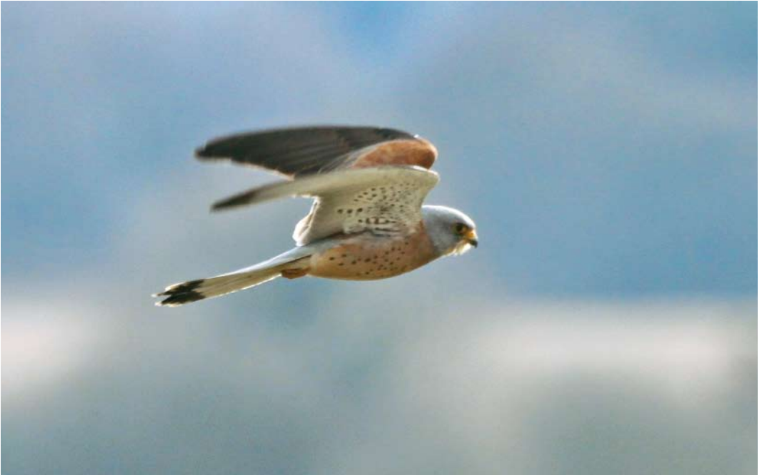
251 Lesser Kestrel / Kleine Torenvalk Falco naumanni , male, Minsmere, Suffolk, England, 28 March 2010 252 Dalmatian Pelican / Kroeskoppelikaan Pelecanus crispus , Klingnauer Stausee, Aargau, Switzerland, 13 April 2010 253 Bonaparte's Gull / Kleine Kokmeeuw Chroicocephalus philadelphia , Höfn, Iceland, 26 March 2010