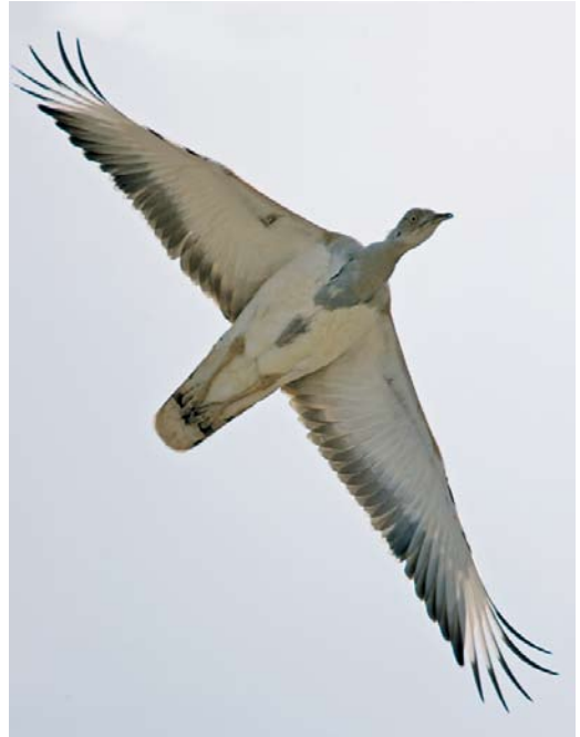
227 Masked Booby / Maskergent Sula dactylatra , Khoor-e Chal, Hormuzgan, Iran, 15 January 2009 (Mark Zekhuis) 228 Macqueen's Bustard / Oostelijke Kraagtrap Chlamydotis macqueenii , Mond protected area, Bushehr, Iran, 20 January 2009 (Bas van den Boogaard) 229 Crested Honey Buzzard / Aziatische Wespendiff Pernis ptilorhyncus , adult male, Bandzark, Hormuzgan, Iran, 24 January 2009 (Arie Ouwerkerk)