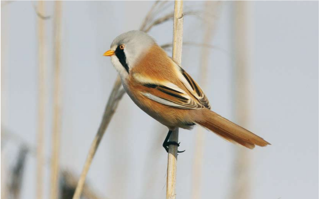
238 Bearded Reedling / Baardman Panurus biarmicus russicus , Gomishan, Golestan, Iran, 24 January 2009