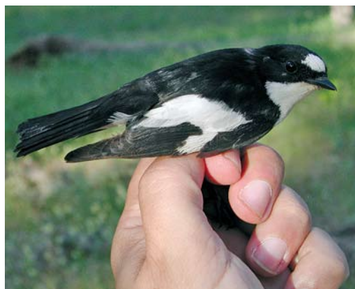
201 Atlas Flycatcher / Atlasvliegenvanger Ficedula speculigera , male, Ifrane, Morocco, 9 June 2009 (José Luis Copete). This could be a first-summer male (p2 is retained) with entirely black tail or an adult with aberrant post-breeding moult. Also note quite extensive white patch on rump. 202 Atlas Flycatcher / Atlasvliegenvanger Ficedula speculigera , adult male, Ifrane, Morocco, 9 June 2009 (José Luis Copete). Other bird than in plate 199. Note rump and entirely black tail. This bird with largest amount of white on rump, with birds in other plates showing common pattern. 203-204 Atlas Flycatcher / Atlasvliegenvanger Ficedula speculigera , adult male, Ifrane, Morocco, 9 June 2009 (José Luis Copete). Same bird as in plate 200. Rump patch showing common pattern.

pictured in that black-and-white plate, and another adult male (plate 201) with a quite extensive white patch. However, we feel that this is not the norm for speculigera , since the rest of the examined males were all showing very small or almost non-existent white rump patches. This was confirmed by close observations of 30+ individuals in the field.