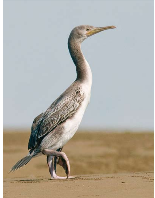
224 Goliath Heron / Reuzenreiger Ardea goliath , Koor Shahreno, Hormuzgan, Iran, 18 January 2009 (Mark Zekhuis) 225 Socotra Cormorant / Arabische Aalscholver Phalacrocorax nigrogularis , first-year, Mubarak, Hormuzgan, Iran, 23 January 2009 (Mark Zekhuis) 226 Siberian Cranes / Siberische Witte Kraanvogels Grus leucogeranus , Fereydon Kenar Damgah, Mazandaran, Iran, 25 January 2009 (Mervyn Roos)