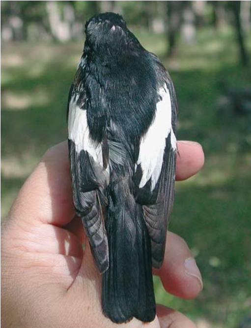
199 Atlas Flycatcher / Atlasliegenvanger Ficedula speculigera , adult male, Ifrane, Morocco, 9 June 2009 (José Luis Copete). Note rump and entirely black tail.