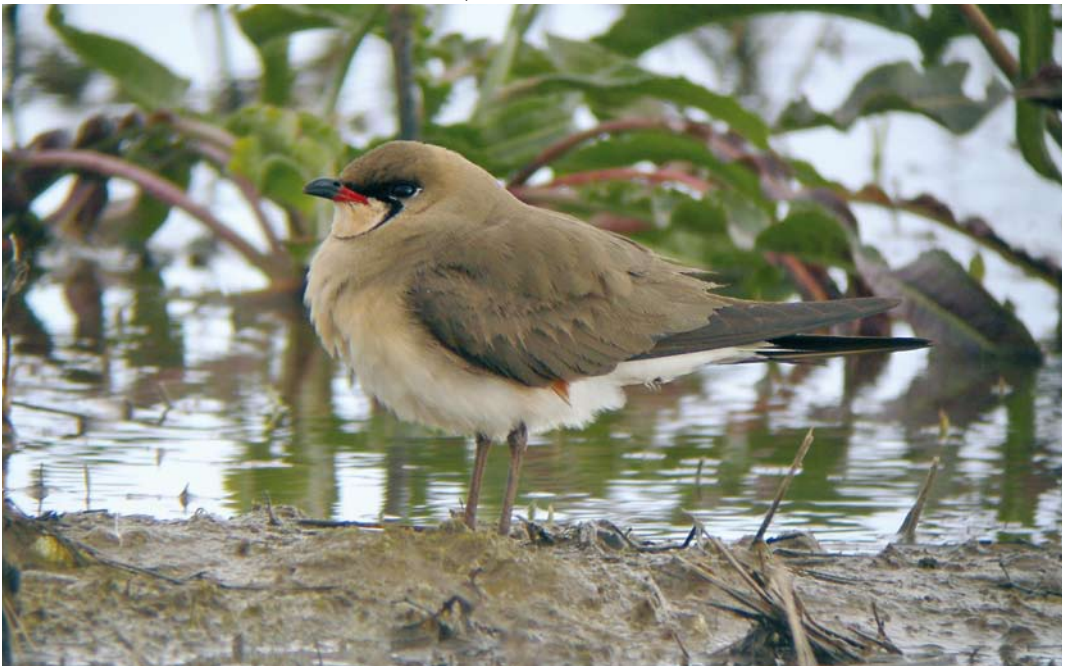
256 Oriental Pratincole / Oosterse Vorkstaartplevier Glareola maldivarum , Frampton Marsh, Lincolnshire, England, 12 May 2010