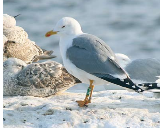
216 Hybrid Yellow-legged x Caspian Gull / hybride Geelpootmeeuw x Pontische Meeuw Larus michahellis x cachinnans , Goczałkowiec reservoir, southern Poland, 10 October 2005. Ringed as chick in the nest of mixed pair of male michahellis and female cachinnans at Jankowice in May 2005 (see table 1). 217 Yellow-legged Gull / Geelpootmeeuw Larus michahellis , Vistula river, Kraków, southern Poland, 21 February 2009. Female ringed as chick on 25 May 1997 at Basson, Italy (44°58'N, 12°32'E), and part of breeding homosexual pair with female Caspian Gull L. cachinnans at Jankowice in 2004 (see table 1). Photograph taken at winter gull roost 36 km east of Jankowice. In March-May 2009, same bird was found in breeding colony in Palczowice near Zator, where it raised three young with male cachinnans .

particularly, a hybrid. In central and eastern Europe, only michahellis that are typical in all respects (ie, in primary pattern, colour of bare parts – including iris, general size and shape) may be identifiable.