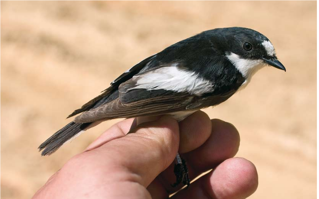
205-206 Iberian Pied Flycatcher / Iberische Vliegenvanger Ficedula hypoleuca iberiae , first-summer male, La Hiruela, Madrid, Spain, 15 May 2007 (David Bigas). Two different birds, showing some white in tail. Also note amount of white in tertials, similar to that shown by some adult male Atlas Flycatchers F. speculigera .