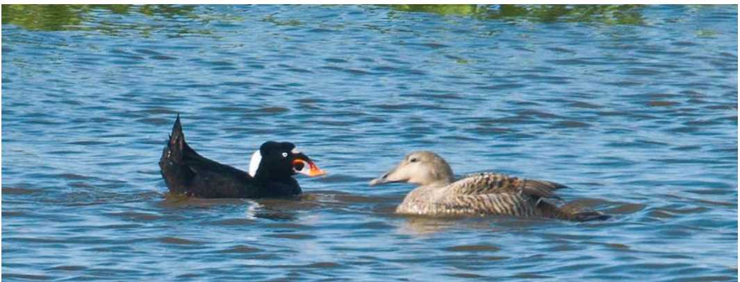
295 Kleine Topper / Lesser Scaup Aythya affinis , mannetje, Oude Zeug, Noord-Holland, 1 april 2010 (Fred Visscher) 296 Griel / Stone-curlew Burhinus oedicnemus , Lentevreugd, Wassenaar, Zuid-Holland, 23 maart 2010 (Jurrien van Deijk) 297 Brilzee-eend / Surf Scoter Melanitta perspicillata , adult mannetje, met Eider / Common Eider Somateria mollissima , vrouwtje, Horsmeertjes, Texel, Noord-Holland, 9 mei 2010 (Vincent Legrand)

het huis van een vogelaar in Pannerden, Gelderland; op 13 april bij het Zuidlaardermeer, Groningen (adult mannetje); op 24 april langs de Vulkanen bij Den Haag, Zuid-Holland; op 25 april langs Kamperhoek en op Rottumerplaat, Groningen; en op 25 en 28 april langs Noordkaap bij Uithuizen, Groningen. Vanaf 25 april werden vier vroege overtrekkende Roodpootvalken Falco vespertinus gemeld, alle uit kustprovincies.