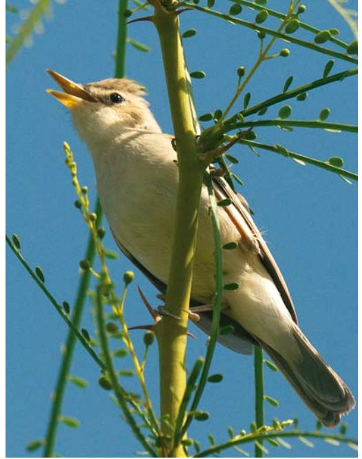
282 Baillon's Crake / Kleinst Waterhoen Porzana pusilla , Tassila, Oued Massa, Morocco, 13 April 2010 ( Arnoud B van den Berg/The Sound Approach ) 283 Saharan Olivaceous Warbler / Saharaanse Vale Spotvogel Iduna pallida reiseri , Quarzazate, Morocco, 11 April 2010 ( Arnoud B van den Berg/The Sound Approach ) 284 Iberian Chiffchaff / Iberische Tjiftjaf Phylloscopus ibericus , Forêt de Soignes, Brussel, Belgium, 25 April 2010 ( Axel Smets )