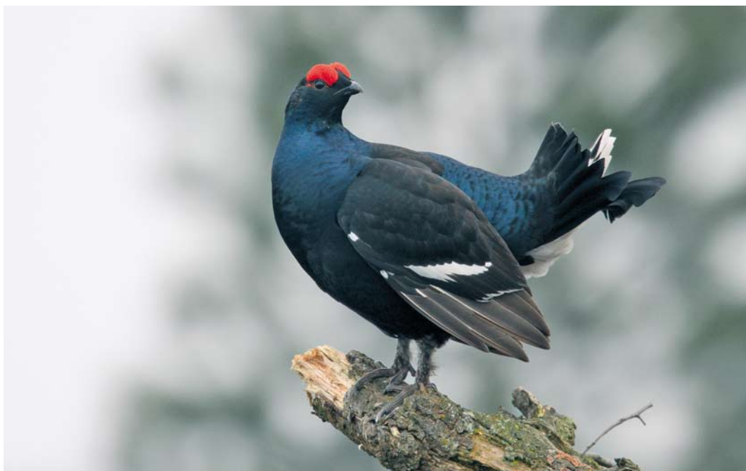
302 Korhoen / Black Grouse Tetrao tetrix , tweedejaars mannetje, Haarderberg, Overijssel, 9 april 2010