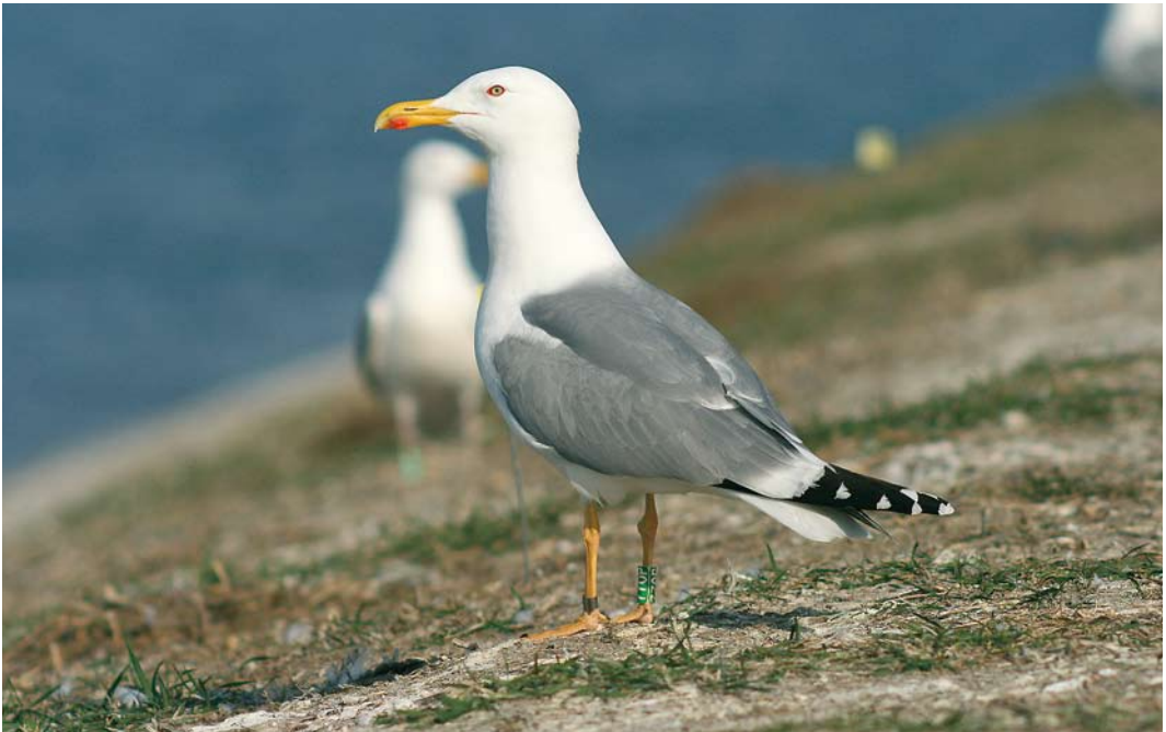
213-215 Hybrid Caspian x Herring Gull / hybride Pontische Meeuw x Zilvermeeuw Larus cachinnans x argentatus , fifth-calendar year, Włocławek reservoir, central Poland, April 2009. Offspring of male cachinnans and female yellow-legged argentatus , ringed as chick in the nest at Włocławek reservoir (central Poland) in May 2005 and found breeding in same colony in 2009. Note non-spotted iris, intense coloration of bare parts and large amount of black on wing-tip (including seven black-tipped primaries and patterns of both p9 and p10), creating appearance strongly resembling Yellow-legged Gull L. michahellis . Such hybrids are impossible to separate from pure michahellis based on phenotype alone.