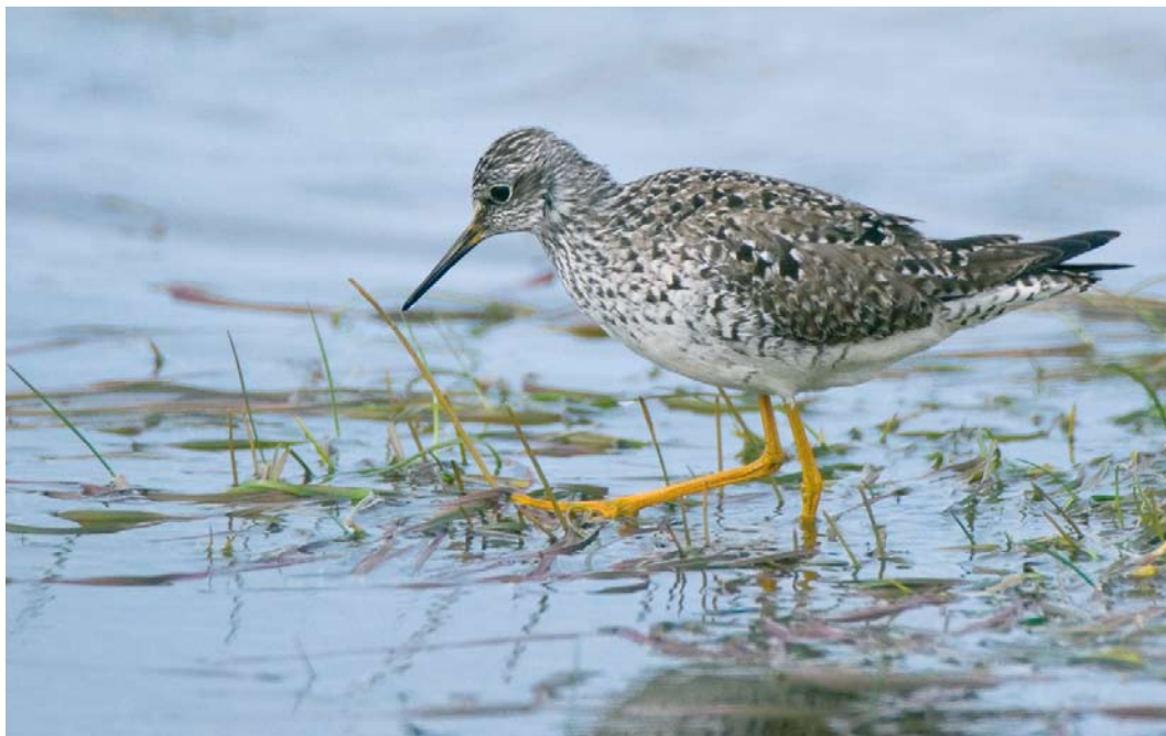
257 Lesser Yellowlegs / Kleine Geelpootruiter Tringa flavipes , Keflavík, Iceland, 18 May 2010 (Jeroen Reneerkens)