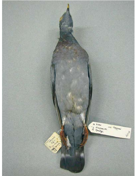
248-249 Yellow-eyed Dove / Oosterse Holenduif Columba eversmanni , adult (collected at Orenburg, European Russia, on 12 May 1881), Zoological Museum, St Petersburg, Russia, October 2009

WP) on 18 October 1998, supporting its vagrancy potential in the south-eastern part of the WP (Davygora 2000, AV Davygora in litt).