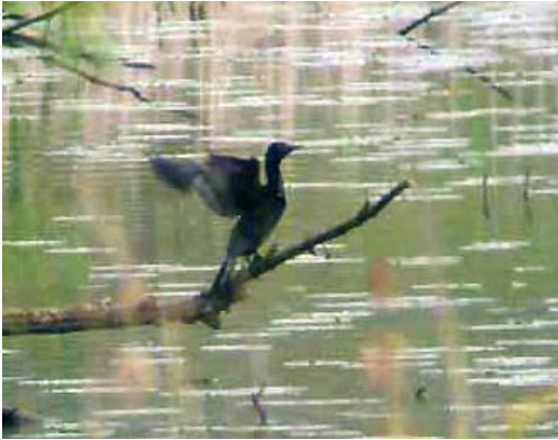
313 Dwergaalscholver / Pygmy Cormorant Phalacrocorax pygmeus , Ooijpolder, Gelderland, 9 mei 2010

Dwergaalscholver in Ooijpolder Op zondag 9 mei 2010 zag Peter Verbeek 's ochtends tijdens zijn 'rondje Millingerwaard Oost', Gelderland, op een van de kleiputten een hem onbekende vogel. Deze vloog op grote afstand op, draaide een rondje boven de plas en vloog verder. Het bleek een kleine aalscholver Phalacrocorax te zijn met een afwijkende kopvorm. PV had nog wat twijfels over de determinatie maar zag dat de vogel inviel op de Millingerhof, meteen achter Kekeerdom. Hij fietste daar naartoe. Eerst leek er niets te zien maar even later kwamen twee vogels recht om hem af vliegen: een Aalscholver P carbo en ... een Dwergaalscholver P pygmeus ! Laatstgenoemde was duidelijk kleiner en PV zag nu ook het typische kopprofiel met de korte snavel en het hoge voorhoofd waarmee de laatste twijfels konden worden uitgebannen.