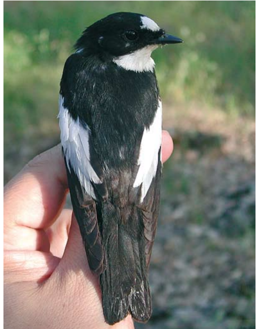
200 Atlas Flycatcher / Atlasliegenvanger Ficedula speculigera , adult male, Ifrane, Morocco, 9 June 2009. Same bird as in plate 203-204. Rump patch showing common pattern.

photography and supplementary experience in field identification. In this paper we present additional information on poorly described identification features for both summer plumage males and females.