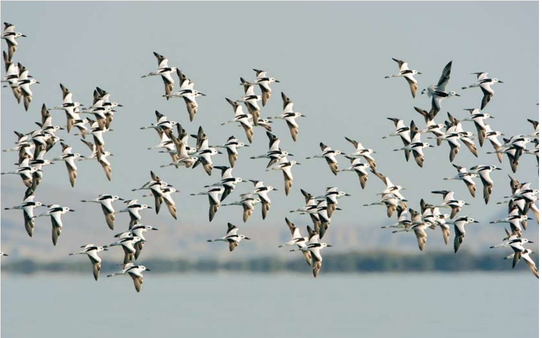
220 Crab Plovers / Krabplevieren Dromas ardeola , Hara protected area, Hormuzgan, Iran, 16 January 2009