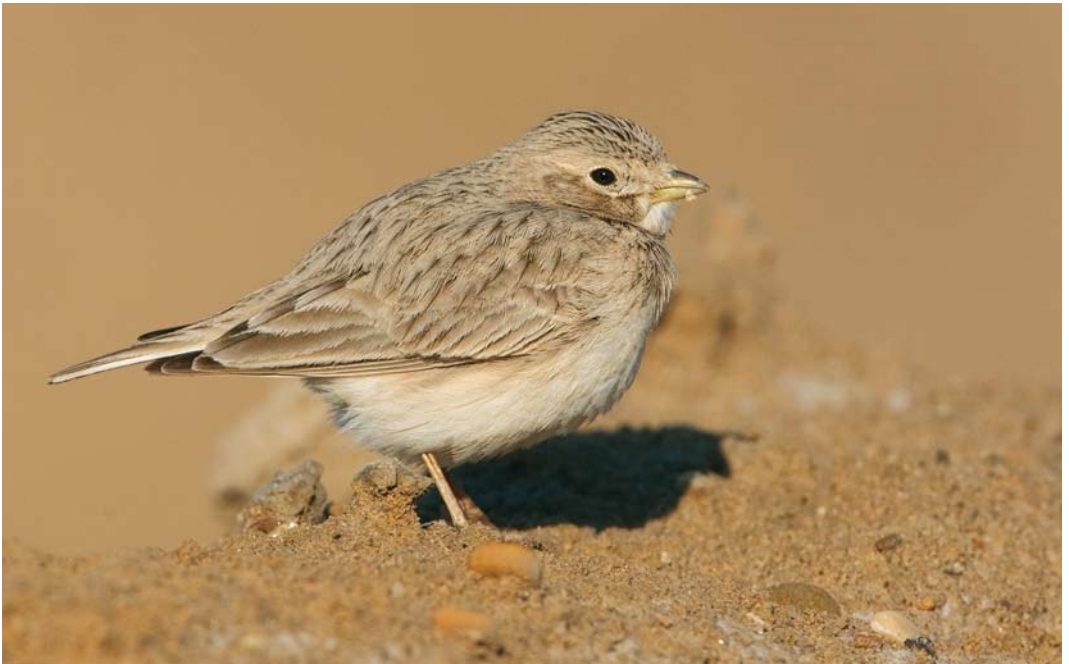
239 Indian Short-toed Lark / Indische Zandleeuwerik Calandrella raytal , Bander-e-Pol, Hormuzgan, 17 January 2009