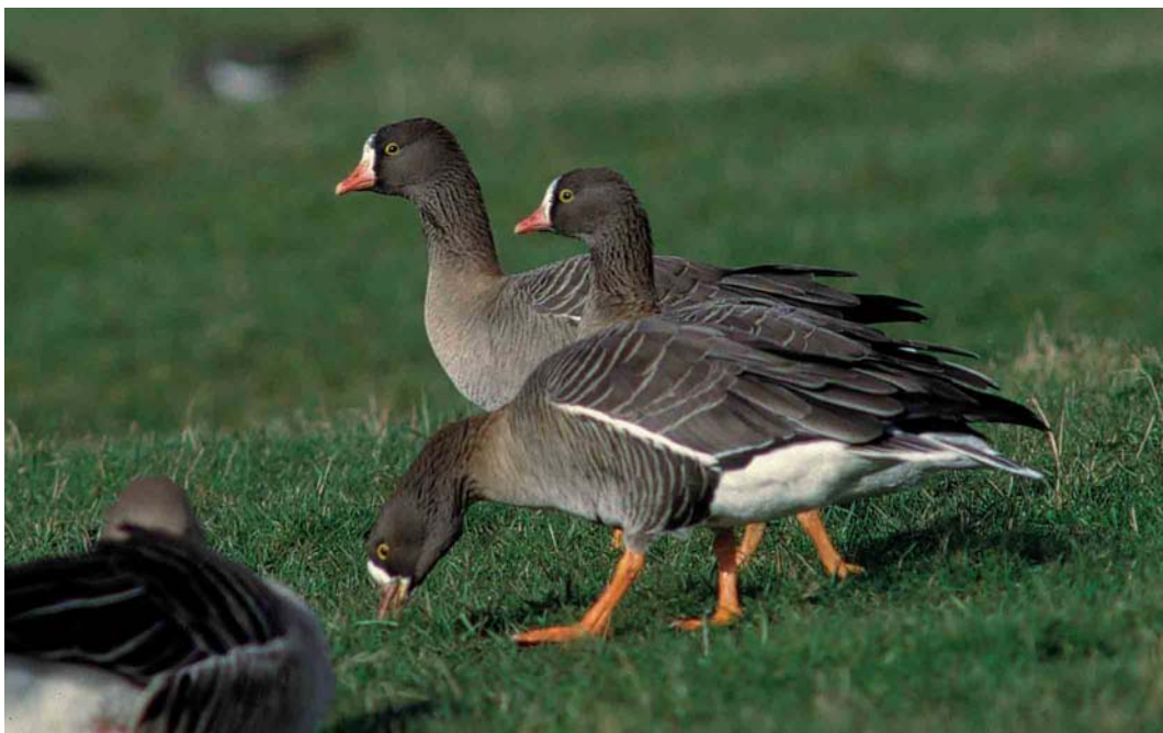
98 Dwergganzen / Lesser White-fronted Geese Anser erythropus , Camperduin, Noord-Holland, 20 februari 2002 (Cees Ooyevaar)