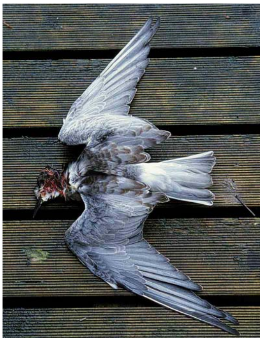
70 Witvleugelstern / White-winged Tern Chlidonias leucopterus , juveniel mannetje, ruiend naar eerste winterkleed (verzameld bij Den Oever, Noord-Holland, 27 december 2000), Arnhem, 13 januari 2001 (Harvey van Diek)

zou op 1 januari 2001 voor het laatst zijn gemeld; Dutch Birding 23: 109, 2001) maar ook zal het waarschijnlijk niet eerder zijn voorgekomen dat deze soort door een Ekster werd gedood (cf Birkhead 1991, Cramp & Perrins 1994). Birkhead (1991) vermeldt: 'I have seen magpies at dusk chasing and catching House Sparrows [ Passer domesticus ] which were roosting in ivy on buildings. Magpies occasionally attack larger prey. There are several records of them apparently killing half-grown and adult rabbits. In most cases the magpie's first action after the prey is dead is to remove its eyes'. Wij constateerden bij de gedode Witvleugelstern dat de ogen verdwenen waren. Behalve de zwaar gehavende kop waren er verder geen sporen van vraat. Cramp & Perrins (1994) vermelden als voedsel voor Ekster onder andere: '... eggs, young and adults of many bird species, particularly sparrows (Passeridae), finches (Fringillidae), thrushes (Turdidae), etc., but also including adult Water Rail Rallus aquaticus , [Common] Swift Apus apus and Feral Pigeon Columba livia .' Dezelfde auteurs vermelden: 'Many observations of killing adult birds of other species in unusual circumstances such as cold weather or when victim weakened' en noemen een aantal kleinere soorten zangvogels. Verder is er een geval gedocumenteerd waarbij een Ekster een Sperwer Accipiter nisus (!) ombrengt (Br Birds 84: 65, 1991).