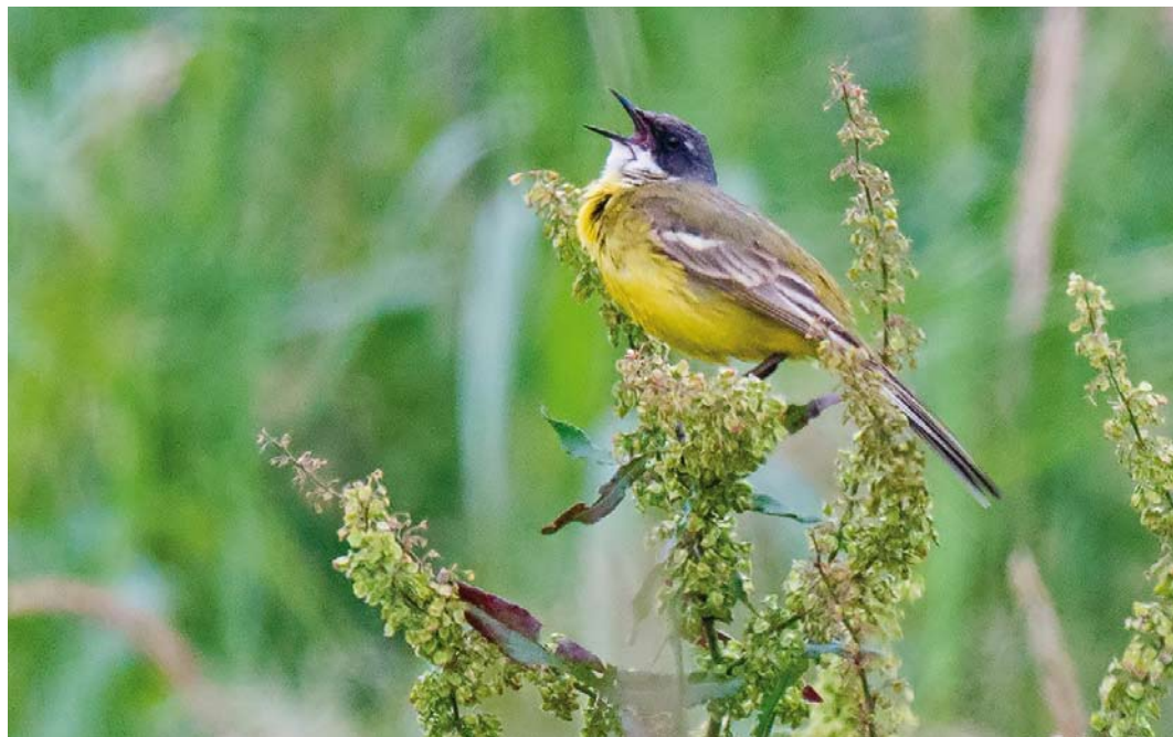
370 Witkeelkwikstaart / White-throated Wagtail Motacilla cinereocapilla , mannetje, Onnerpolder, Groningen, 11 juni 2018 (Arnoud B van den Berg)