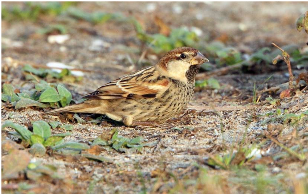
116-117 Spaanse Mus / Spanish Sparrow Passer hispaniolensis , mannetje, Maasvlakte, Zuid-Holland, 26 oktober 2014