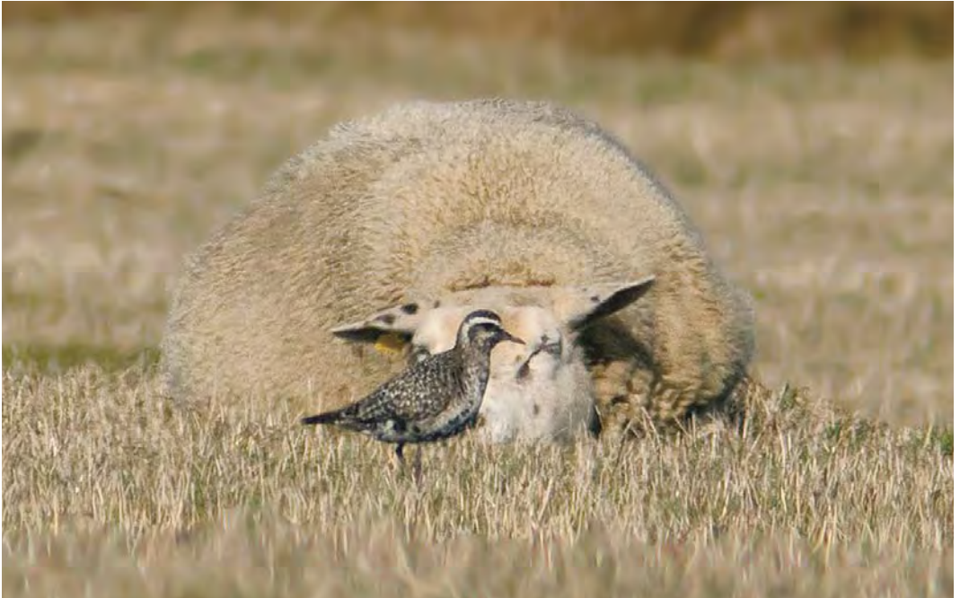
540 Amerikaanse Goudplevier / American Golden Plover Pluvialis dominica , adult, Dijkmanshuizen, Texel, Noord-Holland, 14 oktober 2009