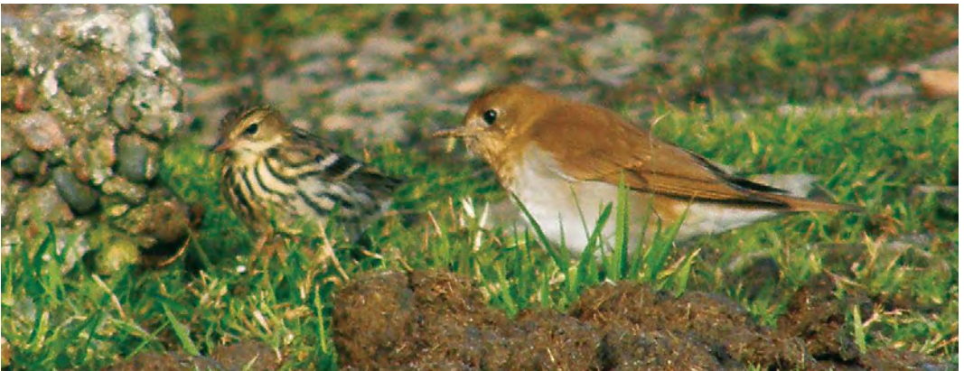
520 Dickcissel / Dickcissel Spiza americana , Flores, Azores, 6 November 2009 521 Black-throated Accentor / Zwartkeelheggenmus Prunella atrogularis , Simrishamn, Skåne, Sweden, 24 October 2009 522 Chestnut Bunting / Rosse Gors Emberiza rutila , first-year male, Île de Sein, Finistère, France, 13 October 2009 523 Pechora Pipit / Petsjorapieper Anthus gustavi , Utsira, Rogaland, Norway, 10 October 2009 524 Veery / Veery Catharus fuscescens , first-year, and Pechora Pipit / Petsjorapieper Anthus gustavi , Whalsay, Shetland, Scotland, 3 October 2009