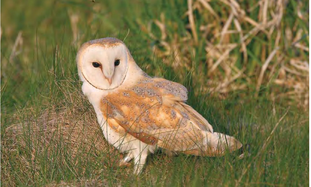
484-485 Waarschijnlijke Witte Kerkuil / probable Pale Barn Owl Tyto alba alba , Alphen aan den Rijn, Zuid-Holland, 20 april 2008 ( Chris van Rijswijk/birdshooting.nl ). Let op geelbruine bovendelen met weinig licht grijze tekening en zeer lichte onderzijde (met wel wat donkere stipjes en tekening op onderkant van buitenste handpennen). Let ook op afgeknipte of afgebroken buitenste handpennen aan linkervleugel, wat samen met tamme gedrag wijst op een mogelijke herkomst uit gevangenschap / Note yellow-brown upperparts with little pale grey markings and very pale underparts (but with a few dark dots and markings on underside of outer primaries). Also note clipped or broken outer primaries on left wing which, combined with tameness, indicates possible captive origin.