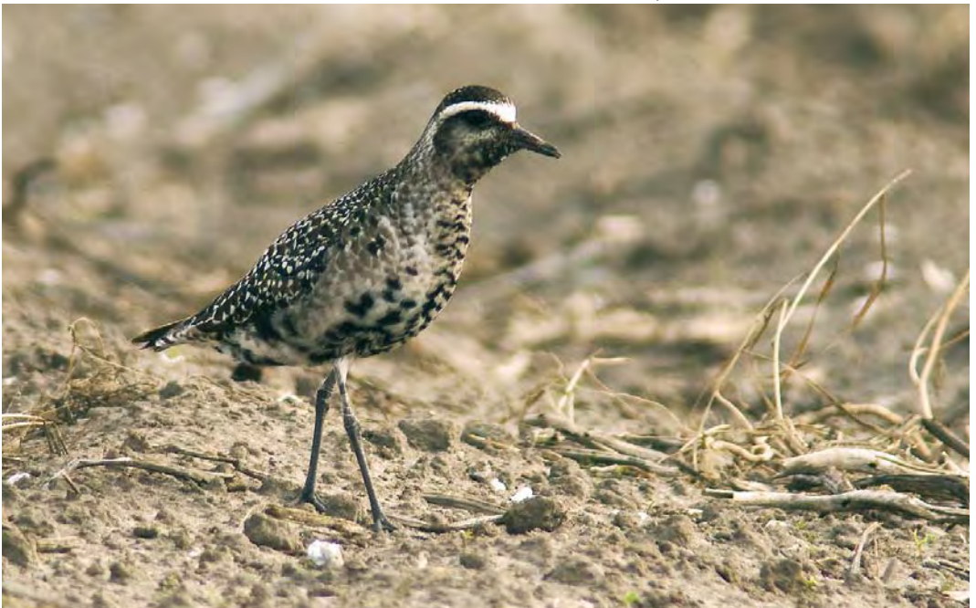
541 Amerikaanse Goudplevier / American Golden Plover Pluvialis dominica , adult, Buitendijk, Texel, Noord-Holland, 19 oktober 2009