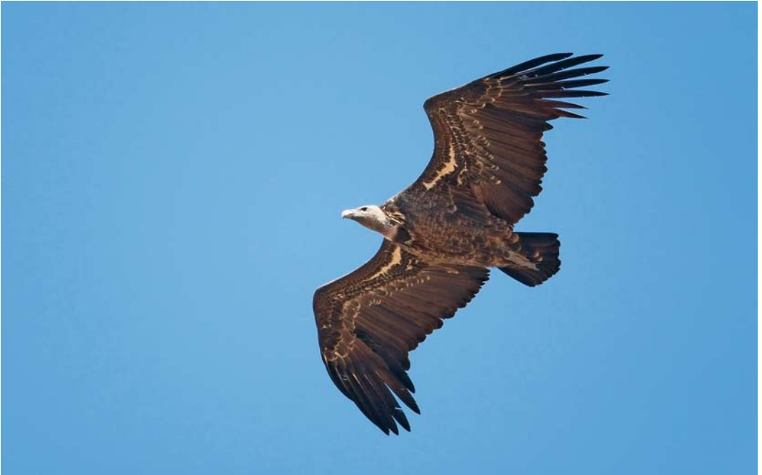
483 Rüppells Vulture / Rüppells Gier Gyps rueppellii , Tarifa, Cádiz, Spain, 7 September 2008 (Markus Varesvuo) cf Dutch Birding 30: 347, 2008