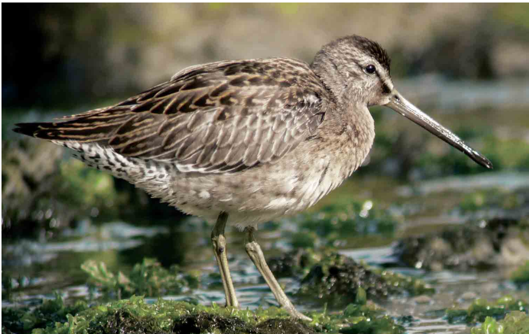
523 Short-billed Dowitcher / Kleine Grijze Snip Limnodromus griseus , juvenile, Lajes do Pico, Pico, Azores, 22 September 2006 (Sébastien Sibley)