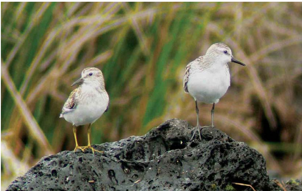
522 Least Sandpiper / Kleinste Strandloper Calidris minutilla (left) and Semipalmated Sandpiper / Grijze Strandloper C pusilla , Lajes do Pico, Pico, Azores, 19 September 2006 (Sébastien Sibley)