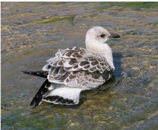
513 Mediterranean Gull / Zwartkopmeeuw Larus melanocephalus , juvenile, Sainte Anne-la-Palud, Finistère, France, 30 July 2006 (Chris van Rijswijk).