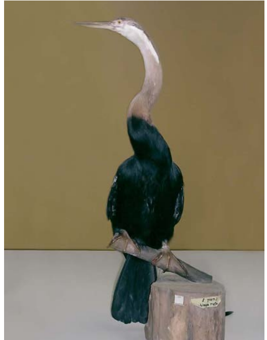
301-302 African Darter / Afrikaanse Slangenhalsvogel Anhinga melanogaster rufa , adult-winter male (collected at Hula valley, Israel, on 30 September 1950), National Museum of Natural History of Tel Aviv University, Tel Aviv, Israel, June 2006 ( Tsila Shariv )

rivers Euphrates and Tigris), in southern Iraq and neighbouring Iran. These birds are supposedly still mostly resident in Iraq. Scott & Evans (1994) summarized the historical records in Iraq. It was supposedly quite common in the early 20th century with many found nesting in various parts of the marshes. However, by the 1940s, it was already considered a scarcer and more localized species by some sources (Scott & Evans 1994).