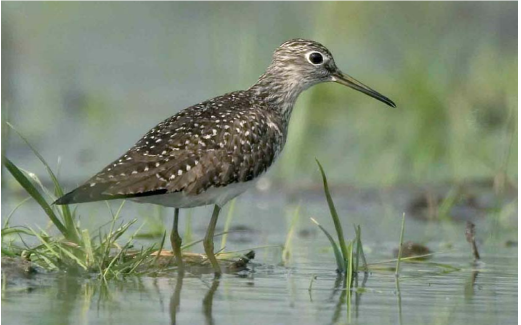
359 Amerikaanse Bosruiter / Solitary Sandpiper Tringa solitaria , Bokkegat, Wissenkerke, Zeeland, 17 mei 2006