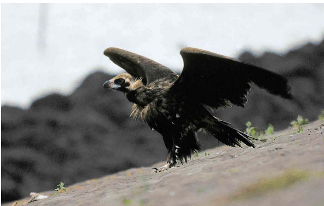
149 Monniksgier / Eurasian Black Vulture Aegypius monachus , onvolwassen, Den Oever, Noord-Holland, 26 juli 2000 ( René Pop )