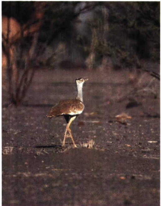
157 Arabian Bustard Ardeotis arabs , Dorra region, Djibouti, March 1990 (Geoff Welch & Hilary Welch)

The market gardens at Ambouli are accessible by bus or taxi but can be frustratingly difficult to work. The vegetation of the gardens provides ample cover for a wide range of residents and migrants and boasts several 'firsts' for Djibouti such as White-throated Robin Irania gutturalis , Paradise Whydah Vidua paradisaea , Collared Pratincole Glareola pratincola and Starling Sturnus vulgaris ! Ambouli's true importance for migrants will not be known until an extensive ringing study is carried out but its proximity to the centre of the city offers great scope