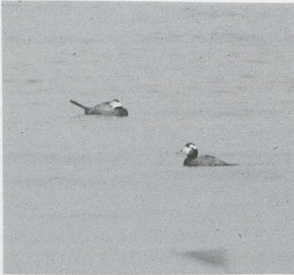
65 Witkopeend Oxyura leucocephala , mannetje in onvolwassen kleed, Turkije, mei 1987

Herkenning van onvolwassen mannetje Witkopeend Mannetjes Witkopeenden Oxyura leucocephala hebben in het eerste zomerkleed een geheel zwarte kop of een zwarte kop met een of twee witte vlekken rond het oog (Torres & Ayala 1986). Naarmate ze ouder worden, verschijnt op de oorstreek meer wit. Een deel van de onvolwassen mannetjes heeft een brede zwarte kruin. Ze kunnen hierdoor met een mannetje Rosse Stekelstaart O jamaicensis worden verward.