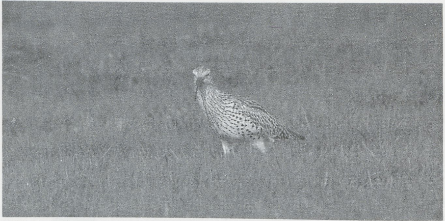
36 Slender-billed Curlew Numenius tenuirostris , Morocco, January 1988 (Arnoud B van den Berg)