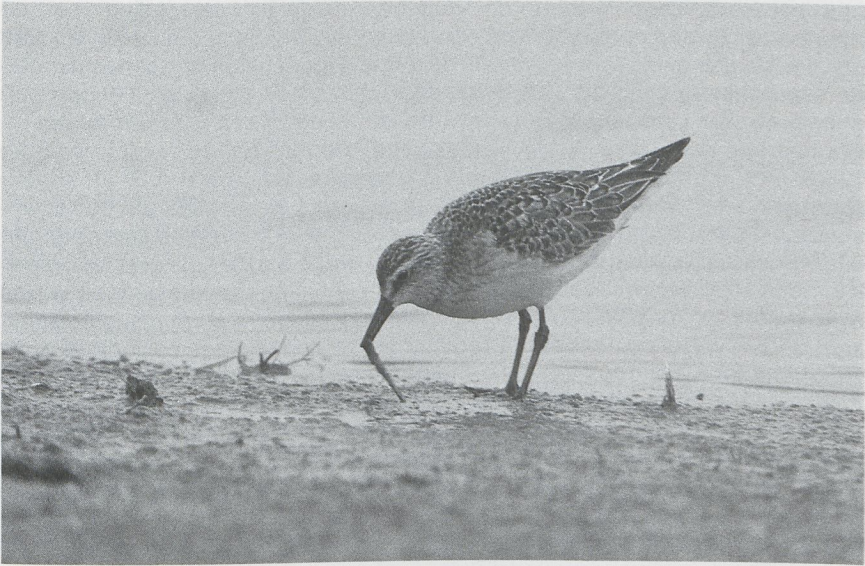
60 Krombekstrandloper Calidris ferruginea met half afgebroken snavel, Camperduin, Noordholland, oktober 1987 61 Krombekstrandloper met half afgebroken snavel, Camperduin, Noordholland, november 1987