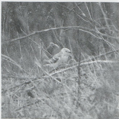
58 Citroenkwikstaart Motacilla citreola , Harchies, Henegouwen, april 1987