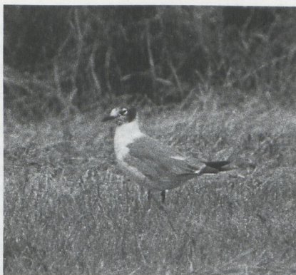
54-55 Franklins Meeuw Larus pipixcan , Wernhout, Noordbrabant, 15-16 juni 1987 (Hans Gebuis)

KOP & HALS Voorhoofd witachtig. Kruin, achterhoofd en oorstreek dofzwart; zwart op achterhoofd en oorstreek naar achteren niet scherp begrensd en geleidelijk overgaand in zwartgrijs; zwart vanuit oorstreek naar voren uitgebreid, vermengd met wit op keel en onduidelijke 'halsketting' vormend. Teugel grijsachtig zwart. Brede witte oogring, nauwelijks onderbroken achter oog, duidelijk onderbroken voor oog. Kin witachtig. Hals vuilwit.