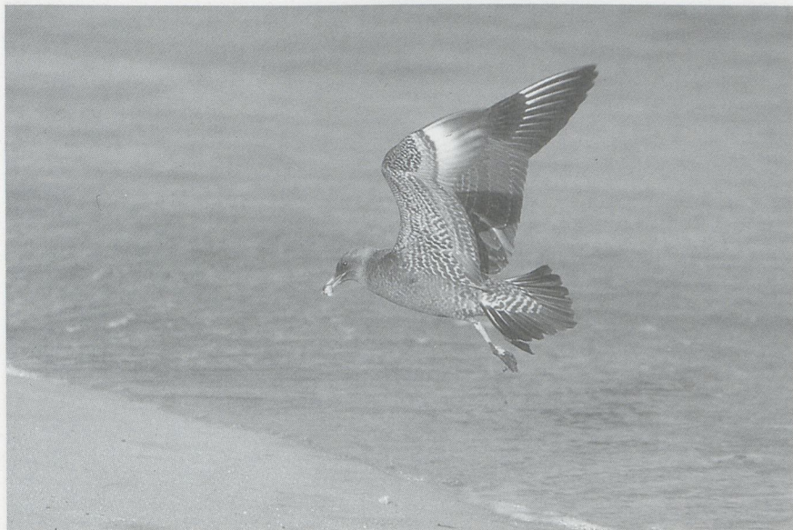
45 Middelste Jager Stercorarius pomarinus in juveniel kleed, Maasvlakte, Zuidholland, november 1985

Alleen te Scheveningen, waar het aantal Middelste Jagers op een bepaald moment was toegenomen tot 42, bevonden zich op 18 november nog 19 vogels, een aantal dat op 21 november was verminderd tot negen of 10. Na 5 december nam het aantal geleidelijk af tot zes op 14 december, vijf op 21 december en één op 25 december. Deze laatste vogel was tot begin januari 1986 aanwezig. Van december tot maart werden nog enkele exemplaren langs de Westerschelde Z gezien.