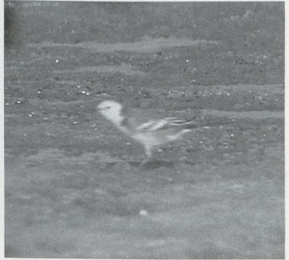
63 Citrine Wagtail Motacilla citreola , Mallorca, Spain, April 1987 (W H Truckle)

General shape and actions much like accompanying White Wagtail M alba or Yellow Wagtail M flava . Head plain bright yellow; nape black, extending onto side of breast as grey smudge. Upperparts grey, darker than White Wagtail M a alba . Underparts plain bright yellow with grey flank and white undertail-coverts. Wing basically blackish; tertials broadly white-fringed; broad white tips to greater and median coverts forming two bold wing-bars; greater coverts also rather broadly fringed with white, so that when wing tightly closed greater coverts formed almost solid square block of white. Tail black with white outer feathers. Bill and leg black. Voice similar to Yellow Wagtail, perhaps harder and thinner, a single or double tsssp (versus tsew of Yellow Wagtail).