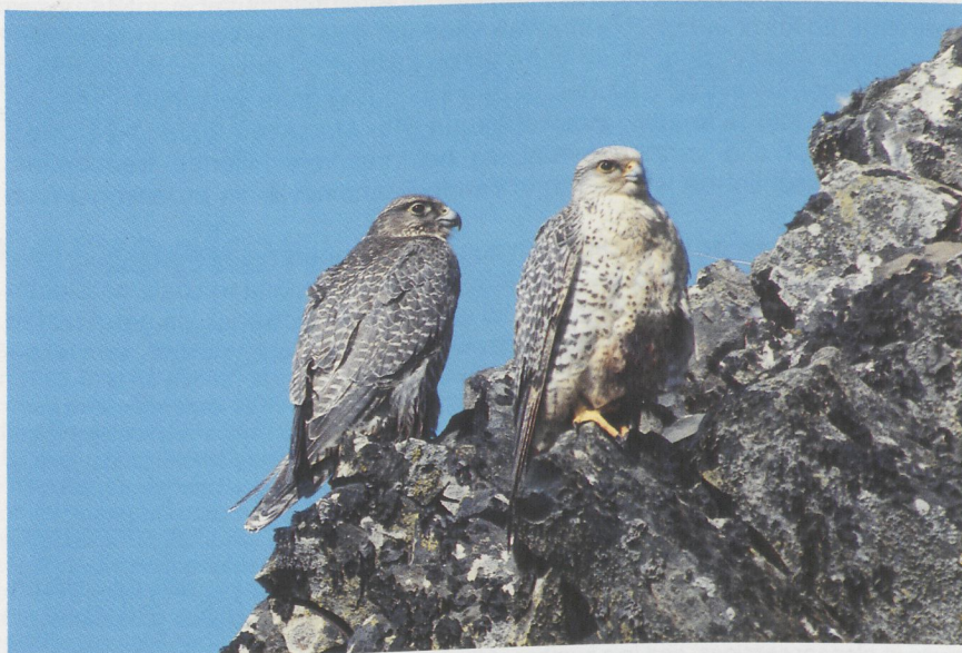
66 Giervalken Falco rusticolus , IJsland, juni 1981 (Karel Beijlevelt)

Giervalk In een opsomming van de hem bekende roofvogels noemt Linnaeus ( Systema Naturae , 10e druk, 1758) als vijfde in het geslacht Falco : ' rusticolus (= op het boerenland levend) - washuid, oogleden en poten geel, lichaam grijs met witte golflijntjes, hals wit. Bewoont Zweden'; en als 22e: ' gyrfalco (= heilige valk) - washuid donkerblauw, poten geel, lichaam donkerbruin, onderzijde met grijze banden, zijkant van de staart wit. Bewoont Europa'. In Linnaeus' bonte lijst van juvenielen en adulten door elkaar is de enige omschrijving die op de algemeen voorkomende Slechtvalk F peregrinus past (eens was de soort 'slecht' = gewoon) die onder rusticolus . Een vreemde zaak derhalve dat het juist de Giervalk is die nu de officiële naam ' Falco rusticolus Linnaeus 1758' draagt en niet de Slechtvalk.