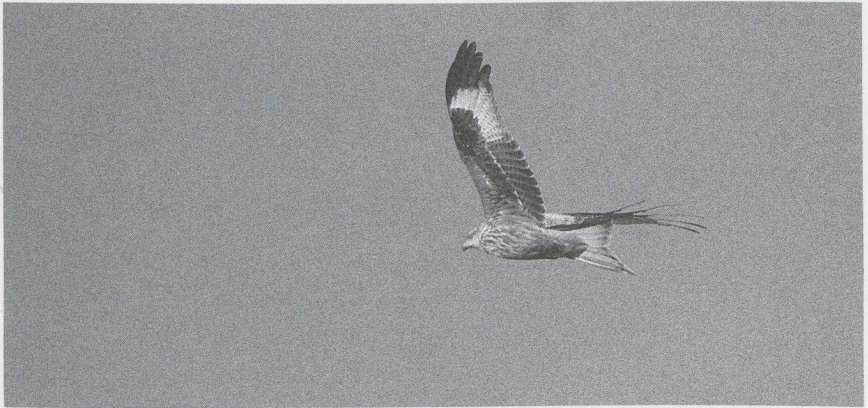
70 Rode Wouw Milvus milvus , Flevoland, december 1987 (Arie de Knijff)

veerde Purperreiger Ardea purpurea werd op 22 februari bij Almere Fl opgemerkt. Vroege Ooievaars Ciconia ciconia waren er op 16 januari bij Grafhorst O (twee) en op 21 februari bij Asperen Zh. Midden maart pleisterden er drie bij Gent Ovl. Verder werd van een klein aantal trekkende exemplaren melding gemaakt in de tweede helft van maart. Op 8 januari zat een Lepelaar Platalea leucorodia op Texel. Tot drie Flamingo's Phoenicopterus ruber roseus werden ook nog in januari en februari bij het Dijkwater Z aan het Grevelingenmeer gezien, wederom in gezelschap van 22 Chileense Flamingo's P chilensis . Vijf Groenlandse Kolganzen Anser albifrons flavirostris werden op 2 januari bij Goedereede Zh gemeld. De Dwerggans A erythropus van Damme Wvl werd ook op 2 en 4 januari gezien. De vogel van Zandvliet A bleef daar tot 24 januari. Op 24 en 25 januari was er één bij Klemskerke Wvl. Maximaal zes Dwergganzen waaronder twee met kleurringen hielden zich van 10 januari tot zeker 8 februari op tussen de ganzen bij Strijen Zh. Op 4 januari was een gekleurindg exemplaar aanwezig in de Bandpolder Fr en van 11 januari tot 18 februari verbleef er één bij Den Bommel Zh. Andere Dwergganzen waren er op 23 januari bij de Kievitslanden Fl en in de Flauwers Inlagen Z, op 6 februari bij Heel L, van 13 januari tot 14 februari één en op 13 februari