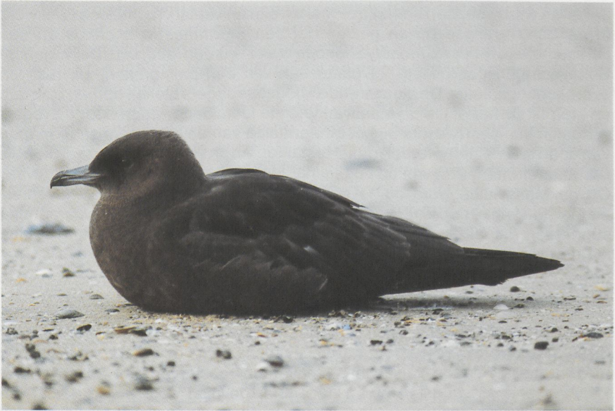
48 Middelste Jager Stercorarius pomarinus in juveniel kleed, donkere vorm, Scheveningen, Zuidholland, november 1985 (Arie de Knijff) 49 Middelste Jager, onvolwassen ruiend naar winterkleed, Scheveningen, Zuidholland, november 1985 (Arie de Knijff)