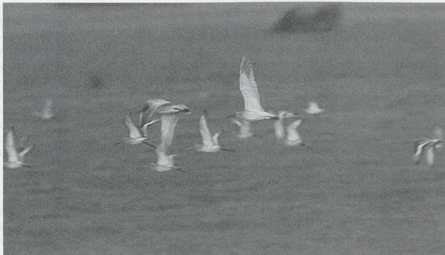
41 Slender-billed Curlews Numenius tenuirostris and Black-tailed Godwits Limosa limosa , Morocco, January 1988