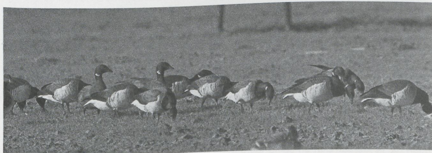
69 Witbuikrotganzen Branta bernicla hrota , Ouddorp, Zuidholland, januari 1988 (Hans Gebuis)

26 maart langs Camperduin vloog. Al op 2 maart werd een adulte Kwak Nycticorax nycticorax bij Wartena Fr gezien. Grote Zilverreigers Egretta alba overwinterden in het Harderbroek Fl en in de polders ten zuiden van Lith Nb. De vogel van Lith werd daar na 4 februari niet meer gemeld. Op 18 februari werd een exemplaar langs de snelweg tussen Zwolle O en Kampen O waargenomen. Op 20 februari verbleven er twee in het Harderbroek en vanaf eind maart waren deze vogels in de Oostvaardersplassen Fl aanwezig. Bij Druten werd op 25 maart ook een Grote Zilverreiger gezien. Een vroeg gearri-