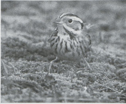
76 Dwinggors Emberiza pusilla , Kallo, Oostvlaanderen, januari 1988 (Luc Verroken)

nuari bij Scheveningen, op 26 januari bij Oostende en op 12 maart bij IJmuiden. Buiten een 15-tal Grote Burgemeesters L. hyperboreus aan de kust werd er op 21 februari één bij Beerse A gezien. Interessant was de waarneming van een Zwarte Stern Chlidonias niger langs de dijk van Enkhuizen Nh naar Lelystad Fl op 2 januari. Op 3 februari zat er een Zwarte Zeekoet Cephus grylle bij Lauwersoog Gr. Dode Kleine Alken Alle alle werden gevonden bij Oostende op 31 januari en bij Katwijk aan Zee op 5 maart. Buiten een olieslachtoffer op Texel in januari werden er Papegaaiduikers Fratercula arctica gemeld op 2 januari bij IJmuiden, op 29 februari bij Camperduin en op 3 maart bij Oostende (twee uitgeputte exemplaren).