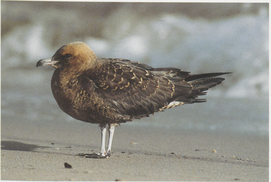
46 Middelste Jager Stercorarius pomarinus in juveniel kleed, Scheveningen, Zuidholland, november 1985 (Arie de Knijff) 47 Middelste Jager in juveniel kleed, Maasvlakte, Zuidholland, november 1985 (Arie de Knijff)