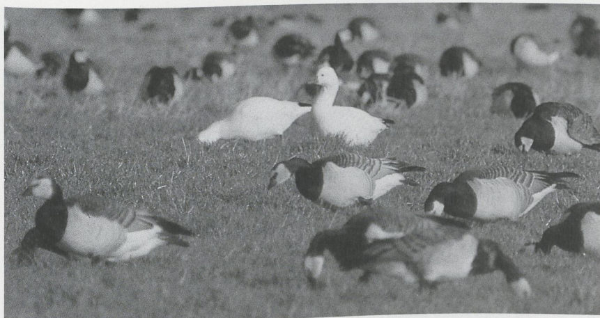
68 Ross' Ganzen Anser rossii , Veerse Meer, Zeeland, februari 1988

kaan Pelecanus onocrotalus in Friesland hebben verbleven. Van 5 tot 20 januari en van 27 januari tot 3 februari was een Roze Pelikaan weer bij Elden present. Op 21 januari werd de vogel laag vliegend bij Wageningen Gld gemeld. Op 8 februari werd er één boven Valkenburg L waargenomen en op 9 en 10 februari verbleef een adult exemplaar bij Wittem L. Op 9 februari werd bovendien een noordwaarts vliegend exemplaar bij Druten Gld gemeld zodat er waarschijnlijk twee pelikanen in het spel zijn. Hoogst merkwaardig is de melding van een onvolwassen Kroeskoppelikaan P. crispus die op