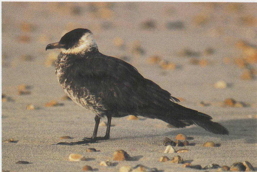
43 Middelste Jager Stercorarius pomarinus in adult kleed, Maasvlakte, Zuidholland, november 1985 (René Pop) 44 Middelste Jagers in onvolwassen (voor) en adult kleed, Maasvlakte, Zuidholland, november 1985 (René Pop)