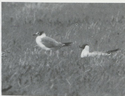
56-57 Franklins Meeuw Larus pipixcan , Wernhout, Noordbrabant, 24 juni 1987 (Guus Hak)

(cf Dwight). De genoemde veronderstelling wordt bevestigd doordat WH op 1 juli zag dat het zwart op de kop was afgenomen. Het wit van het voorhoofd liep nu door tot op de kruin. De keel was vuilwit en van de halsketting waren nog slechts enkele vlekjes over. Op de teugel was het zwart verdwenen en op het achterhoofd was het naar boven toe verder vervaagd. Alleen de oorstreek was nog geheel dofzwart. De binnenste handpen was nu volledig uitgegroeid. De nieuwe tertials waren leigrijs met een brede witte top en vormden een duidelijke tertialachterrand; op de buitenste tertials was een zwartachtige centrale vlek zichtbaar. De langwerpige witachtige vlek op de armvleugel was verdwenen, kennelijk waren de nieuwe grote dekveren uitgegroeid. De staart was nu nog rommeliger, de zwarte toppen leken verdwenen.