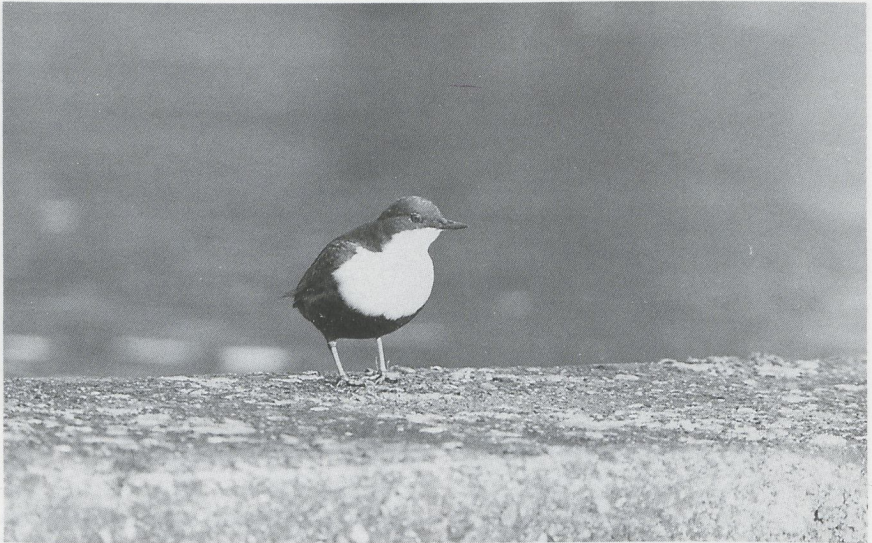
74 Waterspreeuw Cinclus cinclus , AW-duinen, Noordholland, maart 1988

zen B bernicla hrota te Ouddorp en op 10 en 21 maart werd er een waargenomen bij Yerseke. Zwarte Rotganzen B b nigricans werden gezien op 16 januari, tussen c 300 Toendrarietganzen A fabalis rossicus , bij Urk Fl, op 17 en 18 januari bij Westkapelle Z, op 20 januari bij de Grevelingendam Z en op 30 januari één en van 1 tot 4 februari twee op Schiermonnikoog Fr. Roodhalsganzen B ruficollis werden gezien op 2 januari in de Lauwersmeer Gr, van 2 tot 14 januari één en op 7 februari drie bij Strijen, op 17 januari bij Klemskerke en langs de Oostvaardersdijk, op 19 januari bij de Grevelingendam, op 23 januari één en op 6 februari twee in de Bandpolder, van 30 januari tot 7 februari bij Scharendijke Z, op 9 februari drie langs de IJssel bij Wilp Gld, van 13 februari tot 5 maart bij Goedereede, op 24 februari twee in de Workumerwaard Fr, op 2 en 4 maart twee tussen Gaast Fr en Piaam Fr en als laatste op 27 maart op Ameland Fr. De Witoogeend Aythya nyroca van Meer A werd tot 19 januari gezien. De vogel van Overveen Nh kon tot zeker 14 maart worden bewonderd. Andere Witoogeenden waren er op 17 januari op het Engelermeer Nb en van 27 januari tot 7 fe-