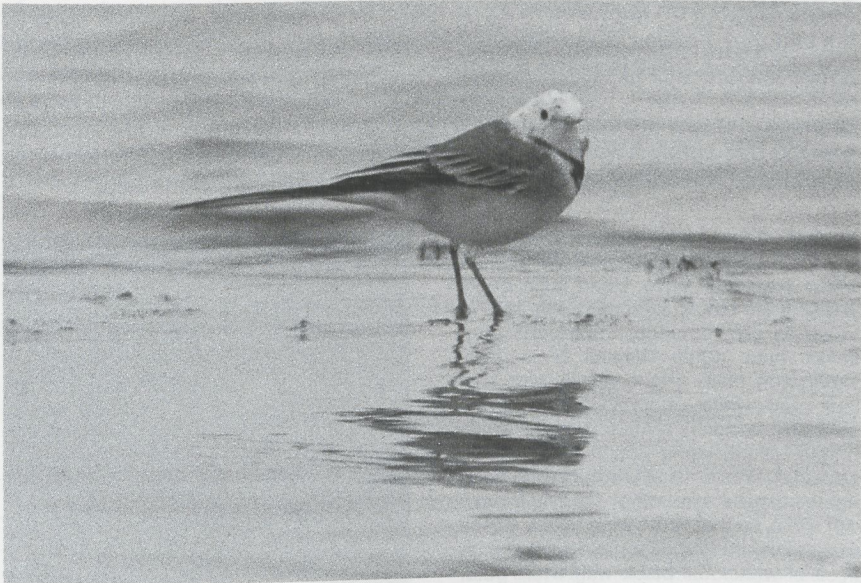
62 White Wagtail Motacilla alba resembling Citrine Wagtail M citreola , Oosterland, Zeeland, September 1987

resembled those of the White Wagtails but the head pattern was strikingly different. The whole head was bright yellow with some greyish flecks, especially in front of the eye and on the nape. The bill was pale. The upperparts were dark grey with two pale greyish wing-bars and greyish-white tertial edgings; the underparts were pale grey with a blackish-grey V-shaped breast band. The legs were dark.