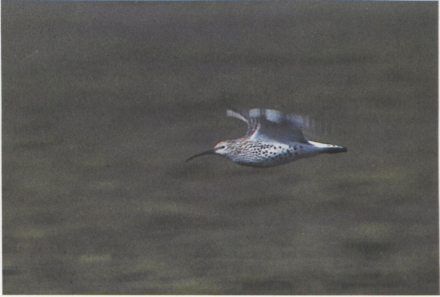
37-38 Slender-billed Curlew Numenius tenuirostris , Morocco, January 1988