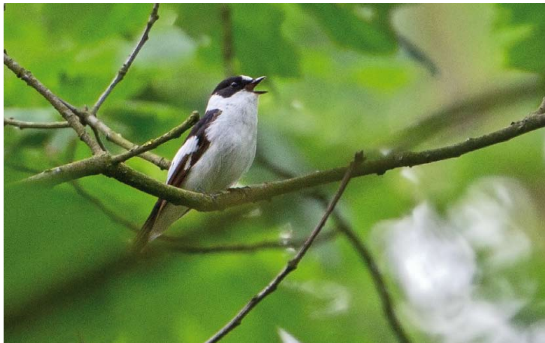
374 Withalsvliegenvanger / Collared Flycatcher Ficedula albicollis , Vierhouten, Gelderland, 13 mei 2018 (Alex Bos)