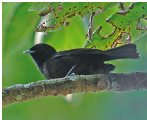
310 Tahiti Monarch / Tahitimonarch Pomarea nigra , adult, Tahiti, Society Islands, French Polynesia, 14 September 2006

For most people, the islands in the Society group will be the best known. Moorea, Bora Bora and Raiatea all make a fabulous honeymoon destination. Consequently, most of these islands are served by frequent flights (more than one daily) from Tahiti. Alternatively, several freighters will take tourists. Ferries also serve Moorea and Huahine.