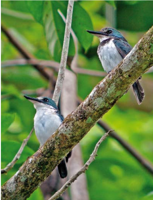
303 Tahiti Kingfishers / Tahiti Kingfishers Todiramphus veneratus veneratus , male (left) and female, Tahiti, Society Islands, French Polynesia, 18 September 2006

The taxonomy of Polynesian Todiramphus kingfishers is a bit messy. We follow Dickinson & Remsen (2013) here but other arrangements are possible (eg, Fry et al 1992). In French Polynesia, five different taxa can be encountered. Two species are critically endangered and are now confined to only one island: Marquesan Kingfisher T godeffroyi on Tahuata in the Marquesas, and Tuamotu Kingfisher T gambieri on Niau in the Tuamotus. Both species have in common that they got extinct on other islands: Marquesan previously occurred on Hiva Oa and Fatu Hiva as well while the nominate subspecies of Tuamotu got extinct on Mangareva. The other three taxa can only be encountered in the Society Islands. The nominate subspecies of Chattering Kingfisher T tutus tutus occurs in forests in the Leeward Islands, like the famous island Bora Bora, sharing its distribution with the Grey-green Fruit Dove subspecies P p chrysogaster . It too can be easily seen in the forests at Fa'ahia archaeological site on Huahine, providing some fine nature in a beautiful backdrop. Chattering Kingfisher is also said to occur on the higher slopes of Tahiti (although it has never been reported from nearby Moorea) but con-