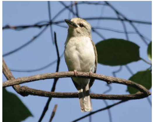
296 Marquesan Swiftlet / Markiezensalangaan Aerodramus ocistus , Ua Huka, Marquesas Islands, French Polynesia, 8 November 2008 (Tom Ghestemme) 297 Fatuhiva Monarch / Fatuhivamonarch Pomarea whitneyi , Fatu Hiva, Marquesas Islands, French Polynesia, 14 August 2012 (Tom Ghestemme) 298 Marquesan Kingfisher / Markiezen-ijsvogel Todiramphus godeffroyi , Tahuata, Marquesas Islands, French Polynesia, 10 December 2012 (Tom Ghestemme) 299 Moorea Kingfisher / Mooreaijsvogel Todiramphus veneratus youngi , Moorea, Society Islands, French Polynesia, 1 January 2009 (Tom Ghestemme)

species occur more widespread, their original distribution being augmented by accidental or deliberate introductions. Blue Lorikeet V. peruviana is most easily seen at the Blue Lagoon at Rangiroa in the Tuamotus, while the French Polynesian emblematic bird species Kuhl's Lorikeet V. kuhlii occurs commonly at Rimatara in the Austral Islands. It has been introduced to the Line Islands and more recently to Atiu, Cook Islands, to secure its future.