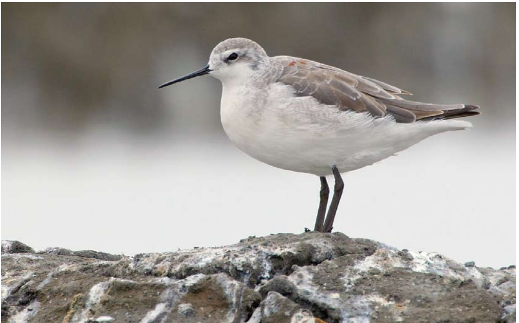
326 Wilson's Phalarope / Grote Franjepoot Phalaropus tricolor , adult, Aveiro, Portugal, 20 July 2013