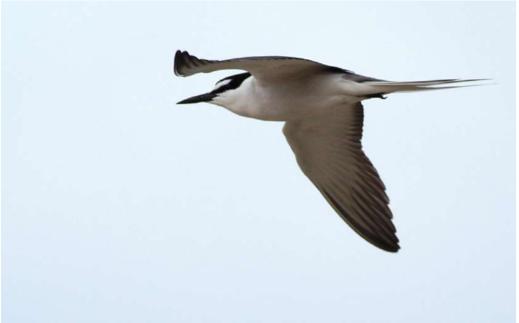
325 Bridled Tern / Brilstern Onychoprion anaethetus , adult, Farne Islands, Northumberland, England, 2 July 2013