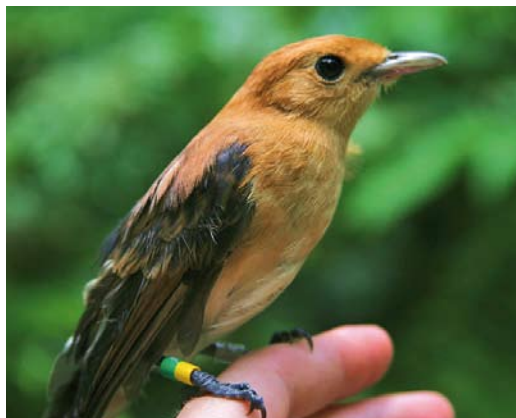
309 Tahiti Monarch / Tahitimonarch Pomarea nigra , immature, Papehue Valley, Tahiti, Society Islands, French Polynesia, 13 February 2009