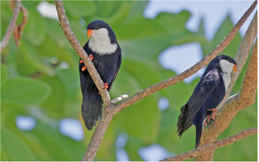
294 Blue Lorikeets / Saffierlori's Vini peruviana , Rangiroa, Tuamotu Islands, French Polynesia, 25 September 2006