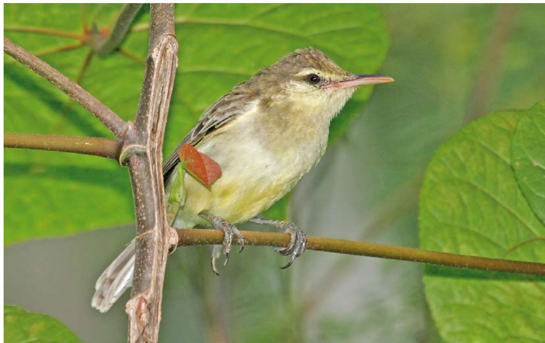
307 Northern Marquesan Reed Warbler / Noordelijke Markiezenkarekiet Acrocephalus percernis idae , Botanique Communal de Vaipae, Ua Huka, Marquesas Islands, French Polynesia, 16 September 2006

for the havoc that rats can wreck on island bird species (Thibault & Meyer 2001). Historically, as many as eight species were known from French Polynesia (Cibois et al 2004) but today only four remain, all single-island endemics. Two of them are hanging by a thread, Tahiti Monarch on Tahiti and Fatuhiva Monarch P. whitneyi on Fatu Hiva respectively, while Mohotani Monarch P. (mendozae) motanensis cannot be visited by the independent traveller as it occurs on uninhabited Mohotani in the Marquesas. The fourth species, Iphis Monarch P. iphis has some sort of thriving population on one Marquesan island only, namely Ua Huka, only because this island is free of Black Rats (see above under Ultramarine Lorikeet).