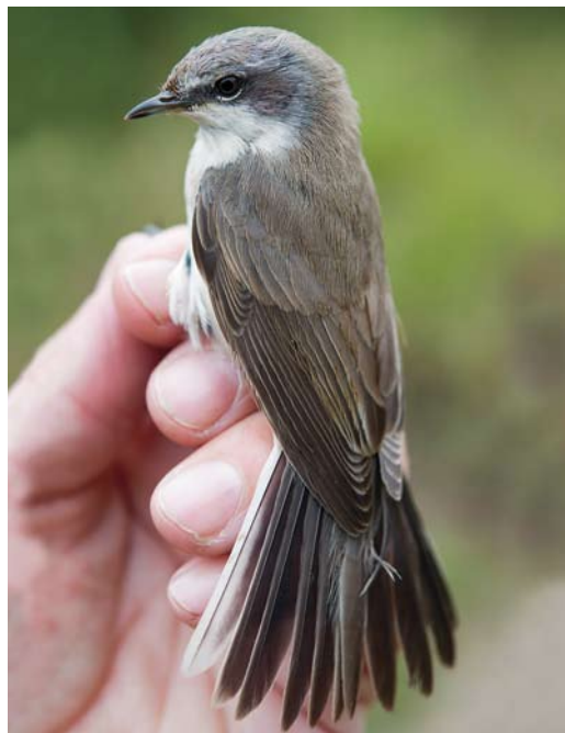
597 Bruine Boszanger / Dusky Warbler Phylloscopus fuscatus , Noordhollands Duinreservaat, Castricum, Noord-Holland, 27 oktober 2012 598 Siberische Braamsluiper / Blyth's Lesser Whitethroat Sylvia curruca blythi , eerstejaars, Kennemerduinen, Bloemendaal, Noord-Holland, 20 oktober 2012 599 Kleine Vliegenvanger / Red-breasted Flycatcher Ficedula parva , eerstejaars, De Cocksdorp, Texel, Noord-Holland, 7 oktober 2012