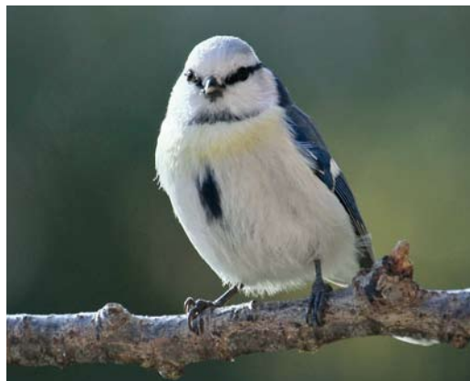
309 Hybrid Azure x European Blue Tit / hybride Azuurmees x Pimpelmees Cyanistes cyanus x caeruleus , Grans, Bouches-du-Rhône, France, 24 December 2010 (Michel Carré)