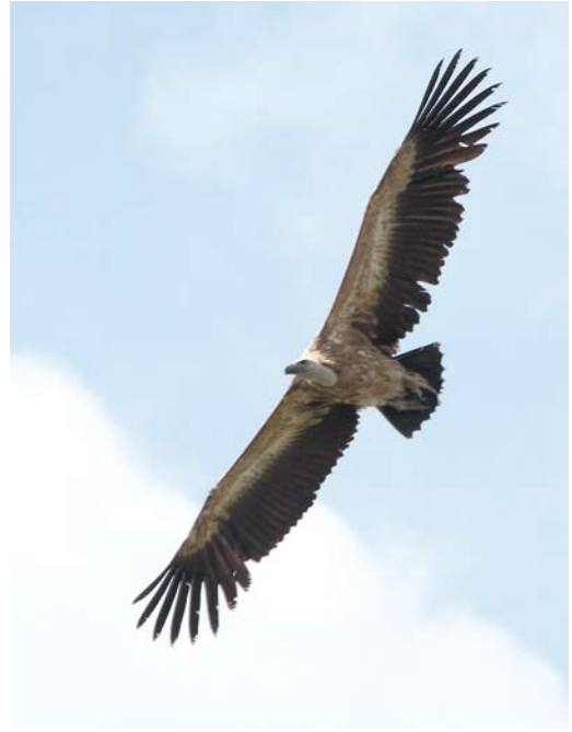
368 Bergfluit / Western Bonelli's Warbler Phylloscopus bonelli , Veluwezoom, Rheden, Gelderland, 13 juni 369 Vale Gier / Griffon Vulture Gyps fulvus , tweede kalenderjaar, Sint Pietersberg, Maastricht, Limburg, 26 juni 2012 370 Grauwe Fitis / Greenish Warbler Phylloscopus trochiloides , Rottumeroog, Groningen, 13 juni 2012