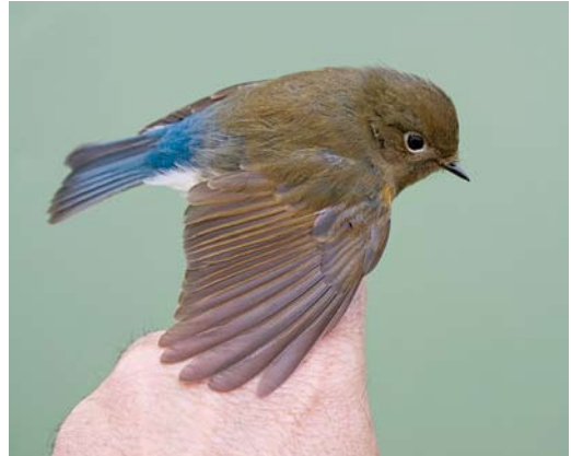
482 Red-flanked Bluetail / Blauwstaart Tarsiger cyanurus , first-year male, Kennemerduinen, Bloemendaal, Noord-Holland, Netherlands, 1 November 2010 (Arnoud B van den Berg)

A first-winter male on 26-28 September (also at Oost-Vlieland (Dutch Birding 32: 431, plate 610, 2010) is still