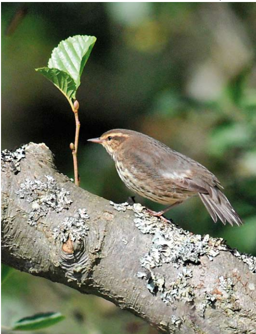
488-489 Northern Waterthrush / Noordse Waterlijster Parkesia noveboracensis , Oude Kooi, Vlieland, Friesland, 21 September 2010 (René Pop)