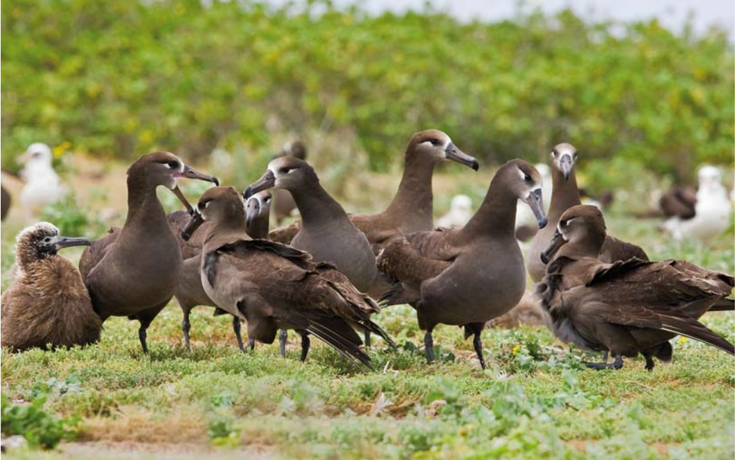
510 Black-footed Albatrosses / Zwartvoetalbatrossen Phoebastria nigripes , Midway Atoll, Hawaii, 11 April 2010

in 2005 (BirdLife International 2010c). On Midway, every year hybrids of Black-footed and Laysan Albatross are present (cf www.scholtz.org/bill/nature/Midway/index.html ).