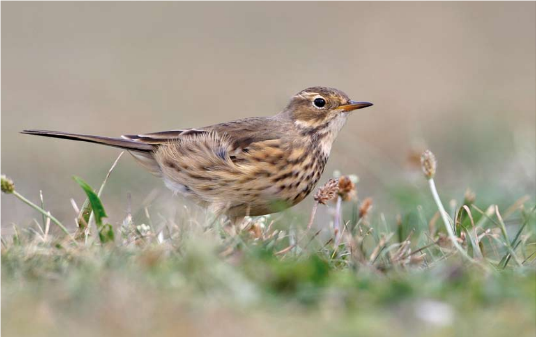
535 Buff-bellied Pipit / Amerikaanse Waterpieper Anthus rubescens rubescens , first-year, A Coruña, Galicia, Spain, 27 September 2011 (Pablo Gutierrez)