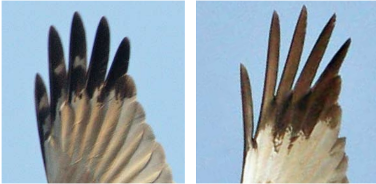
FIGURE 1 Primary tips of adult male Western Marsh Harrier / Bruine Kiekendief Circus aeruginosus . Right: normal pattern, left: aberrant pattern with pale markings (same image as in plate 501).

501). In combination with its marked wing-coverts this probably indicates a younger age than the other birds. On the upperside of the primaries, the prints were also present and visible. Although a faint print in the primaries of the Nijkerk bird could be seen in photographs, it was never as clear as in the Hasselt birds (at least in 2009; there