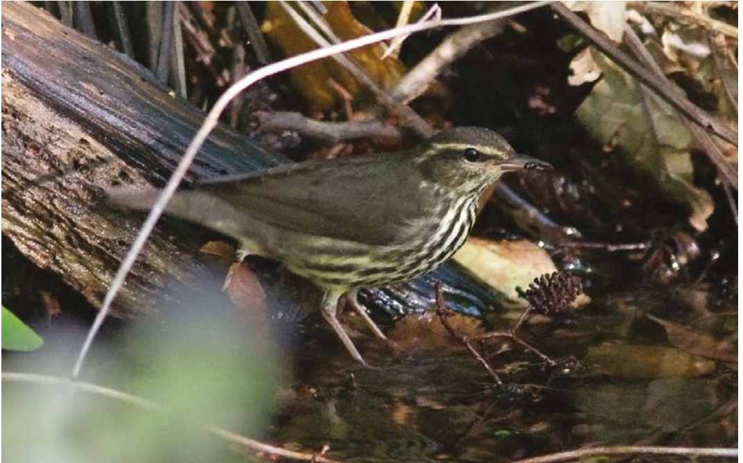
487 Northern Waterthrush / Noordse Waterlijster Parkesia noveboracensis , Oude Kooi, Vlieland, Friesland, 18 September 2010