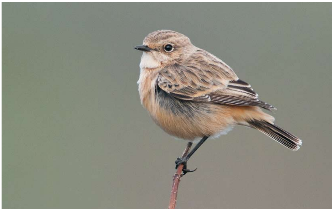
579 Aziatische Roodborsttapuit / Siberian Stonechat Saxicola maurus , eerstejaars, De Cocksdorp, Texel, Noord-Holland, 26 oktober 2011