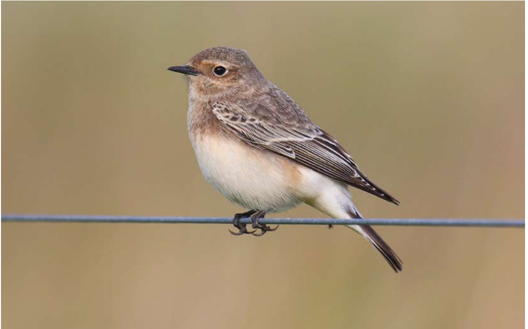
581 Bonte Tapuit / Pied Wheatear Oenanthe pleschanka , vrouwtje, Herdershut, Schiermonnikoog, Friesland, 13 oktober 2011 ( Martijn Bunskoek )