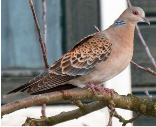
475 Rufous Turtle Dove / Meenatortel Streptopelia orientalis meena , adult, Wergea (Warga), Friesland, 31 January 2010 (Arnoud B van den Berg)