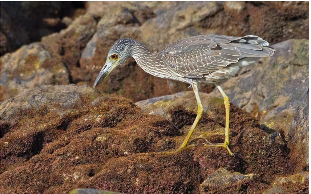
519 Yellow-crowned Night Heron / Geelkruinkwak Nyctanassa violacea , Corvo, Azores, 1 October 2011 ( Vincent Legrand )