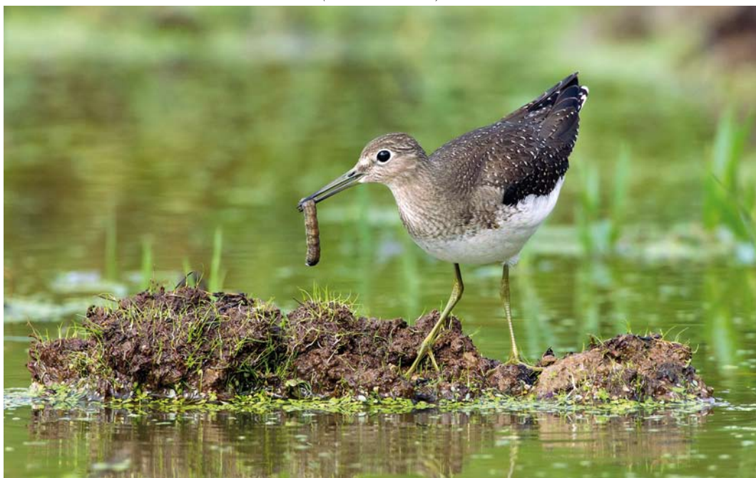
516 Solitary Sandpiper / Amerikaanse Bosruiter Tringa solitaria , São Miguel, Azores, 28 September 2011 (David Monticelli)