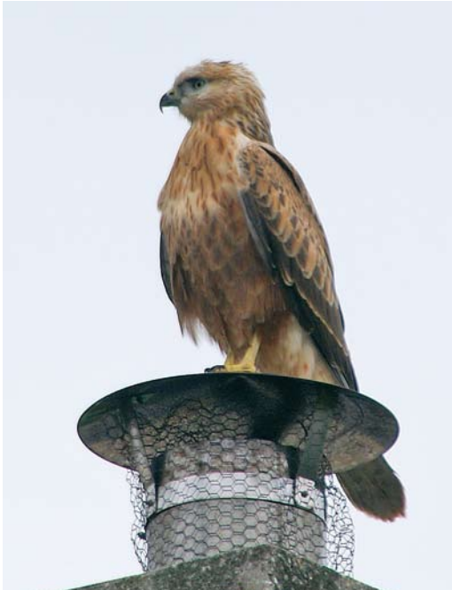
471 Long-legged Buzzard / Arendsbuizerd Buteo rufinus , juvenile, De Krim, Texel, Noord-Holland, 13 July 2010 (Nico Baas)

calendar-year, male, photographed (G Gerritsen, H Roersma, N van Brederode); 25 April, Ketelbrug, Dronten , Flevoland, second calendar-year, photographed (J Vreeman, T Janssen et al); 30 August, Alblasserwaard, Graafstroom , Zuid-Holland, second calendar-year, male, photographed (A Clements, P Bieren, A Stip).