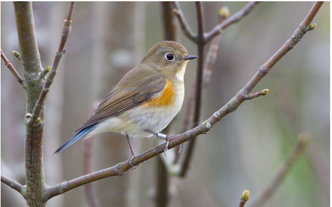
582 Blauwstaart / Red-flanked Bluetail Tarsiger cyanurus , Noordhollands Duinreservaat, Castricum, Noord-Holland, 27 oktober 2011 ( Hans Brinks )