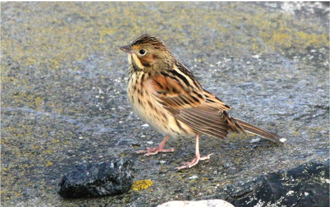
538 Chestnut-eared Bunting / Grijskopgors Emberiza fucata , Understen, Uppland, Sweden, 25 October 2011