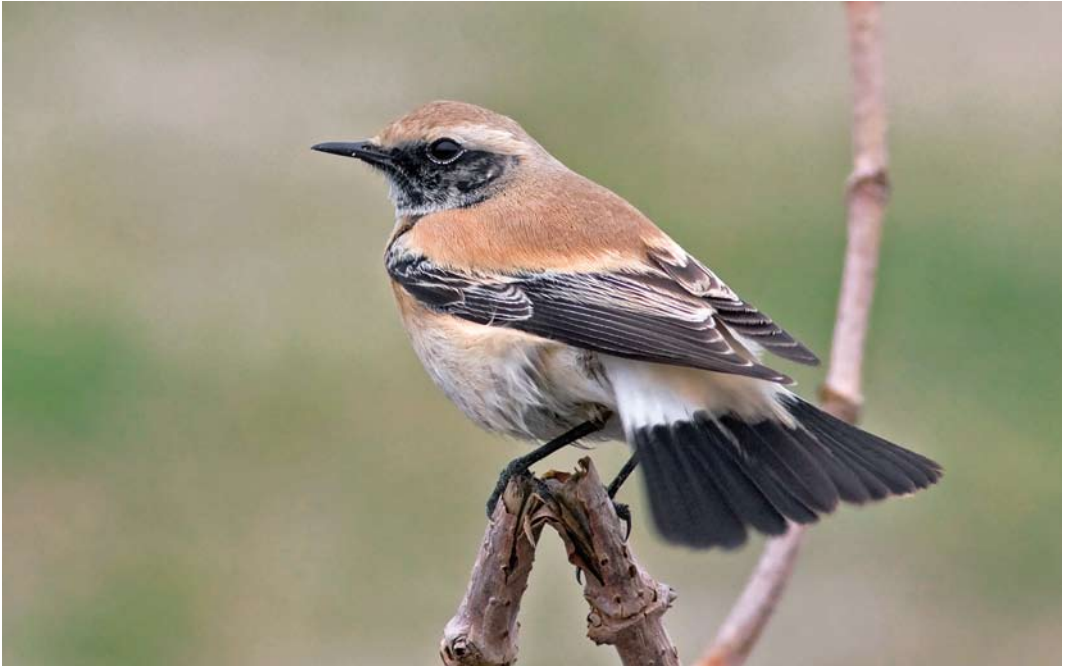
480 Desert Wheatear / Woestijntapuit Oenanthe deserti , male, Stellendam, Zuid-Holland, 5 November 2010 (Thomas Luiten)