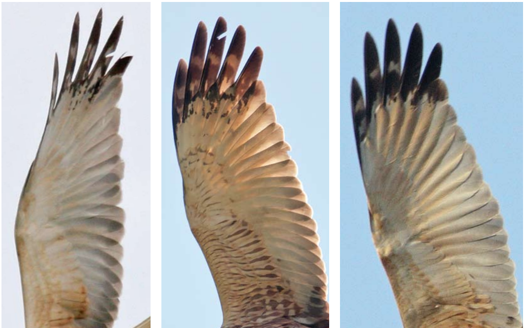
FIGURE 2 Primary tips of three adult males Western Marsh Harrier / Bruine Kiekendief Circus aeruginosus . From left to right: Hasselt, Overijssel, 2006 (same image as in plate 498); Hasselt 2009 (same image as in plate 499); and Nijkerk, Gelderland, 2009 (same image as in plate 501). Note differences in primary tip markings.

As DF already guessed and supported by the development in the Nijkerk bird, the uncommon markings are probably age-related changes in the remiges. As males Western Marsh Harrier get