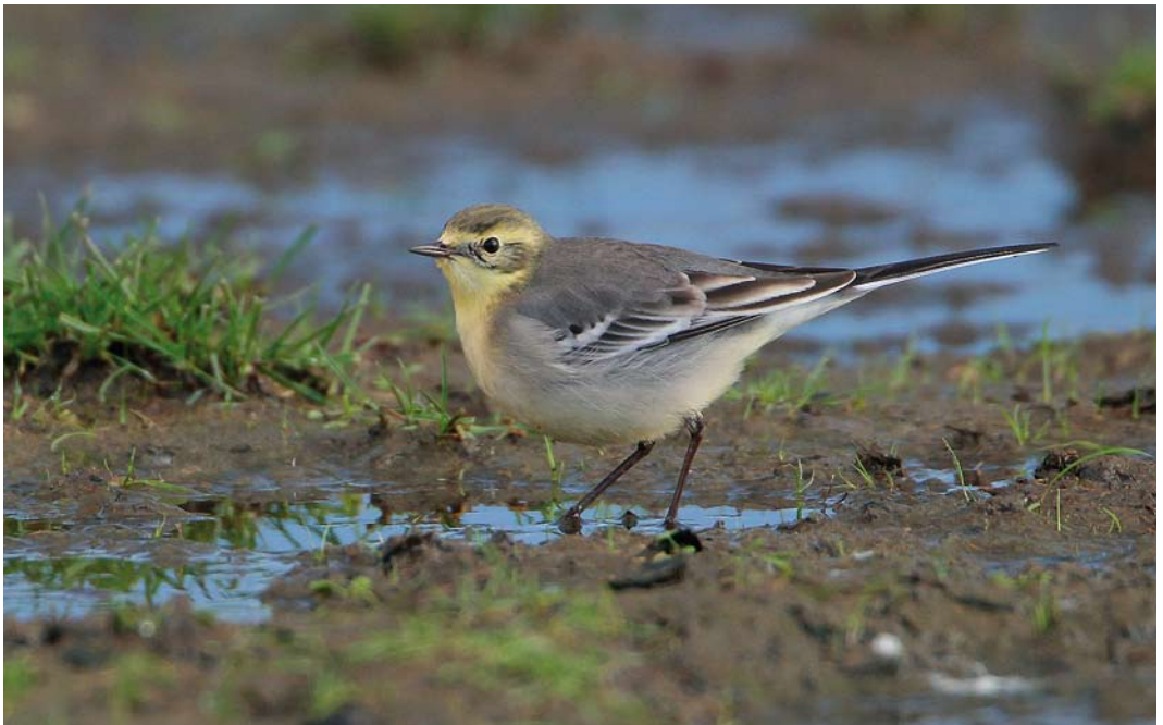
486 Citrine Wagtail / Citroenkwikstaart Motacilla citreola , Klaas Hennepoelpolder, Warmond, Zuid-Holland, 31 October 2010 ( Martin van der Schalk )