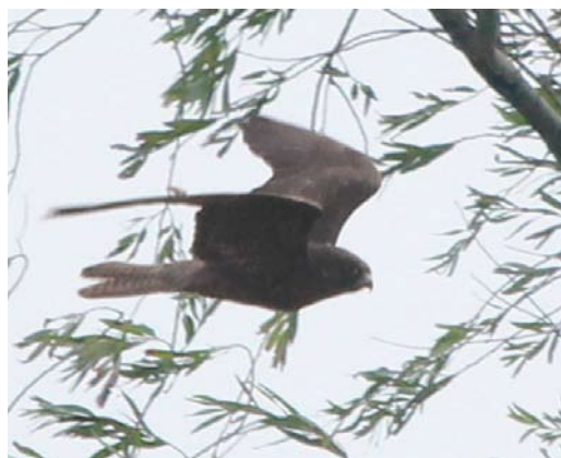
492 Eleonora's Valk / Eleonora's Falcon Falco eleonora , tweede kalenderjaar, donkere vorm, Oostvaardersplassen, Flevoland, 17 september 2011 493 Eleonora's Valk / Eleonora's Falcon Falco eleonora , tweede kalenderjaar, donkere vorm, Oostvaardersplassen, Flevoland, 17 september 2011 494 Eleonora's Valk / Eleonora's Falcon Falco eleonora , tweede kalenderjaar, donkere vorm, Oostvaardersplassen, Flevoland, 17 september 2011 495 Eleonora's Valk / Eleonora's Falcon Falco eleonora , tweede kalenderjaar, donkere vorm, Oostvaardersplassen, Flevoland, 17 september 2011

naar de kleur van de poten kon ik enkel gissen. Daarom belde ik RvB die zich ergens buiten ons zicht aan de andere kant bevond met de vraag of hij meer details kon zien. Na een verandering van zithouding kon ook onze groep even later de gele poten zien; daarmee viel Roodpootvalk af. De geheel onbevederde tibia pasten ook niet goed op Slechtvalk F peregrinus of aanverwante grote valken, die een zwaardere 'broek' hebben. Met de ANWB-gids (Svensson et al 2010) in de hand bestudeerden we de vogel. Een jonge Boomvalk F subbuteo werd geopperd maar dat werd door Luc Cieters en mij terstond tegengesproken; de borst en kop waren daar veel te donker voor en LC had onlangs nog jonge Boomvalken geringd. De