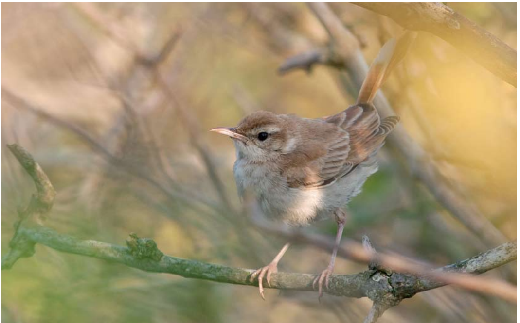
533 Rufous-tailed Scrub Robin / Rosse Waaierstaart Cercotrichas galactotes , Mellum, Niedersachsen, Germany, 2 October 2011