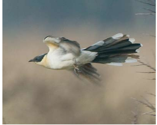
476 Great Crested Cuckoo / Kuifkoekoek Clamator glandarius , Lentevreugd, Wassenaar, Zuid-Holland, 24 March 2010

Dutch Birding 32: 272, plate 366, 2010).