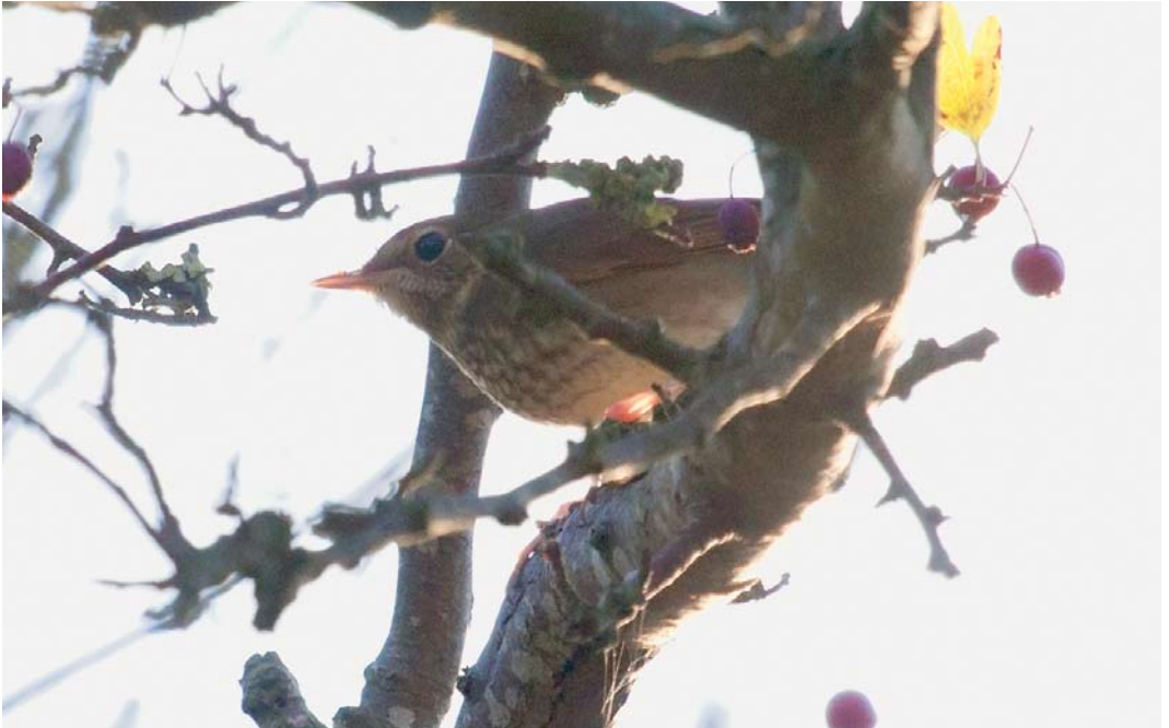
532 Rufous-tailed Robin / Snornachtegal Luscinia sibilans , Wells-next-the-sea, Norfolk, England, 14 October 2011