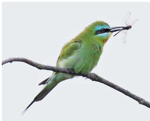
477 Blue-cheeked Bee-eater / Groene Bijeneter Merops persicus , adult, Noordhollands Duinreservaat, Castricum, Noord-Holland, 16 August 2010 ( Cock Reijnders )

A bird at De Cocksdorp, Texel, Noord-Holland, on 7 November (Dutch Birding 33: 69, plate 85, 2011) is still in circulation. The 1983 record was erroneously mentioned as a trapped bird but it was only observed in the field and not in the hand (contra van den Berg & Bosman 1999, 2001). The 2007/08 record concerns a date extension of a bird previously accepted for 21 November 2007 to 20 January 2008 (Ovaa et al 2010).