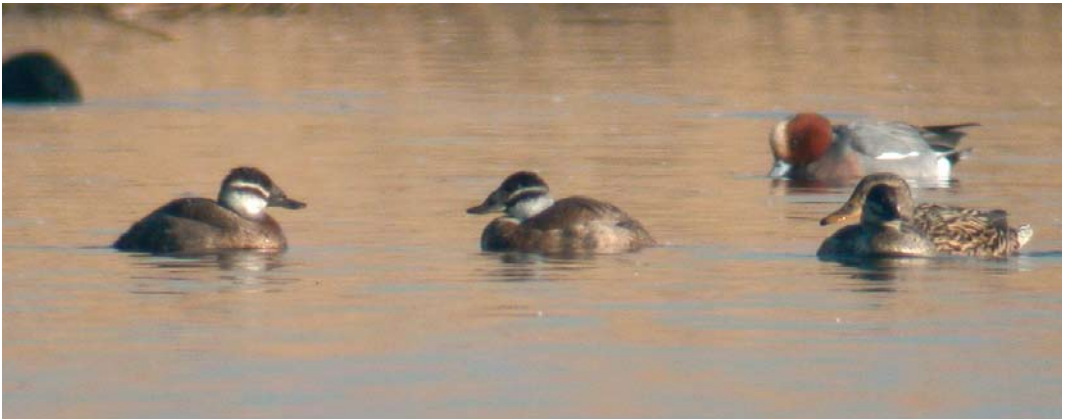
468 Surf Scoter / Brilzee-eend Melanitta perspicillata , adult male, with Common Eider / Eider Somateria mollissima , female, Horsmeertjes, Texel, Noord-Holland, 9 May 2010 469 White-headed Ducks / Witkopeenden Oxyura leucocephala , Starrevaart, Leidschendam, Zuid-Holland, 28 February 2010

bird, already accepted for the winter of 2007/08 (Ovaa et al 2009). The returning bird at Wieringermeer was first accepted for 26 December 2003 to 2 March 2004 (van der Vliet et al 2006).