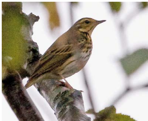
484 Olive-backed Pipit / Siberische Boompieper Anthus hodgsoni , Reddingsweg, Schiermonnikoog, Friesland, 22 October 2010