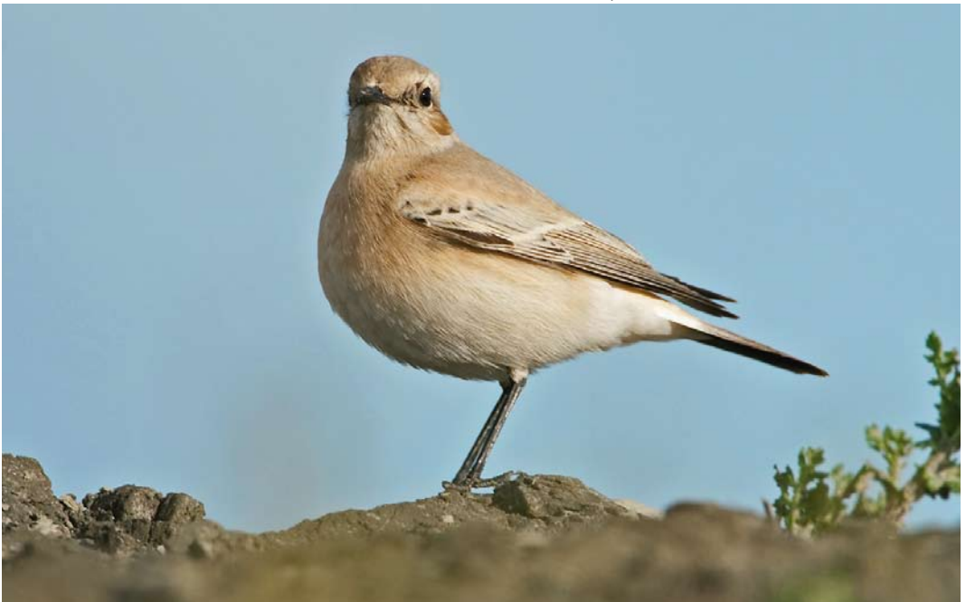
481 Desert Wheatear / Woestijntapuit Oenanthe deserti , female, Waddenzeedijk, Schiermonnikoog, Friesland, 24 October 2010