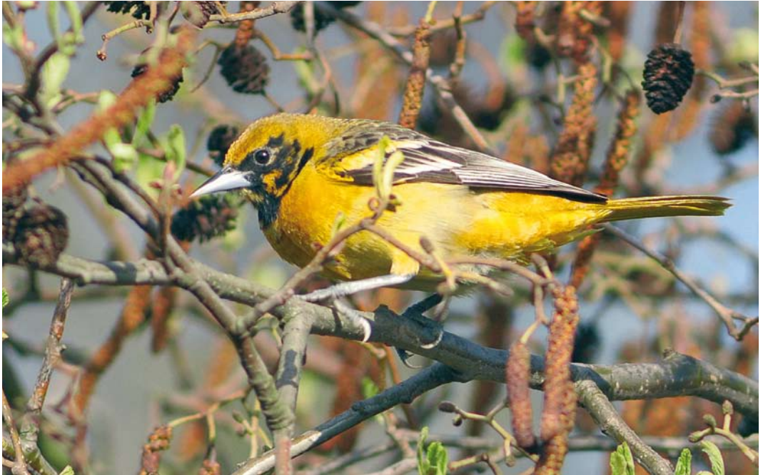
485 Baltimore Oriole / Baltimoreetroepiaal Icterus galbula , first-winter male moulting to first-summer, Oudorp, Alkmaar, Noord-Holland, 11 April 2010 ( Harm Niesen )