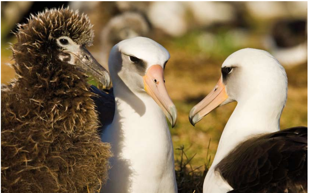
505 Laysan Albatrosses / Laysanalbatrossen Phoebastria immutabilis , Midway Atoll, Hawaii, 9 April 2010

Laysan Albatross is one of the smaller albatross species with a wingspan of 'only' c 2.10 m. The population is rebounding from a period of severe hunting in the early 1900s. Feather hunters killed many 100 000s and the slaughter eventually led to the protection on the north-western Hawaiian Islands. On Midway, airport activities and communications antennas also took a heavy toll in bird strikes in the 1940s and 1950s. Perhaps the most significant ecological catastrophe took place during the Battle of Midway, when rats from ships first gained access to Sand Island with dire consequences for nesting birds. The rats are gone and large obstacles have been removed on Midway, and since then the population has been steadily growing although it seems to stabilize now. Counts in 2010 on Midway indicated 420 000 breeding pairs, c 75% of the total world breeding population of 590 000 pairs. Laysan Island, Hawaii, has the second largest colony with more than 100 000 pairs. Smaller numbers breed on islands off Japan and, since the 1980s, Mexico (BirdLife International 2010a). The main current threat is long-line fishing. Laysan is also vulnerable to ingestion of floating plastics which have contaminated ma-