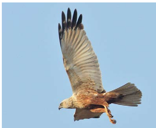
496-497 Western Marsh Harrier / Bruine Kiekendief Circus aeruginosus , adult male, Nijkerk, Gelderland, 2 June 2007 ( Jan van der Greef ) 498 Western Marsh Harrier / Bruine Kiekendief Circus aeruginosus , adult male, Hasselt, Overijssel, 28 May 2006 ( Jan Uilhoorn ). Same image used in figure 2 (left). 499 Western Marsh Harrier / Bruine Kiekendief Circus aeruginosus , adult male, Hasselt, Overijssel, 20 April 2009 ( Ton Valk ). Same image used in figure 2 (centre). 500 Western Marsh Harrier / Bruine Kiekendief Circus aeruginosus , adult male, Nijkerk, Gelderland, 9 May 2008 ( Karel A Mauer ) 501 Western Marsh Harrier / Bruine Kiekendief Circus aeruginosus , adult male, Nijkerk, Gelderland, 3 April 2009 ( Karel A Mauer ). Same image used in figure 1 (left) and figure 2 (right).