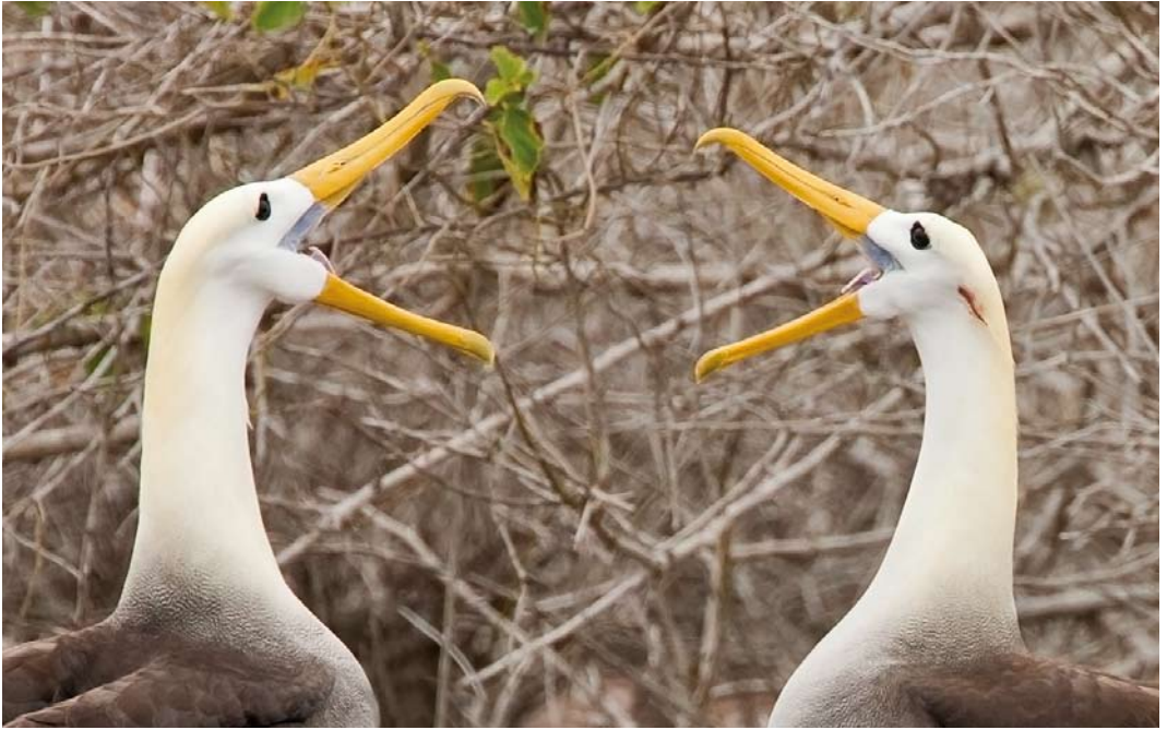
511-512 Waved Albatrosses / Galápagosalbatrossen Phoebastria irrorata , Galápagos Islands, 7 June 2006