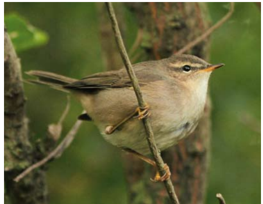
539-540 Two-barred Warbler / Swinhoe's Boszanger Phylloscopus plumbeitarsus , Mellum, Niedersachsen, Germany, 29 September 2011 541 Eastern Crowned Warbler / Kroonboszanger Phylloscopus coronatus , Hillfield Park Reservoir, Hertfordshire, England, 31 October 2011 542 Dusky Warbler / Bruine Boszanger Phylloscopus fuscatus , Nieuwpoort-Bad, West-Vlaanderen, Belgium, 1 November 2011

origin were the low mountains in the north of the species' range in north-eastern France (Vosges and Jura) and south-western Germany (Schwarzwald) (Bull Br Ornithol Club 131: 189-191, 2011). It is noteworthy that an adult female trapped with Eurasian Siskins C spinus (of which one was wearing an Italian ring) in Finland in spring 1995 has not been accepted other than in Category D (Alula 1: 100-102, 1995). A Lesser Redpoll C cabaret photographed at Eiði, Eysturoy, on 8 October was (only) the third for the Faeroes. After the huge movements to the south-west by 10 000s of Two-barred Crossbills Loxia leucoptera bifasciata through southern Scandinavia in late summer, with a total of 134 reaching Denmark in September, only a few were found further south in October. For instance, in the Netherlands, up to two males stayed on Vlieland from 5 October into November, one or two flew over Veenendaal, Gelderland, on four days, and one turned up at De Cocksdorp, Texel, on 5 November. In England, first-year Scarlet Tanagers