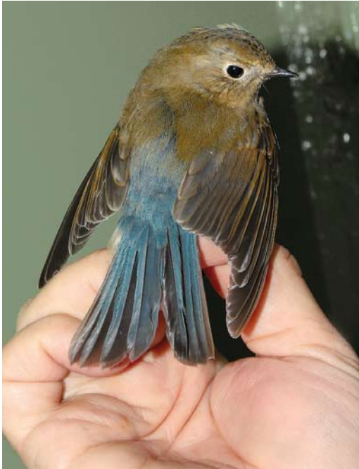
478 Red-flanked Bluetail / Blauwstaart Tarsiger cyanurus , first-year, Kennemerduinen, Bloemendaal, Noord-Holland, Netherlands, 31 October 2010