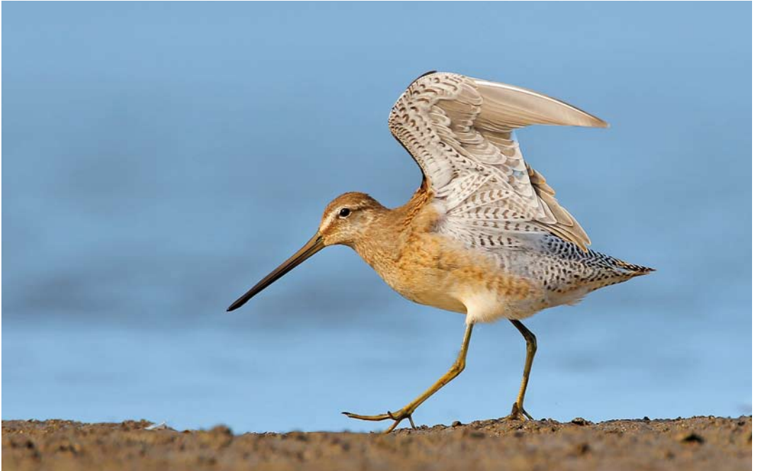
522 Long-billed Dowitcher / Grote Grijze Snip Limnodromus scolopaceus , Oborniki, Poznan, Poland, 4 October 2011