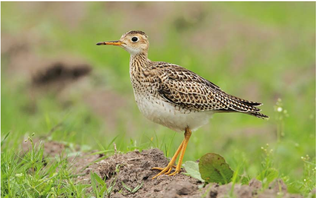
523 Upland Sandpiper / Bartrams Ruitter Bartramia longicauda , juvenile, St Mary's, Scilly, England, 10 October 2011