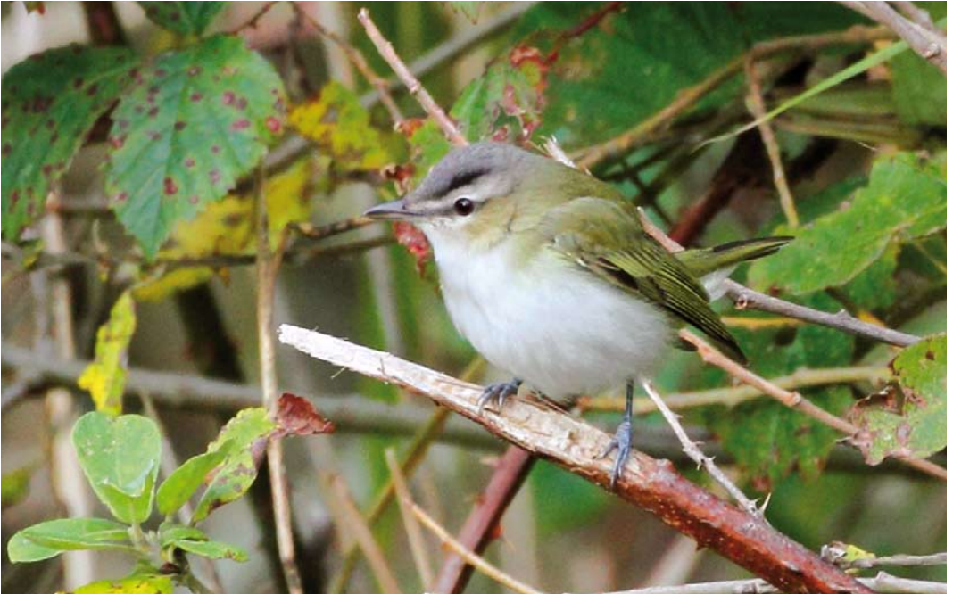
537 Red-eyed Vireo / Roodoogvireo Vireo olivaceus , Mandø, Ribe, Denmark, 20 October 2011