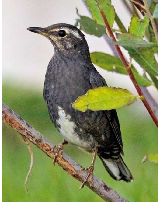
529 White's Thrush / Goudlijster Zoothera aurea , Heist, West-Vlaanderen, Belgium, 9 October 2011 ( Johan Buckens ) 530 Siberian Thrush / Siberische Lijster Geokichla sibirica , first-winter male, Røstlandet, Nordland, Norway, 26 October 2011 ( Thor Edgar Kristiansen ) 531 Siberian Rubythroat / Roodkeelnachtegaal Luscinia calliope , first-year male, Gulberwick, Mainland, Shetland, Scotland, 20 October 2011 ( Hugh Harrop )