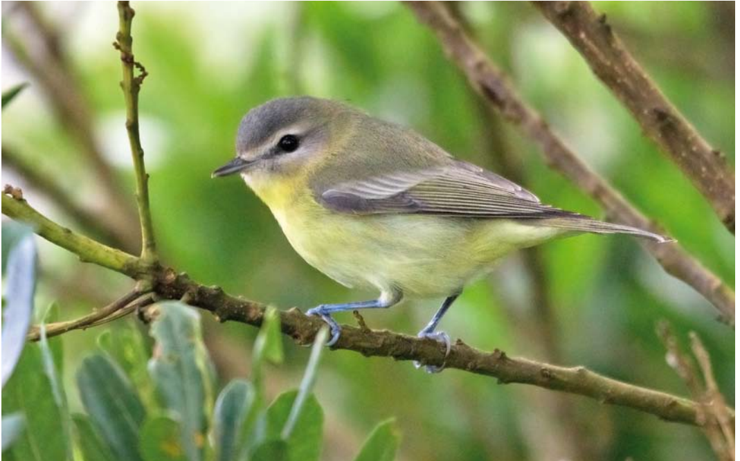
549 Philadelphia Vireo / Philadelphiavireo Vireo philadelphicus , Ribeira da Ponte, Corvo, Azores, 1 October 2011