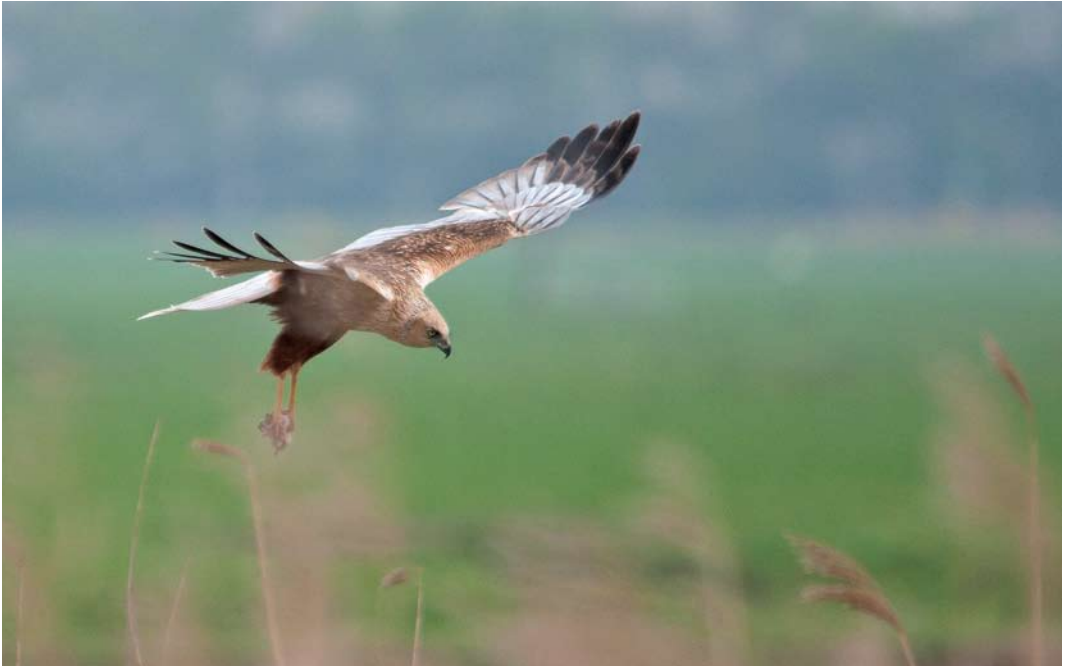
502 Western Marsh Harrier / Bruine Kiekendief Circus aeruginosus , adult male, Nijkerk, Gelderland, 6 April 2011. Note pale markings also visible on upside of primaries.

three such individuals were present in one general area in the Netherlands during a period of just a few years. Perhaps these concern birds from the same nest or from nests in different years of the same breeding pair. One may wonder if such birds are probably more common than expected but go unnoticed.