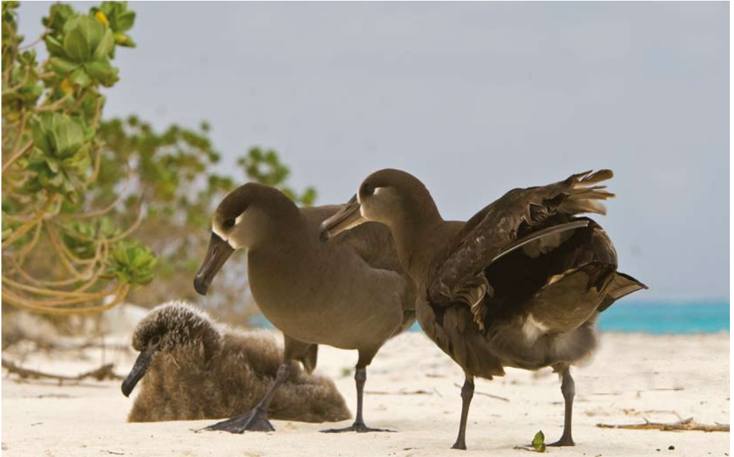
508 Black-footed Albatrosses / Zwartvoetalbatrossen Phoebastria nigripes , Midway Atoll, Hawaii, 11 April 2010