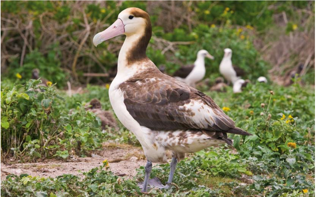
506 Short-tailed Albatross / Stellers Albatros Phoebastria albatrus , Midway Atoll, Hawaii, 8 April 2010