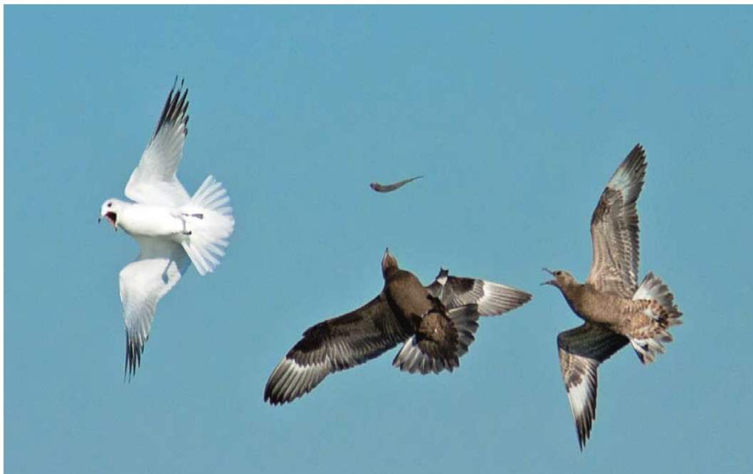
557 Kleine Jagers / Parasitic Jaegers Stercorarius parasiticus , adult en juveniel, met Stormmeeuw / Common Gull Larus canus canus , IJmuiden, Noord-Holland, 16 oktober 2011