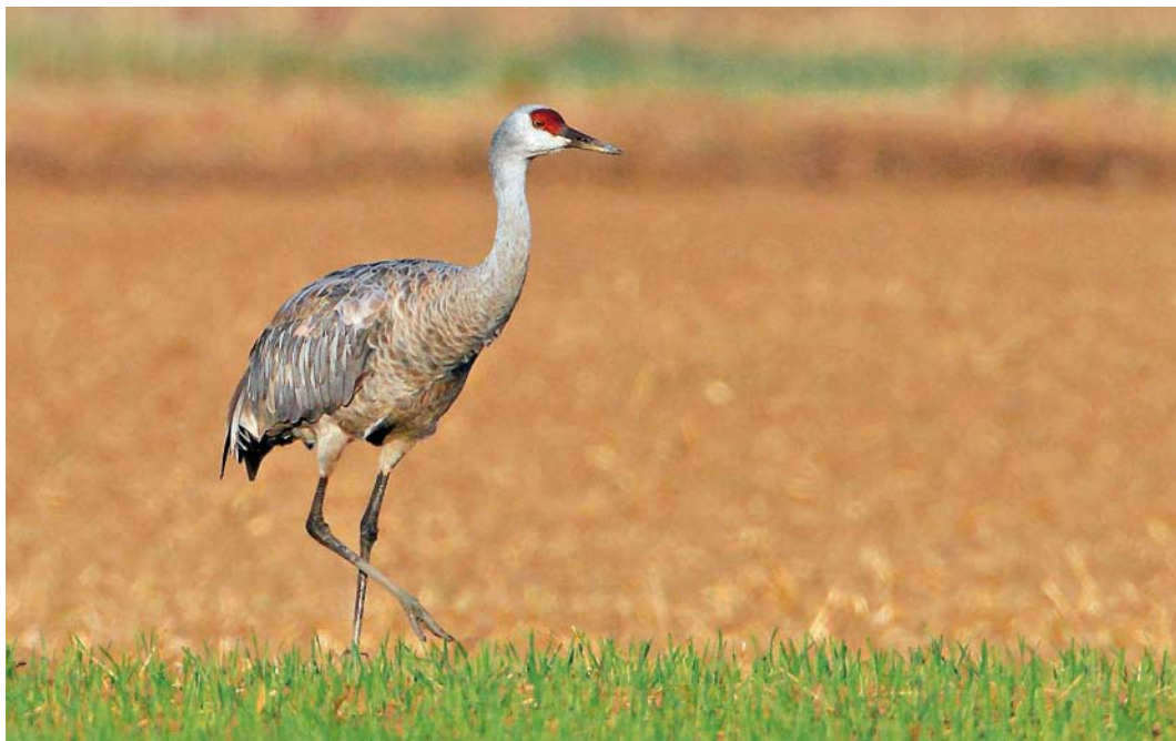
515 Sandhill Crane / Canadese Kraanvogel Grus canadensis , adult, Boyton Marshes, Suffolk, England, 2 October 2011