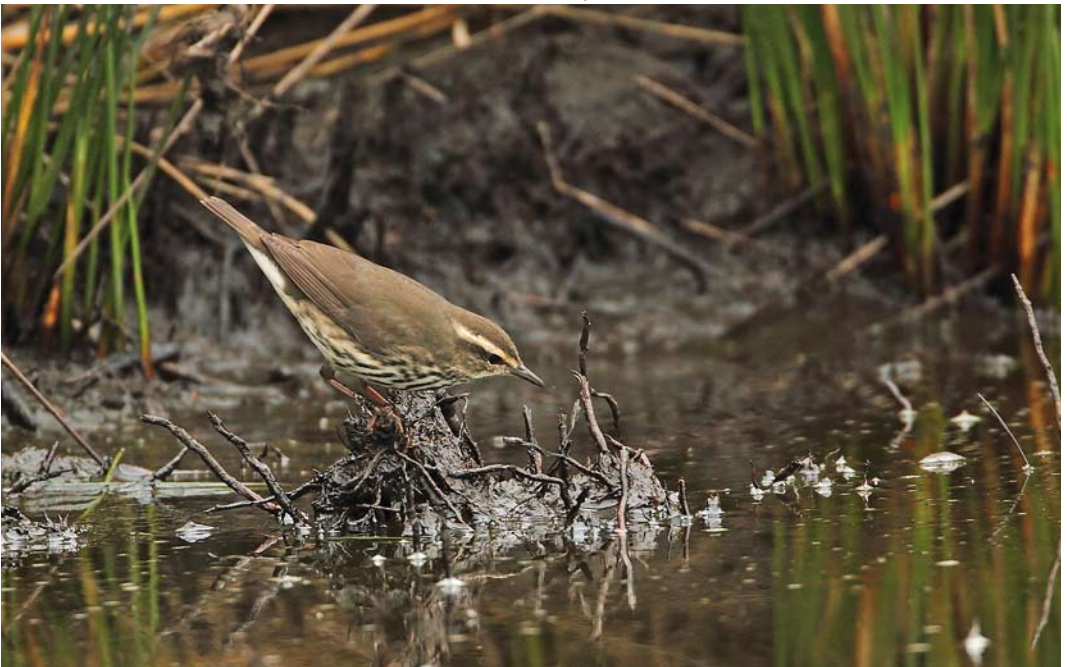
536 Northern Waterthrush / Noordse Waterlijster Parkesia noveboracensis , St Mary's, Scilly, England, 10 October 2011