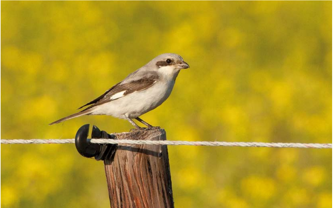
577 Kleine Klapekster / Lesser Grey Shrike Lanius minor , eerstejaars, Koudekerke, Zeeland, 23 oktober 2011