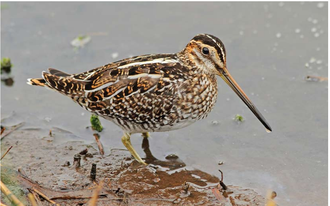
521 Wilson's Snipe / Amerikaanse Watersnip Gallinago delicata , St Mary's, Scilly, England, 10 October 2011