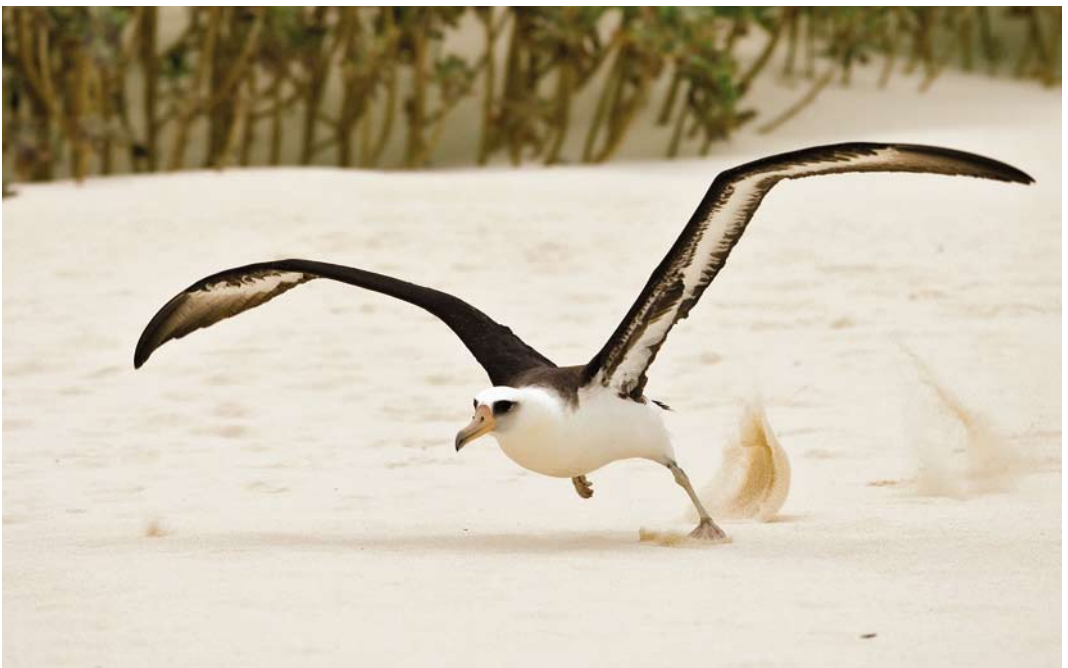
504 Laysan Albatross / Laysanalbatros Phoebastria immutabilis , Midway Atoll, Hawaii, 12 April 2010 (Otto Plantema)