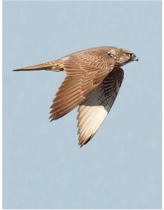
517-518 Gyr Falcon / Giervalk Falco rusticolus , first-year, Maagd van Gent, Oost-Vlaanderen, Belgium, 23 October 2011