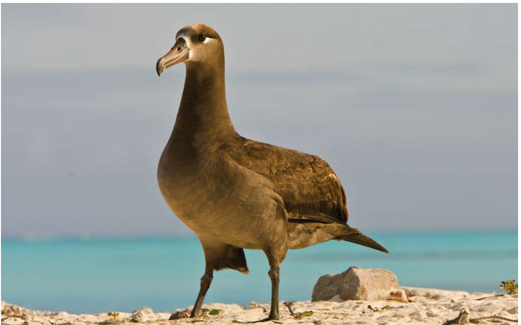
509 Black-footed Albatross / Zwartvoetalbatros Phoebastria nigripes , Midway Atoll, Hawaii, 9 April 2010 (Otto Plantema)