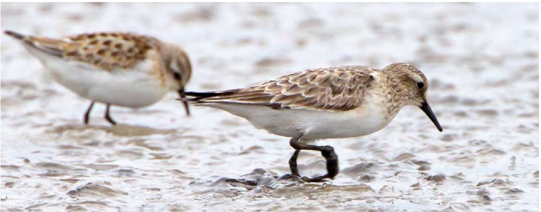
524 Purple Martin / Purperzwaluw Progne subis , Corvo, Azores, 13 October 2011 ( Rami Mizrachi ) 525 American Cliff Swallow / Amerikaanse Klifzwaluw Petrochelidon pyrrhonota , Corvo, Azores, 13 October 2011 ( Rami Mizrachi ) 526 Semipalmated Plover / Amerikaanse Bontbekplevier Charadrius semipalmatus , first-year, Ventry, Kerry, Ireland, 25 September 2011 ( Aidan G Kelly ) 527 Long-toed Stint / Taigastrandloper Calidris subminuta , first-winter, La Turballe, Loire-Atlantique, France, 6 November 2011 ( Aymeric Mousseau ) 528 Baird's Sandpiper / Bairds Strandloper Calidris bairdii , adult, Tienen, Vlaams-Brabant, Belgium, 20 September 2011 ( Fonny Schoeters )