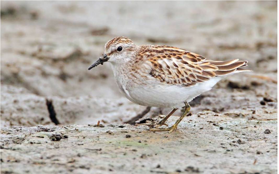
520 Least Sandpiper / Kleinste Strandloper Calidris minutilla , juvenile, Tresco, Scilly, England, 14 October 2011