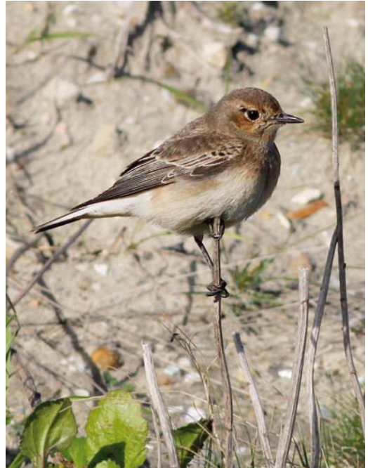
479 Pied Wheatear / Bonte Tapuit Oenanthe pleschanka , female, Westkapelle, Zeeland, 25 October 2010 ( Pim A Wolf )