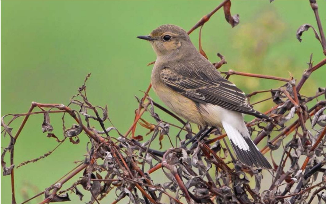
534 Pied Wheatear / Bonte Tapuit Oenanthe pleschanka , first-year, Doornzele, Oost-Vlaanderen, Belgium, 6 November 2011

many, on 21-22 October; at Liepaja, Latvia, on 23 October; at Oldbury-on-Severn, Gloucestershire, Wales, on 25-28 October (first-winter female); at Meijendel, Zuid-Holland, on 31 October; at Nordhasselvika, Vest-Agder, Norway, from 31 October to 2 November (female); and at Doornzele, Oost-Vlaanderen, from 5 November (first for Belgium). The autumn's first Desert Wheatears O. deserti were found at Balgö, Halland, Sweden, on 17 October; at Vuosaari, Helsinki, Finland, on 19 October; at Pilzen on 20 October (first for Czech Republic); at Immanen, Naantali, Finland, on 21 October; at Kungstenarna, Öland, Sweden, on 25 October; at Deerness, Orkney, on 29-31 October; at Pape, Rucava, on 29 October (third for Latvia); at Lista lighthouse, Vest-Agder, Norway, from 30 October to 1 November (male); at Hanstholm, Jylland, Denmark, from 30 October; and at Raabe on 31 October (18th for Finland). In the Netherlands, singles were seen at Camperduin, Noord-Holland, on 30-31 October; Burghsluis, Zeeland, from 10 November; and Krimpenerwaard from 12 November.