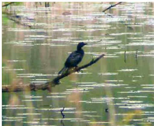
470 Pygmy Cormorant / Dwergaalscholver Phalacrocorax pygmeus , Ooijse Graaf, Ooijpolder, Gelderland, Netherlands, 12 May 2010

This is a date extension of a bird previously accepted for 25-30 April 1995 (van den Berg & Bosman 2001). This species is no longer considered since 1 January 2000 but the CDNA still welcomes reports from before this date.