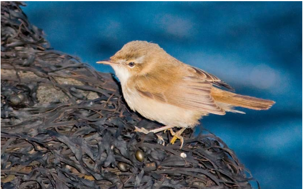
578 Veldrietzanger / Paddyfield Warbler Acrocephalus agricola , Hoek van Holland, Zuid-Holland, 15 oktober 2011