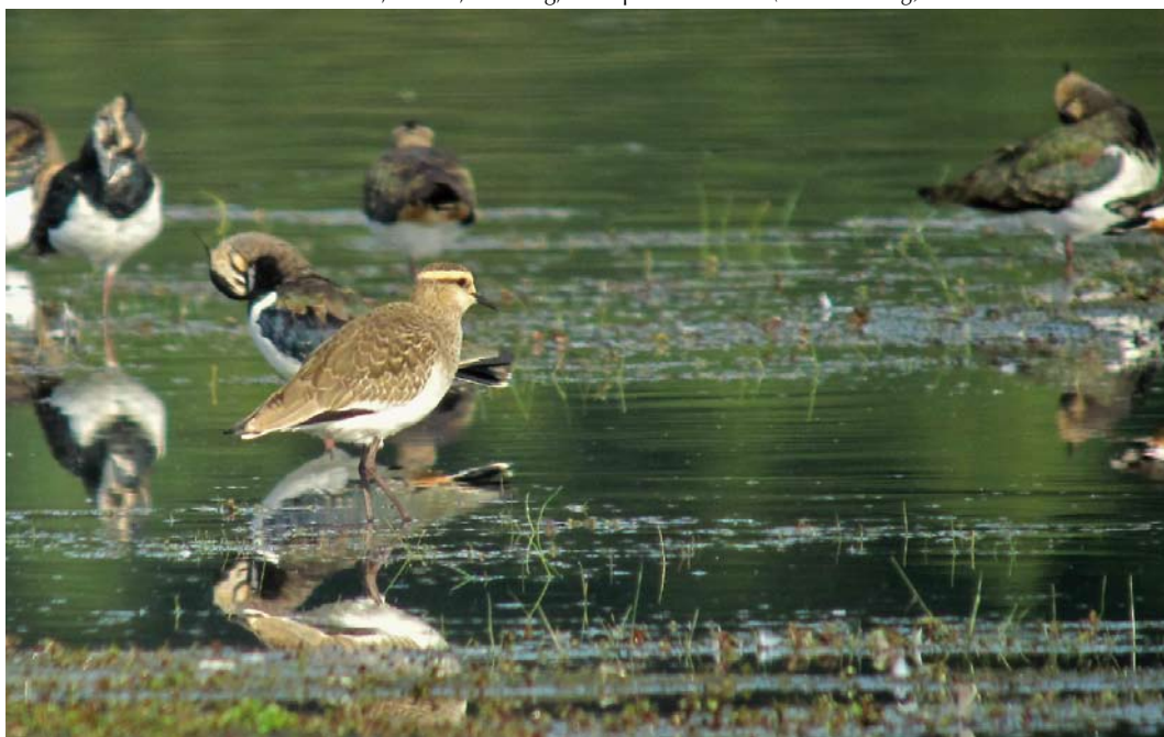
558 Steppekievit / Sociable Lapwing Vanellus gregarius , eerstejaars, met Kieviten / Northern Lapwings V. vanellus , Meerlebroek, Beesel, Limburg, 24 september 2011 (Ger de Hoog)