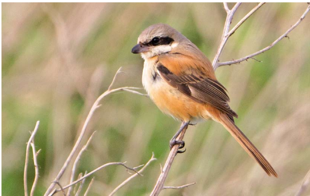
556 Langstaartklauwier / Long-tailed Shrike Lanius schach , eerstejaars, Den Helder, Noord-Holland, 31 oktober 2011