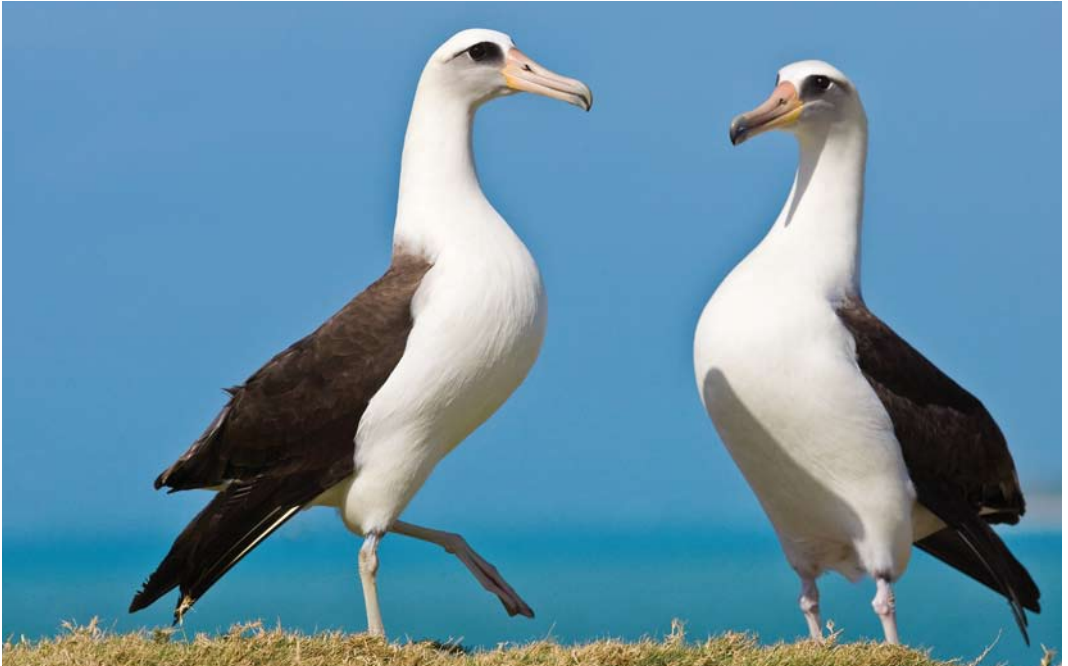
503 Laysan Albatrosses / Laysanalbatrossen Phoebastria immutabilis , Midway Atoll, Hawaii, 8 April 2010