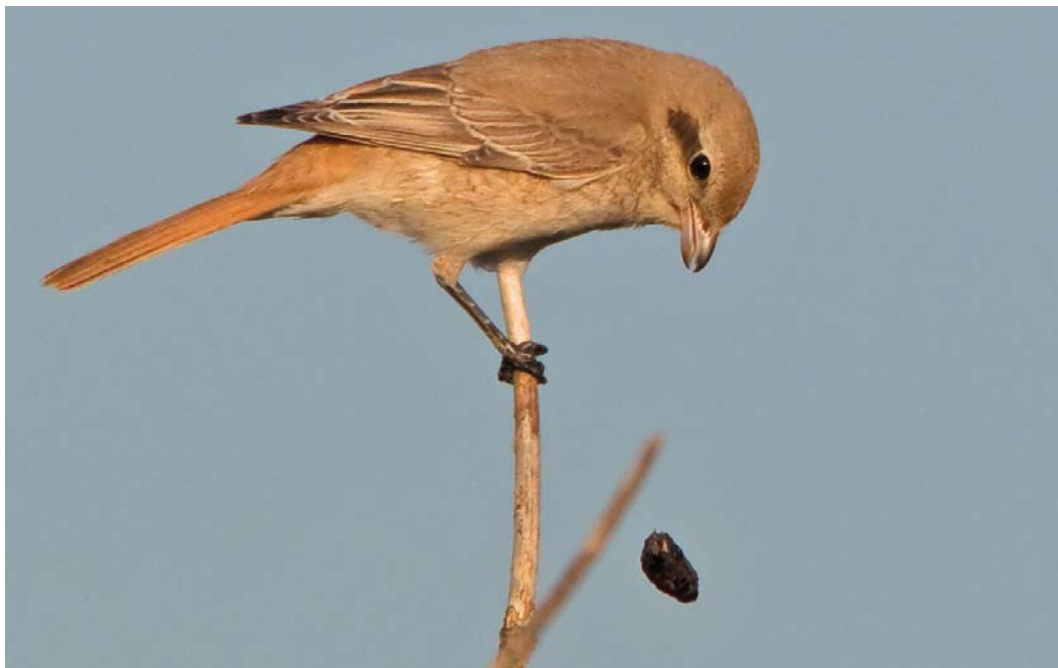
555 Daurische Klauwier / Daurian Shrike Lanius isabellinus , eerstejaars, De Nederlanden, Texel, Noord-Holland, 2 oktober 2011