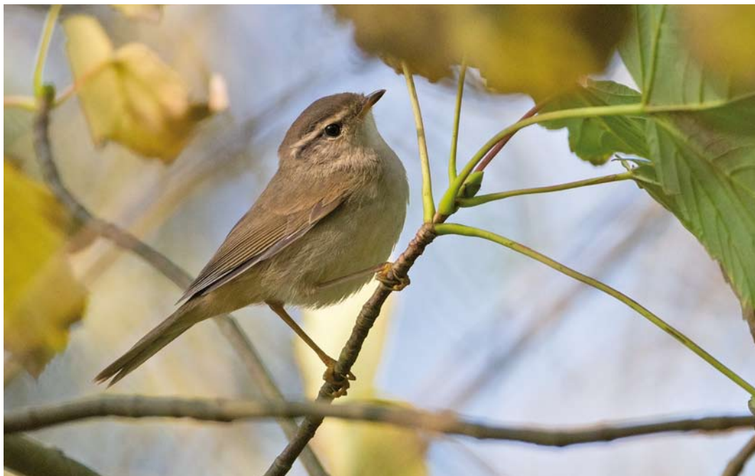
575 Raddes Boszanger / Radde's Warbler Phylloscopus schwarzi , Nieuwe Kooi, Vlieland, Friesland, 22 oktober 2011