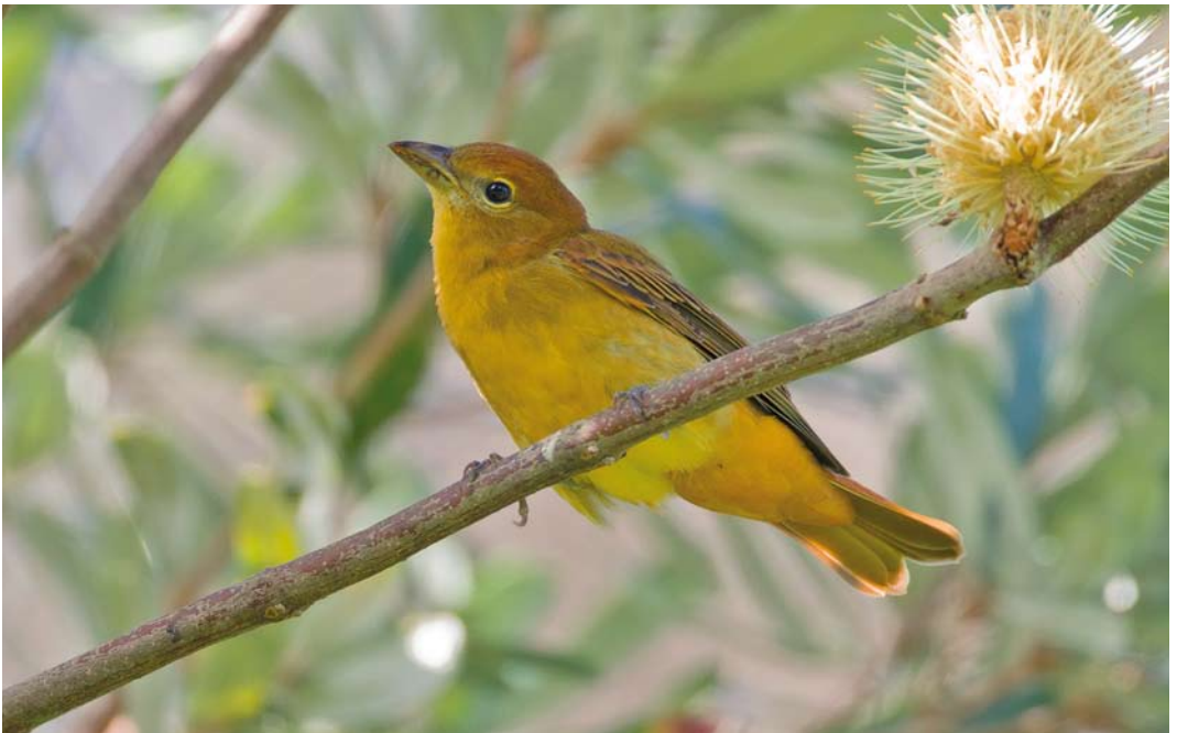
550 Summer Tanager / Zomertangare Piranga rubra , Corvo, Azores, 23 October 2011 (David Monticelli)