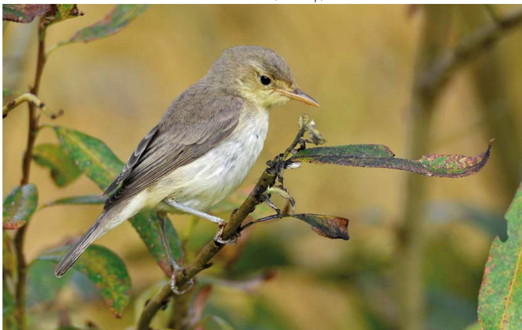
576 Orpheusspotvogel / Melodious Warbler Hippolais polyglotta , Robbenjager, Texel, Noord-Holland, 3 oktober 2011