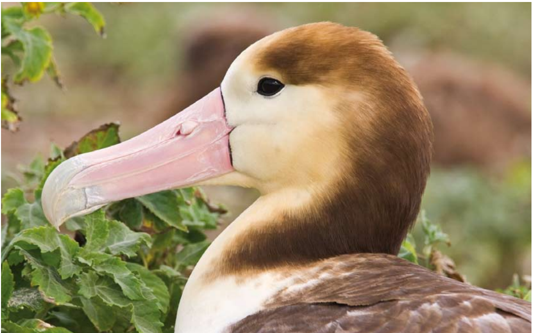
507 Short-tailed Albatross / Stellers Albatros Phoebastria albatrus , Midway Atoll, Hawaii, 11 April 2010