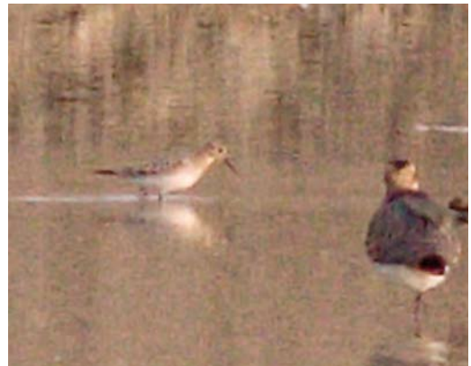
565 Steppekiekendief / Pallid Harrier Circus macrourus , juveniel mannetje, De Horde, Lopik, Utrecht, 2 oktober 2011 (Arjan Boele) 566 Steppekiekendief / Pallid Harrier Circus macrourus , juveniel, Rosmalen, Noord-Brabant, 6 september 2011 (Diederik Kok) 567 Grauwe Franjepoten / Red-necked Phalaropes Phalaropus lobatus en Rosse Franjepoot / Red Phalarope P. fulicarius , Rottumerplaat, Groningen, 18 september 2011 (Mark Zekhuis) 568 Bairds Strandloper / Baird's Sandpiper Calidris bairdii , juveniel, Rottekade, Zevenhuizen, Zuid-Holland, 25 September 2011 (Garry Bakker)

Egmond aan Zee, Noord-Holland, en op 28 oktober bij Huisduinen. Op 9 oktober werd een gekleurde Baltische Mantelmeeuw Larus fuscus fuscus (zwart J6V1) gezien bij Westkapelle; de vogel was als nestjong geringsd op 29 juli 2007 in Tranøy, Tromsø, Noorwegen. Vanaf 16 september werden op c zeven plekken langs de kust Grote Burgemeesters L. hyperboreus gezien; opvallend was dat het merendeel van de waarnemingen betrekking had op volwassen exemplaren. De laatste Reuzenster Hydroprogne caspia van het jaar vloog op 5 oktober langs Camperduin. De laatste Witvleugelster Chlidonias leucopterus van het jaar werd op 24 oktober gemeld bij Harlingen, Friesland. Op 24 september werd een exemplaar geringsd op De Kreupel, Noord-Holland. Zwarte Zeekoeten Cephus grylle werden gemeld op 30 september op Terschelling; op 1 oktober op Ameland, Friesland; op 5 oktober bij Petten; op 8 oktober bij Lauwersoog; op 16 oktober op Texel; op 17 oktober bij