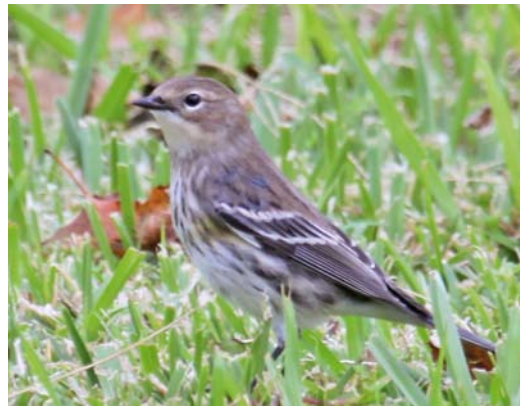
551 Tennessee Warbler / Tennesseezanger Oreothlypis peregrina , Corvo, Azores, 7 October 2011 (Vincent Legrand) 552 Dickcissel / Dickcissel Spiza americana , first-year male, Corvo, Azores, 26 September 2011 (Richard Ek) 553 Blue-winged Warbler / Blauwvleugelzanger Vermivora cyanoptera , Ribeira da Ponte, Corvo, Azores, 2 October 2011 (Vincent Legrand) 554 Yellow-rumped Warbler / Mirtzanger Setophaga coronata , Lagoa Azul, São Miguel, Azores, 30 October 2011 (Ton Eggenhuizen)

from 19 September to 7 October, on São Miguel on 16-24 October and on Santa Maria (two long-stayers); a Western Sandpiper C. mauri on Terceira on 15-19 September; a juvenile Hudsonian Whimbrel on Terceira through September-October; Upland Sandpipers on Flores on 5-24 October and 13 October; a Greater Yellowlegs on Flores on 22 October; and Solitary Sandpipers on Terceira on 19-21 September and on São Miguel on 25-29 September. A Laughing Gull L. atricilla was seen on Corvo on 23 October. On Corvo, single Yellow-billed Cuckoos were found on 20-24 October and 25 October. A Common Nighthawk Chordeiles minor was photographed on Flores on 13 October. A Chimney Swift Chaetura pelagica was present on Corvo on 21-26 October. The first to fifth Philadelphia Vireos V. philadelphia occurred on Corvo from 30 September to 4 October and on 1-8 October and on Flores on 5 October. Six Red-eyed Vireos were found on Corvo between 30 September and 18 October and one was