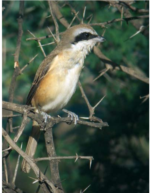
38 Snowy Owl / Sneeuwuil Bubo scandiacus , Uitkerke, West-Vlaanderen, Belgium, 29 December 2008 ( Filip De Ruwe ) 39 Brown Shrike / Bruine Klauwier Lanius cristatus cristatus , adult female, Ayn Hamran, Oman, 28 November 2008 ( Mattias Ullman ) 40 Snowy Owl / Sneeuwuil Bubo scandiacus , Uitkerke, West-Vlaanderen, Belgium, 29 December 2008 ( Filip De Ruwe )