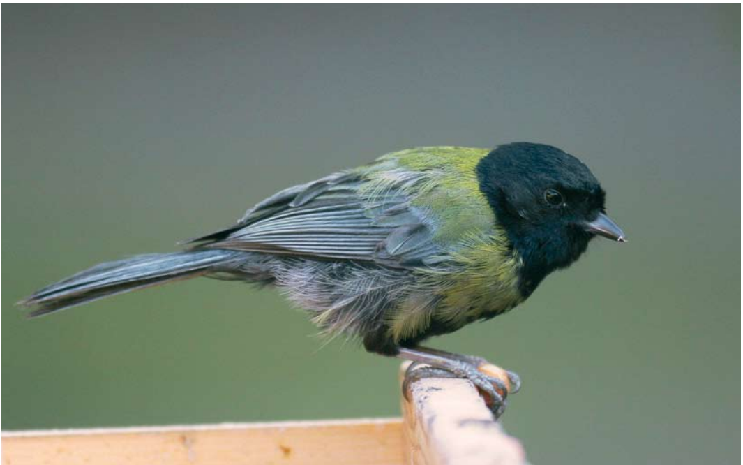
19 Koolmees / Great Tit Parus major, Rotterdam-Overschie, Zuid-Holland, 29 december 2008