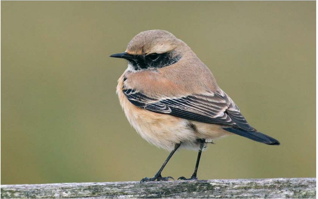
57 Woestijntapuit / Desert Wheatear Oenanthe deserti , mannetje, Schoorl, Noord-Holland, 12 november 2008 (Thomas Luiten)