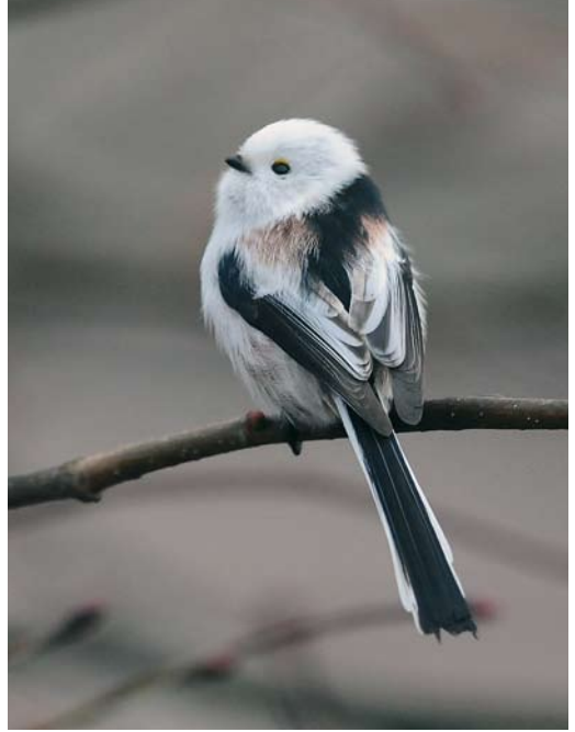
48 Witstuitbarmsijs / Arctic Redpoll Carduelis hornemanni , Acht, Noord-Brabant, 22 november 2008 49 Witkopstaartmees / White-headed Long-tailed Tit Aegithalos caudatus caudatus , Pieterzijl, Groningen, 21 december 2008 50 Beflijster / Ring Ouzel Turdus torquatus , mannetje, Berkheide, Zuid-Holland, 30 december 2008