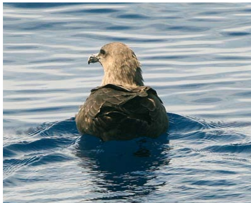
10 South Polar/Brown Skua / Zuidpooljager/ Subantarctische Grote Jager Stercorarius maccormicki/antarcticus , off La Palma, Canary Islands, 6 October 2005