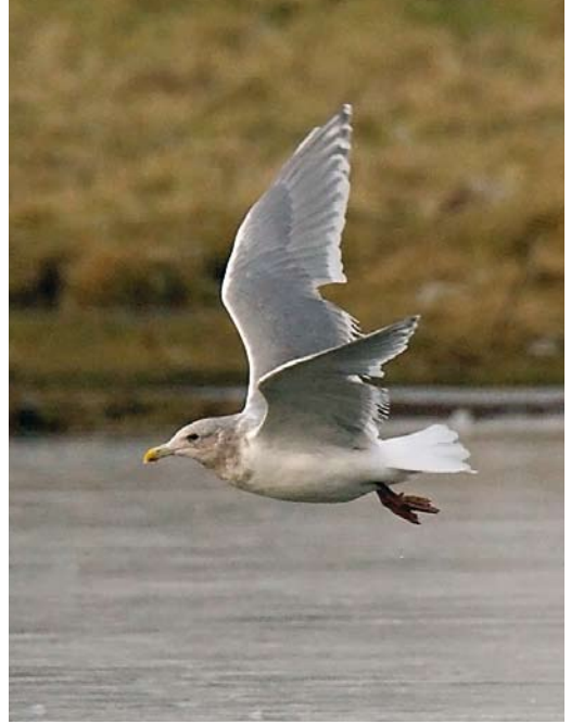
35 Green Heron / Groene Reiger Butorides virescens , adult, Berre l'Étang, Bouches-du-Rhône, France, 29 December 2008 36 Glaucous-winged Gull / Beringmeeuw Larus glaucescens , adult, Cowpen Bewley, Cleveland, England, 10 January 2009 37 Ivory Gull / Ivoormeeuw Pagophila eburnea , first-year, Simrishamn, Skåne, Sweden, 13 December 2008