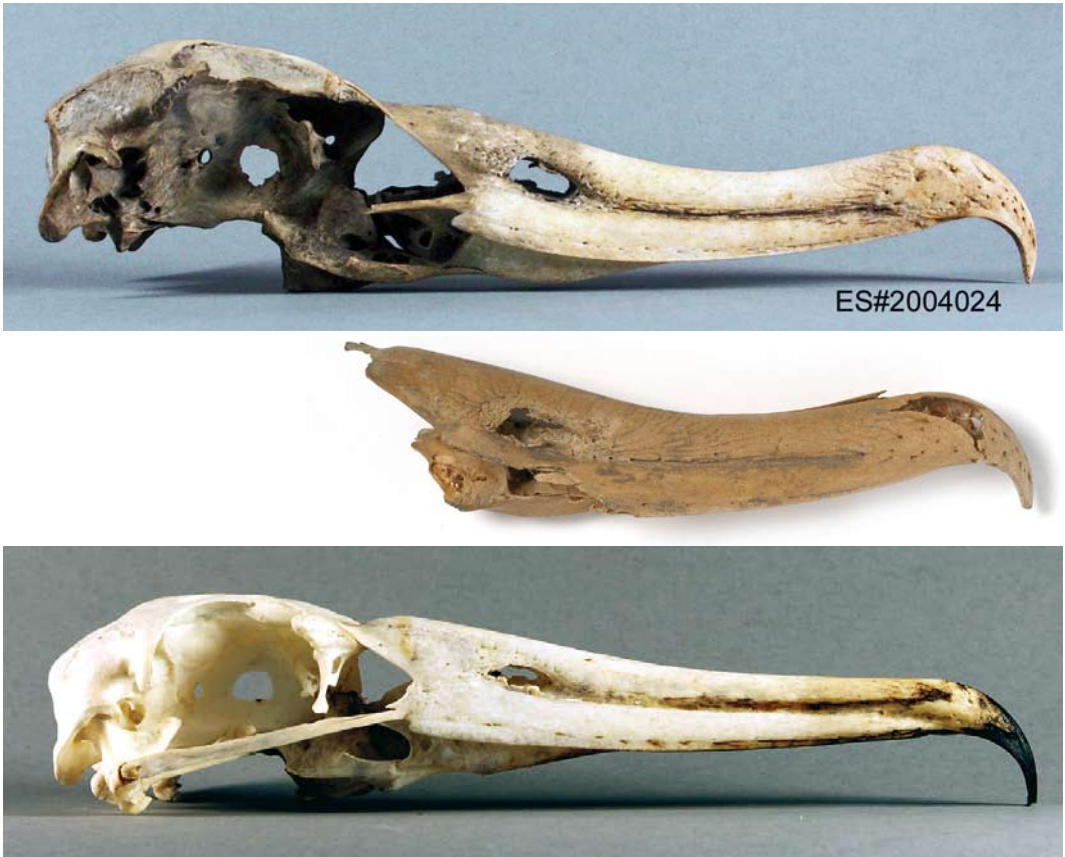
FIGURE 2 Mandible of Diomedea albatross found in Amsterdam, Noord-Holland, Netherlands, on 19 October 1977 (middle) compared with similarly sized bills (brain case and upper mandible only) of Wandering Albatross Diomedea exulans (top) and Waved Albatross Phoebastria irrorata (bottom) (Edward Soldaat (top and bottom) and Wiard Krook (centre)). Note different profiles: clearly curved in Diomedea and much straighter in Phoebastria . Phoebastria also has more delicate bill-tip than Diomedea .

C14 from pools in which C14 may have circulated for a long time. As a result, deviations of up to 400 years make this method useless for recent marine top predators. Therefore, dating the bill by analyzing the local circumstances seems the most realistic approach. However, location MC6 is problematic in this respect. The old harbour front has been filled up with refuse, and the 20th century digging did not produce a clear stratigraphy. Only artifacts from the second half of the 15th century and from the 19th century were found (Wiard Krook in litt) and artifacts from the centuries in between were lacking. As pointed out below, it is very likely that the albatross bill belonged to a bird that was caught by a sailor or ship passenger and discarded in the harbour directly, or that it ended up in town