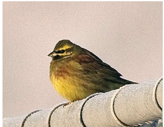
29 Iceland Gull / Kleine Burgemeester Larus glaucooides , first-year, Villa Real de Santo Antonio, Portugal, 4 January 2009 30 Franklin's Gull / Franklins Meeuw Larus pipixcan , Étang d'Entressens, Bouches-du-Rhône, France, 30 December 2008 31 Glaucous-winged Gull / Beringmeeuw Larus glaucescens , adult, Cowpen Bewley, Cleveland, England, 10 January 2009 32 Slaty-backed Gull / Kamtsjatkameeuw Larus schistisagus , adult, Klaipeda, Lietuva, Lithuania, 17 November 2008 33 Naumann's Thrush / Naumanns Lijster Turdus naumanni , Neiden, Sor-Varanger, Norway, 11 December 2008 34 Cirl Bunting / Cirlgors Emberiza cirlus , male, Doelpolder, Oost-Vlaanderen, Belgium, 10 January 2009