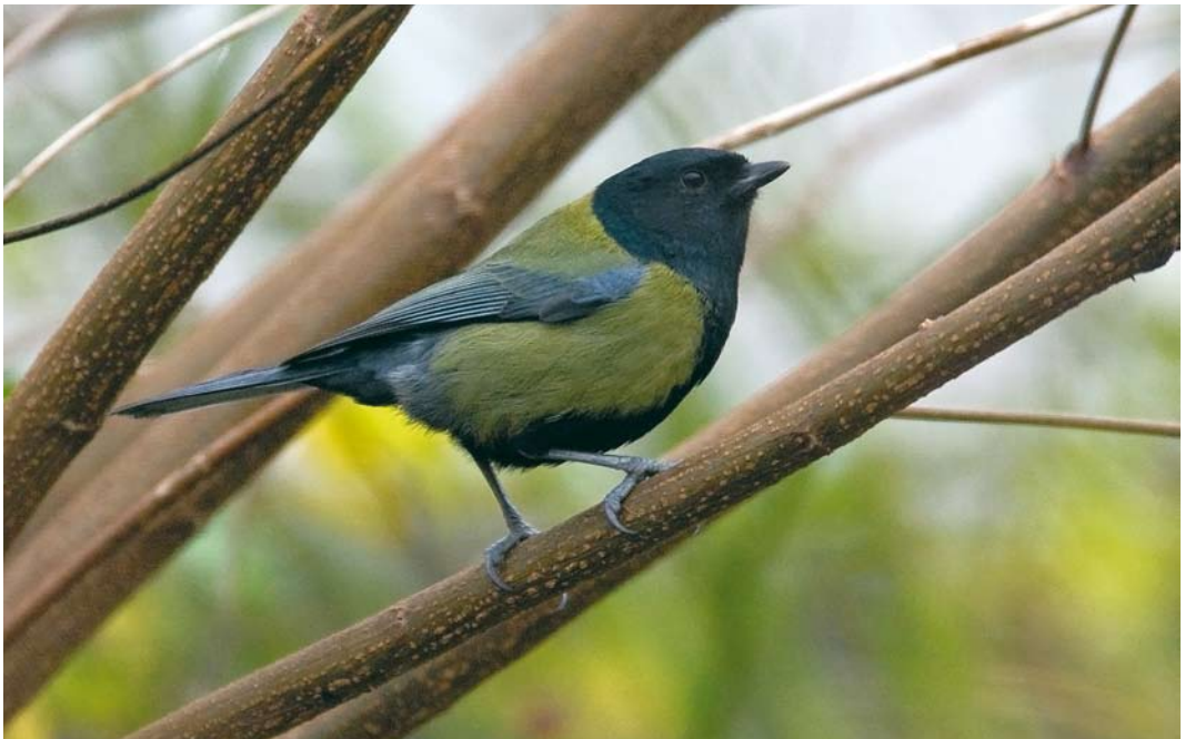
18 Koolmees / Great Tit Parus major , Krimpen aan den IJssel, Zuid-Holland, 29 november 2008 (Harvey van Diek)

Naar aanleiding van de waarneming in Krimpen aan den IJssel meldde Chris van Rijswijk (in litt) dat een vergelijkbare 'Zwartkopkoolmees' al drie winters lang (2006/07 tot 2008/09) dagelijks de tuin van zijn ouders bezoekt in Rotterdam-Overschie, Zuid-Holland (c 15 km van Krimpen aan den IJssel). Het verenkleed lijkt sterk op dat