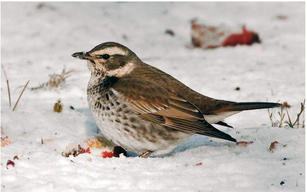
67 Dusky Thrush / Bruine Lijster Turdus eunomus , first-winter, Ezerée, Luxembourg, Belgium, 9 January 2009 (Roland Jansen)