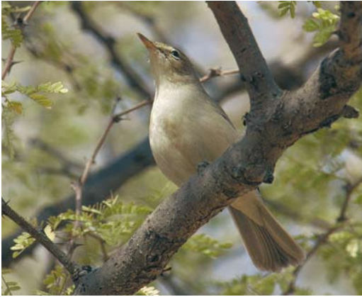
23 Sykes's Warbler / Sykes' Spotvogel Acrocephalus rama , Pushkar, Rajasthan, India, 6 January 2008 (Sander Lagerveld)