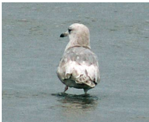
1-6 Kumliens Meeuw / Kumlien's Gull Larus glaucooides kumlieni , tweede-winter, West aan Zee, Terschelling, Friesland, 30 januari 2005 (Martijn Bunskoek)