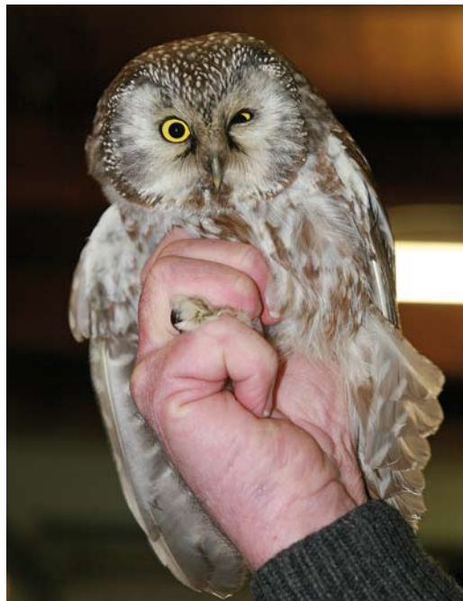
45 Koereiger / Cattle Egret Bubulcus ibis , Schiedam, Zuid-Holland, 22 december 2008 46 Ruigpootuil / Boreal Owl Aegolius funereus (gevonden in Heino, Overijssel, op 16 december 2008), Beerzerveld, Overijssel, 17 december 2008 47 Kleine Burgemeester / Iceland Gull Larus glaucoides , eerstejaars, Den Helder, Noord-Holland, 27 december 2008