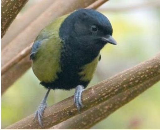
20 Koolmees / Great Tit Parus major , Krimpen aan den IJssel, Zuid-Holland, 29 november 2008