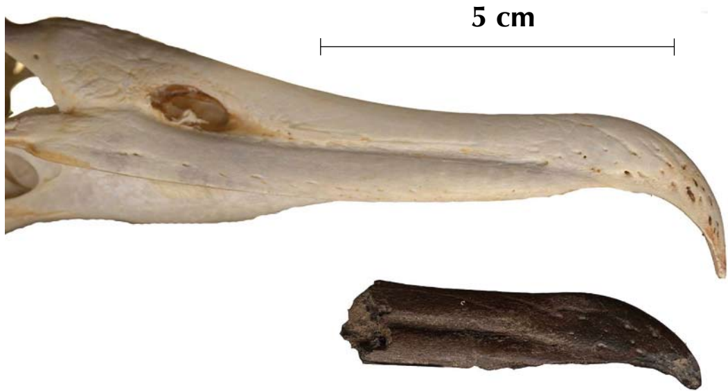
FIGURE 3 Bill-tip of Phoebastria albatross (lower), discovered among many fossil bones from late Neogene (supposedly Pliocene) deposits at Mill, Noord-Brabant, Netherlands (Erik Wijnker). Specimen is kept in Prehistoric Times Museum (Oertijdmuseum 'De Groene Poort'), Boxtel, Noord-Brabant, Netherlands (# MAB F3399). See also Olson & Hearty (2003, figure 3A) for similar fossil Phoebastria bill-tip found on Bermuda. Upper mandible (without ramphotheca) of modern Black-footed Albatross Phoebastria nigripes included for comparison.

stantial evidence, the most likely period for this bill to originate from is the early 17th century until 1876, when the old harbour front was filled up.