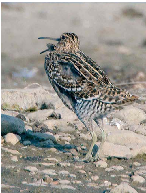
227 Caspian Plover / Kaspische Plevier Charadrius asiaticus , adult male, Yotvata, Israel, 11 April 2007 ( Kris De Rouck ) 228 Great Snipe / Poelsnip Gallinago media , Elen, Limburg, Belgium, 5 May 2007 ( Ran Schols ) 229 Caspian Plovers / Kaspische Plevieren Charadrius asiaticus , Yotvata, Israel, 11 April 2007 ( Kris De Rouck )