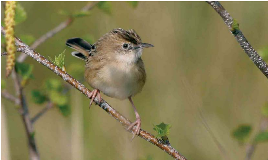
265 Graszanger / Zitting Cisticola juncidis , Oostende, West-Vlaanderen, 2 april 2007

RALLEN TOT STERNS Vanaf 24 april riep een mannetje Klein Waterhoen Porzana parva in De Blankaart in Woumen maar de vogel werd slechts sporadisch gehoord. We ontvingen waarnemingen van meer dan 14 000 Kraanvogels Grus grus , waarvan alleen al op 4 maart 8462 over de Hoge Venen, Liège. De trekpieken lagen gespreid over de hele periode. Bij Ragnies, Hainaut, werd op 29 april een Griël Burhinus oedipus gezien. Na 5 april verschenen Steltkluten Himantopus himantopus in Adinkerke, West-Vlaanderen; Doel; Kalmthout; Stuivekenskerke; in de Uitkerkse Polders, West-Vlaanderen (drie); in Warneton, Hainaut; en in Zeebrugge (twee). Op 30 april pleisterde de eerste Morinelplevier Charadrius morinellus voor dit voorjaar in Clermont, Liège, en op 30 april trok er één over de Kalmthoutse Heide. Een Poelsnip Gallinago media werd op 13 april gemeld bij Tournai, Hainaut. Op 29 april verschenen twee Poelruiters Tringa stagnatilis langs de Maas bij Elen, Limburg, en één in Het Zwin in Knokke. Op 30 april verbleef er één in de Achterhaven van Zeebrugge. Op zijn minst verrassend was de Grote