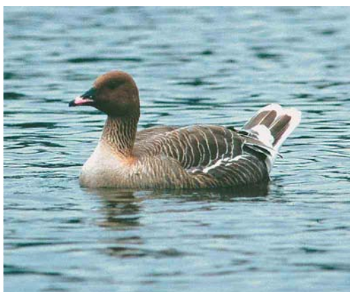
218 Black-browed Albatross / Wenkbrauwwalbatros Thalassarche melanophris , adult, Sula Sgeir, Outer Hebrides, Scotland, 9 May 2007 219 Squacco Heron / Ralreiger Ardeola ralloides , Boavista, Cape Verde Islands, 5 April 2007 220 Baltic Gull / Baltische Mantelmeeuw Larus fuscus fuscus , fourth calendar-year, Hempsted, Gloucestershire, England, April 2007 221 Spotted Sandpiper / Amerikaanse Oeverloper Actitis macularius , adult, Lugar de Baixo, Madeira, 30 April 2007 222 Taiga Bean Goose / Taigarietgans Anser fabalis , Eilat, Israel, April 2007 223 Pink-footed Goose / Kleine Rietgans Anser brachyrhynchus , Golfo di Oristano, Sardinia, Italy, 13 February 2007