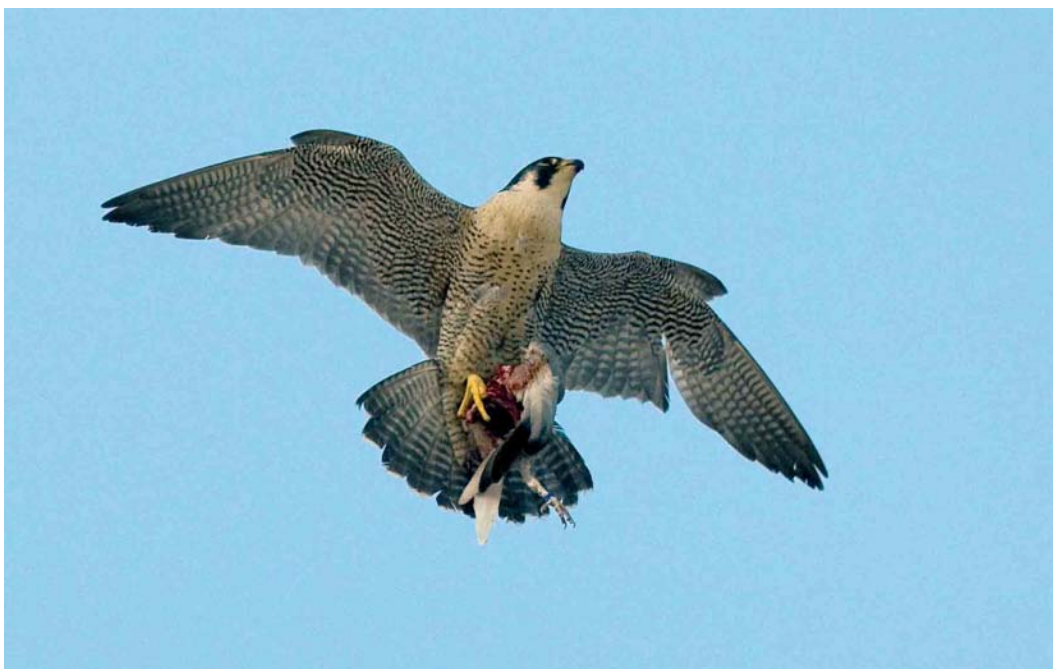
256 Slechtvalk / Peregrine Falcon Falco peregrinus, vrouwtje (broedde in 1999-2005 in Nijmegen, Gelderland), Deventer, Overijssel, 2 mei 2007 257 Steppekiekendief / Pallid Harrier Circus macrourus, onvolwassen mannetje, Strabrechtse Heide, Noord-Brabant, 26 april 2007 258 Grote Aalscholver / Atlantic Great Cormorant Phalacrocorax carbo carbo, Engelermeer, Noord-Brabant, 23 maart 2007