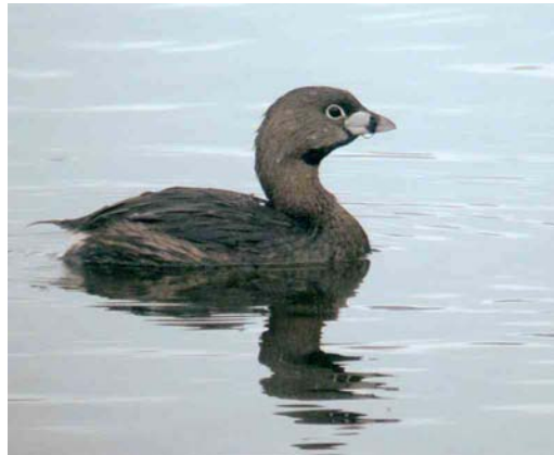
239 Long-tailed Shrike / Langstaartklauwier Lanius schach , Sulaibikhat, Kuwait, 3 April 2007 240 Horned Lark / Strandleeuwerik Eremophila alpestris , Koralpe, Kärnten, Austria, 29 April 2007 241 White-throated Robin / Perzische Roodborst Irania gutturalis , male, Greco cape, Cyprus, 24 April 2007 242 Pied-billed Grebe / Dikbekfuut Podilymbus podiceps , San Andrés reservoir, Serin, Asturias, Spain, 29 April 2007

later on 1 April. Another was present on Out Skerries, Shetland, on 2-3 April. In Cyprus, a male White-throated Robin Irania gutturalis was photographed at the Greco cape on 24 April. In early April, a second calendar-year male hybrid Black x Common Redstart Phoenicurus ochruros x phoenicurus was photographed on Lampedusa, Sicily; in Belgium, one was singing at Kalmthout, Antwerpen, on 27 April. A male Moussier's Redstart P. moussieri was reported at El Acebuche, Doñana, Huelva, Spain, on 8 April. In early May, hybrids Pied x Eastern Black-eared Wheatear Oenanthe pleschanka x melanoleuca were again photographed at Kaliakra, Bulgaria; more than 10 years ago, these hybrids, also present at Emona and Varna, Bulgaria, and in Romania, were reported as Finsch's Wheatear O. finschii (cf DB 15: 183, 234, 1993, 16: 164, 1994, 27: 281, 2005). In Scotland, a Western Black-eared Wheatear O. hispanica turned up on Argyll on 12 April.