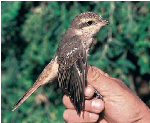
Mystery photograph V (September)