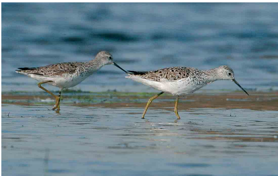
247 Poelruiters / Marsh Sandpipers Tringa stagnatilis , De Hamert, Limburg, 24 april 2007