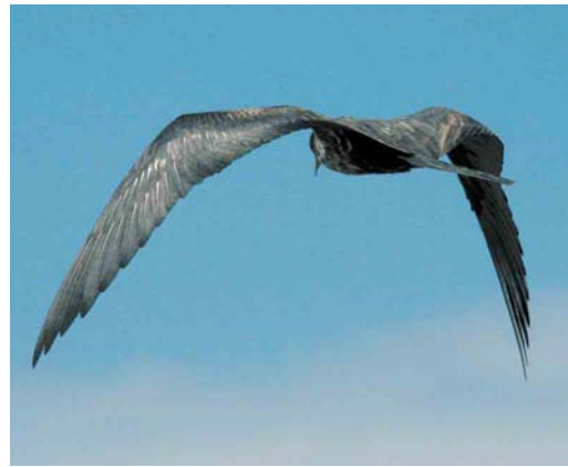
Mystery photograph VI (December)

names of all entrants with at least one correct identification can be viewed at www.dutchbirding.nl .