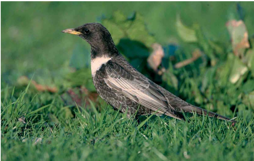
260 Beflijster / Ring Ouzel Turdus torquatus , mannetje, Hensbroek, Noord-Holland, 15 april 2007 (Hans Brinks)