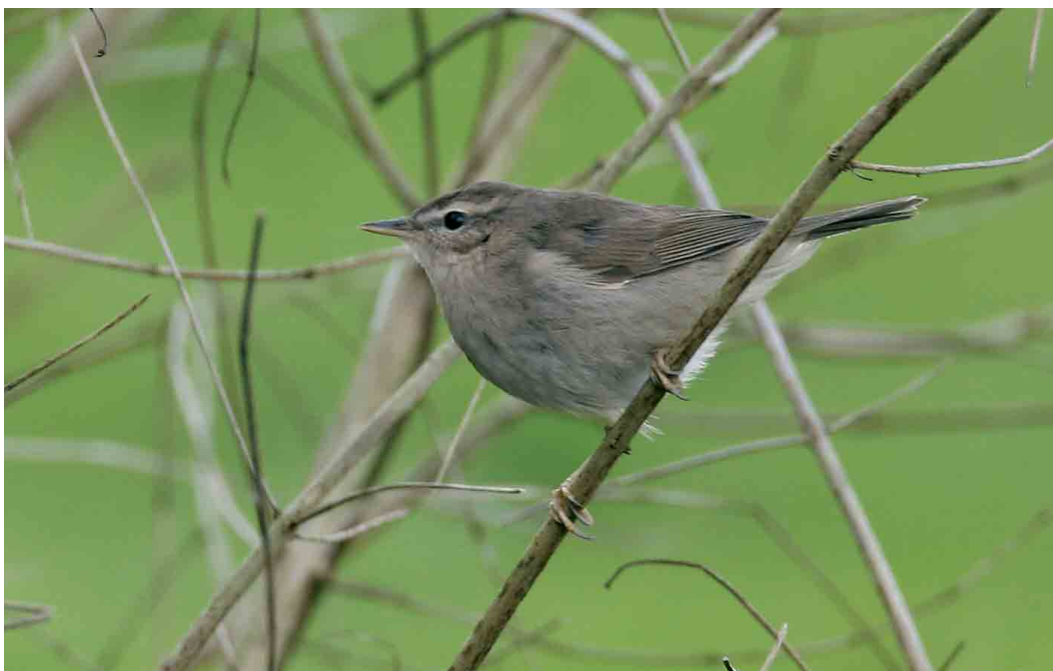
261 Bruine Boszanger / Dusky Warbler Phylloscopus fuscatus , Electra, Groningen, 15 maart 2007 (Mark Schuurman)