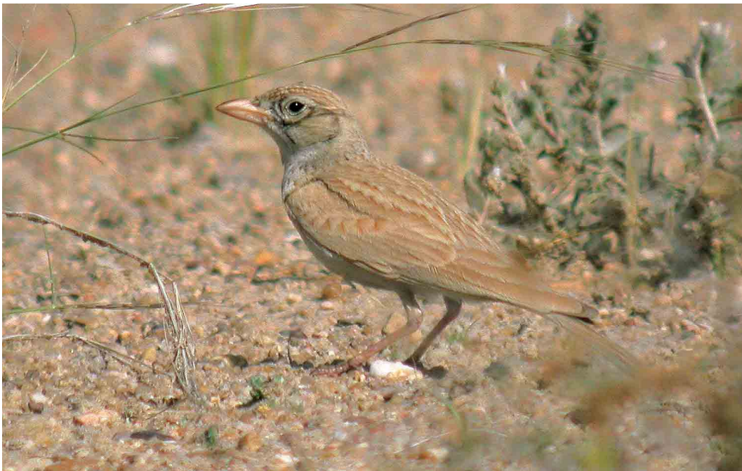
238 Dunn's Lark / Dunns Leeuwerik Eremalauda dunnii , Sabah Al-Ahmad reserve, Kuwait, 7 April 2007