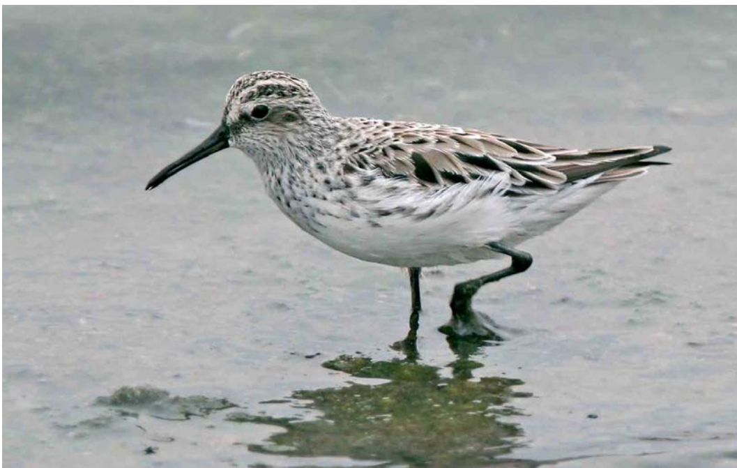
231 Broad-billed Sandpiper / Breedbekstrandloper Limicola falcinellus , K20, Eilat, Israel, 13 April 2007