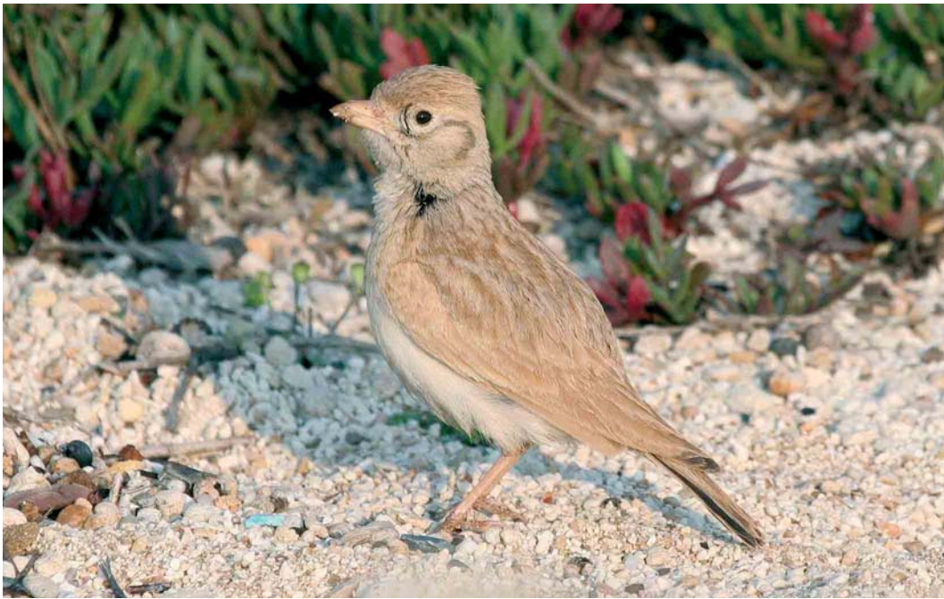
237 Dunn's Lark / Dunns Leeuwerik Eremalauda dunnii , Ayia Napa, Cyprus, 10 April 2007 (Theodoulos Poullis)