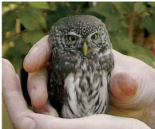
207 Dwerguil / Eurasian Pygmy Owl Glaucidium passerinum , Sumarreheide, Friesland, 4 oktober 2002 (Jan Deinum)

Dwerguil is de kleinste Europese uil en ongeveer zo groot als een Spreeuw Sturnus vulgaris , met een gewicht van 55-85 g. De donkere staart (op de videobeelden niet zichtbaar) is vrij lang en heeft vijf lichte dwarsbanden. Het geslacht Glaucidium bevat 29 andere soorten die voorkomen in tropisch Afrika, Amerika en Zuid-Azië; Dwerguil is de enige vertegenwoordiger van dit geslacht in Europa en de rest van het Palearctische gebied (König et al 1999). Voor het onderscheid met andere kleine uilensoorten die als ontsnapte vogel in Nederland zouden kunnen voorkomen (hoewel daar geen voorbeelden van bekend zijn) wordt verwezen naar König et al (1999). Dankzij het feit dat van de vogel van Sumarreheide videobeelden in de hand zijn gemaakt, kunnen een paar soortspecifieke details worden vastgesteld die Dwerguil onderscheiden van andere Glaucidium -soorten. Met name een aantal Amerikaanse Glaucidium -soorten is wat verkleed en kleur van de naakte delen betreft vrijwel identiek aan Dwerguil, zoals Noord-Amerikaanse Dwerguil G. californicum en Midden-Amerikaanse Dwerguil G. gnoma . Voor alle Amerikaanse Glaucidium -soorten geldt dat de naakte huid rond de twee neusgaten is opgezwollen, zodat duidelijk zichtbare bultjes ontstaan. Bij Dwerguil zijn deze 'zwellingen' afwezig of in ieder geval minder sterk aanwezig. Op de