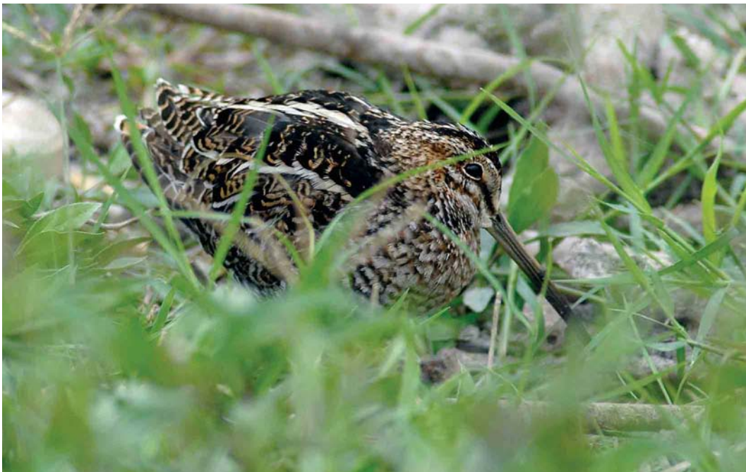
215 Wilson's Snipe / Amerikaanse Watersnip Gallinago delicata , Barragem de Poilão, Santiago, Cape Verde Islands, 26 March 2007