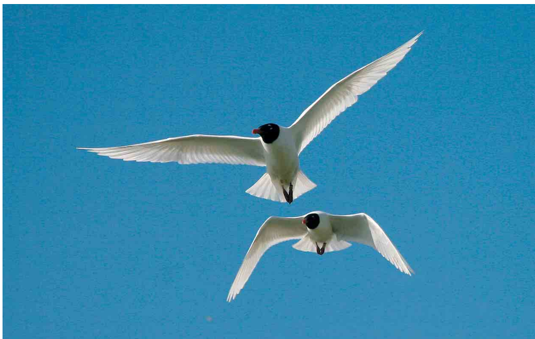
246 Zwartkopmeeuwen / Mediterranean Gulls Larus melanocephalus , adult, Zuidgors, Ellewoutsdijk, Zeeland, 3 mei 2007 (Pim A Wolf)