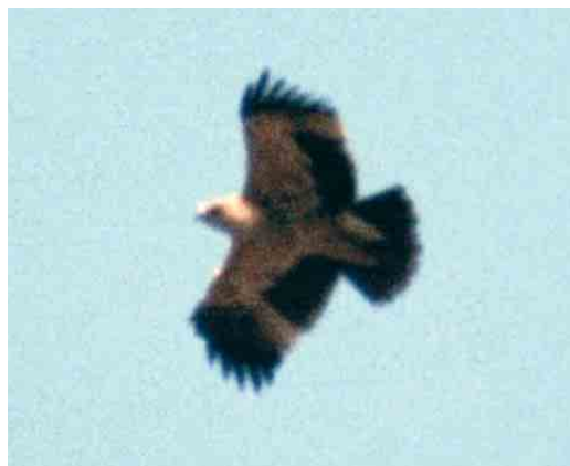
201-206 Keizerarend / Eastern Imperial Eagle Aquila heliaca , derde-kalenderjaar, Kamperhoek, Flevoland, 3 april 2005