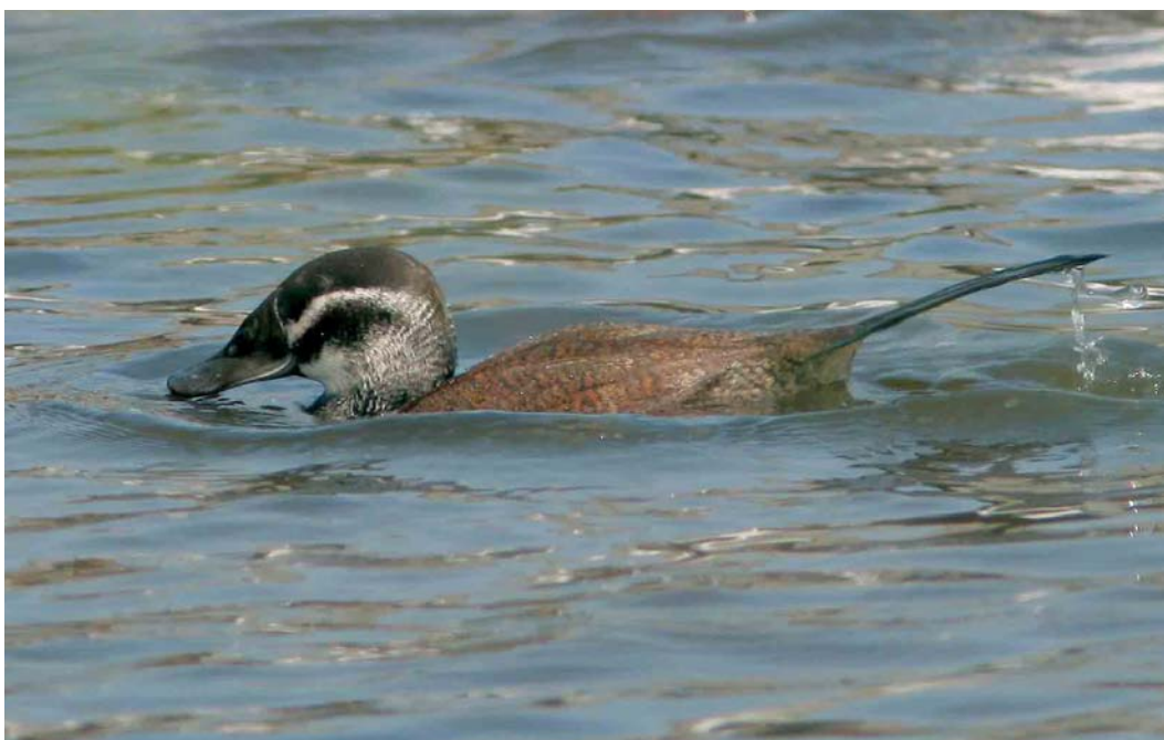
245 Witkopeend / White-headed Duck Oxyura leucocephala , vrouwtje, Starrevaart, Leidschendam, Zuid-Holland, 6 april 2007 (Ellen de Lange)