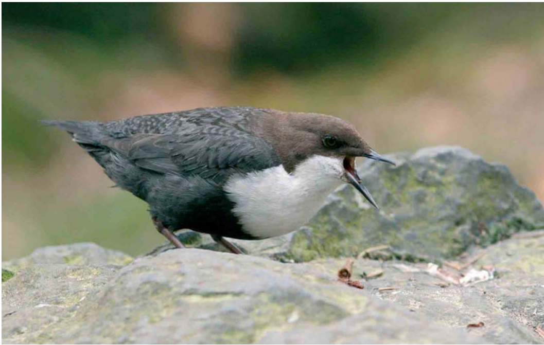
259 Zwartbuikwaterspreeuw / Black-bellied Dipper Cinclus cinclus cinclus , Beekhuizen, Gelderland, 11 april 2007