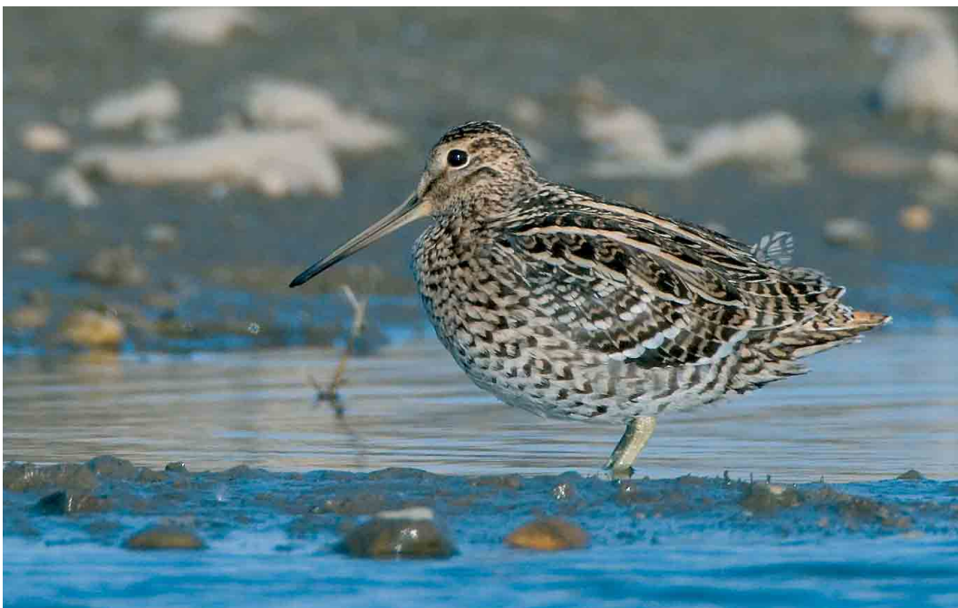
217 Great Snipe / Poelsnip Gallinago media , Elen, Limburg, Belgium, 5 May 2007