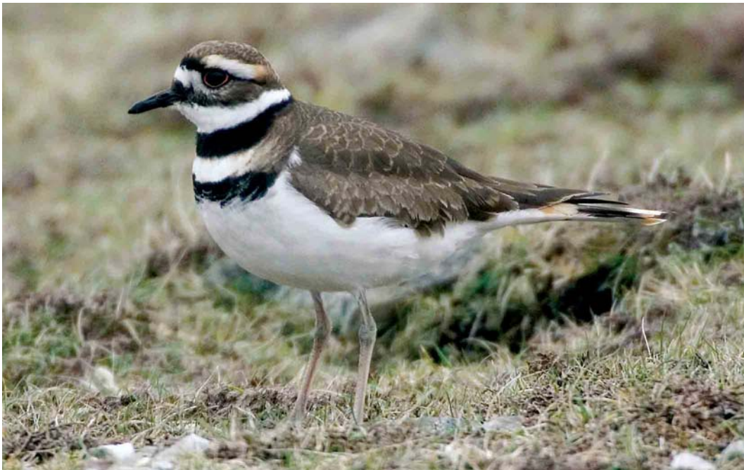
216 Killdeer / Killdeerplevier Charadrius vociferus , Banna Minn, Mainland, Shetland, Scotland, 22 April 2007 (Hugh Harrop)