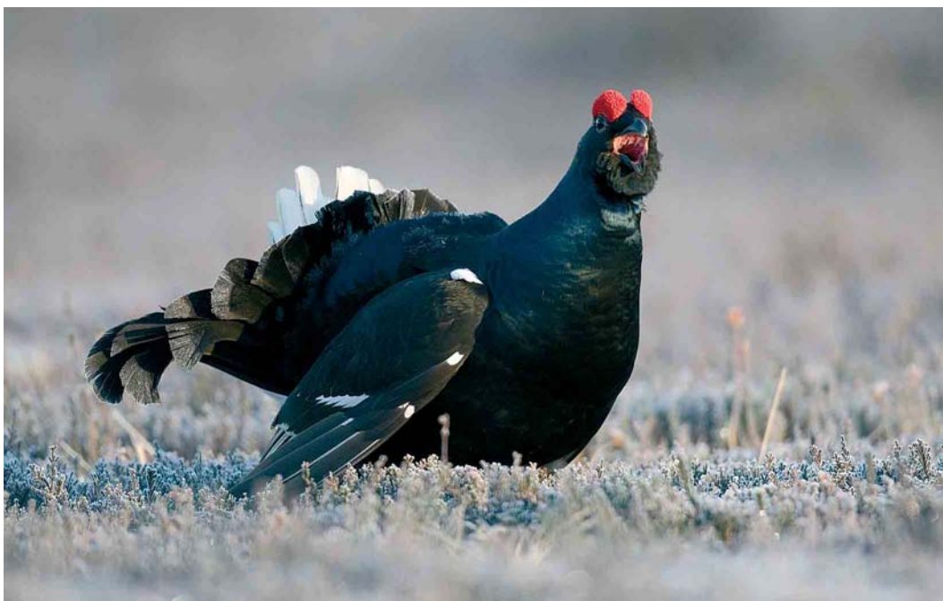
244 Korhoen / Black Grouse Tetrao tetrix , mannetje, Holterberg, Overijssel, 21 maart 2007 (Edwin Winkel)