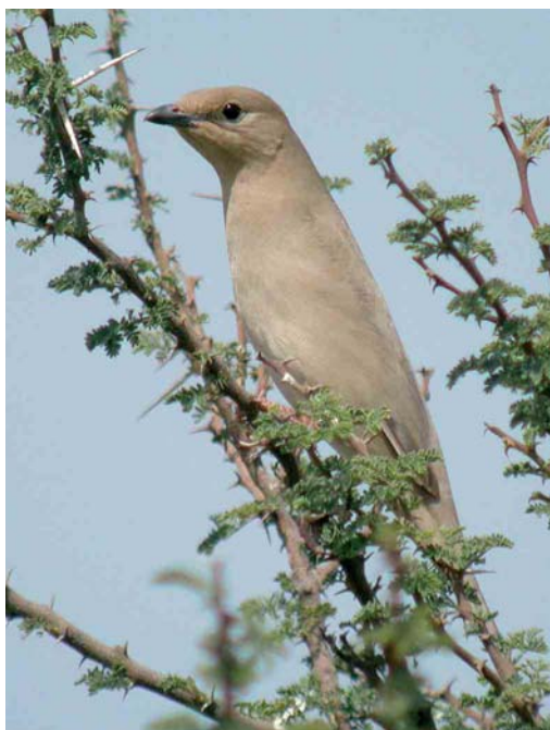
234 Red-rumped Swallow / Roodstuitzwaluw Cecropis daurica , Liminka, Finland, 10 May 2007 235 Grey Hypocolius / Zijdestaart Hypocolius ampelinus , Sabah Al-Ahmad reserve, Kuwait, 7 April 2007 236 Hybrid Pied x Eastern Black-eared Wheatear / hybride Bonte x Oostelijke Blonde Tapuit Oenanthe pleschanka x melanoleuca , male, Kaliakra, Bulgaria, 4 May 2007