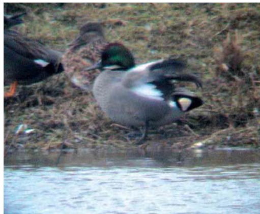
189 Falcated Duck / Bronskopeend Anas falcata , male, Nuldernauw, Gelderland, Netherlands, 27 March 2005 190 Falcated Duck / Bronskopeend Anas falcata , male, Nuldernauw, Gelderland, Netherlands, 1 April 2005 191-192 Falcated Duck / Bronskopeend Anas falcata , male, Asselt, Limburg, Netherlands, 10 February 2002

winter, due to short elongated tertials, which grew longer and more curved during its stay (Rommert Cazemier in litt); however, first-year birds appear to retain shorter and straighter tertials into their first summer, so this bird was probably also an adult. So far, females of possibly wild origin have not been reported in the Netherlands.