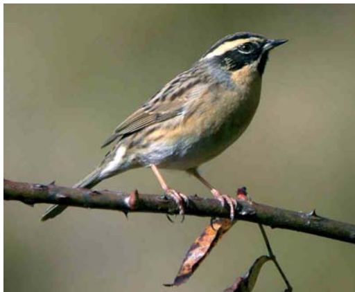
210 Black-throated Accentor / Zwartkeelheggenmus Prunella atrogularis , Pangot, Uttarakhand, India, 9 December 2006 (Nils van Duivendijk)

III The third mystery photograph of the 2007 competition obviously shows an accentor Prunella with bold black head markings and buffish underparts. Three rather similar species with these characters occur in the Western Palearctic. Of these, Radde's Accentor P. ocularis shows a pure white supercilium and a malar stripe which extends on to the lower breast and which is formed by fine streaks. Both characters are not present in the mystery photograph and, therefore, the mystery bird must be either a Siberian Accentor P. montanella or a Black-throated Accentor P. atrogularis . Due to the posture of the mystery bird, the amount of black on the throat is impossible to judge properly (note that, in some Black-throated in fresh autumn plumage, the black throat can be partly or even largely obscured by buff feather-tips). Therefore, other characters are necessary to discriminate between the two candidates. In Siberian, the supercilium is on average more buff compared with Black-throated in autumn plumage. In the mystery bird, the supercilium is obviously tinged buffish and this might be the reason why 45% of the entrants opted for Siberian. Note, however, the cold brown ground colour of the mantle and the bold black mantle-streaks. In Siberian, the mantle is normally more warmly coloured and the mantle streaks are usually distinctly reddish-brown. Some Siberian, however, might show a colder brown ground colour and darker mantle-streaks and these birds can be very difficult to