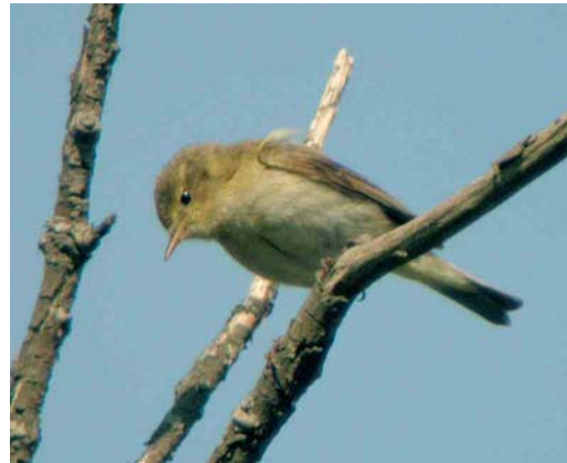
252 Cetti's Zanger / Cetti's Warbler Cettia cetti , Brabantse Biesbosch, Noord-Brabant, 11 april 2007 (Jorrit Vlot) 253 Pallas' Boszanger / Pallas's Leaf Warbler Phylloscopus proregulus , Coendersborg, Groningen, Groningen, 14 april 2007 (Lucien Davids) 254 Pallas' Boszanger / Pallas's Leaf Warbler Phylloscopus proregulus , Amersfoort, Utrecht, 4 maart 2007 (Martin van der Schalk) 255 Iberische Tjiftjaf / Iberian Chiffchaff Phylloscopus ibericus , Diemerzeedijk, Noord-Holland, 22 april 2007 (Ruud G M Altenburg)

nikoog, Friesland. Waarnemingen van grote aantallen Zwartkopmeeuwen L. melanocephalus buiten de Delta zijn uitzonderlijk, dus het vermelden waard zijn de grote aantallen op de Kinseldam nabij Durgerdam, Noord-Holland, met een maximum van 188 op 25 april. Grote Burgemeesters L. hyperboreus bleven tot 24 maart op de Maasvlakte; tot 17 april bij Katwijk aan Zee, Zuid-Holland; tot 27 april (de adulte) bij Den Helder; op 13 maart langs de Oosterscheldekering; op 24 maart langs Huisduinen, Noord-Holland; op 25 maart (twee) langs De Cocksdorp, Texel, Noord-Holland; van 27 maart tot 14 april bij de Brouwersdam, Zuid-Holland; en van 31 maart tot 6 april bij Heerlen, Limburg. De eerste-winter hybride Grote Burgemeester x Zilvermeeuw L. argentatus van IJmuiden werd tot 15 april gezien. Een eerste-winter Kleine Burgemeester L. glaucooides vloog op 9 april langs Breskens en op 28 april werd een tweede-kalenderjaar