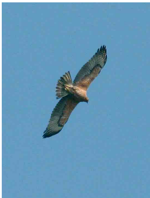
211 Bonelli's Eagle / Havikarend Aquila fasciata , second calendar-year (below), with Common Buzzard / Buizerd Buteo buteo , Lüsekamp, Viersen, Nordrhein-Westfalen, Germany, 12 April 2007 (Daniel Hubatsch) 212-213 Bonelli's Eagle / Havikarend Aquila fasciata , second calendar-year, Lüsekamp, Viersen, Nordrhein-Westfalen, Germany, 12 April 2007 (Daniel Hubatsch)