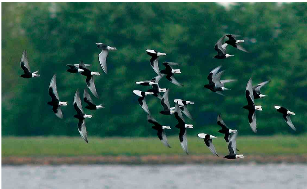
271 White-winged Tern / Witvleugelstern Chlidonias leucopterus , Blauwestad, Groningen, 17 mei 2007 (Roef Mulder)

WHITE-WINGED TERNS From 15 May 2007, a major influx of White-winged Terns Chlidonias leucopterus occurred in the Netherlands. The first sign of what was going to happen was on 14 May with a group of five. On 15 May, 39 were reported., including 24 in one group. On 16 May, numbers (including possible double counts) rose to 977, including groups of 158 and 90, almost all in the north-east. The peak day was 17 May, with 2513 reported, almost all over the country (including groups of 172, 87 and 72). Numbers slowly decreased after that day (775 on 18 May, 441 on 19 May, 352 on 20 May and 131 on 21 May). The only previous major influx in the Netherlands was on 13-16 May 1997, when 350-400 birds were reported. The 1997 influx was concentrated on just a few localities, mainly in the north-east, but included a large group of 200 on 15 May.