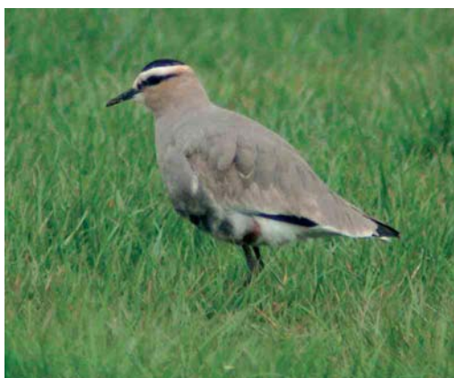
248 Koereiger / Cattle Egret Bubulcus ibis , Frieschepalen, Friesland, 9 maart 2007 249 Steppiekiekendief / Pallid Harrier Circus macrourus , onvolwassen mannetje, Strabrechtse Heide, Noord-Brabant, 25 april 2007 250 Franklins Meeuw / Franklin's Gull Larus pipixcan , tweede-zomer (links), met Kokmeeuw / Black-headed Gull L. ridibundus , Sophiapolder, Oostburg, Zeeland, 27 april 2007 251 Steppiekievit / Sociable Lapwing Vanellus gregarius , eerstejaars, Wekerom, Gelderland, 25 maart 2007

gregarius in Syrië en Turkije, dit voorjaar de soort ook weer in Nederland werd aangetroffen, met waarnemingen van 16 tot 20 maart bij Veenendaal, Utrecht, en (dezelfde) op 25 maart ten oosten van Barneveld, Gelderland (eerste-zomer), op 18 april bij Velp, Gelderland, en op 27 april ten oosten van Vorden, Gelderland (adult). Gestreepte Strandlopers Calidris melanotos kwamen vroeg en wel op 7 april bij Alphen aan den Rijn, Zuid-Holland; van 14 tot 20 april op Texel; op 15 en 29 april op de Starveert; en op 21 april in de Rammelwaard, Gelderland. Een grijze snip Limnodromus vloog op 22 april over Breskens. De beste plek voor Poelruiters Tringa stagnatilis was De Hamert, Limburg, waar al op 9 april één werd ontdekt die lange tijd aanwezig bleef. Op 24 april waren er hier twee, op 25 april zelfs drie en op 26 april weer twee. Van 17 tot 21 april pleisterde er één langs de Philipsdam, Zeeland, en vanaf 28 april werden er her en der in het