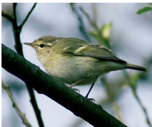
266 Reuzenster / Caspian Tern Hydroprogne caspia , Het Zwin, West-Vlaanderen, 30 april 2007 (Johan Buckens) 267 Hybride Zwarte x Gekraagde Roodstaart / hybrid Black x Common Redstart Phoenicurus ochruros x phoenicurus , Kalmthout, Antwerpen, 27 april 2007 (Glenn Vermeersch) 268-269 Bladkoning / Yellow-browed Warbler Phylloscopus inornatus , Zeebrugge, West-Vlaanderen, 28 maart 2007 (Koen Verbanck)

Jager Stercorarius skua die op 3 maart over Botrage in de Hoge Venen vloog. De hoogste tellingen van Zwartkopmeeuwen Larus melanocephalus kwamen van Essen-Kalmthout-Wuustwezel, Antwerpen, op 17 maart (225) en Verrebroek, Oost-Vlaanderen, op 10 april (282). Op 12 en 13 april, minder dan een jaar na de eerste gevallen in de Lage Landen, verscheen er weer een adulte Dunbekmeeuw L genei in Het Zwin in Knokke. Vaak foerageerde hij op Nederlands grondgebied maar met enig geduld kon men hem ook aan de Belgische kant van de grens bekijken. Op 25 april vloog bovendien een eerste-zomer over Anderstad in Lier. Een adulte Baltische Mantelmeeuw L fuscus fuscus werd op 20 maart gemeld in Dilsen-Stokkem, Limburg. Tot 3 maart werd de adulte Kleine Burgemeester L glaucoides nog gezien aan de Barrage de l'Eau d'Heure, Hainaut. Het kan haast geen toeval zijn dat er op 4 maart een adulte over de Kruiskouter in Relegem-Asse, Vlaams-Brabant, vloog. Een tweede-winter Grote