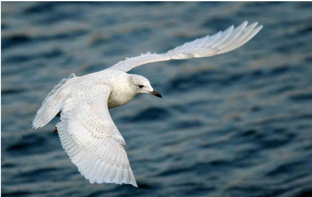
232 Kumlien's Gull / Kumliens Meeuw Larus glaucooides kumlieni , Rossaveel, Galway, Ireland, 1 April 2007