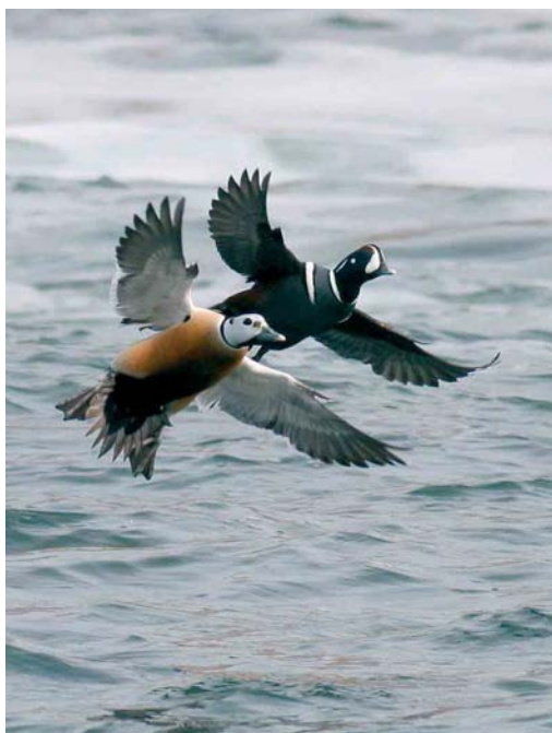
224 Bateleur / Bateleur Terathopius ecaudatus , Greco cape, Cyprus, 21 April 2007 225 Steller's Eider / Stellers Eider Polysticta stelleri , with Harlequin Duck / Harlekijneend Histrionicus histrionicus , Borgarfjörður, Iceland, 25 April 2007 226 Glossy Ibises / Zwarte Ibissen Plegadis falcinellus , Slimbridge, Gloucestershire, England, 21 April 2001