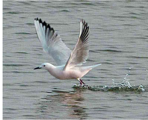
270 Dunbekmeeuw / Slender-billed Gull Larus genei , adult, Het Zwin, Zeeland, 13 april 2007 (Jan den Hertog)

Deze waarneming volgt nog geen jaar na de eerste