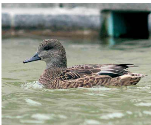
193-194 Falcated Duck / Bronskopeend Anas falcata , first-winter male, with Eurasian Wigeons / Smienten A penelope , Exminster Marshes, Devon, England, November 2006 195-196 Falcated Duck / Bronskopeend Anas falcata , female, Zürich-Honggerberg, Zürich, Switzerland, 10 February 2007

A possible hybrid (or aberrant) Falcated Duck was seen at Nuldernauw, Gelderland, on 6 May 2007 (at the same site where a 'good' male was present in March-May 2005). According to the two observers, the bird showed too much yellow on the lower head and a slighter rounder head than in pure Falcated Duck ( www.dutchbirding.nl ).