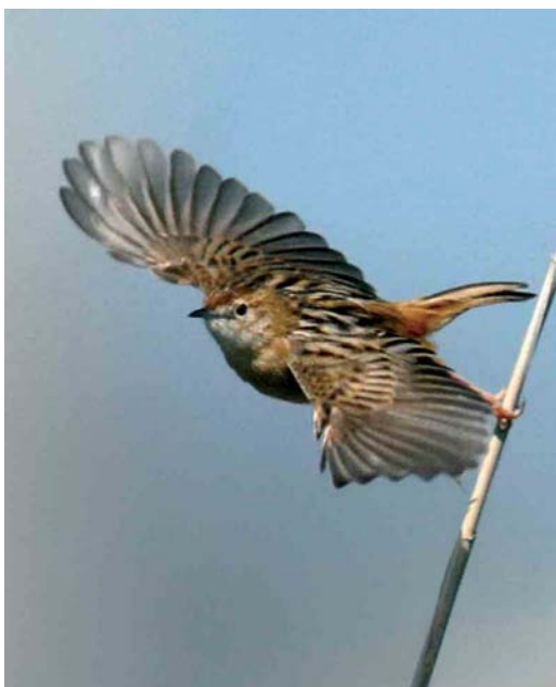
264 Graszanger / Zitting Cisticola juncidis , Kennemermeer, IJmuiden, Noord-Holland, 19 april 2007 (Harm Niesen)

daarnaast waarnemingen bij het Kennemermeer te IJmuiden vanaf 15 april; vanaf 18 april tot in mei verbleef op deze plek een paar. De Vale Braamsluiper Sylvia curruca halimodendri bleef tot 7 april in Groningen, Groningen. De bekende Pallas' Boszangers Phylloscopus proregulus bleven bij Driehuis, Noord-Holland, tot 21 maart en in Amersfoort, Utrecht, tot 28