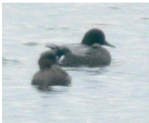
185 Falcated Duck / Bronskopeend Anas falcata , male, with Gadwall / Krakeend A strepera and Eurasian Coot / Meerkoet Fulica atra , Oranjekom, AW-duinen, Bloemendaal, Noord-Holland, Netherlands, 24 January 1992 186 Falcated Duck / Bronskopeend Anas falcata , male, with Tufted Duck / Kuifeend Aythya fuligula , Oranjekom, AW-duinen, Bloemendaal, Noord-Holland, Netherlands, January 1992 187 Falcated Duck / Bronskopeend Anas falcata , male, Jaap Deensgat, Lauwersmeer, Groningen, Netherlands, 10 May 1996 188 Falcated Duck / Bronskopeend Anas falcata , male, Harlingen, Friesland, Netherlands, 3 January 2004