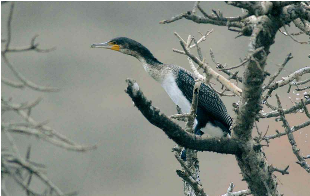
214 White-breasted Cormorant / Afrikaanse Aalscholver Phalacrocorax carbo lucidus , Barragem de Poilão, Santiago, Cape Verde Islands, 27 March 2007