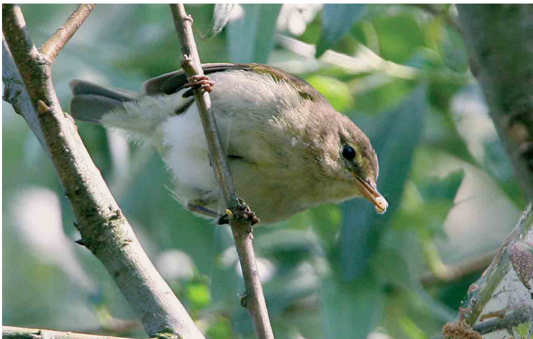
262 Iberische Tjiftjaf / Iberian Chiffchaff Phylloscopus ibericus , Diemerzeedijk, Noord-Holland, 5 mei 2007 (Jos van den Berg)