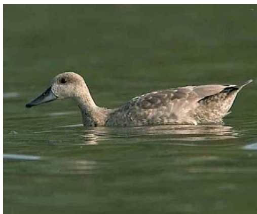
200 Marmereend / Marbled Duck Marmaronetta angustirostris , Pannerden, Gelderland, 15 augustus 2004

februari en mei (Dubois & Yésou 1992). Aangenomen wordt dat de (grote) meerderheid van de Franse waarnemingen betrekking heeft op vogels van wilde herkomst, hoewel ook het voorkomen van ontsnapte vogels wordt onderkend (Dubois et al 2000). De ringteugmelding en de overeenkomst tussen het Franse seizoenspatroon met dat in Noordoost-Spanje maken een overwegend wilde herkomst zeer aannemelijk. Frankrijk is – nu samen met Nederland – het enige land in West-Europa ten noorden van de Middellandse Zee waar de soort in de 'A-categorie' staat.