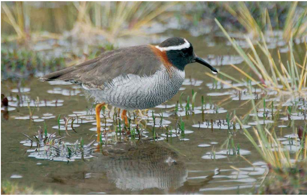
208-209 Diademed Plover / Diadeemplevier Phegornis mitchellii , adult, Marcapomacocha, near Milloc, Peru, 4 February 2006