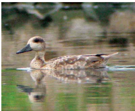
199 Marmereend / Marbled Duck Marmaronetta angustirostris , Pannerden, Gelderland, 15 augustus 2004 (Phil Koken)