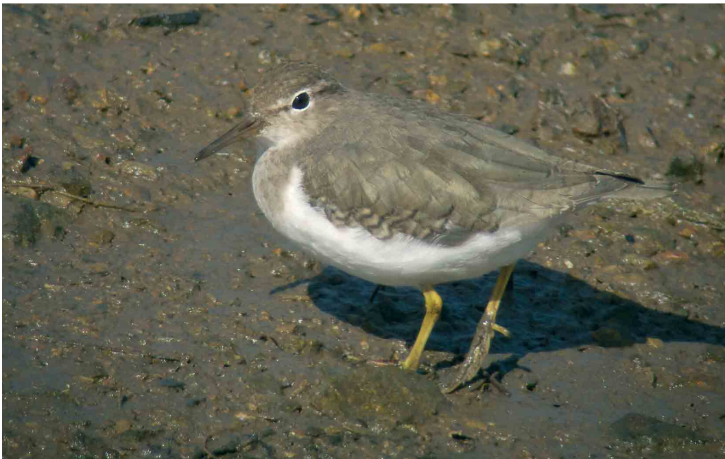
233 Spotted Sandpiper / Amerikaanse Oeverloper Actitis macularius , Hayle, Cornwall, England, April 2007 (Dave Stewart)