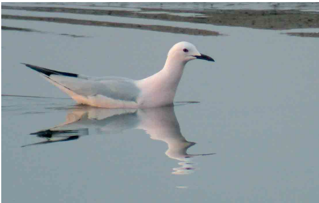
243 Dunbekmeeuw / Slender-billed Gull Larus genei , adult, Het Zwin, Zeeland, 13 april 2007 (Sjaak Schilperoort)

A fabalis bij Lisse, Zuid-Holland, in een grote groep Toendrarietganzen A serrirostris betrof één van de zeer schaarse meldingen in het westen van het land in de afgelopen winters. Dwergganzen A erythropus waren nog aanwezig in de polders ten noorden van Camperduin, Noord-Holland, tot 26 maart met een maximum van 37 op 2 maart, op 7 maart 18 in het Oudeland van Strijen, Zuid-Holland, op 8 maart 14 op de Korendijksche Slikken, Zuid-Holland, en tot 2 april weer bij Anjum, Friesland, met een maximum van 13 op 8 maart. Verder werden er nog 13 gemeld op andere locaties, met de laatste op 9 april bij de Workumerwaard. Er werden 26 Roodhalsganzen Branta ruficollis opgemerkt met als beste plekken de Bantpolder, Friesland, met vier op 15 en 29 april en Ameland, Friesland, met drie op 22 april. Van de 14 Witbuikrotganzen B hrota verbleven er drie op Wieringen, Noord-Holland, en vier op Texel, Noord-Holland. Voor Zwarte Rotgans B nigricans , waarvan er 15 gemeld werden, was Texel eveneens de beste plek met drie. Op 16 april vloog er één langs Camperduin, een nieuwe telpostsoort. Witoogeenden Aythya nyroca zwommen tot 2 maart op de Keersluisplas, Flevoland, op 8 maart bij 's-Hertogenbosch, Noord-Brabant, op 1 april twee en 9 april één in de Kil van Hurwenen,