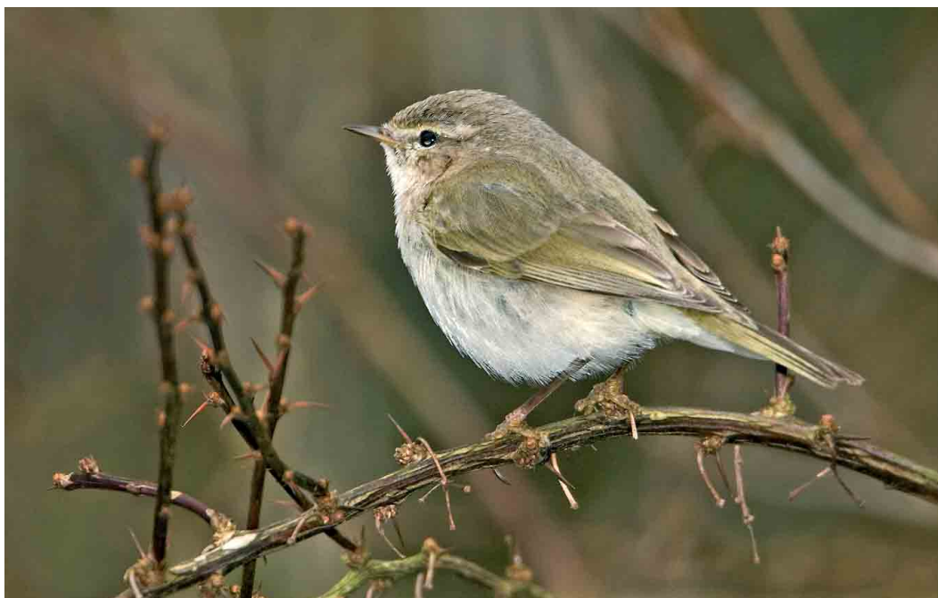
263 Siberische Tjiftjaf / Siberian Chiffchaff Phylloscopus collybita tristis , Bilthoven, Utrecht, 23 februari 2007 (Roland Jansen)

Zwarte Zeekoet Cephus grylle gezien, ditmaal in zomerkleed, van 23 februari tot 3 maart.