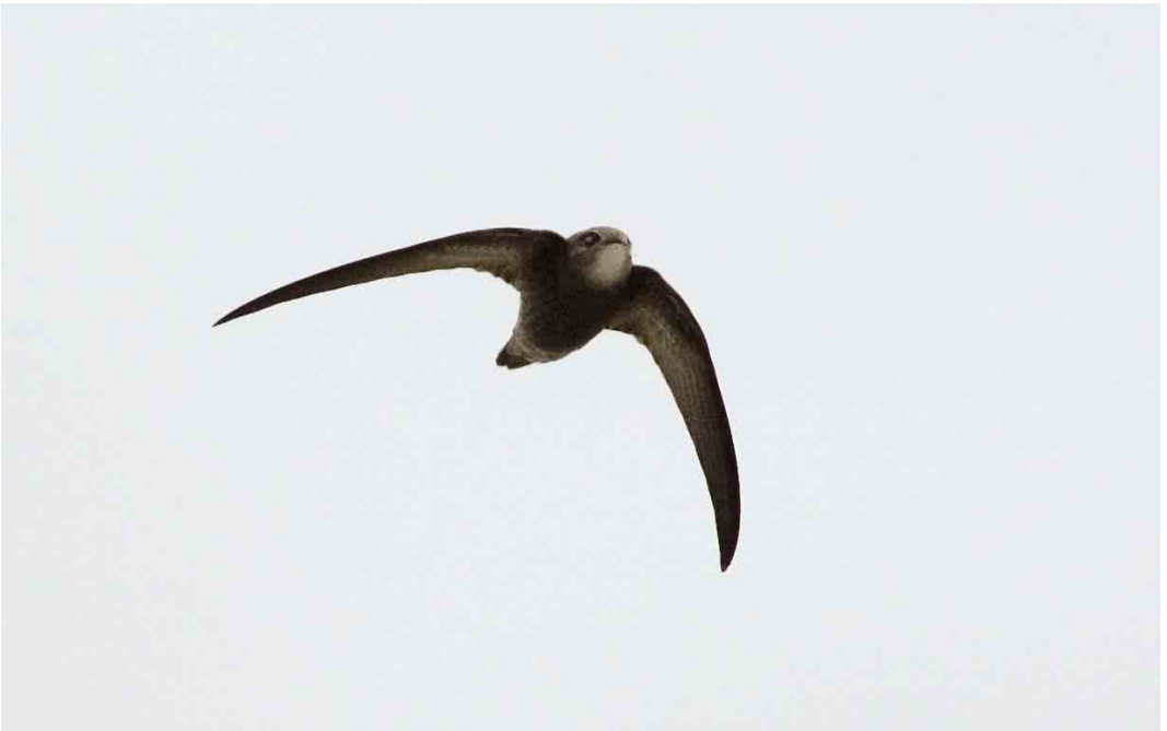
574 Vale Gierzwaluw / Pallid Swift Apus pallidus , Vlieland, Friesland, 20 oktober 2006 575 Steppevorkstaartplevier / Black-winged Pratincole Pratincola nordmanni , Eemnes, Utrecht, 17 oktober 2006 576 Roodpootvalk / Red-footed Falcon Falco vespertinus , juveniel, Westkapelle, Zeeland, 30 september 2006