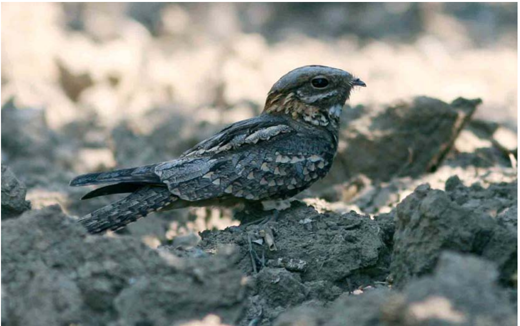
429 Red-necked Nightjar / Moose Nachtzwaluw Caprimulgus ruficollis , Brenes, Sevilla, Andalucía, Spain, 3 June 2006 (Markus Deutsch)

European Nightjar and Red-necked Nightjar are rather similar in appearance. One of the differences, also visible in the mystery photograph, is the size of the white primary spots. In European, only males have obvious spots. In Red-necked, both males and females show these white spots on the three outermost primaries. In both sexes of Red-necked, the white spots are on average larger than in European. The mystery bird shows rather large white spots and this, therefore, favours Red-necked. Another character favouring Red-necked and also visible in the mystery photograph is the rather brownish-grey colour of the uppertail and mantle. In European, these feathers lack the brownish tinge of Red-necked. The rusty-red patterning visible at the upperwing of the mystery bird is another pointer towards Red-necked. In European, the upperwing is patterned less rusty-red. The most important discriminating character, however, is just visible in the mystery photograph. In Red-necked, all wing-coverts show broad pale buff tips, creating pale wing-bars of equal width and about three rows of these buff wing-bars can be seen on the left wing of the mystery bird. European shows only one broad whitish wing-bar, formed by the