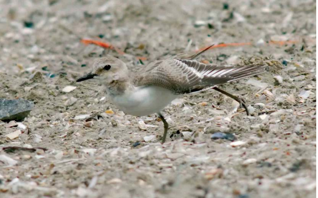
435 Greater Sand Plover / Woestijnplevier Charadrius leschenaultii , first-year, IJmuiden, Noord-Holland, Netherlands, 4 August 2006