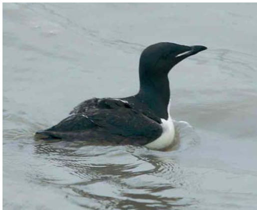
475 Kortbekzeekoet / Brunnich's Murre Uria lomvia , adult (opgeraapt bij Lille, Antwerpen, op 5 augustus 2006), Oostende, West-Vlaanderen, 15 augustus 2006