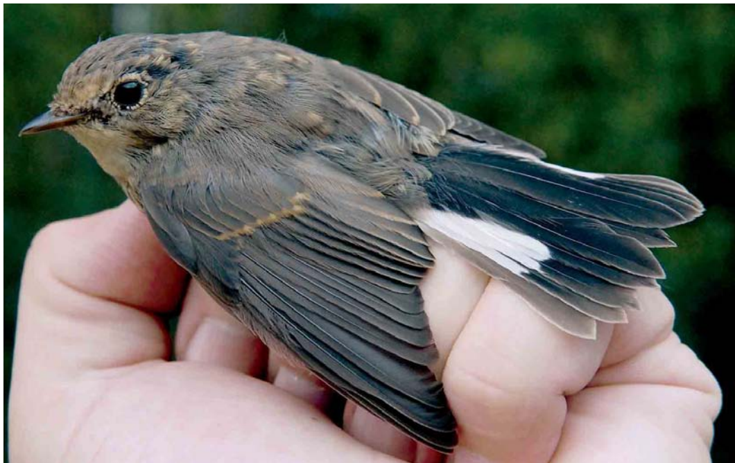
470 Kleine Vliegenvanger / Red-breasted Flycatcher Ficedula parva , eerstejaars, Groene Glop, Schiermonnikoog, Friesland, 26 augustus 2006 (André G Duiven)

Camperduin, op 4 augustus over het Ballooërveld, Drenthe, en op 5 augustus bij Bennekom, Gelderland. Na 17 augustus volgden nog eens 26 exemplaren. De