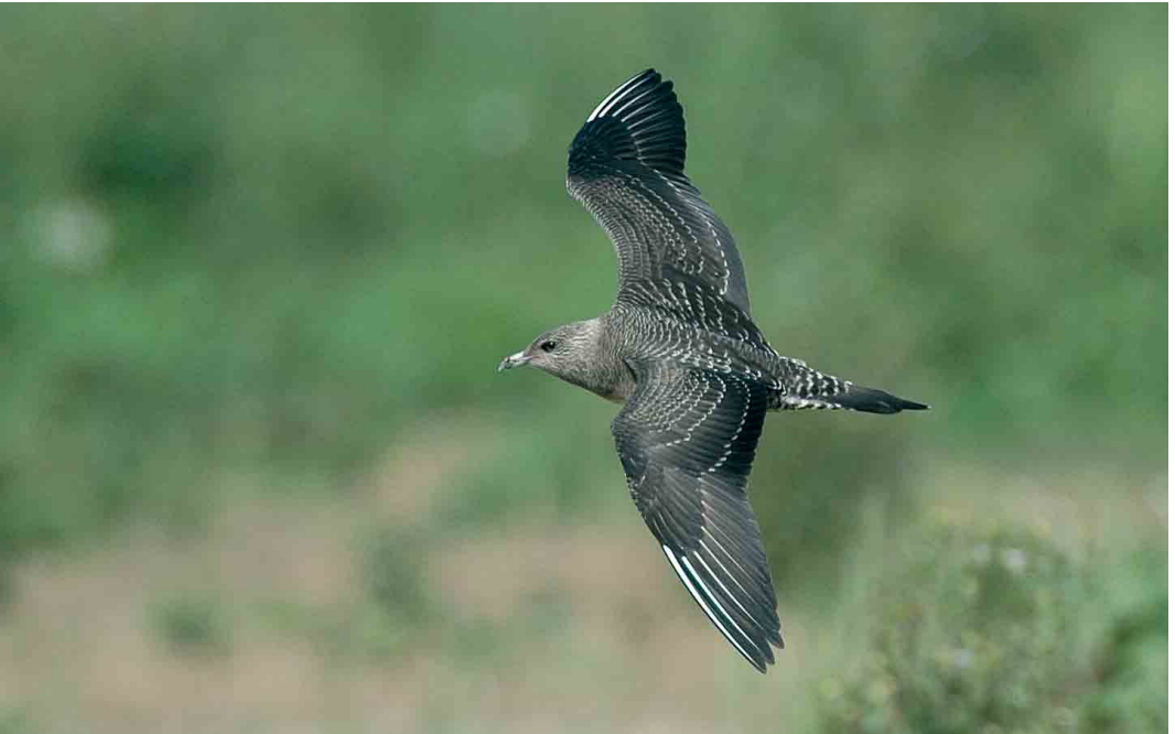
460 Kleinste Jager / Long-tailed Jaeger Stercorarius longicaudus , juveniel, Goudswaard, Zuid-Holland, 5 september 2006