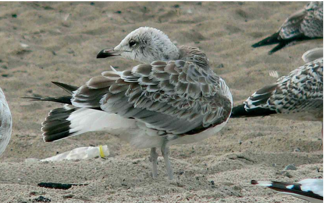
436 Pallas's Gull / Reuzenzwartkopmeeuw Larus ichthyaetus , first-year, Miedzyzdroje, Poland, 19 August 2006 (Zbyszek Kajzer)