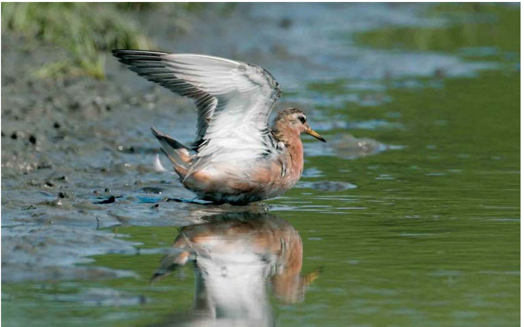
457 Rosse Franjepoot / Red Phalarope Phalaropus fulicarius , Wanteskuup, Zeeland, 1 juli 2006