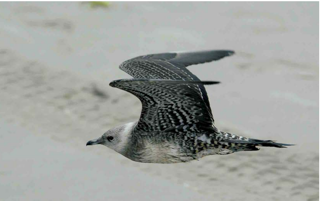
461 Kleinste Jager / Long-tailed Jaeger Stercorarius longicaudus , juveniel, Hondsbossche Zeewering, Noord-Holland, 30 augustus 2006