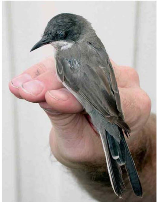
447 Eastern Orphean Warbler / Oostelijke Orpheusgrasmus Sylvia crassirostris , Halten, Sør-Trøndelag, Norway, 12 August 2006

THRUSHES TO BABBLERS An Isabelline Wheatear Oenanthe isabellina at Eemshaven, Groningen, from 31 August to 4 September was the fifth for the Netherlands and the earliest ever. A Zitting Cisticola Cisticola juncidis photographed at Saint Margaret's, Cliffe, Kent, on 25 August was the fifth for Britain. A first-winter Olive-tree Warbler Hippolais olivetorum photographed at Boddam, Mainland, Shetland, on 16 August was the first for western Europe (except for claims on Helgoland in May 1860 and May 1954). Paddyfield