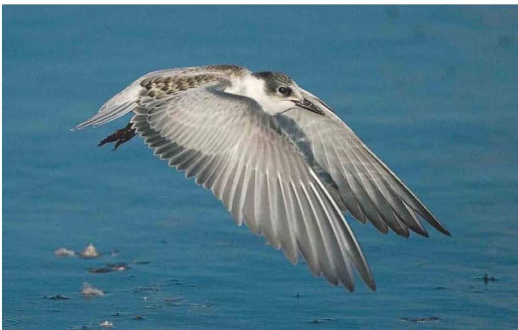
593 Witwangstern / Whiskered Tern Chlidonias hybrida , juveniel, Hoornse Meer, Drenthe, 10 oktober 2004 (Bas van den Boogaard)