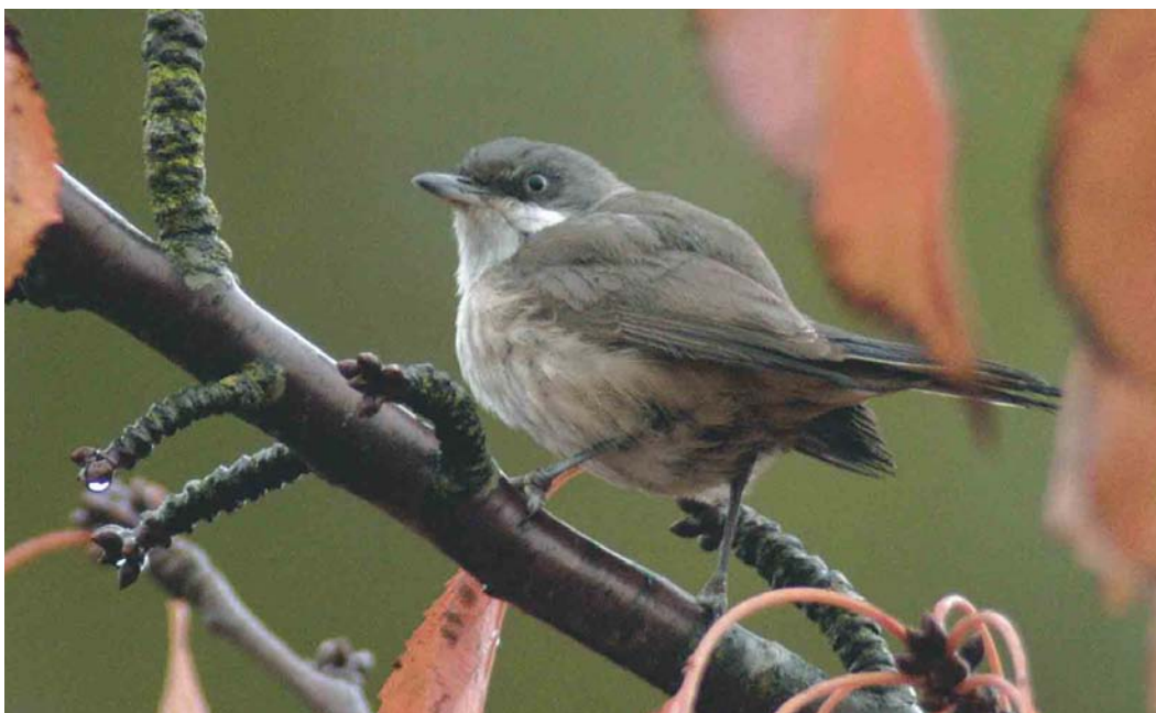
522 Vermoedelijke Westelijke Orpheusgrasmus / presumed Western Orphean Warbler Sylvia hortensis , Middelburg, Zeeland, 30 oktober 2003 (Marten van Dijl)

mannetje gevangen. Dit exemplaar overleefde nog drie weken in een kooi, waarna het werd opgezet. Op basis van de in 1913 gepubliceerde foto lijkt het om een Westelijke Orpheusgrasmus te gaan. In Brittannië zijn zes gevallen bekend: één in mei, één in juli en vier tussen 20 september en 22 oktober, waarvan slechts één twitchbaar (op Scilly, Engeland, in oktober 1981). In Duitsland werd op 1 september 1964 een adult vrouwtje gevangen op Helgoland, Schleswig-Holstein, en werden opmerkelijk genoeg van 19 juli tot 13 augustus 2003 twee zingende mannetjes Westelijke Orpheusgrasmus waargenomen in Baden-Württemberg (Dutch Birding 25: 343, 2003).