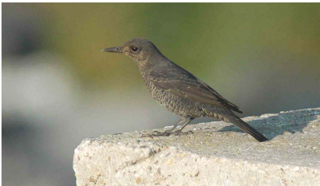
405 Blauwe Rotslijster / Blue Rock Thrush Monticola solitarius , Westkapelle, Zeeland, 20 september 2003