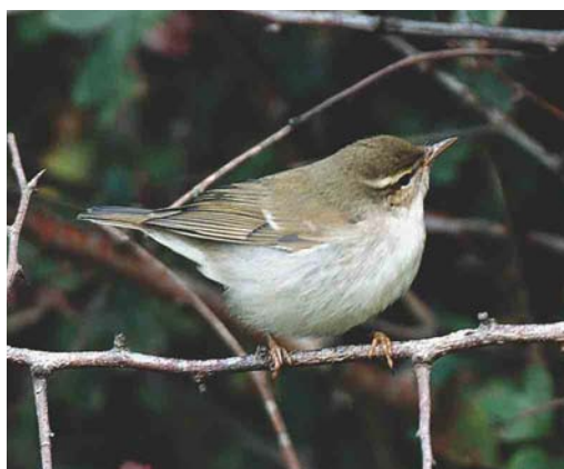
366-367 Wilson's Storm-petrel / Wilsons Stormvogeltje Oceanites oceanicus , off Donegal, Ireland, August 2003 (Anthony McGeehan) 368 Redhead / Amerikaanse Tafeleend Aythya americana , Cape Clear Island, Cork, Ireland, July 2003 (Paul Kelly) 369 Ring-necked Duck / Ringsnaveleend Aythya collaris , adult male eclipse, Gran Tarajal Lagoon, Fuerteventura, Canary Islands, August 2003 (Paul Kelly) 370 Great Spotted Cuckoo / Kuifkoekoek Clamator glandarius , juvenile, Spurn, East Yorkshire, England, July 2003 (Steve Young/Birdwatch) 371 Arctic Warbler / Noordse Boszanger Phylloscopus borealis , Spurn, Yorkshire, England, 31 August 2003 (Steve Young/Birdwatch)