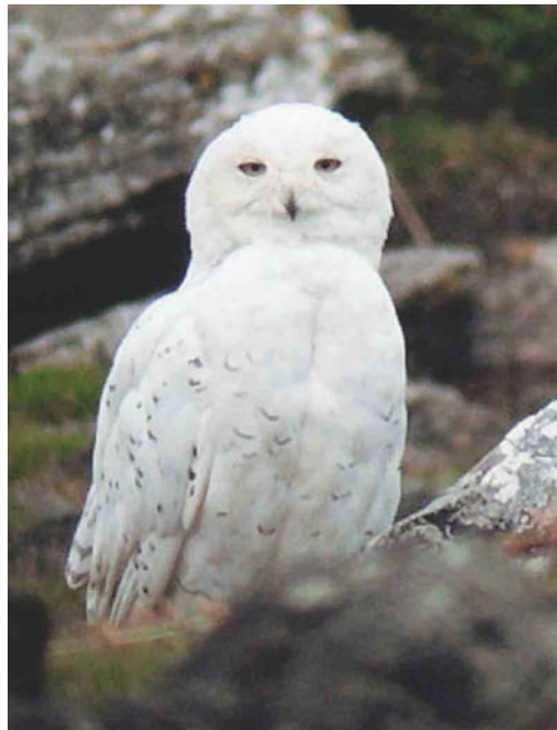
363 Masked Booby / Maskergent Sula dactylatra , Bay of Biscay, Spain, 3 September 2003 ( Hugh Harrop ) 364 Snowy Owl / Sneeuwuil Nyctea scandiaca , male, North Uist, Western Isles, Scotland, 16 August 2003 ( Stuart Piner ) 365 Elegant Tern / Sierlijke Stern Sterna elegans , subadult, Pointe de l'Imperlay, Corsept, Loire-Atlantique, France, 31 August 2003 ( Alain Fossé )