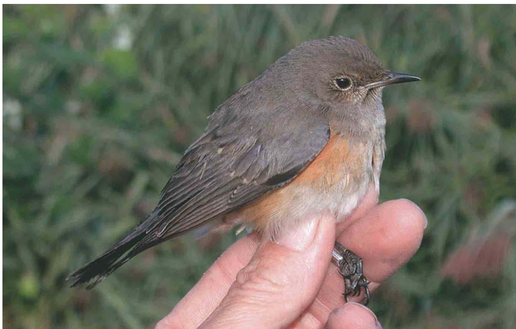
403 Perzische Roodborst / White-throated Robin Irania gutturalis , eerstejaars, bij Budel-Dorplein, Limburg, 30 augustus 2003

WHITE-THROATED ROBIN On 30 August 2003, a first-year White-throated Robin Irania gutturalis was trapped and ringed at Budel-Dorplein, an inland ringing site on the border of Noord-Brabant and Limburg, the Netherlands. If accepted, this is the third record after an adult male in November 1986 and a first-summer female in June 1995.