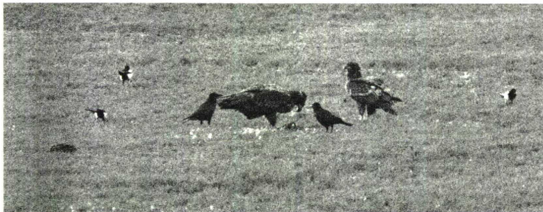
93 Zeearenden / White-tailed Eagles Haliaeetus albicilla , Hellegatsplaten, Zuid-Holland, 13 januari 1996 (Gerard L. Ouweeneel)

KRAANVOGELS TOT ALKEN In de periode vanaf 16 februari werden c 4000 Kraanvogels Grus grus geteld, met als piekperiode 8 tot 14 maart (3700). Een mannetje Kleine Trap Tetrao tetrao verbleef van 19 tot 27 maart bij de Inlagen van Westenschouwen, Zeeland. De Grote Trap Otis tarda van Rolde, Drenthe, was daar nog aanwezig tot 9 maart, terwijl er op 20 februari één langsvloog bij Kijkduin, Zuid-Holland. Groot was de verbazing toen op de plek van de Kleine Trap bij Westenschouwen van 30 maart tot 1 april een Griël Burhinus oediacnemus opdook. Deze vogel had een rode ring aan de rechterpoot en is waarschijnlijk afkomstig van de Engelse populatie waarvan veel vogels geringd zijn. Recordaantallen Goudplevieren Pluvialis apricaria (34 000) en Kieviten Vanellus vanellus (110 000) werden op 21 maart geteld bij Breskens. Een Steppekievit Chettusia gregaria verbleef vanaf 3 april bij Lopik. De eerste Ijslandse Grutto's Limosa limosa islandica werden gemeld op 31 maart (vijf) bij de Flaauwers Inlaag, Zeeland. Rosse Franjepoten Phalaropus fulicaria werden waargenomen op 17 februari bij Lauwersoog en op 20 februari bij Katwijk, Zuid-Holland. Kleine Burgemeesters Larus glaucooides werden gezien op 11 februari bij Ool, Limburg, op 18 februari in De Putten bij Camperduin en langs de Maas bij Waalwijk, Noord-Brabant, op 28 februari bij Katwijk en op 29 februari bij