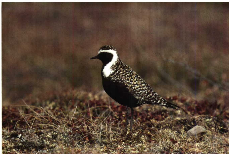
163 P dominica , Alaska, USA, June 1985 (Rinie van Meurs) 164 P fulva , Oahu, Hawaii, April 1989 (René Pop)