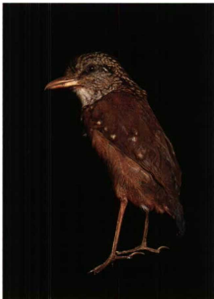
174 Schneider's Pitta Pitta schneideri (RMNH cat no 4), juvenile, collected in June 1834 at Batang Singgalang, Sumatra, Indonesia, by S Müller. This specimen was previously figured as Giant Pitta P. coerulea (sic) by Schlegel (1864: plate 1, figure 3) (Ingrid Henneke)

identification of immature P caerulea and P schneideri The juvenile plumage of caerulea has been described by Baker (1920: 580), Riley (1938: 256), Chasen (1939: 195) and Round et al (1989: 42). Breeding of caerulea in captivity was described by McKelvey & Miller (1979), who provided an illustration of a juvenile in black-and-white but no description of the juvenile plumage nor its post-juvenile moult. The juvenile plumage of schneideri was briefly described by Hartert (1909: 10) and Robinson & Kloss (1924: 268) and was figured by Robinson & Kloss (1918: plate 6). Juvenile caerulea differs from schneideri by its unmarked, dull dark greyish-brown mantle, back and rump, buff ear-coverts, mostly buff forehead and forecrown and coarsely mottled buff-and-black hindcrown and nape, which lack any rufous tinge. Also, the underparts are dark brown, becoming very coarsely marked with buff with increasing age. The plumage of the two RMNH specimens may be described as follows.