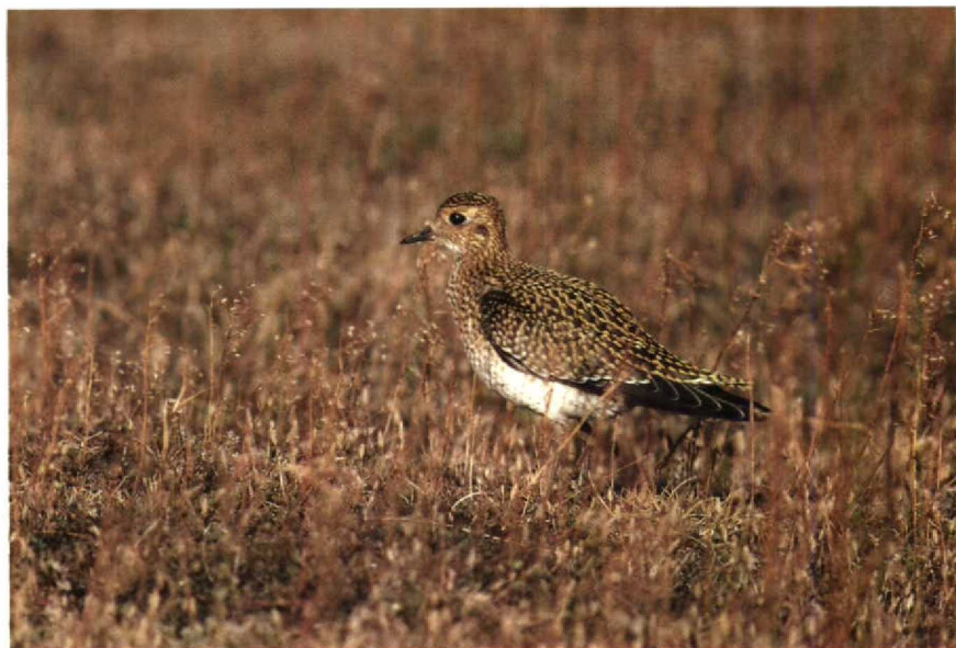
165 P. apricaria , Maasvlakte, Zuidholland, September 1990 (René Pop) 166 P. apricaria , Iceland, July 1985 (René Pop)