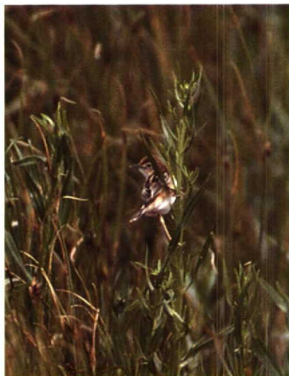
192 Graszanger Cisticola juncidis , Paal, Zeeland, augustus 1990 (Hans Gebuis)