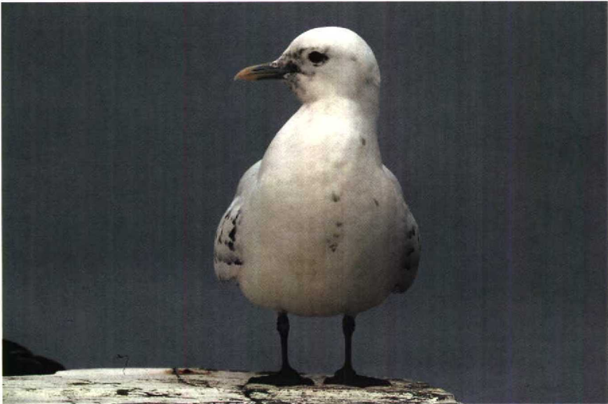
172 Ivoormeeuw Pagophila eburnea , Stellendam, Zuidholland, februari 1990 (Frank Dröge)

GEDRAG Zeer mak. Op visafval afkomend en daarbij dominant over andere meeuwen.