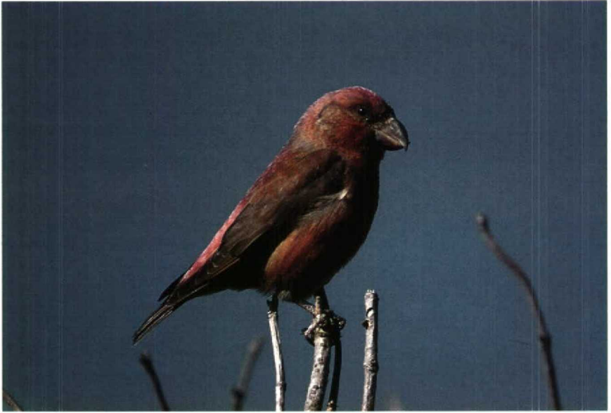
201 Grote Kruisbek Loxia pytyopsittacus , Kennemerduinen, Noordholland, oktober 1990 202 Kleine Goudplevier Pluvialis fulva , Abbega, Friesland, november 1990