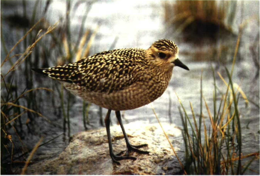
180 Pacific Golden Plover Pluvialis fulva , Finland, September 1990 181 Spotted Sandpiper Actitis macularia , Rheindelta, Vorarlberg, Austria, October 1990