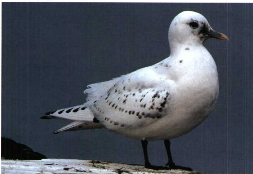
173 Ivoormeeuw Pagophila eburnea , Stellendam, Zuidholland, februari 1990 (Frank Dröge)

Het sneeuwwitte voorkomen, de opvallende zwarte stippellijnen op de bovenvleugels, de blauwgrijze snavel met gele punt, het groezelige gebied rond de snavelbasis en het donkere oog duiden op een eerste-winter Ivoormeeuw en sloten alle andere meeuwen uit. De zwarte poten sloten een leucistische meeuw uit (cf Harrison 1983, Grant 1986).