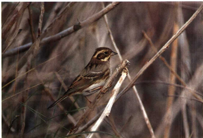
199 Bosgors Emberiza rustica , Westkapelle, Zeeland, september 1990 (René van Rossum) 200 Bosgors Emberiza rustica , Scheveningen, Zuidholland, september 1990 (Arie de Knijff)