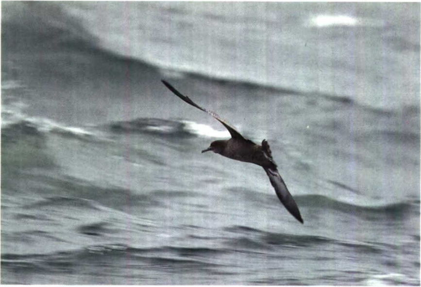
178 Grauwe Pijlstormvogel Puffinus griseus , Noordzee ten noorden van Schiermonnikoog, Friesland, september 1990 179 Waterspreeuw Cinclus cinclus , Texel, Noordholland, oktober 1990