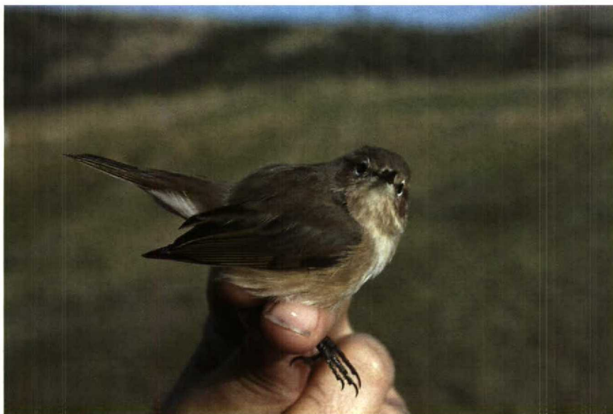
193 Tjiftjaf Phylloscopus collybita met kenmerken van Siberische ondersoort P c tristis , Bloemendaal, Noordholland, oktober 1990