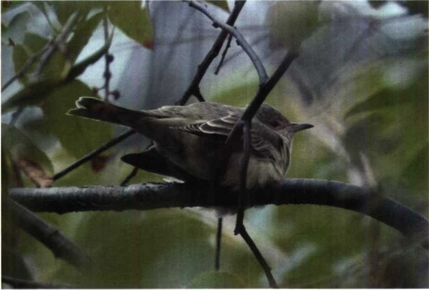
197 Sperwergrasmus Sylvia nisoria , Ameland, Friesland, september 1990 (Leo J R Boon) 198 Kleine Vliegenvanger Ficedula parva , Texel, Noordholland, oktober 1990 (Hans Gebuis)