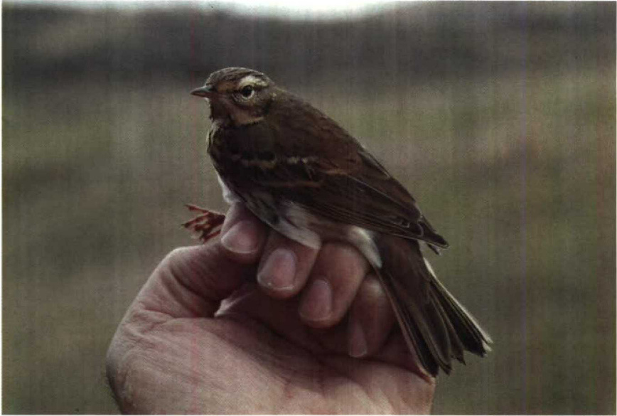
194 Siberische Boompieper Anthus hodgsoni , Bloemendaal, Noordholland, oktober 1990 (Arnaud B van den Berg) 195 Kleine Spotvogel Hippolais caligata , Bloemendaal, Noordholland, september 1990 (Arnaud B van den Berg)