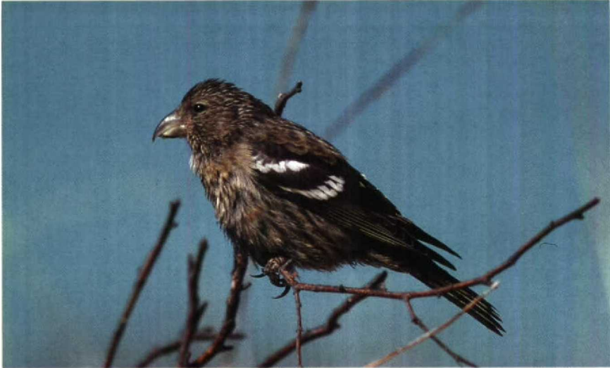
182 Two-barred Crossbill Loxia leucoptera . Helgoland, FRG, September 1990