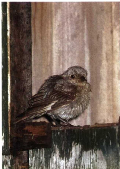
196 Roodkopklauwier Lanius senator , Texel, Noordholland, oktober 1990

vogelweek op Texel werd een mogelijke Kleine Spotvogel waargenomen bij de Vuurtorenweg. Sperwergrasmussen Sylvia nisoria waren er bij Oostvoorne Zh op 26 augustus, bij Castricum Nh op 27 augustus (vangst), op Ameland van 10 tot 12 september, in de Eemshaven op 17 september, op Terschelling op 27 en 28 september (ook gevangen), op Texel op 28 september, op Schiermonnikoog op 9 oktober (vangst) en in de Kennemerduinen op 12 oktober (vangst). Op 11 augustus werd een Grauwe Fitis Phylloscopus trochiloides geringd in de AW-duinen. Op Schiermonnikoog werd op 26 augustus één exemplaar waargenomen. Bij Castricum werd op 17 september een Swinhoes Boszanger P plumbeitarsus – nieuw voor Nederland – gevangen (zie plaat 183, p 261). Pallas' Boszangers P proregulus waren er op 23 oktober bij Katwijk en op 25 oktober op de Westplaat Zh. In de tweede helft van september en de eerste helft van oktober werden c 50 Bladkoningen P inor-