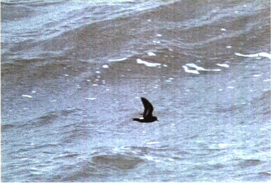
185-186 Stormvogeltje Hydrobates pelagicus , IJmuiden, Noordholland, september 1990