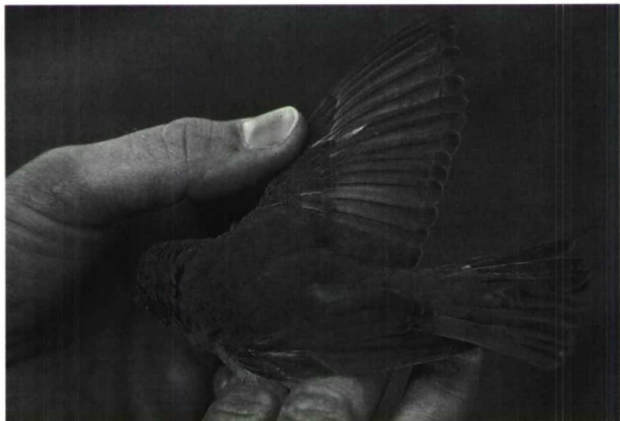
177 Garden Warbler Sylvia borin , first-year, Bloemendaal, Noordholland, October 1988 (Arnoud B van den Berg)

Mystery photograph 38, Berlengas, Portugal, June 1984. Solution in next issue.