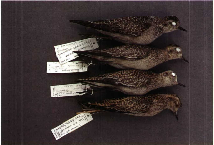
168 Juvenile P dominica (upper) and three juvenile P fulva, collected in the Netherlands during 1897-1916, Zoologisch Museum, Amsterdam, December 1989