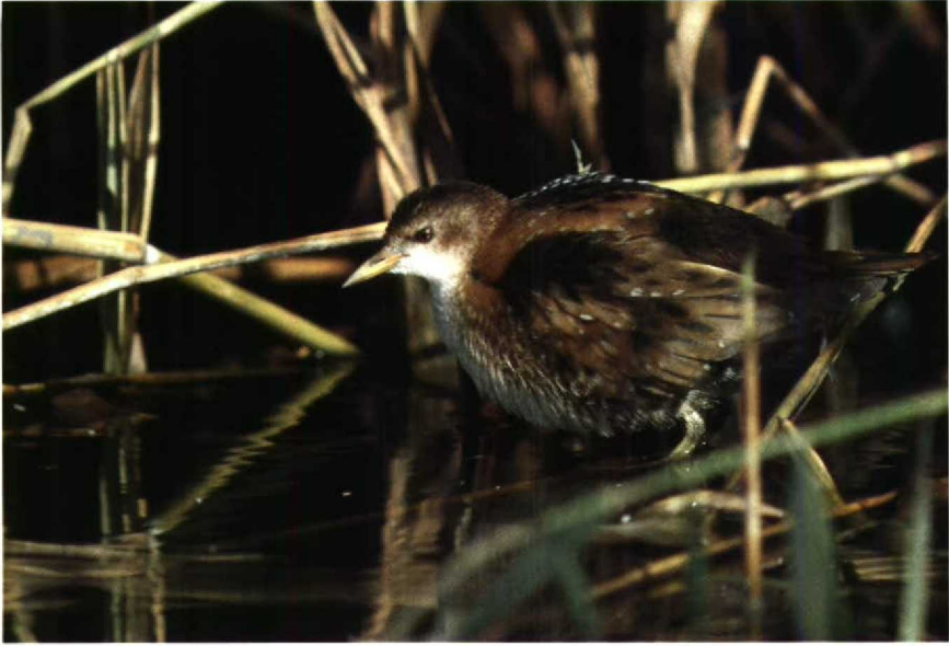
187 Klein Waterhoen Porzana parva , Eemshaven, Groningen, augustus 1990 188 Rosse Franjepoot Phalaropus fulicarius , Alphen aan den Rijn, Zuidholland, september 1990