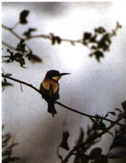
191 Bijeneter Merops apiaster , Schiermonnikoog, Friesland, september 1990 (Leo J R Boon)