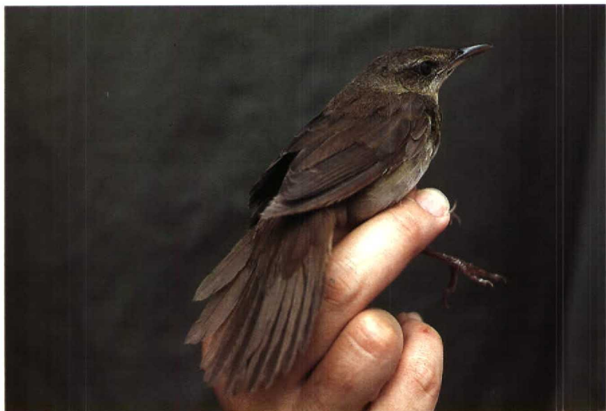
6 Gray's Grasshopper Warbler Locustella fasciolata , immature, Karakelang island, Talaud islands, North Sulawesi, Indonesia, February 1985