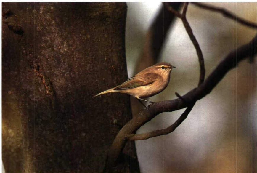
39 Siberische Tjiftjaf Phylloscopus collybita tristis , Texel, Noordholland, oktober 1989