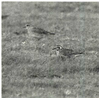
31 Amerikaanse Goudplevier Pluvialis dominica , Texel, Noordholland, oktober 1989

ganzen A caerulescens op 22 december in de Noordoostpolder Fl, gelet op het feit dat hier in de voorgaande winter twee adulten en drie juvenielen werden gezien. Behalve her en der een 15-tal exemplaren, zat er één vanaf 18 november bij de Plaat van Scheelhoek Zh in gezelschap van twee Ross' Ganzen A rossii . Zwarte Rotganzen Branta bernicla nigricans waren aanwezig op Texel Nh van 15 tot 18 oktober en bij Holwerd op 17 oktober. De eerste Roodhalsgans B ruficollis bevond zich begin november op Terschelling. Daaropvolgend werden exemplaren waargenomen bij; het Verdrongen land van Saeftinge, de Anna Paulownapolder Nh, de westkant van het Lauwersmeer Fr (twee), de Vogelweg Fl, de Workumerwaard en omgeving (tenminste twee), het Leekstermeer Gr, Strijen (vier), Giekerk Fr, langs de Strandgaperweg en in de Wieringermeer Nh. Krooneenden Netta rufina verbleven bij de Philipsdam op 3 oktober (drie), in de AW-duinen Nh op 5 oktober, op de Zevenhuizer Plas Zh vanaf 14 oktober (maximaal vier), bij Oorderen van 15 tot 21 oktober, bij Monnickendam Nh op 19 oktober (14), in Haarlem rond 2 november, langs de Oostvaardersdijk Fl op 12 november en in de HW-duinen Zh vanaf 13 november (maximaal twee). Witoog-eenden Aythya nyroca waren schaars, met exemplaren van 6 september tot 4 oktober bij