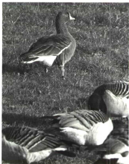
30 Dwerggans Anser erythropus , Strijen, Zuidholland, december 1989

Z. Vanaf 6 december kon men bij Nieuw-Lekkerland Zh, een adult exemplaar, tot ver in het nieuwe jaar, een handje geven. Flamingo's Phoenicopterus ruber roseus werden tot in november gezien in de Oostvaardersplassen Fl en het Lauwersmeer Gr (op beide plaatsen maximaal twee). Verder werden ze nog gemeld bij Deventer, Den Oever Nh, de Flauwers Inlaag Z en de Philipsdam Z. Vanaf 20 november zaten vijf Dwergganzen Anser erythropus bij het Verdronken Land van Saeftinge Z; na 28 november bleef er nog één tot 9 december. In Flevoland werden exemplaren gezien langs de Ibisweg Fl op 2 december, de Meerkoetweg Fl op 3 december en de Strandgaperweg Fl op 25 december. Bij Stad aan 't Haringvliet Zh verbleef één exemplaar van 3 tot 26 december, bij Stellendam Zh één op 8 december, in de Workumerwaard Fr van 10 tot 26 december maximaal drie, bij Strijen Zh maximaal acht in de maand december en van 26 tot 28 december één bij de Flauwers Inlaag. Verschillende exemplaren waren voorzien van kleurringen. Opmerkelijk was het verschijnen van vijf adulte Sneeuw-