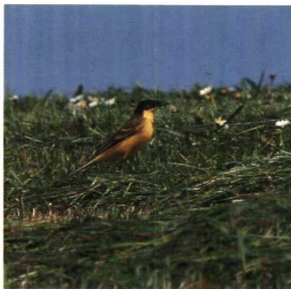
1 Balkankwikstaart Motacilla flava feldegg , mannetje, Delfzijl, Groningen, 10 mei 1988

Op grond van de geheel diepzwarte kopkap, inclusief het achterhoofd, mag de mogelijkheid van verwarring met een zwartkoppig mannetje Noordse Kwikstaart redelijkerwijs worden uitgesloten. Dit geldt eveneens, zij het in mindere mate, voor het volledig ontbreken van een borstband en de aanwezigheid van een zwartachtige waas op de olijfgroene bovendelen. De determinatie wordt verder ondersteund door de zwartachtige kleur van vleugels, staart en naakte delen. De afwezigheid van een