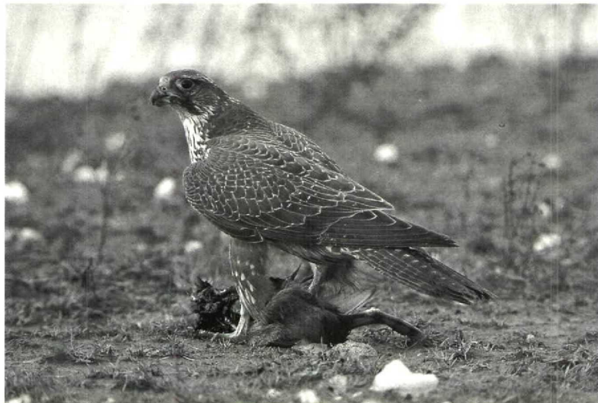
23 Gyrfalcon Falco rusticolus , Meldorfer Bucht, Schleswig-Holstein, FRG, November 1989 24 Citrine Wagtail Motacilla citreola , Tresco, Scilly, Britain, October 1989