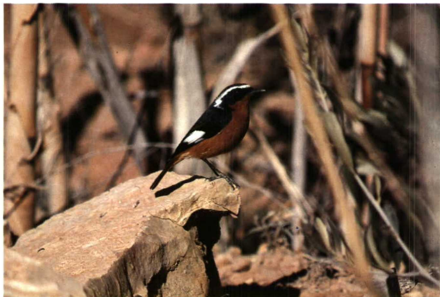
21 Moussier's Redstart Phoenicurus moussieri , Zepzate, Morocco, January 1990 (Arnold Meijer) 22 Desert Sparrow Passer simplex , Merzouga, Morocco, January 1990 (Arnold Meijer)