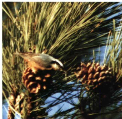
25 Red-breasted Nuthatch Sitta canadensis , Holkham Pines, Norfolk, Britain, October 1989 (David Cottridge)