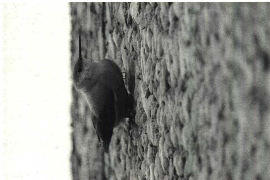
42 Rotskruiper Tichodroma muraria , Amsterdam-Buitenveldert, Noordholland, november 1989 (Arnoud B van den Berg)

werd gehoord op 19 oktober bij Zeebrugge. Er waren twee vangsten van Raddes Boszangers P. schwarzi bij Het Zwin op 6 en 10 oktober, hetgeen, samen met nog een vangst in het binnenland, het aantal Belgische gevallen op vijf bracht. Op 16 oktober werd op Texel een Bruine Boszanger P. fuscatus gemeld en op 25 en 28 (vangst) oktober één op de Maasvlakte, waar zich ook nog een Raddes Boszanger bevond. Tussen 15 oktober en 14 november werden 12 Siberische Tjiftjaffen P. collybita tristis opgemerkt waaronder een zingend exemplaar op Texel. Daarnaast waren er vangsten op 4 november bij Castricum en op 12, 14 en 15 november in de AW-duinen en een laat exemplaar op 3 en 25 december bij Harchies. Meldingen van Kleine Vliegenvangers Ficedula parva waren op twee handen te tellen; bij Heist op 2 oktober, op Terschelling op 4 en 5 oktober, bij Zeebrugge op 4 en 5 oktober (maximaal vier), op het Kornwerderzand op 8 oktober en op Schiermonnikoog op 17 oktober (vangst). Vanuit Nederland werd er met veel verbazing