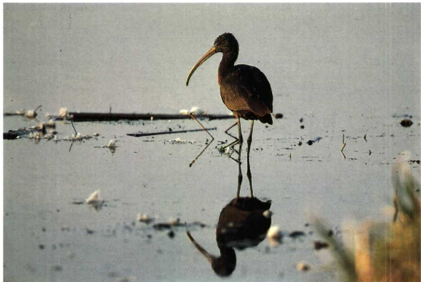
32 Zwarte Ibis Plegadis falcinellus , Nieuw-Lekkerland, Zuidholland, december 1989 (Hans Gebuis) 33 Grote Burgemeester Larus hyperboreus , Brouwersdam, Zuidholland, oktober 1989 (Henk van Harskamp)