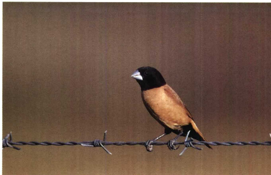
11 Adult Hooded Mannikin, holotype of Lonchura spectabilis sepikensis new subspecies, Urimo cattle station, c 60 km south-south-east of Wewak, East Sepik Province, Papua New Guinea, 15 August 1987 ( Hans Roersma ) 12 Hooded Mannikin Lonchura spectabilis sepikensis new subspecies, Urimo cattle station, c 60 km south-south-east of Wewak, East Sepik Province, Papua New Guinea, 15 August 1987 ( Bert Jonkers )