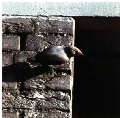
40-41 Rotskruiper Tichodroma muraria , Amsterdam-Buitenveldert, Noordholland, november 1989