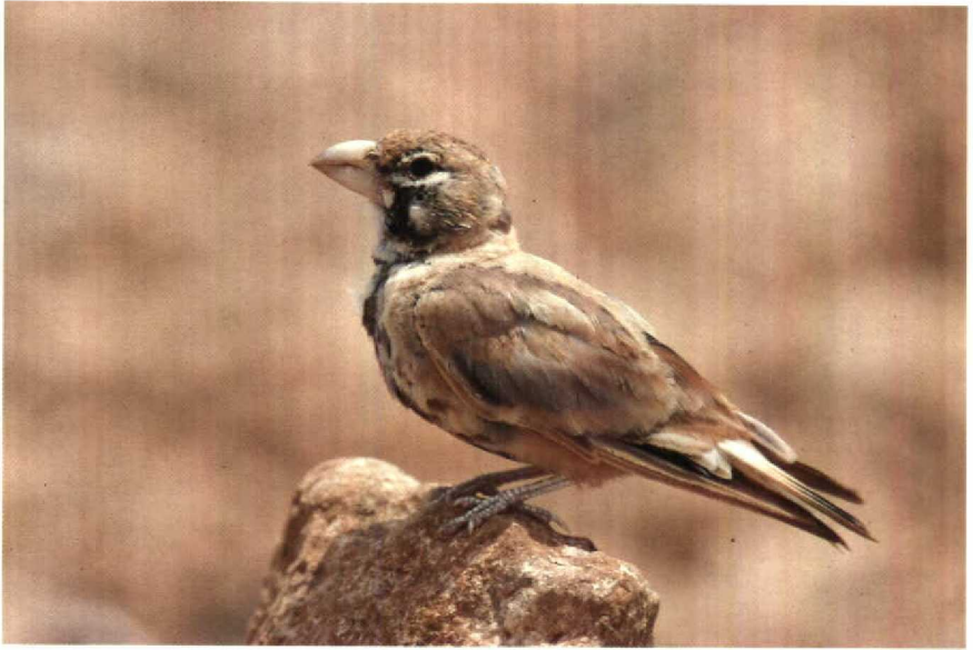
19 Thick-billed Lark Rhamphocoris clotbey , Tiznit , Morocco, July 1989 (Arnold Meijer) 20 Black-headed Bush Shrike Tchagra senegala , Oued Massa, Morocco, January 1990 (Arnold Meijer)