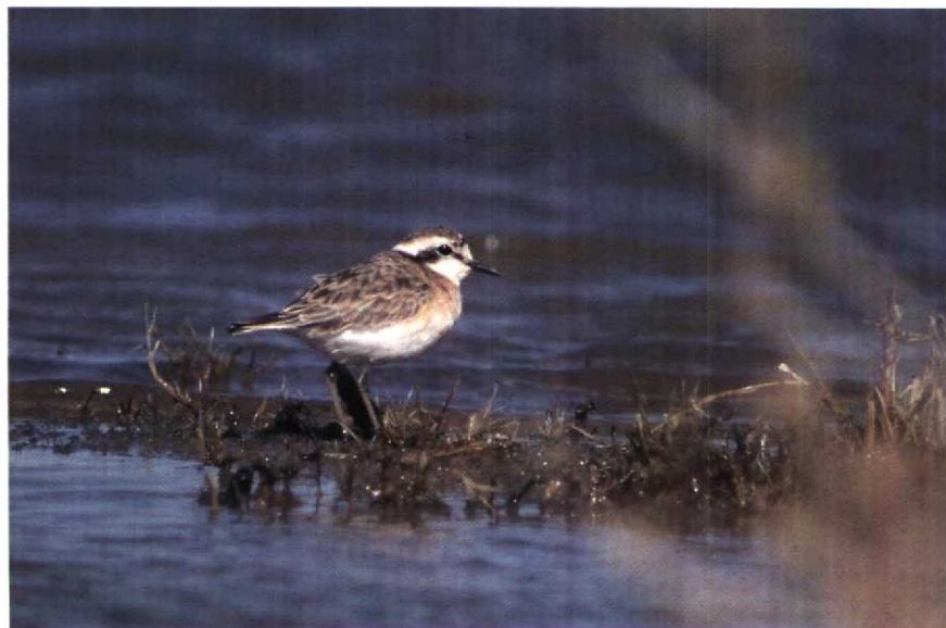
27 Kittlitz's Plover Charadrius pecuarius , Merzouga, Morocco, January 1990 (Arnold Meijer)