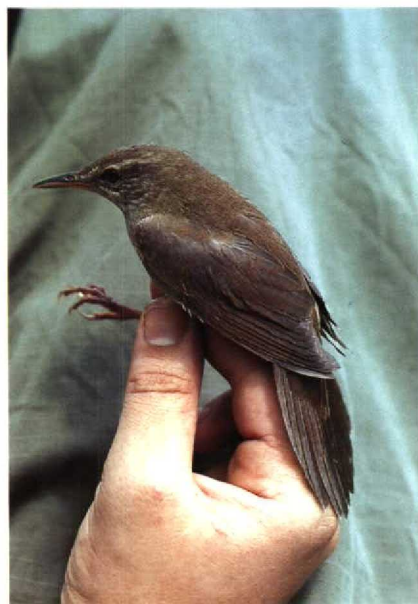
7 Gray's Grasshopper Warbler Locustella fasciolata , adult, Sangihe island, North Sulawesi, Indonesia, May 1985