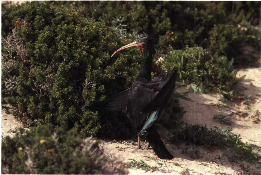
14 Bald Ibis Geronticus eremita , Tamri, Morocco, January 1990 (Paul Knolle)