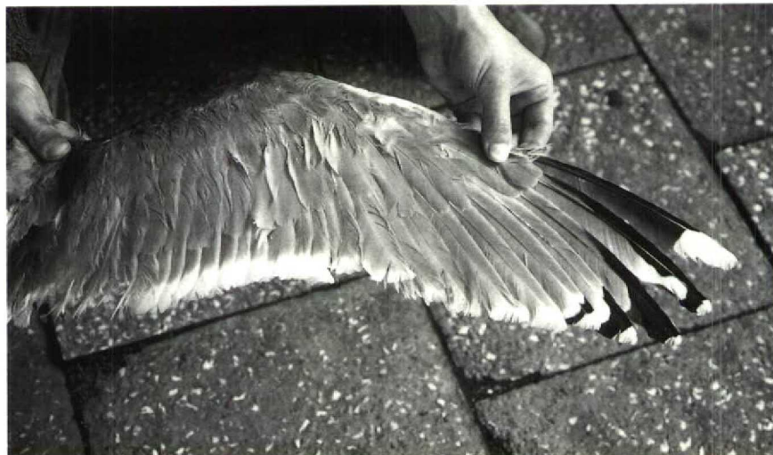
9 Wing of adult Yellow-legged Gull Larus cachinnans , showing characters of L c cachinnans , mouth of Vistula river, Poland, September 1987 (Philippe J Dubois)

showed a little more white. On 25 September, some gulls with features of L c omissus could be compared with L cachinnans . They differed from these by their larger average size, straw-yellow legs and feet, paler mantle (close to that of L a argentatus ) and much more streaking on the head. Finally, wings of specimens collected along the Polish Baltic coast clearly show the typical pattern of Yellow-Legged Gull (cf Dubois & Yésou 1984); these specimens include both immatures and adults.