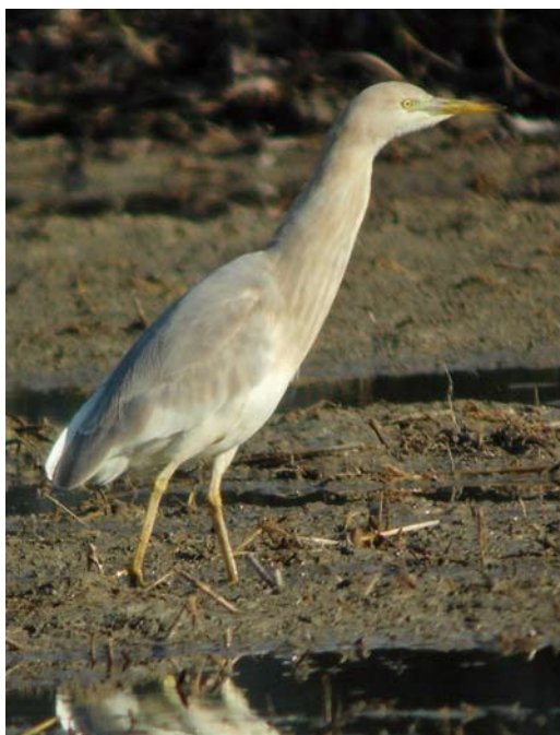
399-401 Hybrid Squacco Heron x Cattle Egret / hybride Ralreiger x Koereiger Ardeola ralloides x Bubulcus ibis , Ebro delta, Catalunya, Spain, 1 January 2011 (Ricard Gutiérrez) 402 Hybrid Squacco Heron x Cattle Egret / hybride Ralreiger x Koereiger Ardeola ralloides x Bubulcus ibis , Ebro delta, Catalunya, Spain, 2 January 2011 (Ricard Gutiérrez)

SIZE & STRUCTURE Rather like Cattle Egret but slightly smaller (direct comparison possible), probably with shorter legs; clearly smaller than Little Egret (in direct comparison) and always resting with retracted neck, in Squacco Heron-like fashion. Upper mandible straight, without any concave shape typical of Cattle Egret. In flight, showing rather hunchbacked look of Squacco Heron, with rather deep chest.