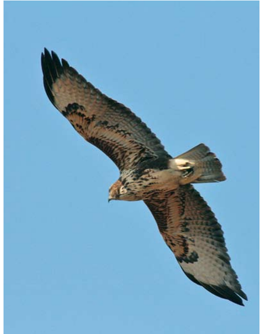
264 Hybrid Atlas Long-legged x Common Buzzard / hybride Atlasarendbuizerd x Buizerd Buteo rufinus cirtensis x buteo , recently fledged juvenile, Pantelleria, Italy, 5 September 2008 (Andrea Corso). Note long wings, well contrasting flanks and less well-marked carpal patch than in typical Long-legged Buzzard.

nominate buteo of Sicilian population. Underwing close to nominate buteo though possibly cleaner and with more contrasting median coverts; lesser and marginal coverts visibly darker and more solidly patterned than in cirtensis . Carpal patch not solid, not striking and quite pale, therefore different from nominate rufinus but similar to many juvenile cirtensis (Corso in prep) but less patterned and less conspicuous.