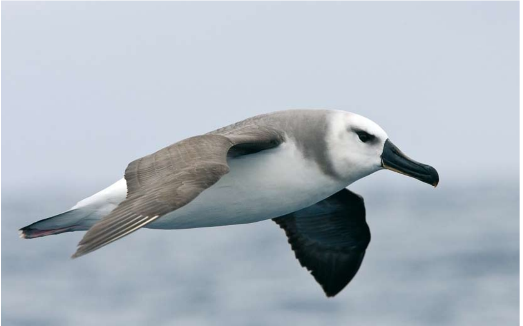
277 Grey-headed Albatross / Grijskopalbatros Thalassarche chrysostoma , immature, at sea off Macquarie Island, Australia, 17 November 2008