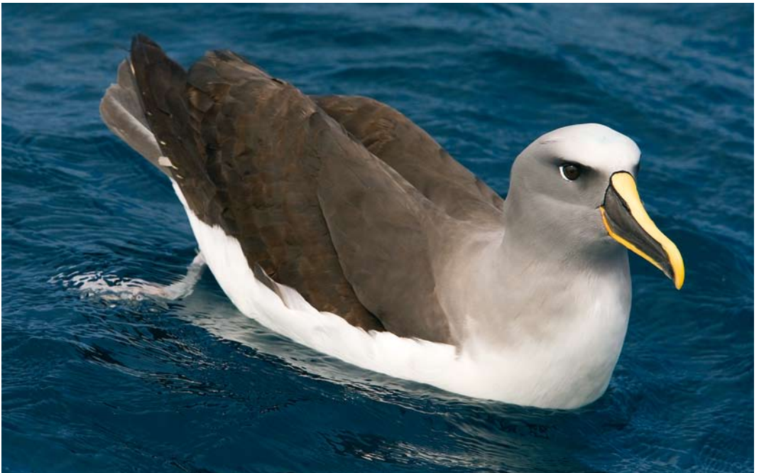
278 Buller's Albatross / Bullers Albatros Thalassarche bulleri , at sea off Pyramid Rock, Chatham Islands, New Zealand, 22 November 2008