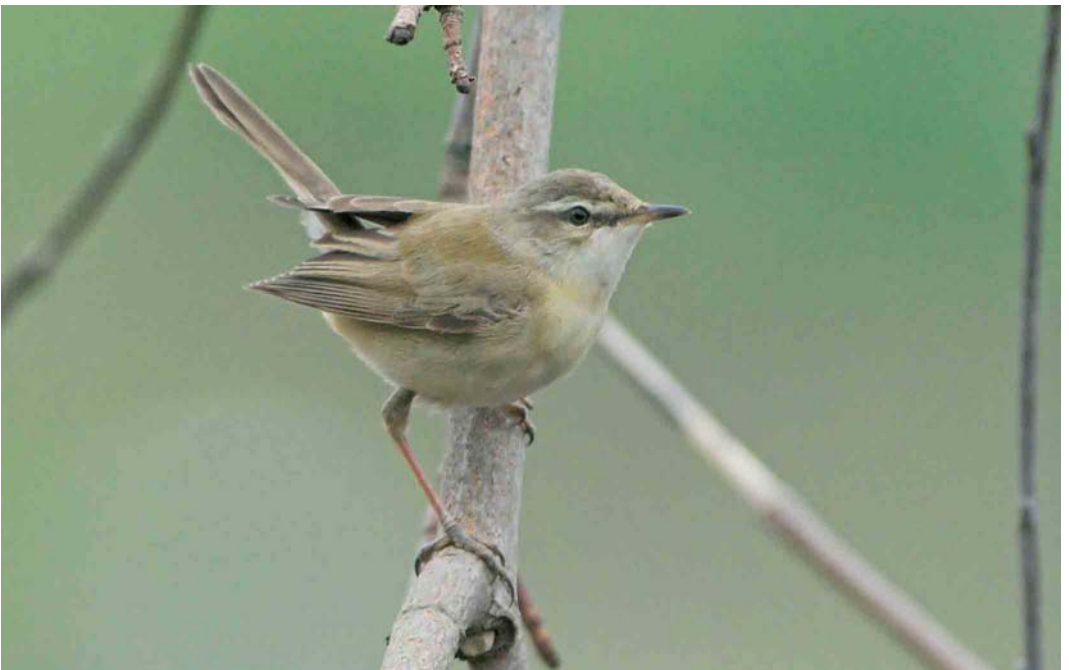
357 Paddyfield Warbler / Veldrietzanger Acrocephalus agricola , Helgoland, Schleswig-Holstein, Germany, 18 May 2006