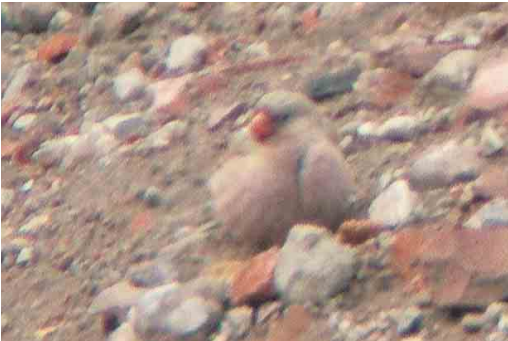
323-324 Woestijnvink / Trumpeter Finch Bucanetes githagineus , Eemshaven, Groningen, 12 juni 2005 (Martijn Bot)

De determinatie van de vogel was vrij eenvoudig door de combinatie van klein formaat, plompe bouw, rozeachtig verenkleed en grote rode snavel (cf Clement et al 1993, Cramp & Simmons 1994, Snow & Perrins 1998, Svensson et al 2002). Woestijnvink kan worden verward met Vale Woestijnvink Rhodospiza obsoleta . Deze is echter zandkleurig en heeft een zwarte snavel. Deze soort is grotendeels standvogel en een onwaarschijnlijke dwaalgast in Europa (de westrand van het verspreidingsgebied ligt in Oost-Turkije); er zijn echter wel verschillende waarnemingen van escapes in Nederland bekend (Ebels 1996, 2004). Verder lijkt Woestijnvink wel wat op Rode Woestijnvink Rhodopechys sanguineus . Deze soort komt voor in de berggebieden van Azië (Aziatische Rode Woestijnvink R s sanguineus ) en in de Hoge Atlas in Noordwest-Afrika (Afrikaanse Rode Woestijnvink R s alienus ). In tegenstelling tot Woestijnvink heeft Rode Woestijnvink een zwarte kruin en bruine flanken. Het is een bergvogel en grotendeels standvogel, die 's winters soms naar lager gelegen gebieden migreert. Voorkomen als wilde vogel in Europa is onwaarschijnlijk; er zijn ook (nog) geen meldingen van deze soort als escape bekend. De enige andere Bucanetes -soort is Mongoolse Woes-