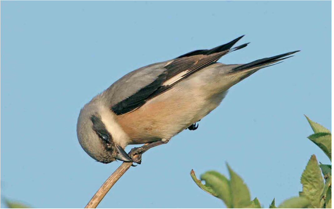
356 Lesser Grey Shrike / Kleine Klapekster Lanius minor , Shingle Street, Suffolk, England, 8 July 2006 (Bill Baston)