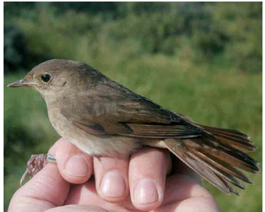
469 Melodious Warbler / Orpheusspotvogel Hippolais polyglotta , Ter Apel, Groningen, 20 May 2004 (Martijn Bot) 470 River Warbler / Krekelzanger Locustella fluviatilis , 't Twiske, Noord-Holland, 2 June 2004 (Theo Koeten) 471 Hume's Leaf Warbler / Humes Bladkoning Phylloscopus humei , Reusel, Noord-Brabant, 14 November 2004 (Pieter Wouters) 472 Thrush Nightingale / Noordse Nachtegaal Luscinia luscinia , Bloemendaal, Noord-Holland, 9 September 2004 (Arnoud B van den Berg/Vrs van Lennepe)