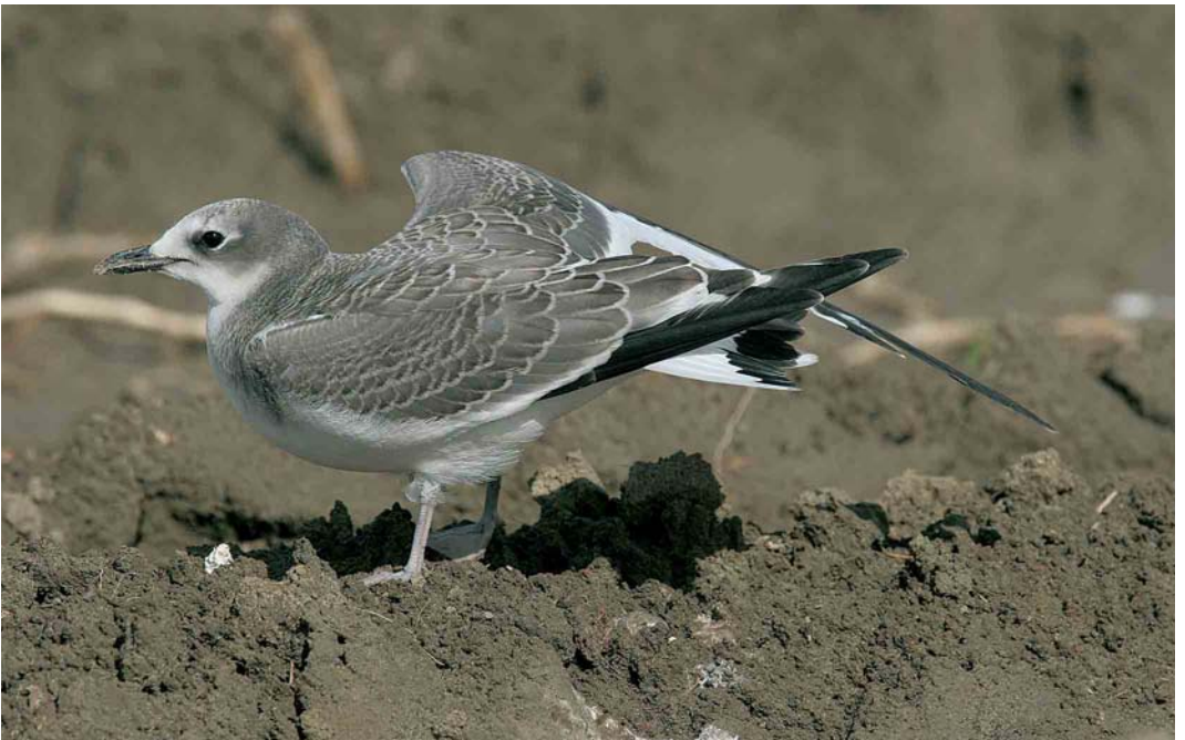
532 Vorkstaartmeeuw / Sabine's Gull Larus sabini , juveniel, Westkapelle, 29 september 2005