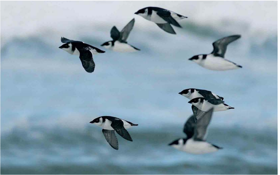
531 Kleine Alken / Little Auks Alle alle , Paal 7, Schiermonnikoog, Friesland, 23 oktober 2005