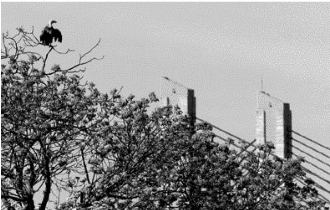
521 Eurasian Griffon Vulture / Vale Gier Gyps fulvus , Zaltbommel, Gelderland, 22 May 2001