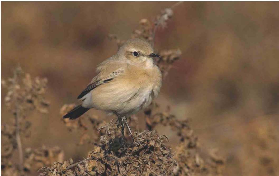
536 Desert Wheatear / Woestijntapuit Oenanthe deserti , female, De Cocksdorp, Texel, Noord-Holland, 9 November 2003 (René Pop)