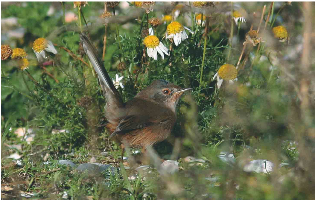
608 Provençaalse Grasmus / Dartford Warbler Sylvia undata , Zeebrugge, West-Vlaanderen, oktober 2004

grote afstand in de vroege uurtjes gezien. Op 3 september pleisterde een Hop Upupa epops in een tuin in Sint-Huibrechts-Hern, Limburg. Er werden 62 Draaihalzen Jynx torquilla doorgegeven, de meeste tussen 1 en 5 september. Op 8 oktober was er na een leegte van enkele jaren weer een waarneming van een Middelste Bonte Specht Dendrocopos medius in Pulderbos, Antwerpen. Vanaf 3 oktober verschenen de eerste Strandleeuweriken Eremophila alpestris maar het bleef telkens bij één tot maximaal acht exemplaren. Grote Piepers Anthus richardi werden vanaf 29 september waargenomen op volgende plaatsen: Essen; Heist (twee); Knokke (twee); Nieuwpoort; Oostduinkerke, West-Vlaanderen; Oudenburg, West-Vlaanderen; Rijkvorsel, Antwerpen; en Tienen (twee). Pleisterende vogels werden weer voornamelijk vastgesteld in het Zeebrugse met c negen in de Achterhaven en drie in de Voorhaven. Er werden nog 47 Duinpiepers A campestris opgemerkt, waarvan 38 tussen 1 en 10 september. De laatste waarnemingen gebeurden in Perwez, Namur, en in Houthalen, Limburg, op 3 oktober. De 11 waargenomen Roodkeelpiepers A cervinus trokken alle langs tussen 13 september en 13 oktober. Op 19 oktober trok een late Gele Kwikstaart Motacilla flava over Tienen. De eerste Pestvogel Bombycilla garrulus trok op 22 oktober over Koksijde, West-Vlaanderen; daarna volgden waarnemingen in Blankenberge op 27 oktober; in Zeebrugge op 28 oktober (drie) en 29 oktober; over Boekhoute op 30 oktober; en over Dilsen-