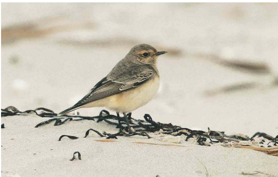
595 Bonte Tapuit / Pied Wheatear Oenanthe pleschanka , paal 22, Terschelling, Friesland, 16 oktober 2004