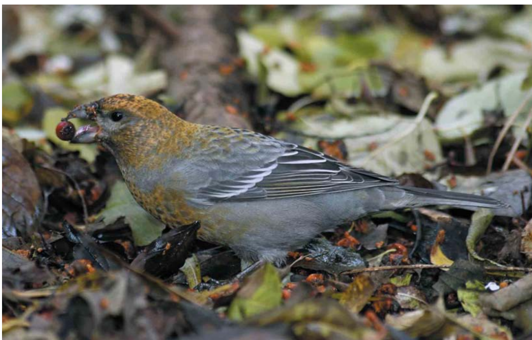
613 Haakbek / Pine Grosbeak Pinicola enucleator , eerste-winter mannetje of vrouwtje, Groningen, Groningen, 18 november 2004 (Marten van Dijk)