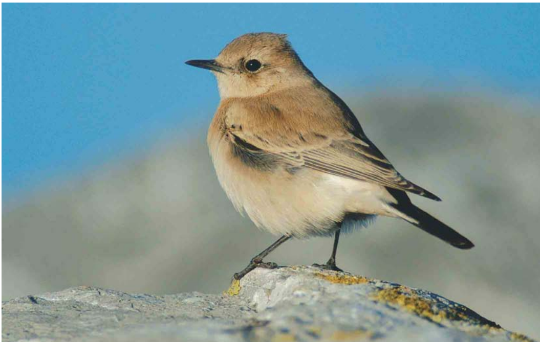
573 Western Black-eared Wheatear / Westelijke Blonde Tapuit Oenanthe hispanica , female, Eemshaven-Oost, Groningen, Netherlands, 7 November 2004