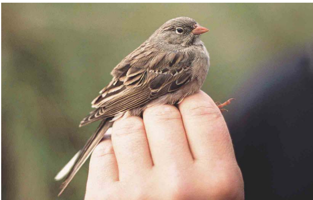
581 Grey-necked Bunting / Steenortolaan Emberiza buchanani , first-winter male, Castricum, Noord-Holland, Netherlands, 16 October 2004 (André J van Loon)