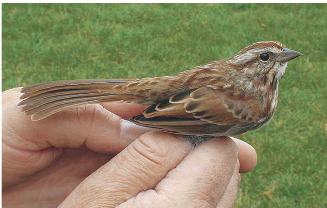
583 Song Sparrow / Zanggors Melospiza melodia , first-year, Sint-Laureins, Oost-Vlaanderen, Belgium, 30 September 2004