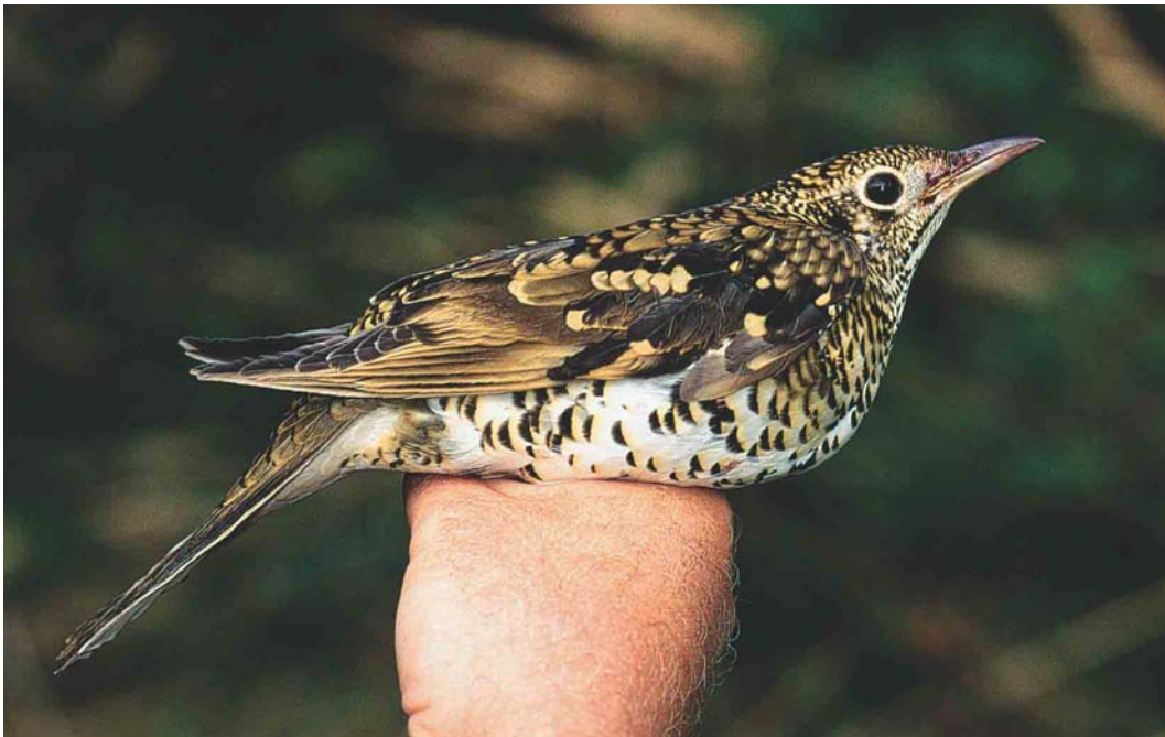
535 White's Thrush / Goudlijster Zoothera aurea , first-year, Korverskooi, Texel, Noord-Holland, 10 October 2003 (Arend Wassink)