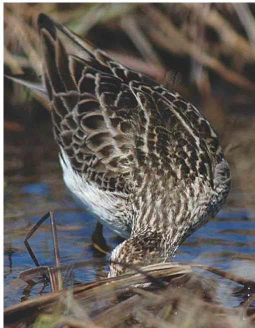
Mystery photograph X (June)

Photographs IX and X represent the fifth round of the 2004 competition. Please study the rules