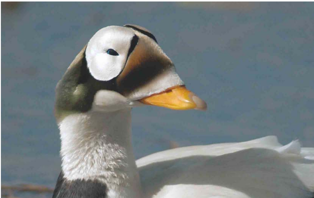
458 Spectacled Eider / Brileider Somateria fischeri , adult male, Deadhorse, Prudhoe Bay, Alaska, USA, 14 June 2004 (René Pop)