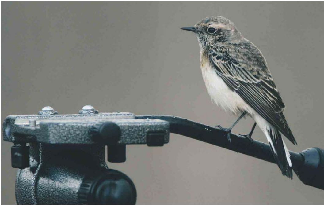
468 Pied Wheatear / Bonte Tapuit Oenanthe pleschanka , Helgoland, Schleswig-Holstein, Germany, 19 October 2003