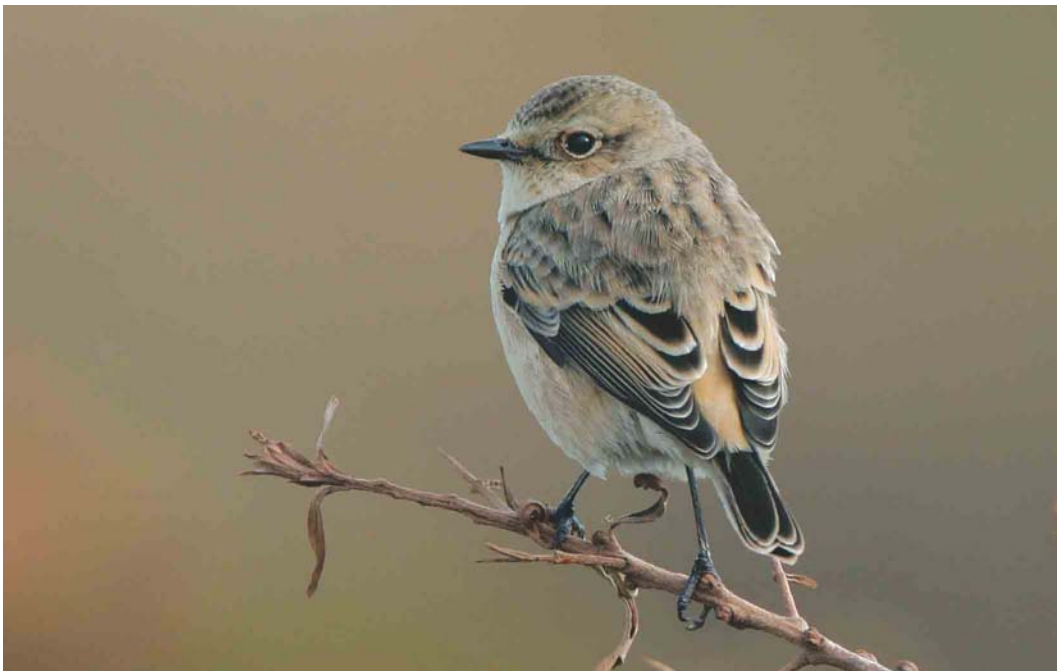
469 Siberian Stonechat / Aziatische Roodborstapuit Saxicola maura , Helgoland, Schleswig-Holstein, Germany, 17 October 2003 ( Bas van den Boogaard )