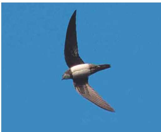
424 Alpine Swift / Alpengierzwaluw Apus melba , first-winter, Wageningen, Gelderland, 17 November 2002 (Bas van den Boogaard)

The autumn bird was released near Zürich in Switzerland in June 2003. It was only the second ever staying longer than a few hours. The first 'long-staying' bird was on 28-29 October 1987. A report on 7 September at Ooltgensplaat, Zeeland, is still in circulation, while a report on 20 September on Terschelling, Friesland, has not (yet) been submitted (cf van Dongen et al 2002).