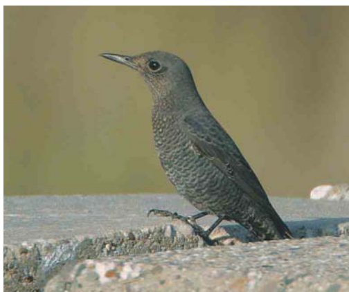
406 Blauwe Rotslijster / Blue Rock Thrush Monticola solitarius , Westkapelle, Zeeland, 20 september 2003

BLUE ROCK THRUSH A Blue Rock Thrush Monticola solitarius stayed at Westkapelle, Zeeland, the Netherlands, on 20 September 2003. The bird was found at c 13:00 and could be observed until dark (c 20:00) by over 200 observers. If accepted, it is the first record. The species is a vagrant in western Europe, with records in Belgium (1), Britain (5), Finland (2), Germany (2+) and Sweden (1).