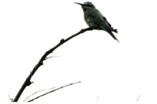
74 Blue-cheeked Bee-eater / Groene Bijeneter Merops persicus , Christiansø, Bornholm, Denmark, June 1989 75 Blue-cheeked Bee-eater / Groene Bijeneter Merops persicus (collected on Scilly, Engeland, 13 July 1921), Isles of Scilly Museum, St Mary's, Scilly, England, October 1992 76 Blue-cheeked Bee-eater / Groene Bijeneter Merops persicus , Cowden, Humberside, England, July 1989 77-79 Blue-cheeked Bee-eater / Groene Bijeneter Merops persicus , Texel, Noordholland, Netherlands, 30 September 1961