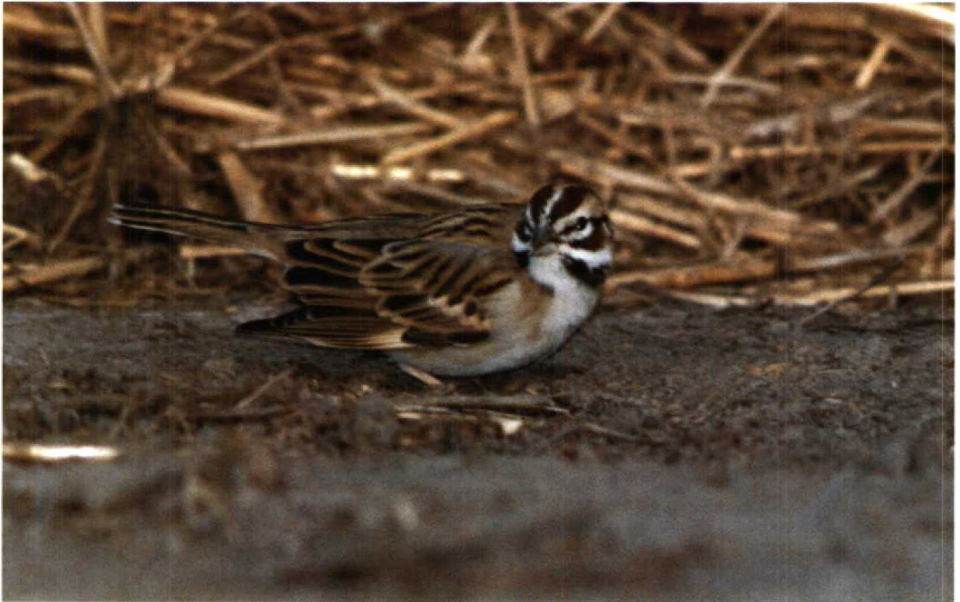
175 Lark Sparrow Chondestes grammacus , Waxham, Norfolk, Britain, May 1991