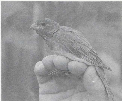
115 Veldrietzanger Acrocephalus agricola , Oostvaardersdijk, Flevoland, september 1987 116 Roodmus Carpodacus erythrinus , mannetje, De Kennemerduinen, Noordholland, september 1987

Veldrietzanger A agricola voor Nederland was de vangst van een exemplaar op 8 september langs de Oostvaardersdijk. De vogel werd de volgende dag nogmaals gevangen maar kon niet buiten het net geobserveerd worden. Een Baardgrasmus Sylvia cantillans werd op 3 september bij Knokke-Zwin Wvl gevangen. Een juveniele Sperwergrasmus S nisoria werd op 10 en 11 augustus bij Lier A gesignaleerd. Vangsten van juveniele exemplaren waren er eind augustus bij Aalst Ovl (twee), op 23 en 30 augustus en 1 september bij Knokke-Zwin, op 31 augustus bij Ransart H, op 1 september bij Heine Ovl, op 1, 3 en 19 september in De Kennemerduinen en op 2 september op de Westplaat. Op 4 september werd er nog één in Meijendel gezien. Grauwe Fitissen Phylloscopus trochiloides werden gezien op 1 september bij Zeebrugge en op 8 september bij Leeuwarden Fr. Op 12 september werd een Noordse Boszanger P borealis gemeld bij Tienen B. Op 27 september verscheen het eerste Bladkoninkje P inornatus op Texel en op 29 september waren er exemplaren bij Emmeloord Fl, bij Castricum (twee vangsten) en in De Kennemerduinen (vangst). Op 30 sep-