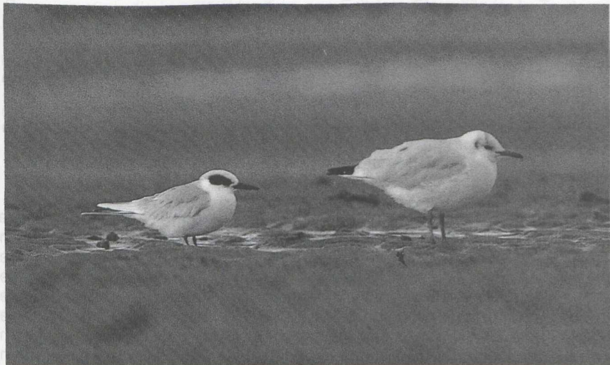
100 Forsters Stern Sterna forsteri en Kokmeeuw Larus ridibundus , Ritthem, Zeeland, november 1986 (René Pop)

De volgende ochtend waren de meest enthousiaste vogelaars uit Nederland en België al een uur voor zonsopgang bij de Sloehaven aanwezig. Om 7:30 werd de Forsters Stern vliegend boven de Westerschelde en de Sloehaven gezien. Hij werd hier en op een nabijgelegen strand de gehele dag waargenomen. 's Middags kreeg hij enige tijd gezelschap van een Grote Stern S sandvicensis . Enkele 100en vogelaars kwamen hem bekijken. De volgende dagen werd de vogel niet meer teruggezien.