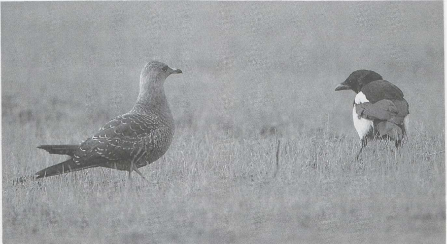
105 Kleinste Jager Stercorarius longicaudus en Ekster Pica pica , Wuustwezel, Antwerpen, september 1986 (Arie de Knijff)

Woestijneplevier Charadrius leschenaultii werd op 23 juli bij Zeebrugge ontdekt. Dit betekende het derde geval voor België. Rond 10 augustus waren er enkele Morinelplevieren C morinellus langs de Dodaarsweg Fl aanwezig. Op 4 september zaten er twee juvenielen te Kallo. Een leuke ontmoeting met deze soort had een bioloog in De Uithof U, die, op zijn knieën bezig in de proeftuin, opeens oog in oog met twee exemplaren zat. De enige Amerikaanse Gestreepte Strandloper Calidris melanotos werd op 31 augustus gemeld te Kallo. Op 23 september zou er een Siberische Gestreepte Strandloper C acuminata gefotografeerd zijn op Texel Nh. Een 'stint' Calidris , die van 9 tot 12 augustus langs de Oostvaardersdijk zat, liet in plaats van een sluitende determinatie grote onenigheid onder de aanwezige vogelaars achter. Een adulte Breedbekstrandloper Limicola falcinellus die op 20 en 21 juli in de Ooypolder Gld zat, was mogelijk al vanaf 6 juli aanwezig. Behalve de Blonde Ruiters Tryngites subruficollis die op 4 juli bij Kallo zat, was er in België nog een geval in Het Zwin van 27 tot 30 juli. Vele 10-tallen vogelaars in Nederland waren daarom dolblij dat er van 16 tot 19 augustus één te bewonderen viel op een onder water gezet bollenveld bij Lisse Zh.