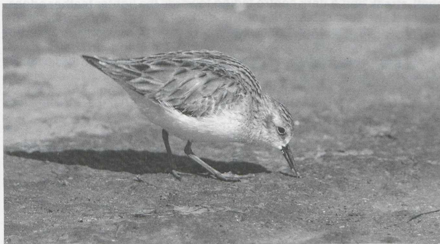
98 Least Sandpiper Calidris minutilla , Texas, February 1982 (René Pop)

21 The squat appearance and short legs and bill of the wader in mystery photograph 21 obviously belong to one of the smaller sandpipers or stints Calidris . The rather plain-coloured upperparts tell that the bird is in winter plumage. Its pale legs limit our choice to three species: Temminck's Stint C temminckii , Long-toed Stint C subminuta