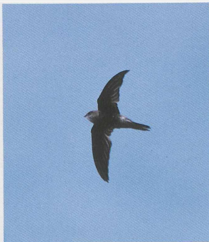
91-92 Cape Verde Swift Apus alexandri , Fogo, Cape Verde Islands, March 1986 (René Pop) 93 Grey-headed Kingfisher Halcyon leucocephala , São Tiago, Cape Verde Islands, February 1986 (René Pop)