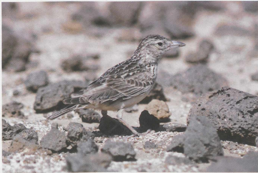
94-95 Razo Lark Alauda razae , male & female, Razo, Cape Verde Islands, March 1986 (René Pop)