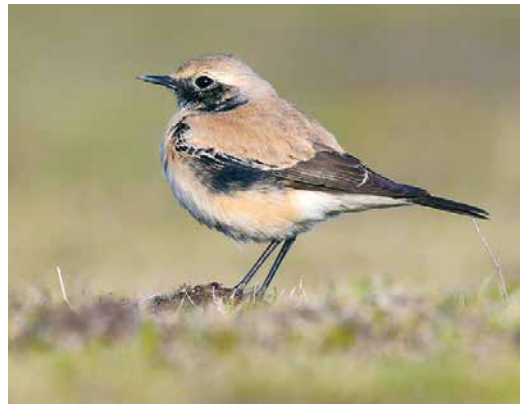
76 Long-tailed Rosefinch / Langstaartroodmus Carpodacus sibiricus , first-winter male, Besh Barmag, Azerbaijan, 22 November 2018 (Steve Klasan) 77 Long-tailed Shrike / Langstaartklauwier Lanius schach , first-winter, Grandson, Vaud, Switzerland, 24 November 2018 (Mathieu Bally) 78 Pied Bush Chat / Zwarte Roodborstapuit Saxicola caprata , male, Ulricehamn, Västergötland, Sweden, 8 November 2018 (Ingvar L Nilsson) cf Dutch Birding 40: 419, 2018 79 Basalt Wheatear / Basalttapuit Oenanthe lugens warriae , Ovda valley, Israel, 21 December 2018 (Eduard Sangster) 80 Asian Desert Warbler / Woestijngrasmus Sylvia nana , Torre Canne, Puglia, Italy, 21 November 2018 (Cristiano Liuzzi) 81 Desert Wheatear / Woestijntapuit Oenanthe deserti , first-winter male, Chişineu-Criş, Arad, Romania, 11 December 2018 (János Oláh)