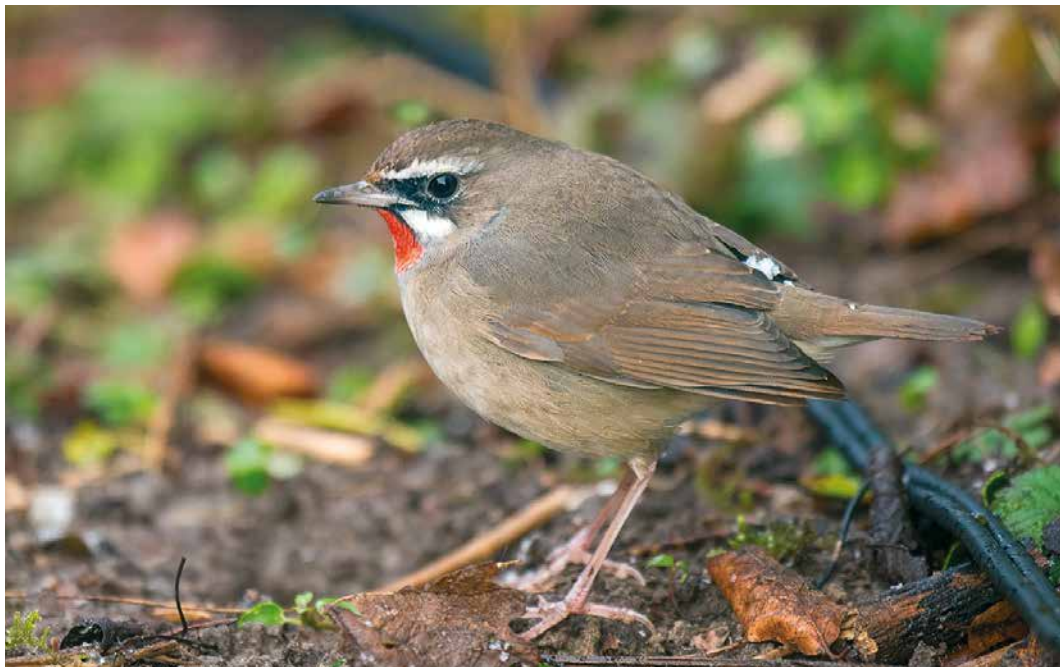
12 Roodkeelnachtegaal / Siberian Rubythroat Calliope calliope , eerste-winter mannetje, Hoogwoud, Noord-Holland, 7 maart 2016