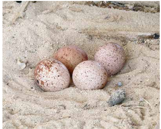
33 Nest under fisherman's hut with two eggs of Sooty Falcon / Woestijnvalk Falco concolor , Torfa el Mashikh, Egypt, 30 July 2016 ( Mohamed I Habib ) 34 Nest in crevice with two eggs of Sooty Falcon / Woestijnvalk Falco concolor , Zabarjad, Egypt, 10 August 2014 ( Mohamed I Habib ) 35 Nest under Nitraria retusa with three eggs of Sooty Falcon / Woestijnvalk Falco concolor , Wadi el Gemal island, Egypt, 12 August 2014 ( Mohamed I Habib ) 36 Nest with four eggs of Sooty Falcon / Woestijnvalk Falco concolor , Wadi el Gemal island, Egypt, 30 July 2014 ( Mohamed I Habib )