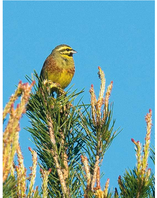
18 Ross' Meeuw / Ross's Gull Rhodostethia rosea , eerste-winter, Vlissingen, Zeeland, 25 januari 2018 19 Cirlgors / Cirl Bunting Emberiza cirlus , mannetje, Weerter- en Budelerbergen, Noord-Brabant, 6 mei 2018 20 Witkeelkwikstaart / White-throated Wagtail Motacilla cinereocapilla , mannetje, Onnerpolder, Haren, Groningen, 13 mei 2018