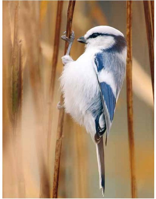
82 Dwarf Bittern / Afrikaanse Woudaap Ixobrychus sturmii , Barranco del Rio Cabras, Fuerteventura, Canary Islands, 3 January 2019 83 Azure Tit / Azuurmees Cyanistes cyanus , Fehér lake, Szeged, Hungary, 19 November 2018 84 Cretzschmar's Bunting / Bruinkeelortolaan Emberiza caesia , first-winter male, Skutskär, Uppsala, Sweden, 6 January 2019