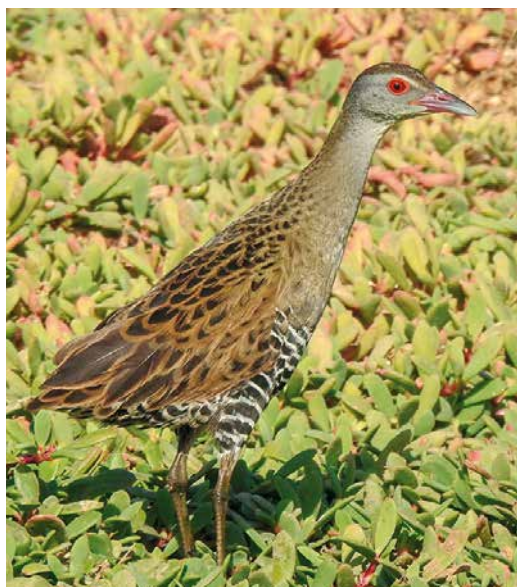
[Dutch Birding 41: 51-62, 2019]

56 African Crane / Afrikaanse Kwartelkoning Crex egregia , Santa Maria, Sal, Cape Verde Islands, 6 January 2019 (Uwe Thom)