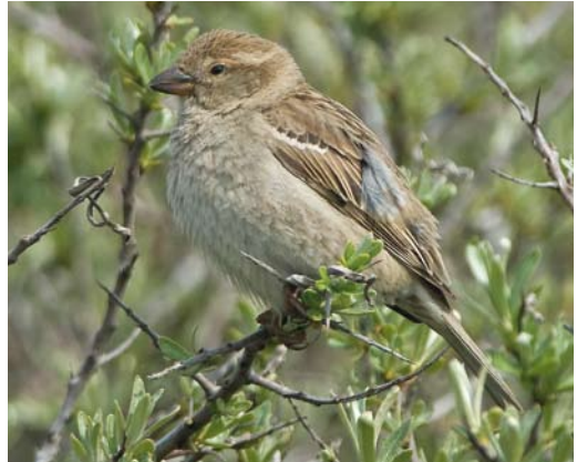
115 Spaanse Mus / Spanish Sparrow Passer hispaniolensis , vrouwtje, Zuidpier, IJmuiden, Noord-Holland, 6 mei 2010 (Jacob Garvelink)

Op zondagmiddag 26 oktober 2014 ontdekte Garry Bakker samen met Daniel Benders en Wil van den Hoven een mannetje Spaanse Mus in vers kleed ('winterkleed') langs de Missouriweg op de Maasvlakte. De vogel foerageerde in de wegberm met een aantal Vinken Fringilla coelebs . Tijdens de ontdekking zat de vogel in een hek met de borst naar de waarnemers toe en vielen de bruine kruin (zonder grijs) en zwarte tekening op borst en flanken op, wat GB direct de uitroep 'Spaanse Mus!' ontlokte. De vogel verdween snel uit beeld en