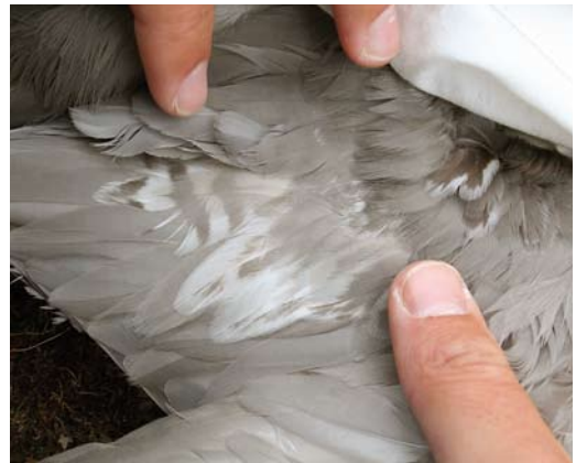
137 Long-tailed Jaeger / Kleinste Jäger Stercorarius longicaudus, adult, Björkfället, Ammarnäs, Västerbotten, Sweden, 20 June 2011. Same bird as plate 136 and 138-139. 138 Long-tailed Jaeger / Kleinste Jäger Stercorarius longicaudus, adult, Björkfället, Ammarnäs, Västerbotten, Sweden, 12 June 2010. Detail of right underwing. Same bird as plate 136-137 and 139. 139 Long-tailed Jaeger / Kleinste Jäger Stercorarius longicaudus, adult, Björkfället, Ammarnäs, Västerbotten, Sweden, 12 June 2010. Detail of left underwing. Same bird as plate 136-138.

Long-tailed and Parasitic. Hence, jaegers showing these features cannot be aged with any certainty.