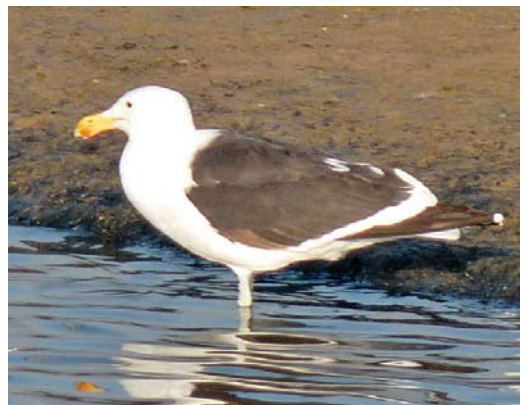
330-331 Ascension Frigatebird / Ascensionfregatvogel Fregata aquila , juvenile, Bowmore, Islay, Argyll, Scotland, 5 July 2013 ( Jim Sim ) 332 African Openbills / Afrikaanse Gapers Anastomus lamelligerus , Kom Ombo, Egypt, 31 May 2013 ( James Cameron Quilter ) 333 Pacific Golden Plover / Aziatische Goudplevier Pluvialis fulva , adult male, Łaszka, Pomerania, Poland, 16 July 2013 ( Sławek Rubacha ) 334 Roseate Tern / Dougalls Stern Sterna dougallii , adult, Mietków reservoir, Silesia, Poland, 13 July 2013 ( Paweł Głowacki ) 335 Cape Gull / Afrikaanse Kelpmeeuw Larus dominicanus vetula , subadult, Peniche, Portugal, 22 May 2013 ( Pedro Ramalho )