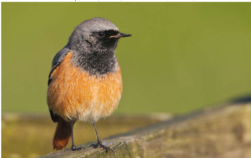
606 Oosterse Zwarte Roodstaart / Eastern Black Redstart Phoenicurus ochruros phoenicuroides , eerstejaars mannetje, Paesens, Friesland, 12 november 2012