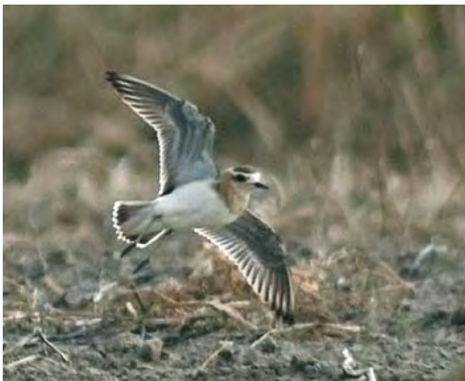
566 Kaspische Plevier / Caspian Plover Charadrius asiaticus , eerstejaars, Buitendijk, Texel, Noord-Holland, 19 oktober 2009