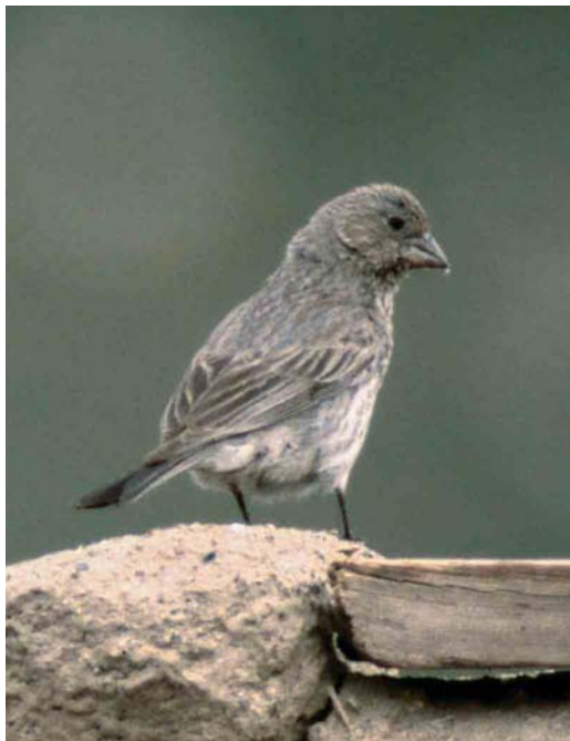
299 Spotted Great Rosefinch / Severtzovs Grote Roodmus Carpodacus severtzovi , female-type, Bash Gumbez, eastern Pamir, Tajikistan, July 2004. Female-type Spotted Great Rosefinch has long primary projection and only faint streaking on mantle and flank. Also note strong pale wing-panel on bases of secondaries.