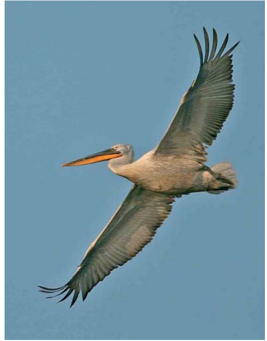
331 Dalmatian Pelican / Kroeskoppelikaan Pelecanus crispus , adult, Przemkow, Silesia, Poland, 4 July 2006 (Mateusz Matysiak)

were seen at a breeding site on Lampedusa in May. A Madeiran Little Shearwater P baroli was reported off Tønsberg, Norway, on 21 June. On a pelagic tour between Madeira and the Selvagens on 26-29 June, more than 100 White-faced Storm-petrels Pelagodroma marina were seen, most of them near the Selvagens but also one 41 nautical miles south of Funchal, Madeira, on 29 June. On the same tour, more than 10 (presumed) Fea's Petrels P feae (with many more near Deserta Grande, Madeira, on 29-30 June), a few Manx Shearwaters P puffinus , a few Madeiran Little Shearwaters , two Wilson's Storm-petrels Oceanites oceanicus , c 12 Madeiran Storm-petrels Oceanodroma castro and, on 29 June, an adult Red-billed Tropicbird Phaethon aethereus and a first-summer Sabine's Gull Larus sabini were noted. An unusual influx of European Storm-petrels Hydrobates pelagicus occurred in the English Channel from 19 May onwards; for instance, c 1000 were seen off Portland Bill, Dorset, England, both on 19 and 20 May, 232 in 2.5 h past Ouessant, Finistère, France, on 21 May, and 369 past Hope's Nose, Devon, England, on 26 May.